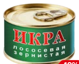
ИКРА КРАСНАЯ , 95 г