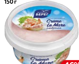
Паста из морепродуктов БАЛТИЙСКИЙ БЕРЕГ , Crème Le Mare, сливочная, 150 г