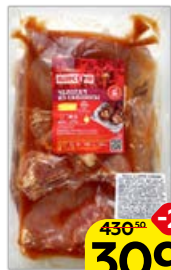
Челогач ИШИМСКИЙ , из свинины в маринаде, 1 кг