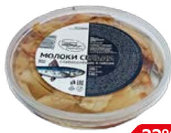
Молеку сельди PESCATORE FRANCESCO в масле, 200 г