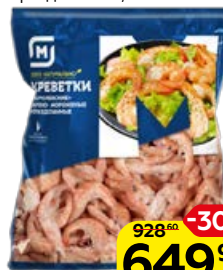
Креветки МАГНИТ Королевские, варено-мороженые, неразделанные, 1 кг