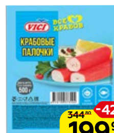
Палочки крабовые VICI , охлажденные, 500 г