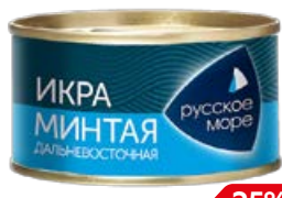
Икра минтая РУССКОЕ МОРЕ , Дальневосточная, Пробойная соленая, 130 г