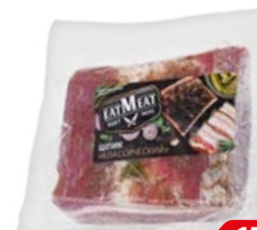
Шлик EATMEAT® Классический, 300 г