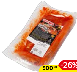
Вырезка ИШИМСКИЙ в папричном маринаде, охлажденная, 1 кг