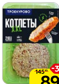
Котлеты ТРОЕКУРОВО XXL, куриные, охлажденные, 350 г