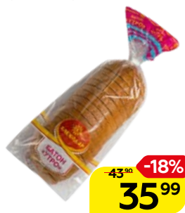
Батон УТРО , нарезной (Хлебодар), 250 г