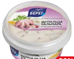
Шупальца кальмара БАЛТИЙСКИЙ БЕРЕГ , в чесночном соусе, 210 г