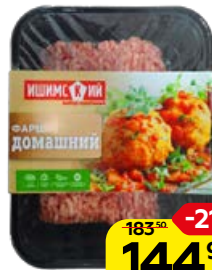
Фарш ИШИМСКИЙ , Домашний, охлажденный, 500 г