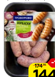
Колбаски ТРОЕКУРОВО рубленные, с пряными травами, охлажденные, 500 г