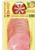
Шинка ПРЯНАЯ копчено-вареная, нарезка (Иней), 150 г