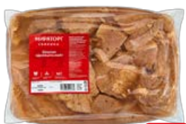
Шашлык свиной МИРАТОРГ , Деликатесный, охлажденный, 1 кг