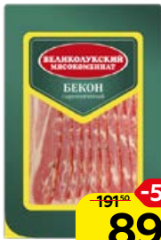
Бекон ВЕЛИКОЛУКСКИЙ из свинины, сырокопченый, нарезка (Великолукский МК), 150 г