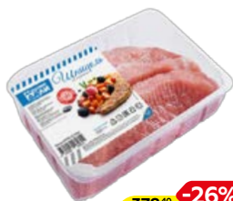
Шницель ДАЛЬНИЕ ДАЛИ , из свинины (Агро-Белогорье), 700 г