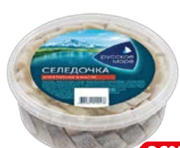
Сельдь РУССКОЕ МОРЕ , Appetitная, филе-кусочки в масле, 400 г