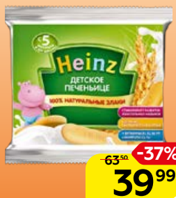
Печенье детское** HEINZ, Натуральные злаки, 60 г