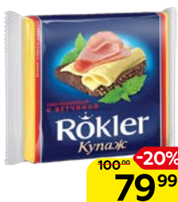
Сыр плавленый ROKLER с ветчиной, нарезка, 130 г