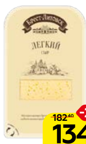
Сыр БРЕСТ-ЛИТОВСКИЙ, Легкий, нарезка, 150 г