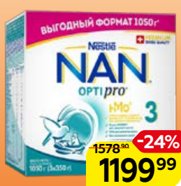
Напиток молочный** NAN 3 ОПТИМО сухой, с 12 мес., 1050 г