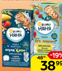
Каша молочная** ФРУТОНЯЯ жидкая: 5 злаков-клубника-банан/яблоко-земляника, 200 мл