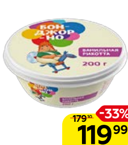
Сыр БОНДЖОРНО Рикотта, с ванилью, 200 г