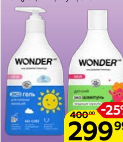
WONDER LAB, Экогель для купания малышей/Экошампунь детский, Танцующая маракуйя, 540 мл