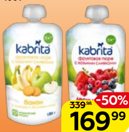
Пюре фруктовое** KABRITA, Козьи сливки: банан-печенье-яблоко/лесные ягоды-яблоко, 100 г