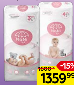
Подгузники-трусики NANI® в ассортименте***: 32 шт./38 шт./44 шт./50 шт.