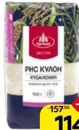
Рис КУЛОН , Кубанский (Агро-Альянс), 900 г