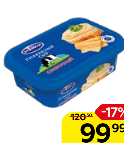
Сыр плавленый ЭКОМИЛК Сливочный, 200 г