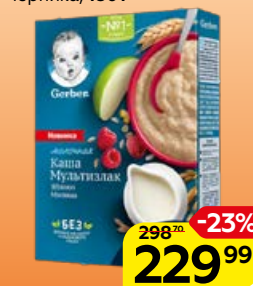
Каша молочная** GERBER яблоко-малина/банан-черника, 180 г