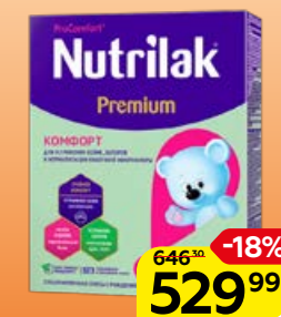
Смесь** NUTRILAK Премиум, комфорт, 350 г