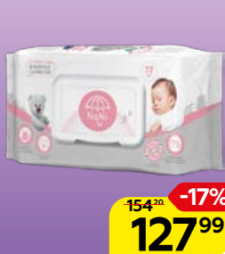
Влажные салфетки NANI® детские, 72 шт.