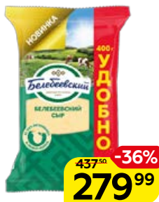
Сыр БЕЛЕБЕЕВСКИЙ, 400 г