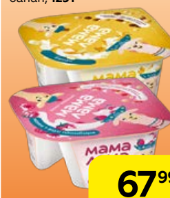
Десерт МАМА ЛАМА творожный: малина-пломбир/банан, 125 г