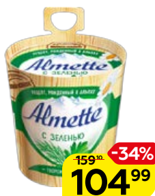
Сыр творожный ALMETTE с зеленью, 150 г