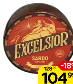
Сыр EXCELSIOR, Сардо, 100 г