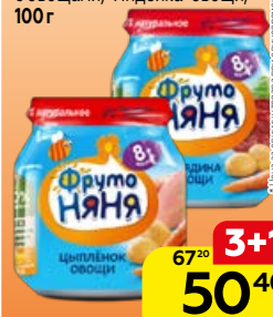
Пюре мясное** ФРУТОНЯЯ, Цыпленок-рис-овощи/Говядина с овощами/Индейка-овощи, 100 г