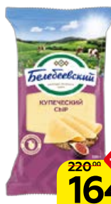
Сыр БЕЛЕБЕЕВСКИЙ, Купеческий, 190 г