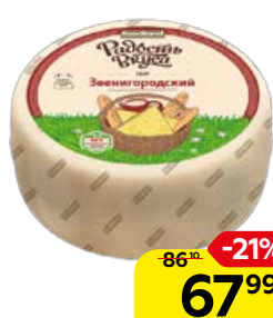
Сыр РАДОСТЬ ВКУСА, Звенигородский, 100 г