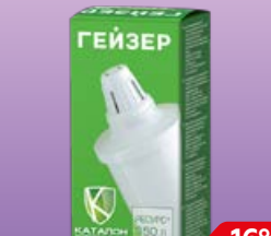
Катридж сменный ГЕЙЗЕР , №503, 1 шт.