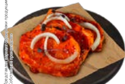
Полуфабрикат СТЕЙК , из свиного окорка, охлажденный (СП), 1 кг