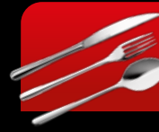
Набор столовых предметов взрослый 3 шт.