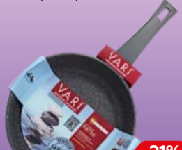
Сковорода АКВАФОР , мраморное покрытие, литая, 24см, 1 шт.