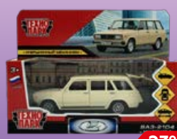
Машинка ТЕХНОПАРК Советское ретро, авто металл, в ассортименте***, 1 шт.