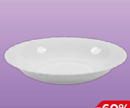
Тарелка WAVE суповая, 22см, 1 шт.