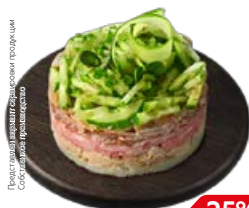
Салат ФАВОРИТ (СП), 100 г