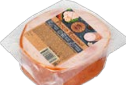
Рулет МЯСНАЯ ИСТОРИЯ куриный, копчено-вареный (Иней), 300 г