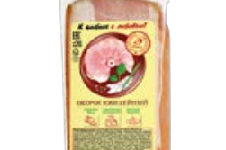
Окорок ЮБИЛЕЙНЫЙ , Копчено-вареный (ОО Иней), 300 г