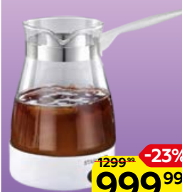
Кофеварка STARWIND электрическая турка, 1 шт.