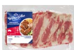
Ребрышки ЧЕРКИЗОВО , свиные, классические, охлажденные (ЧМПЗ), 1 кг