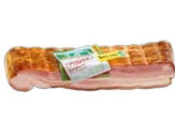
Грудинка ВЕЛКОМ Домашняя, копчено-вареная, 350 г