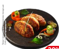
Котлета ЗАГАДКА , куриная (СП), 100 г