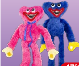
Мягкая игрушка NN фанта- стическое существо, 1 шт.