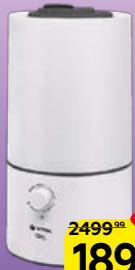
Увлажнитель воздуха VITEK, 1 шт.