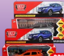
Машинка ТЕХНОПАРК Модели автомобилей, в ассортименте***, 1 шт.