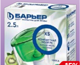
Фильтр-кувшин БАРЬЕР , Ника, 2,5 л