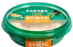
Хумус САВАВА рецепт из Иерусалима, 150 г