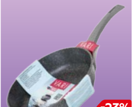
СКОВОРОДА Пиетра , мраморное покрытие, литая 4,6 мм, 26см, 1 шт.