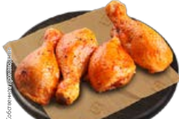
Полуфабрикат ГОЛЕНЬ КУРИНАЯ , в маринаде Алабама, охлажденная (СП), 1 кг