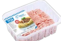
Фарш ДАЛЬНИЕ ДАЛИ , Из свинины (Агро-Белогорье), 700 г