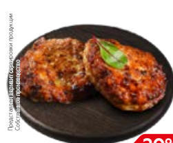
Оладьи ПЕЧЕНОЧНЫЕ (СП), 100 г