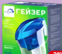
Фильтр-кувшин ГЕЙЗЕР Аквилон био, 3 л