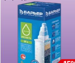
Кассета сменная БАРЬЕР 6, для фильтр-кувшина (Барьер), 1 шт.