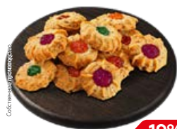
Печенье МАКОВОЕ сдобное (СП), 300 г