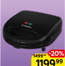
Сэндвичница STARWIND , 1 шт.