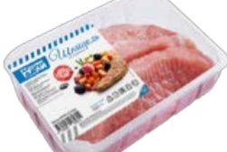
Шницель ДАЛЬНИЕ ДАЛИ , из свинины (Агро-Белогорье), 700 г