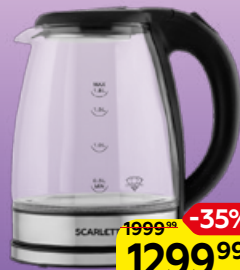
Чайник СКАРЛЕТТ , элек- трический, 1 шт.