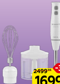
Блендерный набор СКАРЛЕТТ , 1 шт.