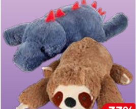
МЯГКАЯ ИГРУШКА Tallula в ассортименте***