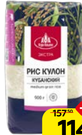
Рис КУЛОН , Кубанский (Агро-Альянс), 900 г