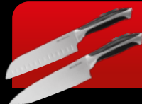
Нож сантоку 18 см. Нож поварской 19,5 см