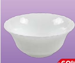
Салатник WAVE 12,6см, 1 шт.