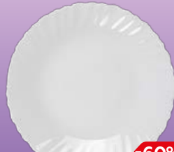
Тарелка WAVE десертная 19см, 1 шт.