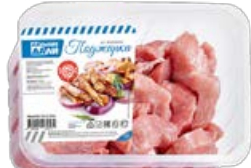
Поджарка ДАЛЬНИЕ ДАЛИ , из свинины (Агро-Белогорье), 700 г