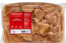
Шашлык свиной МИРАТОРГ , Деликатесный, охлажденный, 1 кг