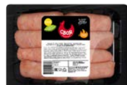
Купаты СВОЯ Бременские, охлажденные (Воловский бройлер), 500 г