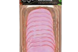
Карбонад ЕАТМЕАТ® , Юбилейный, варено-копченый, 150 г