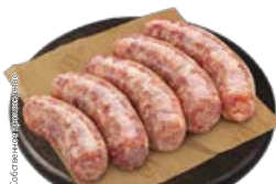
Полуфабрикаты КОЛБАСКИ ОХОТНИЧЬИ свино-говяжьи, охлажденные (СП), 1 кг