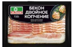
Бекон ВЕЛКОМ двойное копчение, сырокопченный, нарезка, 150 г