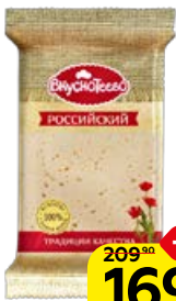
Сыр ВКУШОТЕЕВО Российский, 200 г