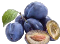
СЛИВА Сезонная, 1кг