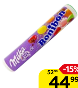
Драже MILKA Бонибон шоколадное, 24,3 г