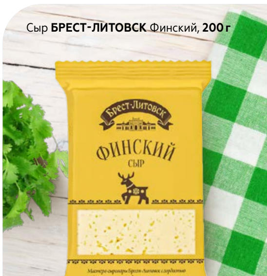
Сыр БРЕСТ-ЛИТОВСК Финский, 200 г