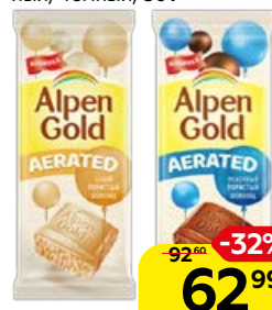
Шоколад ALPEN GOLD пористый: белый/ молочный/ темный, 80 г