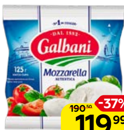
Сыр моцарелла GALBANI , 125 г