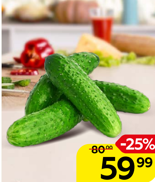
ОГУРЦЫ, короткоплодные, тепличные, 450 г