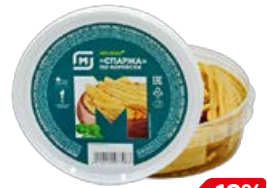
Спаржа МАГНИТ по-корейски, 200 г