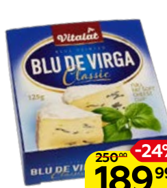
Сыр VITALAT , Блю Де Вирга, с плесенью, 125 г