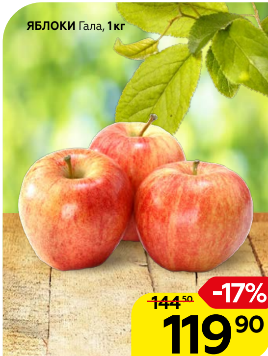
ЯБЛОКИ Гала, 1кг