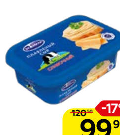
Сыр плавленый ЭКОМИЛК Сливочный, 200 г