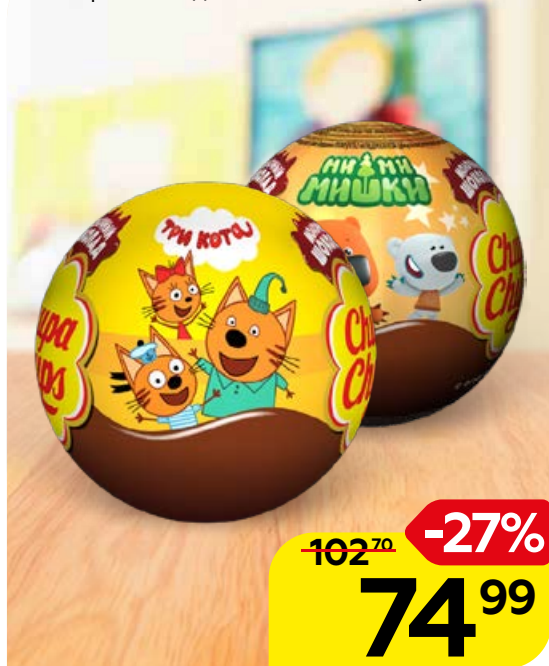
Шар шоколадный CHUPA CHUPS, 20 г