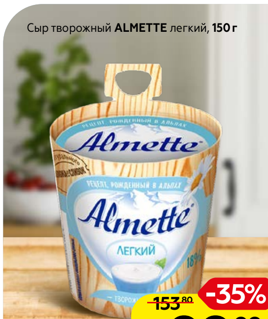
Сыр творожный ALMETTE легкий, 150 г