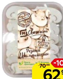
ШАМПИЬОНЫ резаные, 300 г