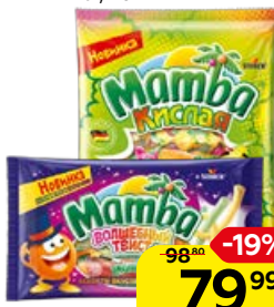
Конфеты жевательные МАМБА, Кислая/ Волшебный твист, 70 г