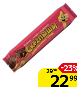
Батончик СКРЕПЫШИ нуга-карамель, 40 г