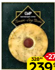
Сыр ГУРМЭ , томат-соус песто, 45% (Амига), 115 г