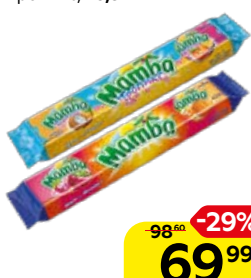
Конфеты жевательные МАМБА, классические/тропикс, 79,5 г