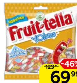
Мармелад жевательный FRUIT-TELLA с йогуртом, 138 г