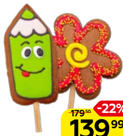
Имбирный пряник SOFI на палочке, с глазурью, 45 г