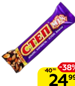
Батончик СТЕП Микс вафельный в глазури, 44 г