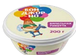
Сыр БОНДЖОРНО Рикотта, с ванилью, 200 г