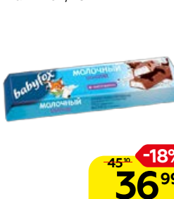
Шоколад молочный BABYFOX с молочной начинкой, 45 г