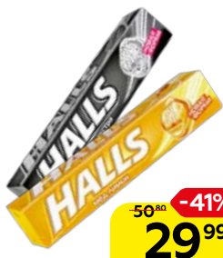
Леденцы HALLS, В ассортименте***, 24,5 г / 25 г