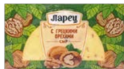
Сыр ЛАРЕЦ , с грецкими орехами, 245 г