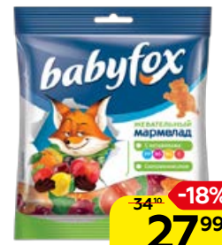
Мармелад жевательный BABYFOX бегемоты, 70 г