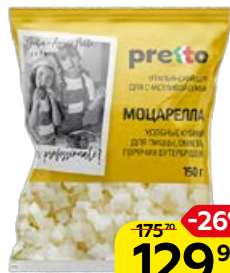
Сыр PRETTO Моцарелла, кубики, 45%, 150 г