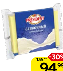
Сыр плавленый PRESIDENT , Сливочный, 150 г