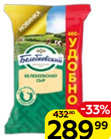
Сыр БЕЛЕБЕВСКИЙ , 400 г