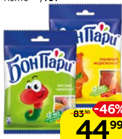
Мармелад жевательный БОН ПАРИ, В ассортименте***, 75 г