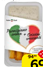
Крем-сыр ITALIAN SNACK пармезан миндаль гриссини, 50 г