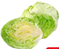
САЛАТ Айсберг, 1шт.