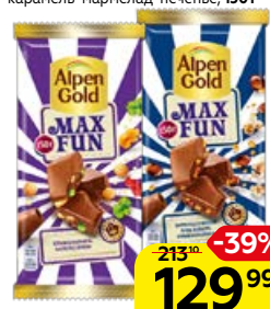
Шоколад ALPEN GOLD, Макс Фан: Мармелад со вкусом колы-попкорн-взрывная карамель/ Взрывная карамель-мармелад-печенье, 150 г