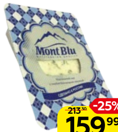
Сыр MONT BLU с голубой плесенью (Бобровский СЗ), 100 г