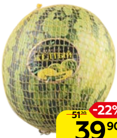
АРБУЗ желтый, 1кг