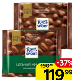
Шоколад RITTER SPORT, в ассортименте***, 100 г