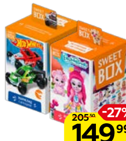
Мармелад SWEET BOX с игрушкой, 10 г