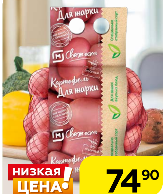
КАРТОФЕЛЬ для жарки, 1кг