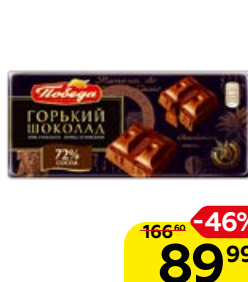
Шоколад ПОБЕДА ВКУСА, горький, 72%, 100 г