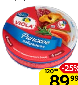
Сыр плавленый VIOLA Финское избранное, ассорти, 130 г