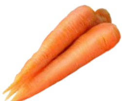
МОРКОВЬ, мытая, 1кг