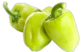
ПЕРЕЦ Болгарский, 1кг