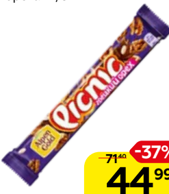
Батончик PICNIC, Шоколадный с грецкими орехами, 52 г