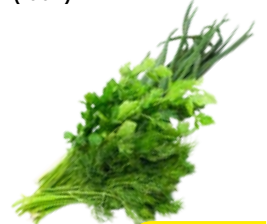
Зелень АССОРТИ Лук/ Укроп/ Петрушка, 1уп. (100 г)