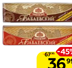
Батончик БАБАЕВСКИЙ, С помадно-сливочной начинкой/ С шоколадной начинкой, 50 г