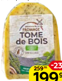
Сыр полутвердый TOME DE BOIS с прованскими травами, 41%, 200 г