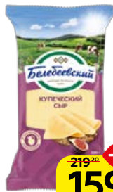
Сыр БЕЛЕБЕВСКИЙ , Купеческий, 190 г