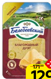
Сыр БЕЛЕБЕВСКИЙ Благородный дуэт, нарезка, 140 г