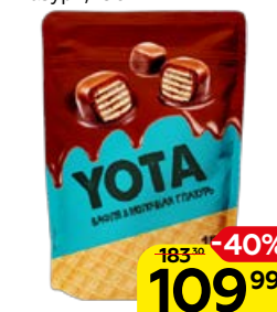
Драже вафельное YOTA в молочной шоколадной глазури, 150 г