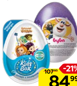
Десерт с игрушкой KIDS BOX/ ШОКИ ШОК, 20 г