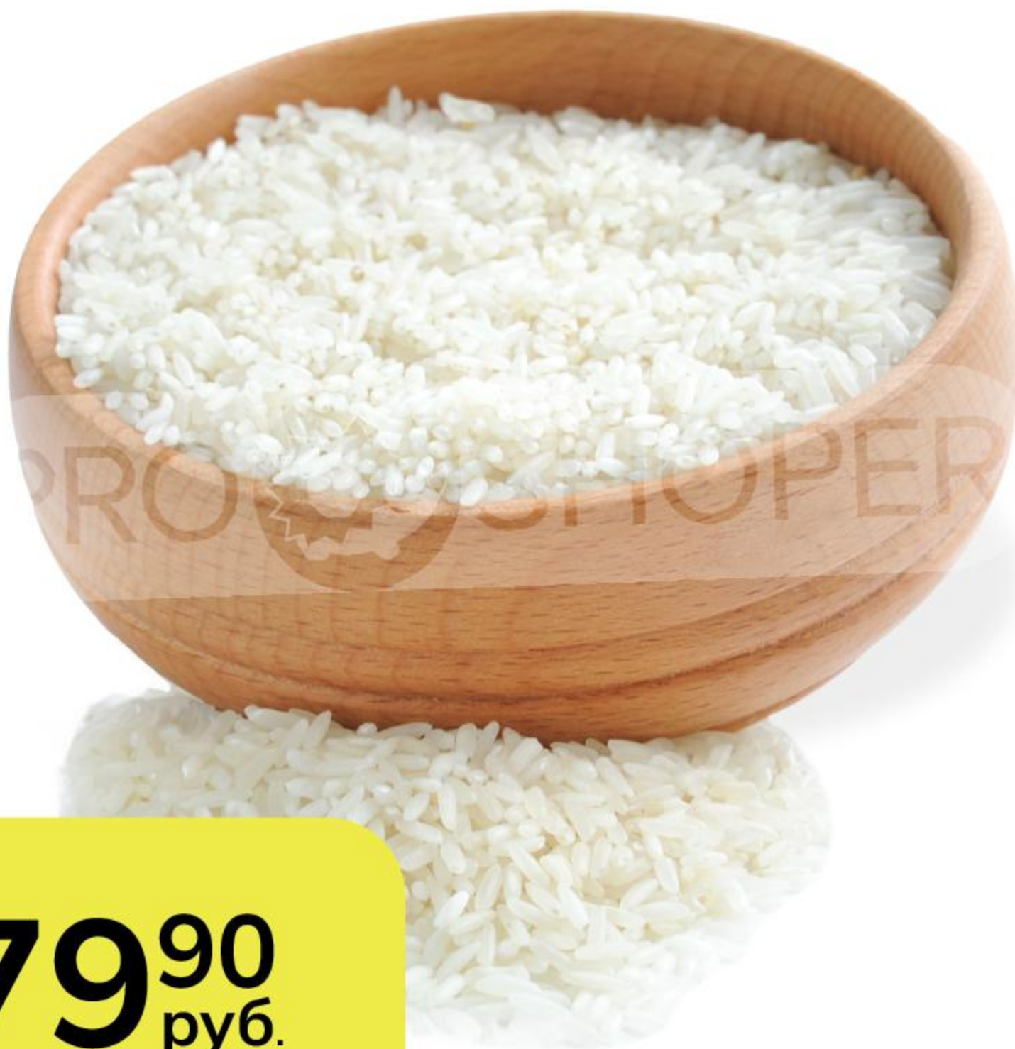
Рис пропаренный, 1 кг