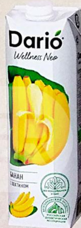
НЕКТАР DARIO WELLNESS БАНАН, 1 Л