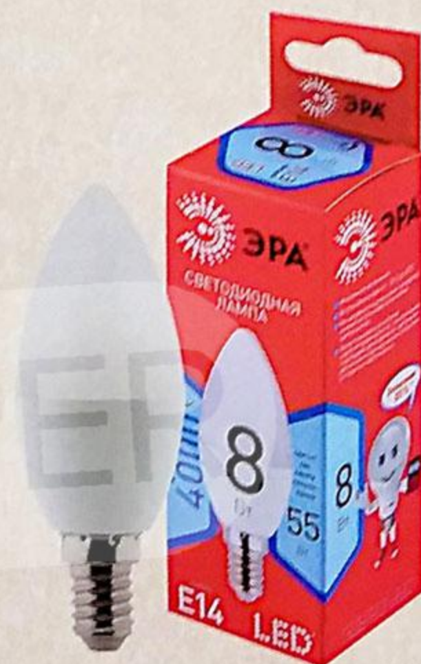
ЛАМПА ЭРА LED 8BT E14