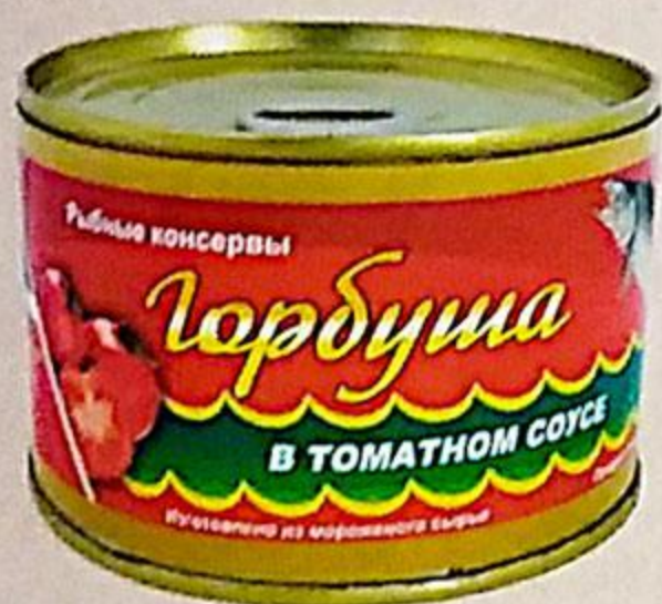
ГОРБУША В ТОМАТНОМ СОУСЕ КУРИЛЬСКИЙ БЕРЕГ, 245 Г