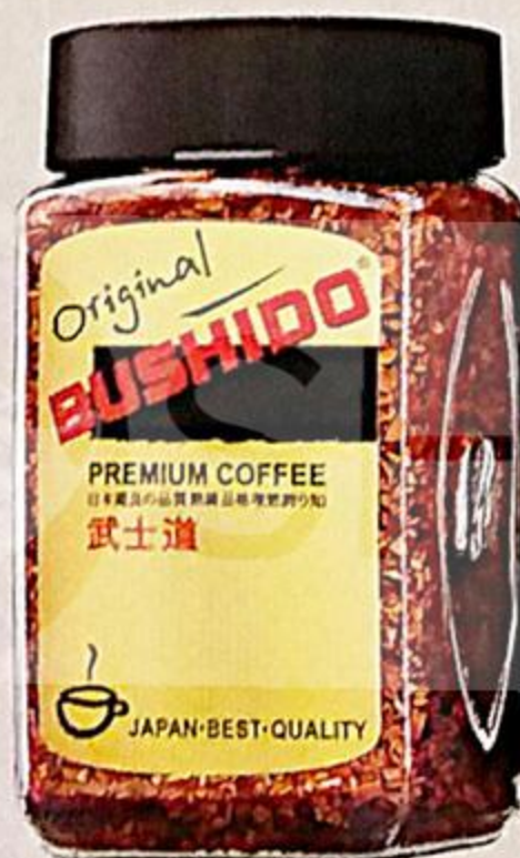
КОФЕ BUSHIDO ORIGINAL, РАСТВОРИМЫЙ, 100 Г