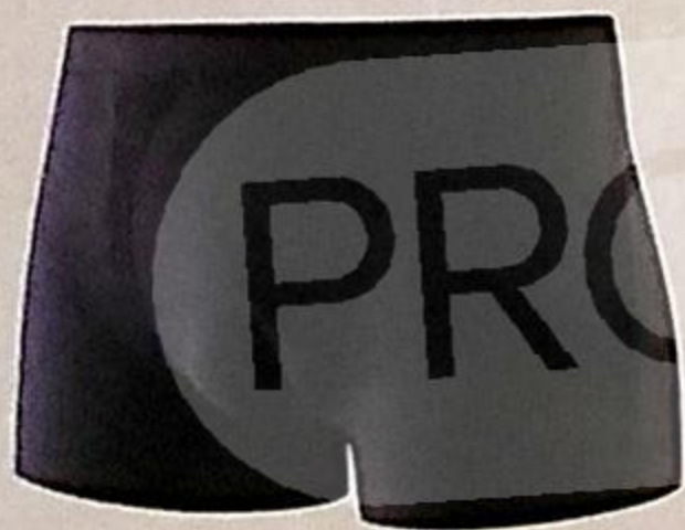
БОКСЕРЫ МУЖСКИЕ P-P52-62