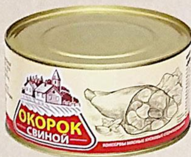
ОКОРОК СВИНОЙ 325 Г