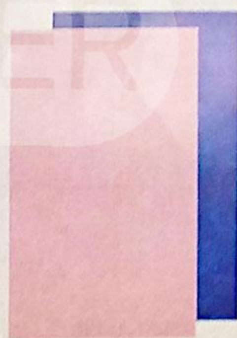
ПОЛОТЕНЦЕ КУХОННОЕ МАХРОВОЕ, 30X50 СМ