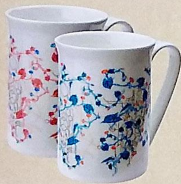
КРУЖКА АРОЛЛО КОСТЯНОЙ ФАРФОР, 435 МЛ