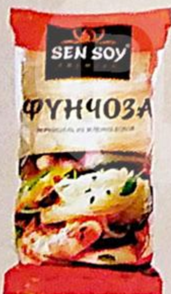
ВЕРМИШЕЛЬ ФУНЧОЗА СЭН СОЙ, 200 Г