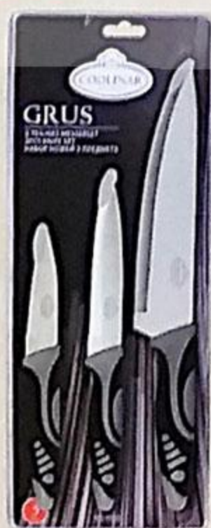
НАБОР НОЖЕЙ СООЛИНАР ПОВАРСКОЙ 20 СМ, УНИВЕРСАЛЬНЫЙ 13 СМ, НОЖ ДЛЯ ОВОЩЕЙ 8,75 СМ, 1 УП.