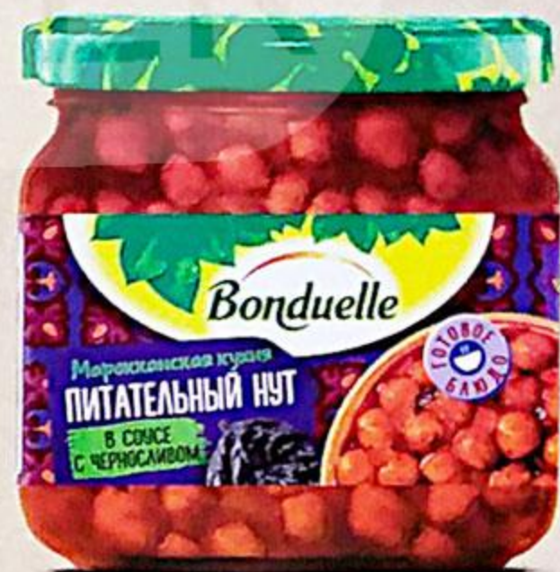
НУТ BONDUELLE С ЧЕРНОСЛИВОМ, 350 МЛ