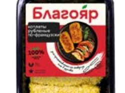
Котлеты рубленые БЛАГОЯР по-французски, охлажденные, 480 г