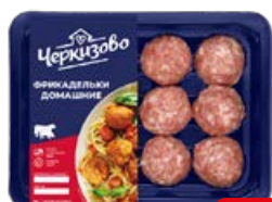
Фрикадельки ЧЕРКИЗОВО Домашние, 360 г