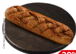
Багет ПИКАНТНЫЙ (СП), 155 г