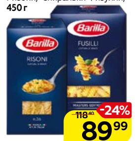
Макаронные изделия BARILLA Букатини, 400 г; Ризони/ Спиральки Физулли, 450 г