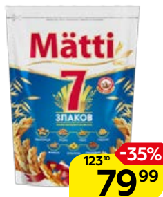
Хлопья МАТТИ, 7 злаков, 400 г