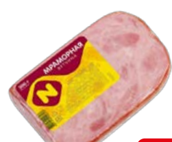
Ветчина МРАМОРНАЯ, вареная (ОМПК), 300 г