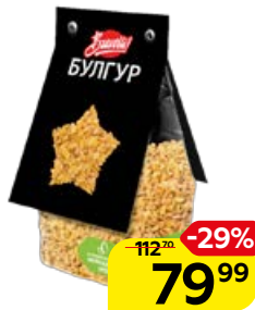
Булгур BRAVOLLI, 350 г