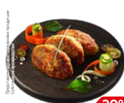
Котлета ЗАГАДКА, куриная (СП), 100 г