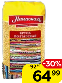
Крупа пшеничная НАЦИОНАЛЬ, Полтавская, 700 г