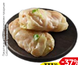
Полуфабрикат ГОЛУБЦЫ мясные, охлажденные (СП), 1кг