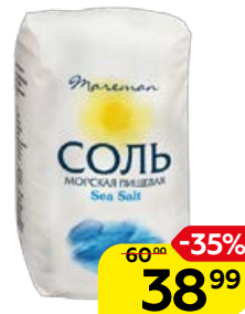
Соль морская MAREMAN, Средняя, 1 кг