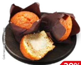
МАФФИН с ванилином (СП), 120 г