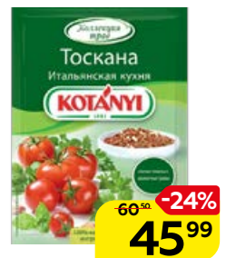
Приправа КОТАНИ Тоскана, итальянская кухня, 20 г