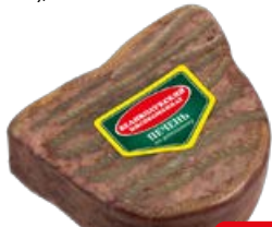
Печень ПО-ДОМАШНЕМУ вареная (Великолукский МК), 300 г