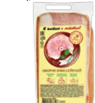
Окорок ЮБИЛЕЙНЫЙ, Копчено-вареный (ООО Иней), 300 г