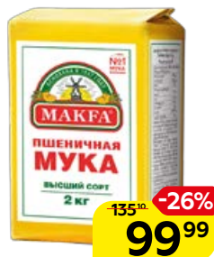
Мука пшеничная МАКФА® высший сорт, 2 кг