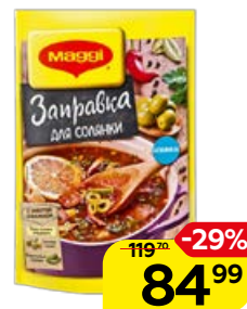
Заправка для солянки МАГГИ®, 180 г