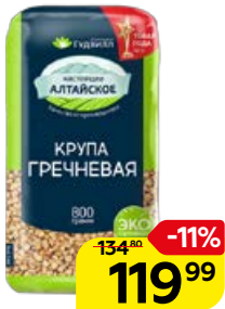
Крупа гречневая ГУДВИЛ, 800 г