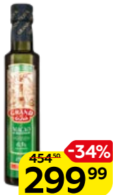
Масло оливковое GRAND DI OLIVA, Экстра Вирджин, 250 мл