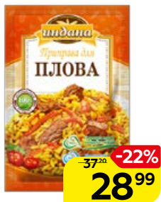
Приправа ИНДАНА для плова, 15 г