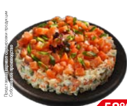
Салат НОРВЕЖСКИЙ (СП), 100 г