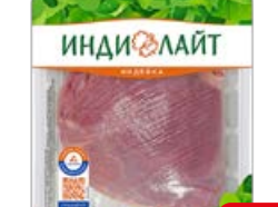
Филе бедра индейки ИНДИЛАЙТ, охлажденное, 410 г