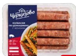
Колбаски ЧЕРКИЗОВО, по-домашнему, с чесноком, охлажденные, 450 г