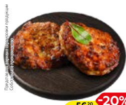
Оладьи ПЕЧЕНОЧНЫЕ (СП), 100 г