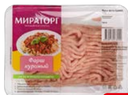
Фарш МИРАТОРГ куриный, охлажденный, 400 г