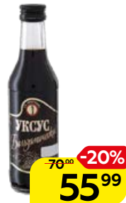
УКСУС БАЛЬЗАМИЧЕСКИЙ (СП Мирный), 250 мл