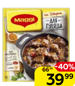
Приправа МАГГИ®, На Второе, Для гуляша, 37 г