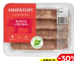
Купаты свиные МИРАТОРГ, Экстра, охлажденные, 400 г