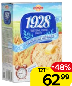
Хлопья овсяные MYLLYN PARAS, 500 г