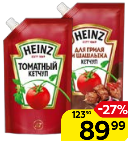
Кетчуп HEINZ, Томатный/ для гриля и шашлыка, 320 г