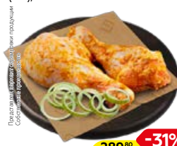
Полуфабрикат ГОЛЕНЬ КУРИНАЯ в маринаде Средиземноморский, охлажденная (СП), 1кг