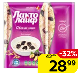
Каша ЛАКТОЛАЙФ овсяная с черносливом, 40 г