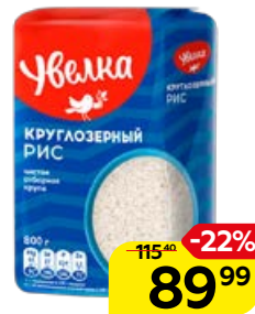
Рис круглозерный УВЕЛКА, 800 г