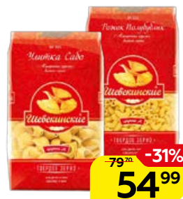
Макаронные изделия ШЕБЕКИНСКИЕ, Рожки/ Улитка Сабо, 450 г