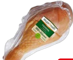
Голень индейки ИНДИЛАЙТ варено-копченая, 100 г