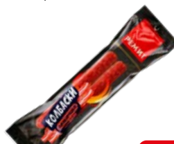
Колбаски РЕМИТ Торнадо, со вкусом бекона, сырокопченые, 60 г