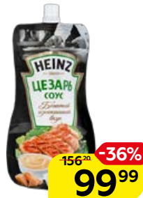
Соус HEINZ, Цезарь, 230 г