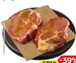
Полуфабрикат СТЕЙК СВИНОЙ шея, в маринаде Грецкий орех, охлажденный (СП), 1кг