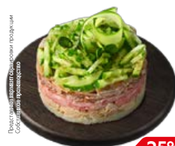
Салат ФАВОРИТ (СП), 100 г