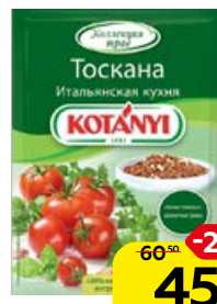
Приправа КОТАНИ Тоскана, итальянская кухня, 20 г