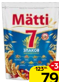
Хлопья МАТТИ, 7 злаков, 400 г