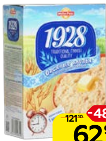
Хлопья овсяные MYLLYN PARAS, 500 г