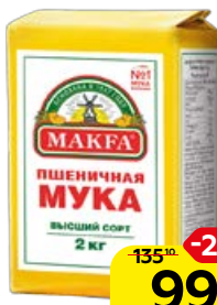
Мука пшеничная МАКФА® высший сорт, 2 кг