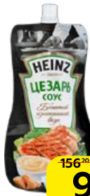
Соус HEINZ, Цезарь, 230 г