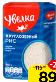
Рис круглозерный УВЕЛКА, 800 г