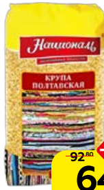
Крупа пшеничная НАЦИОНАЛЬ, Полтавская, 700 г