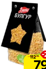
Булгур BRAVOLLI, 350 г