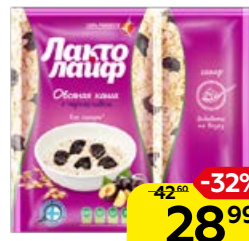
Каша ЛАКТОЛАЙФ овсяная с черносливом, 40 г