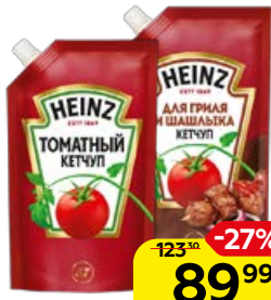
Кетчуп HEINZ, Томатный/ для гриля и шашлыка, 320 г