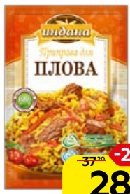
Приправа ИНДАНА для плова, 15 г