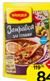
Заправка для солянки МАГГИ®, 180 г