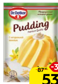
Пудинг DR.OETKER с натуральной ванилью, 35 г