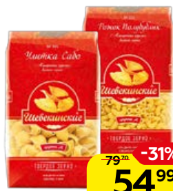
Макаронные изделия ШЕБЕКИНСКИЕ, Рожки/ Улитка Сабо, 450 г