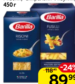
Макаронные изделия BARILLA Букатини, 400 г; Ризони/ Спиральки Физулли, 450 г