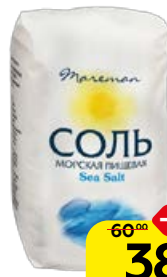
Соль морская MAREMAN, Средняя, 1 кг