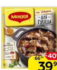
Приправа МАГГИ®, На Второе, Для гуляша, 37 г