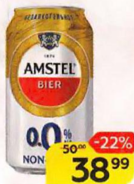
Напиток пивной AMSTEL светлый безалкогольный, 0,33 л