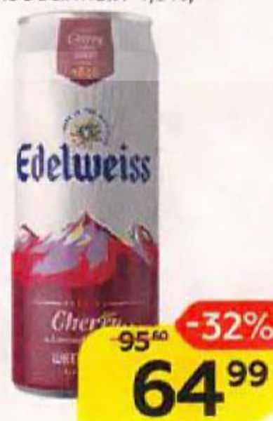
Напиток пивной EDELWEISS вишня, нефilterованный пастеризованный 4,5%, 0,43 л