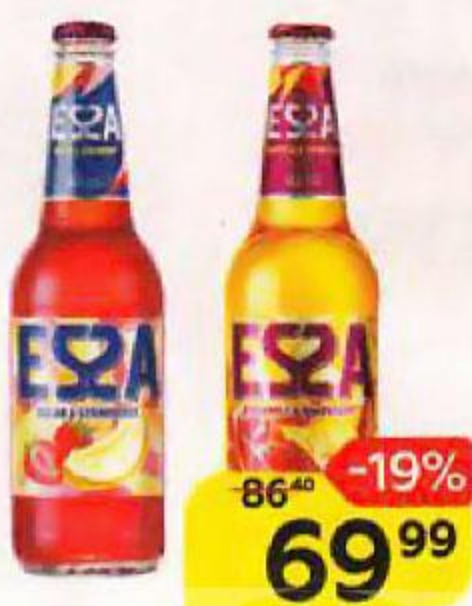
Напиток пивной ESSA в ассортименте***, 0,45 л