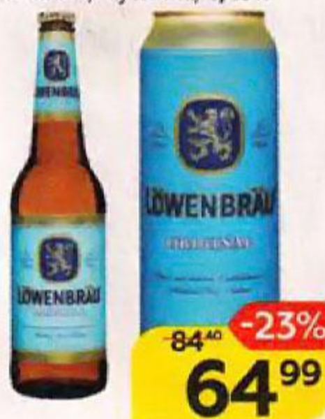
Пиво LOWENBRAU Оригинальное, светлое, фfilterованное, 5,4%: банка/ бутылка, 0,45 л