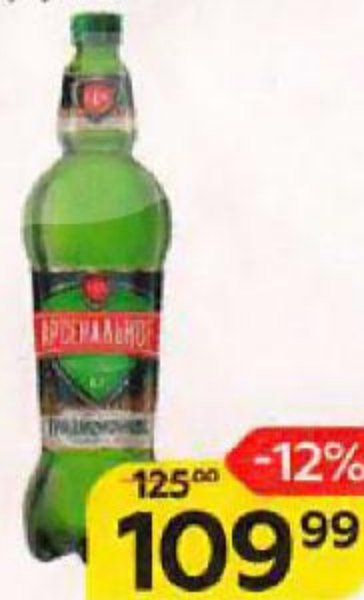
Пиво светлое АРСЕНАЛЬНОЕ Традиционное, 4,7%, 1,25 л