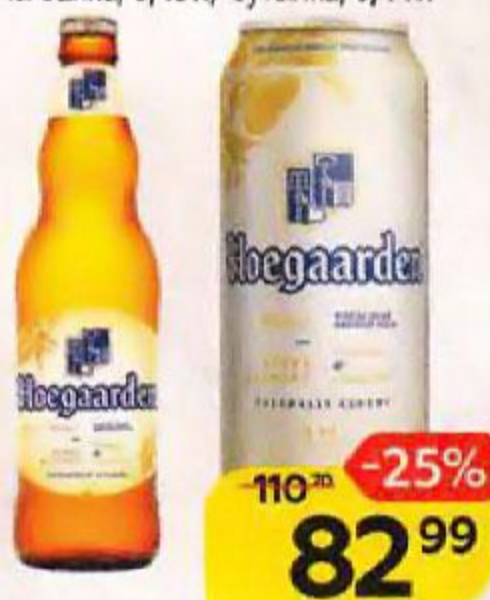
Напиток пивной HOEGAARDEN® , нефilterованный, пастеризованный, 4,9%: банка, 0,45 л/ бутылка, 0,44 л