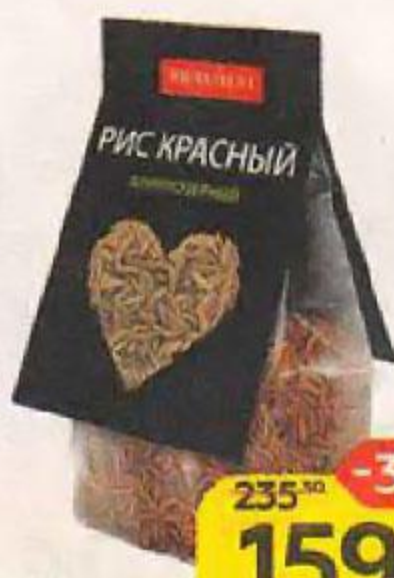
Рис BRAVOLLI красный, 350 г