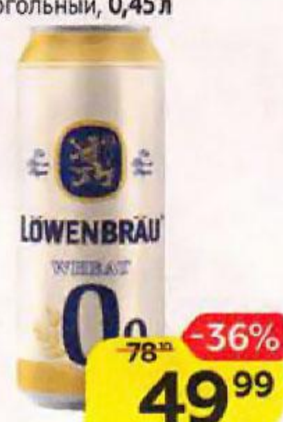
Напиток пивной LOWENBRAU Пшеничный, нефilterованный безалкогольный, 0,45 л