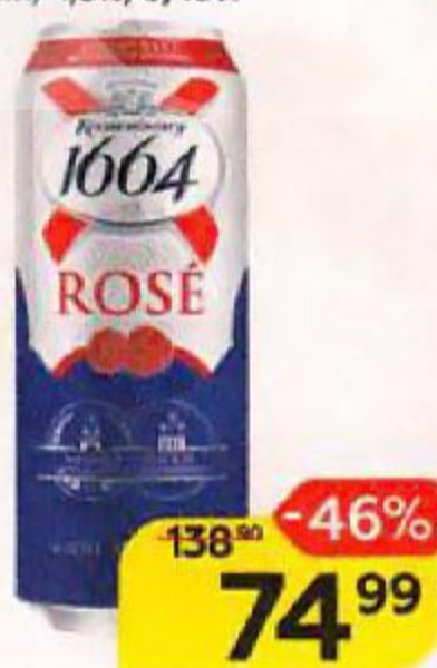
Напиток пивной KRONENBOURG 1664 Розе, пшеничный нефilterованный, 4,5%, 0,45 л