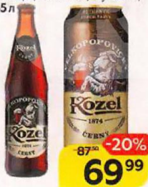
Напиток пивной VELKOROVICKY KOZEL , темный, 3,7%: банка/ бутылка, 0,45 л