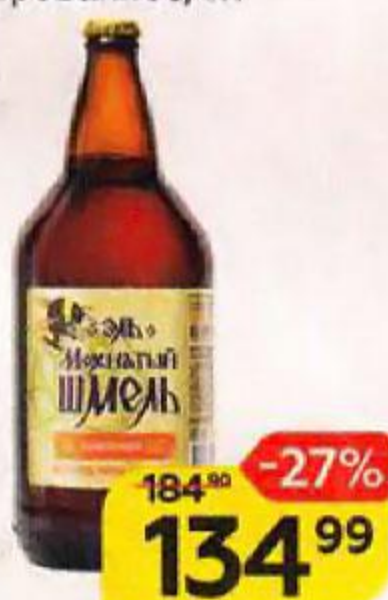
Пиво светлое Эль МОХНАТЫЙ ШМЕЛЬ нефilterованное, 1 л