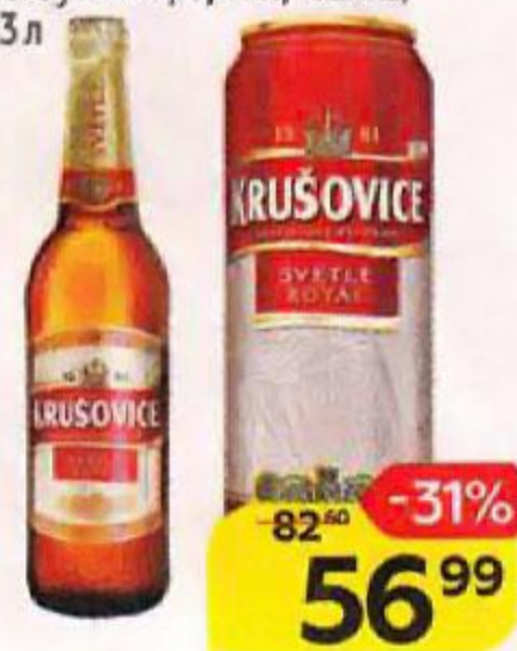
Пиво KRUSOVICE , светлое, фfilterованное, пастеризованное, 4,2%: бутылка, 0,45 л/ банка, 0,43 л