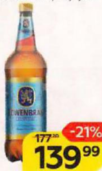
Пиво LOWENBRAU Оригинальное, светлое пастеризованное 5,4%, 1,3 л