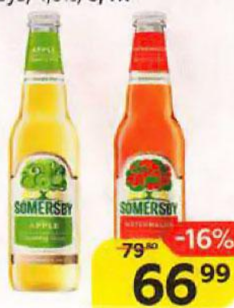
Напиток пивной SOMERSBY Яблоко, 4,5%/ Арбуз, 4,6%, 0,4 л