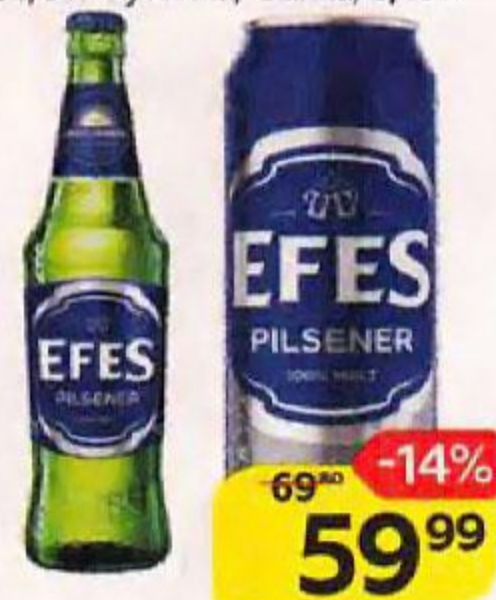
Пиво EFES Пилснер, светлое, фfilterованное пастеризованное, 5%: Бутылка/ Банка, 0,45 л