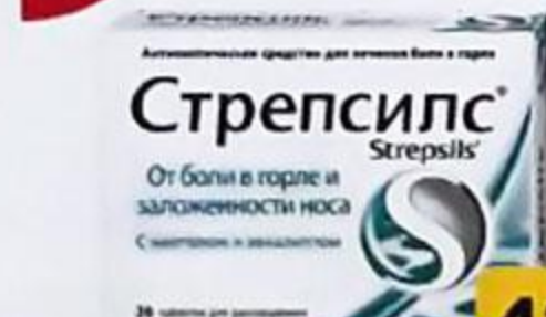
ТАБЛ. П. О. 10 МГ, №30 П N013867/01