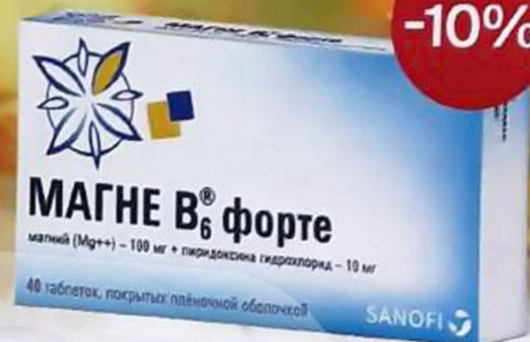
ТАБЛ. П. О. №40 ЛСР-007053/09