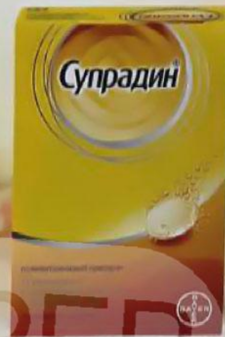
ТАБЛ. ШИПУЧ. №20 П №015220/01