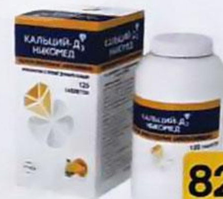
ТАБЛ. П. О. №120 П N014829/01