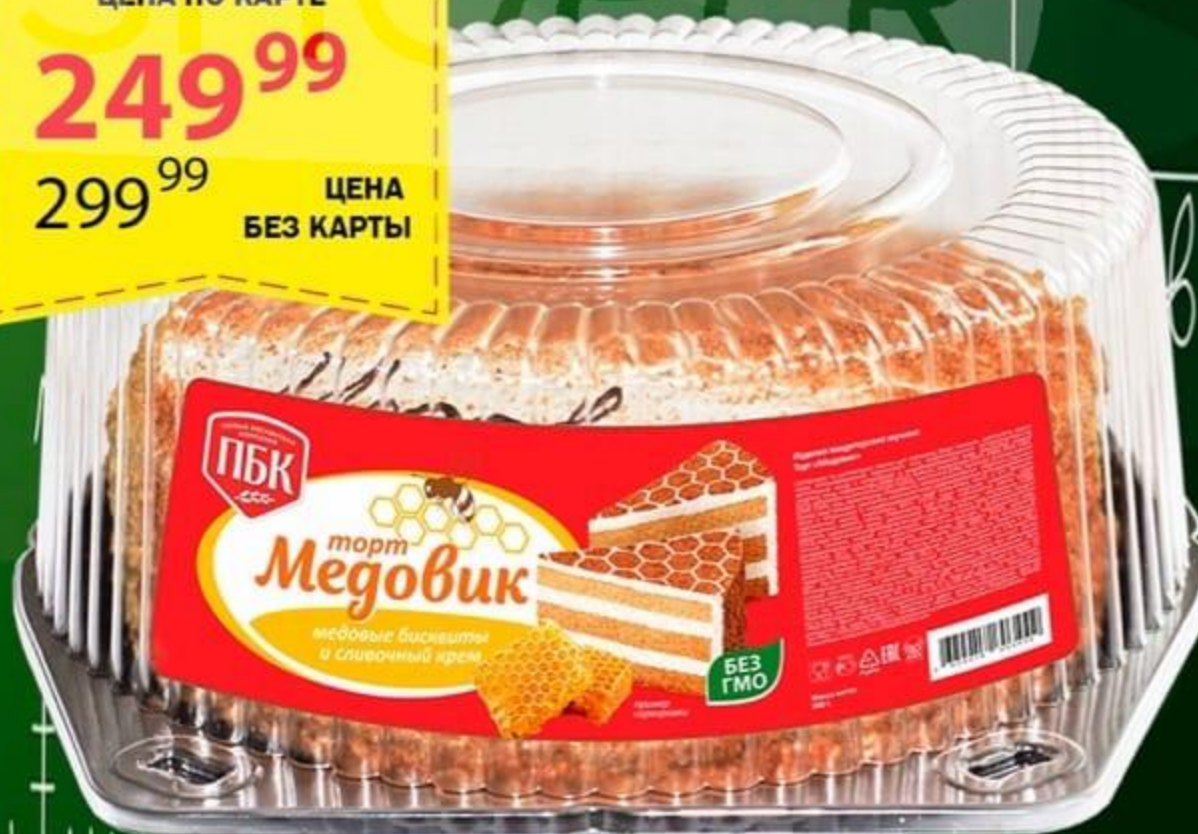
ТОРТ МЕДОВИК 500 ГР

ЦЕНА ПО КАРТЕ 249 99 299 99 ЦЕНА БЕЗ КАРТЫ