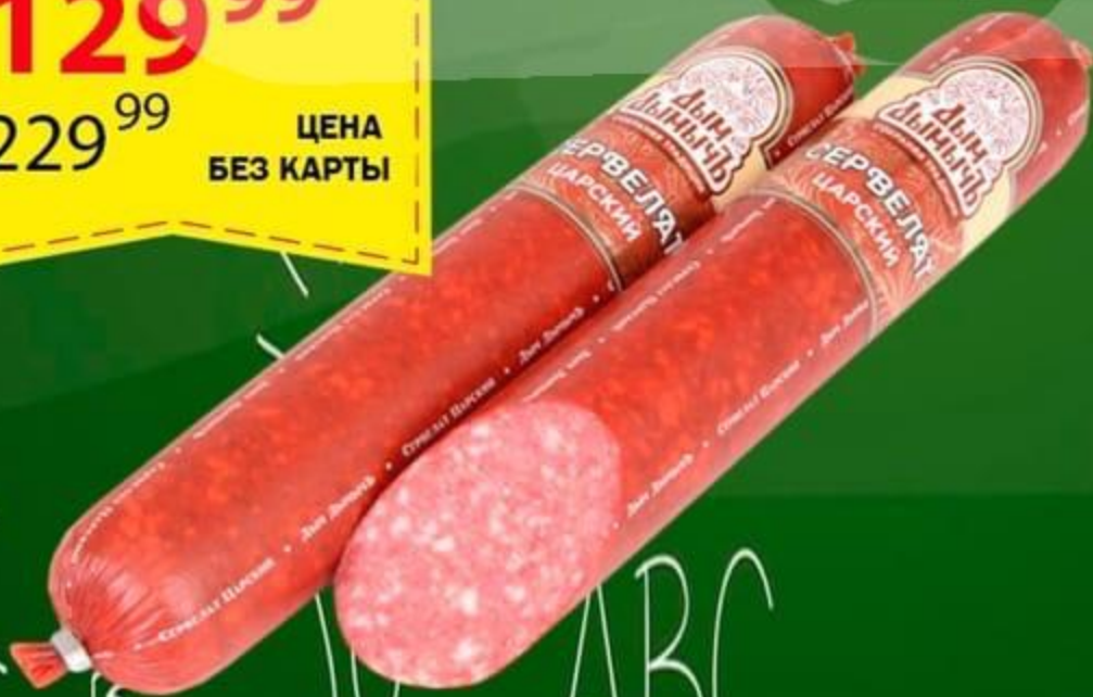
СЕРВЕЛАТ ЦАРСКИЙ 350 ГР

ЦЕНА ПО КАРТЕ 129 99 229 99 ЦЕНА БЕЗ КАРТЫ