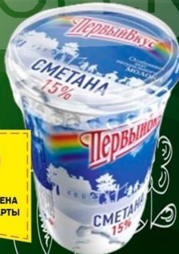
СМЕТАНА 15% 500 ГР

ЦЕНА ПО КАРТЕ 99 99 119 99 ЦЕНА БЕЗ КАРТЫ