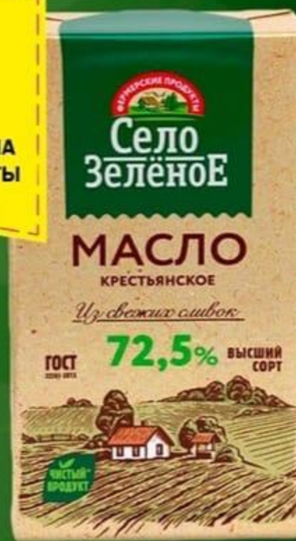
МАСЛО 72,5% 175 ГР

ЦЕНА ПО КАРТЕ 99 99 179 99 ЦЕНА БЕЗ КАРТЫ