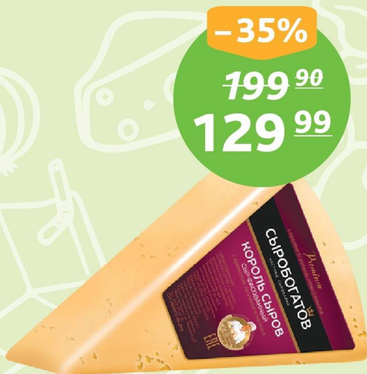
Сыр «Король сыров», 40%, ТМ «Сыробогатов», 180 г