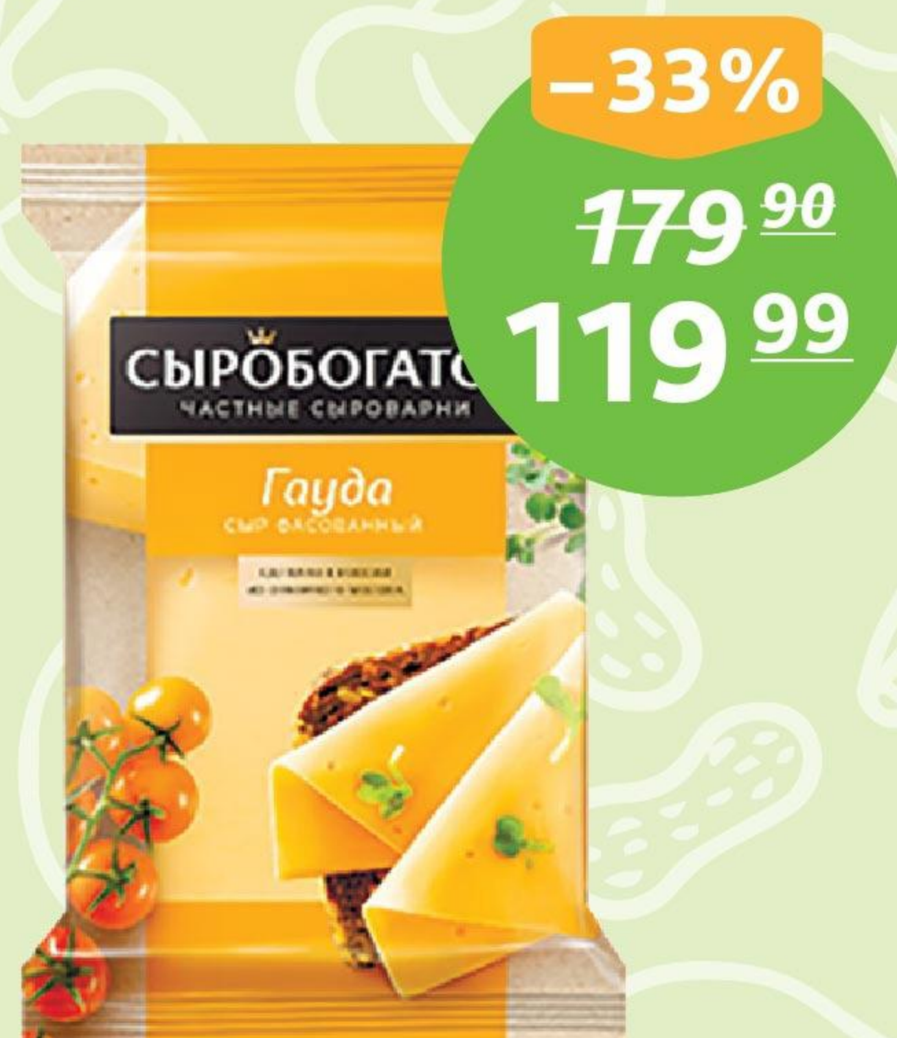
Сыр «Гауда», 45%, ТМ «Сыробогатов», фас., 180 г