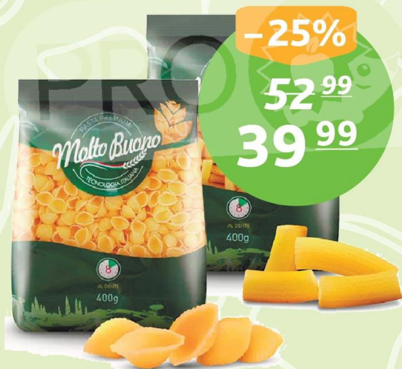
Макаронные изд. «Молто Буоно», 400 г, спиральки, рожки, улитки, спагетти