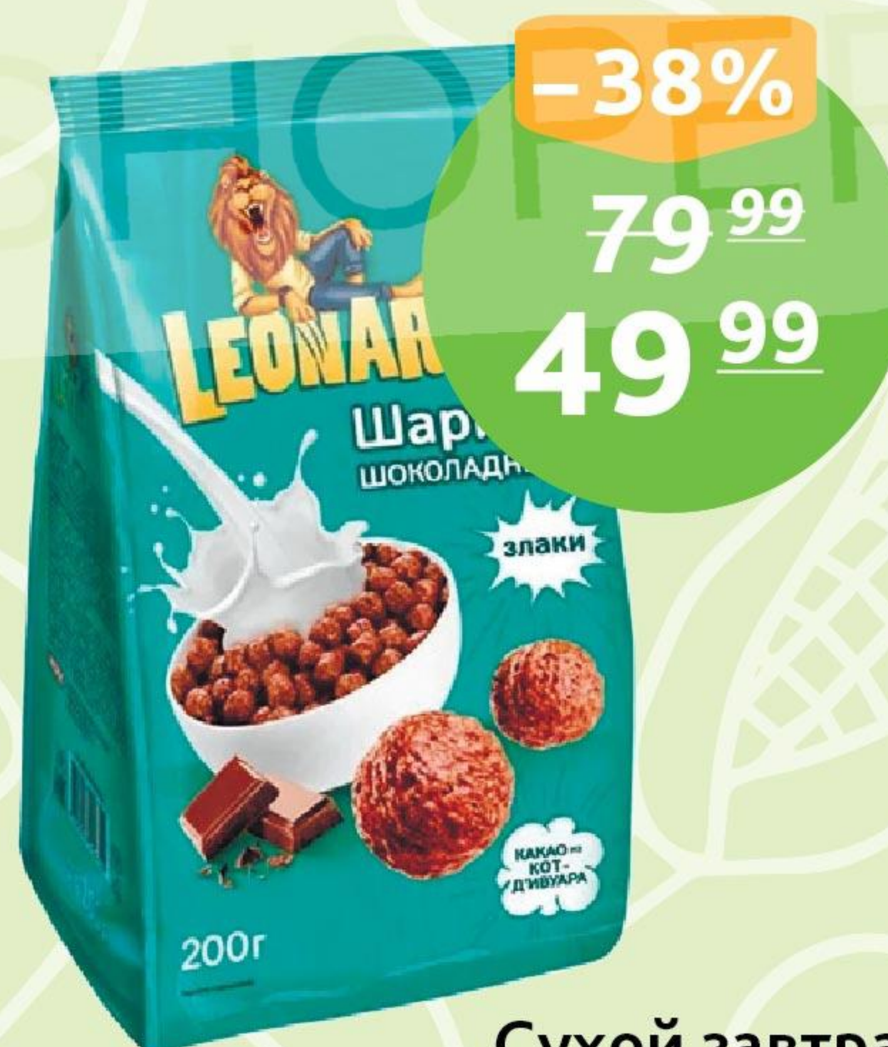
Сухой завтрак «Леонардо», шарики шок., 200 г

с четверга 10 ноября по среду 16 ноября 2022