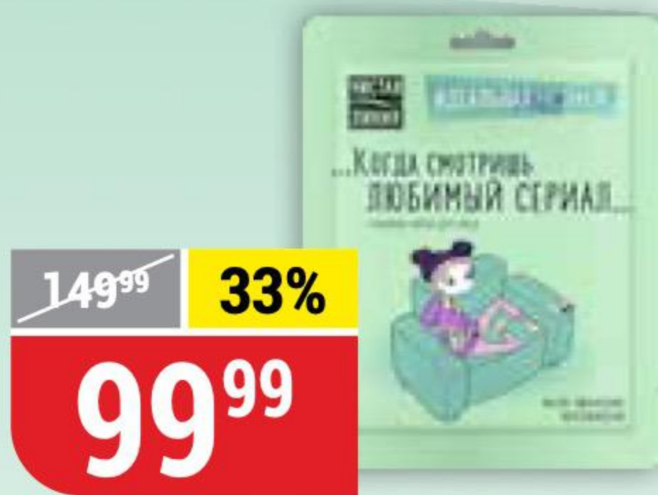
МАСКА ДЛЯ ЛИЦА идеальная кожа, увлажнение, Чистая Линия, 1 шт. 154811