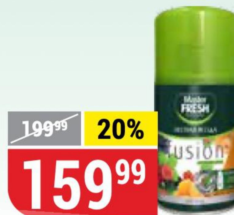
ОСВЕЖИТЕЛЬ ВОЗДУХА MASTER FRESH лесная ягода, 250 мл 162985