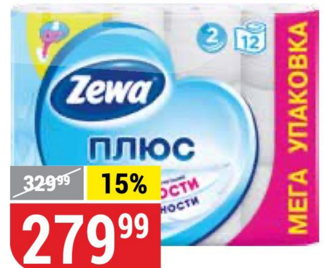
ТУАЛЕТНАЯ БУМАГА ZEWA ПЛЮС белая, 2 слоя, 12 рул. 121716