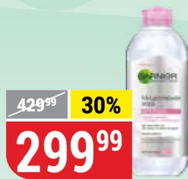
ВОДА МИЦЕЛЛЯРНАЯ GARNIER 3 в 1, 400 мл 119582