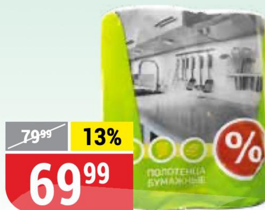
ПОЛОТЕНЦА БУМАЖНЫЕ % 2 слоя, 2 рул. 132477