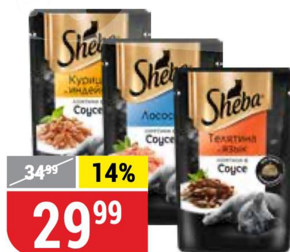
КОРМ ДЛЯ КОШЕК SHEBA в ассортименте, 75 г 164197/164199/164216/164218/164220