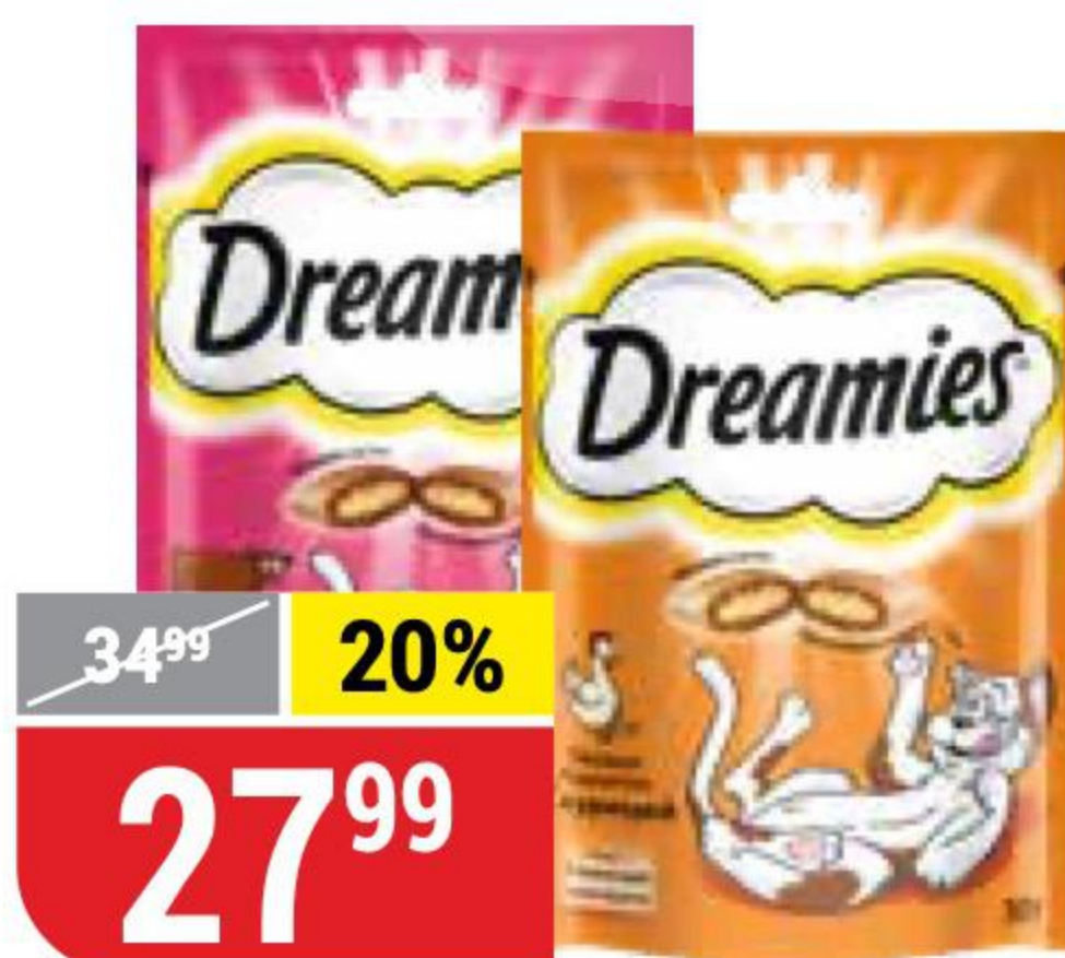
КОРМ ДЛЯ КОШЕК DREAMIES говядина; курица, 30 г 116755/116756