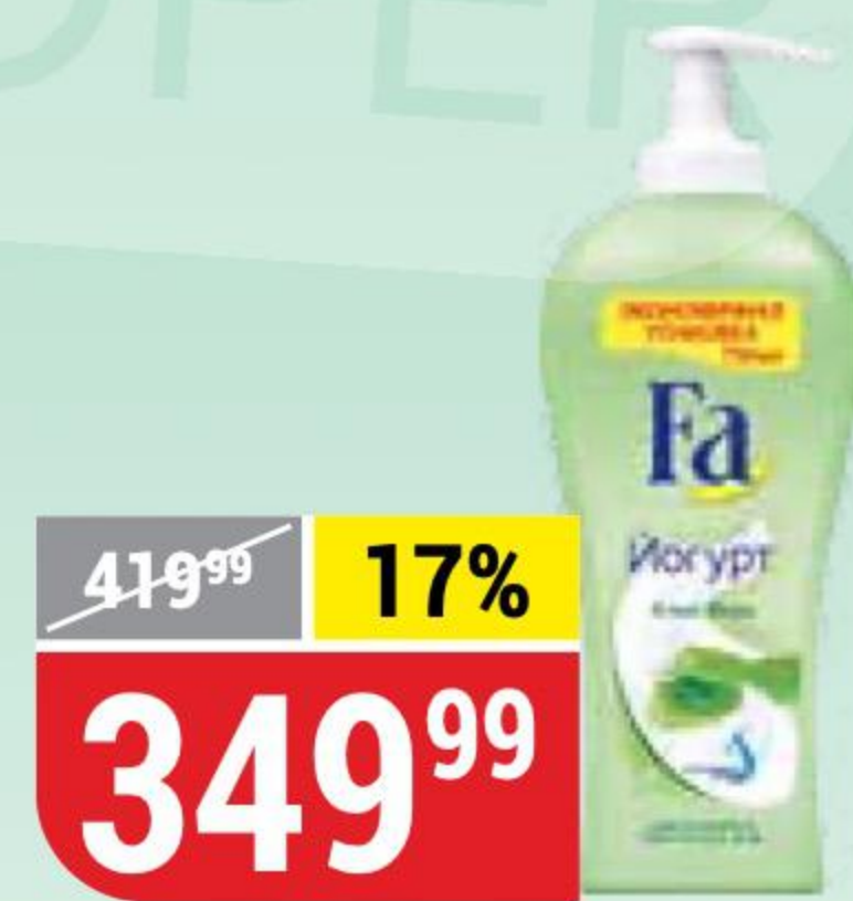
ГЕЛЬ-КРЕМ ДЛЯ ДУША FA йогурт, алоэ вера, 750 мл 127466