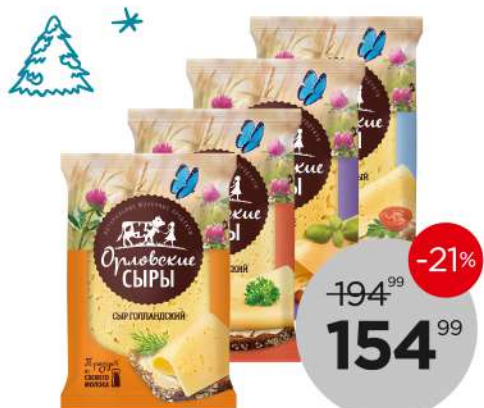
Орловские сыры Голландский 45%ж/Российский/ С топленным молоком/Сливочный 50%ж, БЗМЖ, 180 г