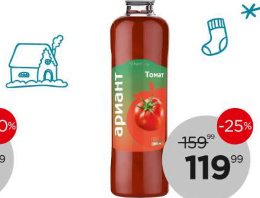
Сок Ариант Томатный ПРЕМИУМ, восстановл. с мякотью и солью, 1 л