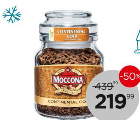
Кофе Моксона Continental Gold растворимый, ст/б, 95 г