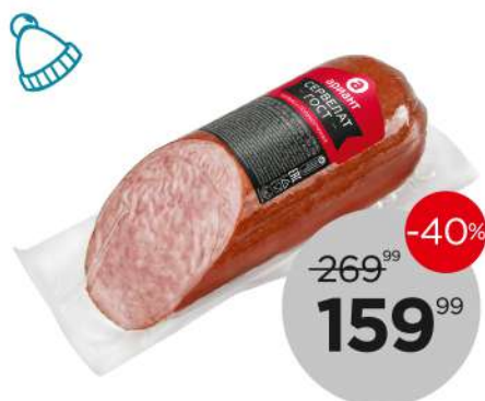
Сервелат ГОСТ колбаса в/к, 310 г