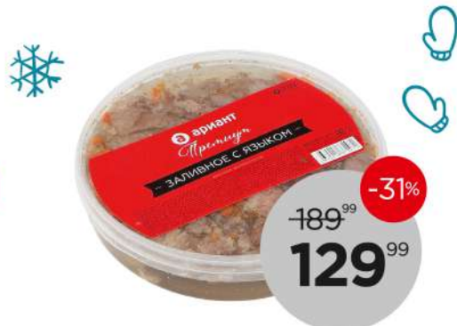
Заливное с языком 300 г