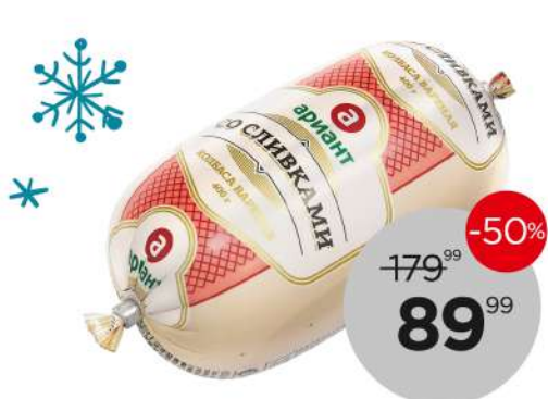
Колбаса вареная со сливками, 400 г