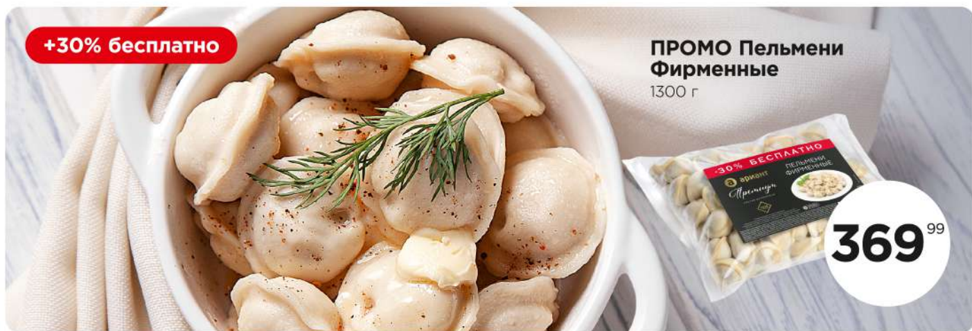
ПРОМО Пельмени Фирменные 1300 г