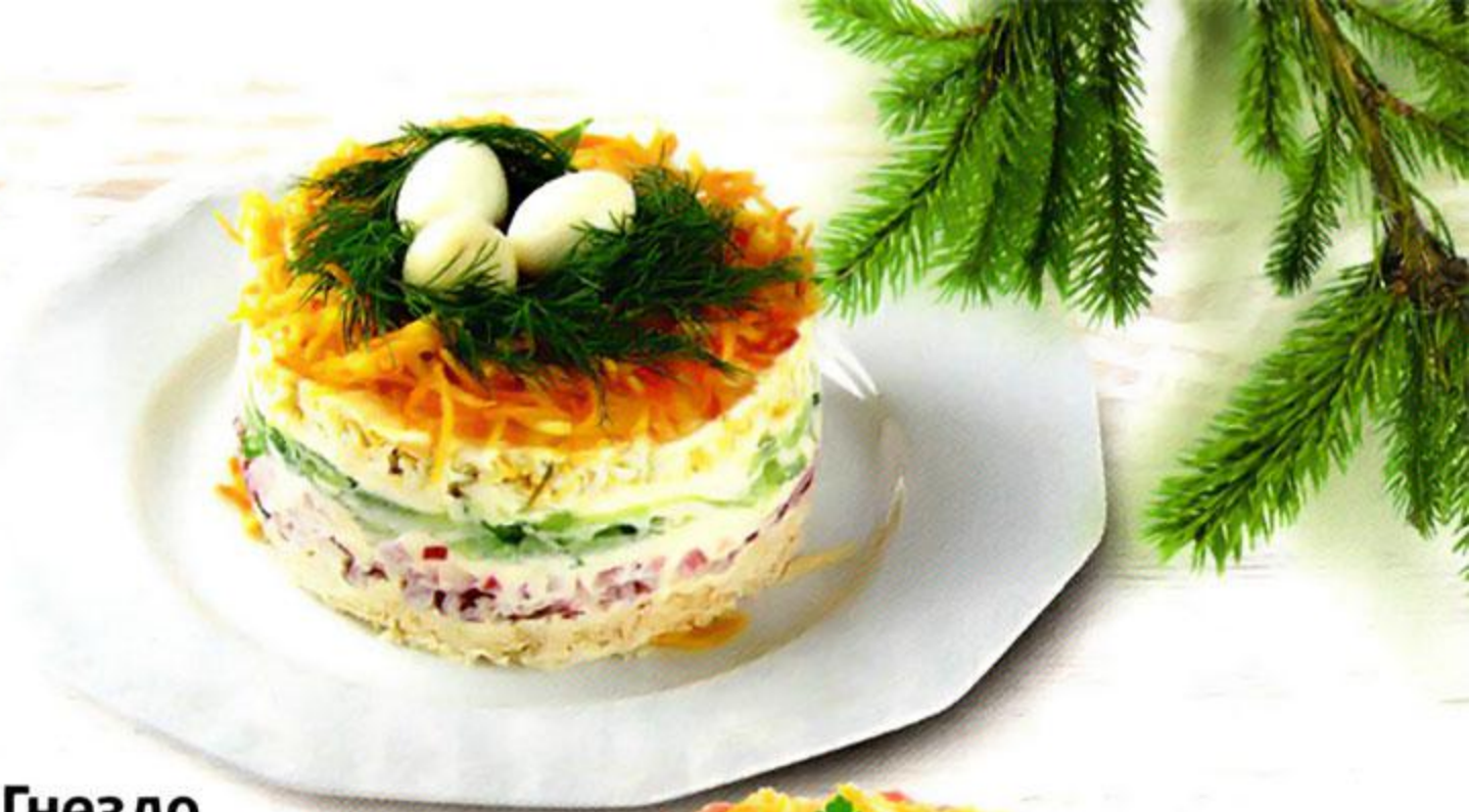
Салат Гнездо глухаря, 100 г