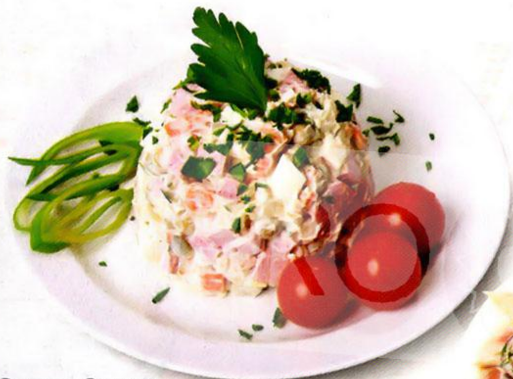
Салат Оливье, 100 г