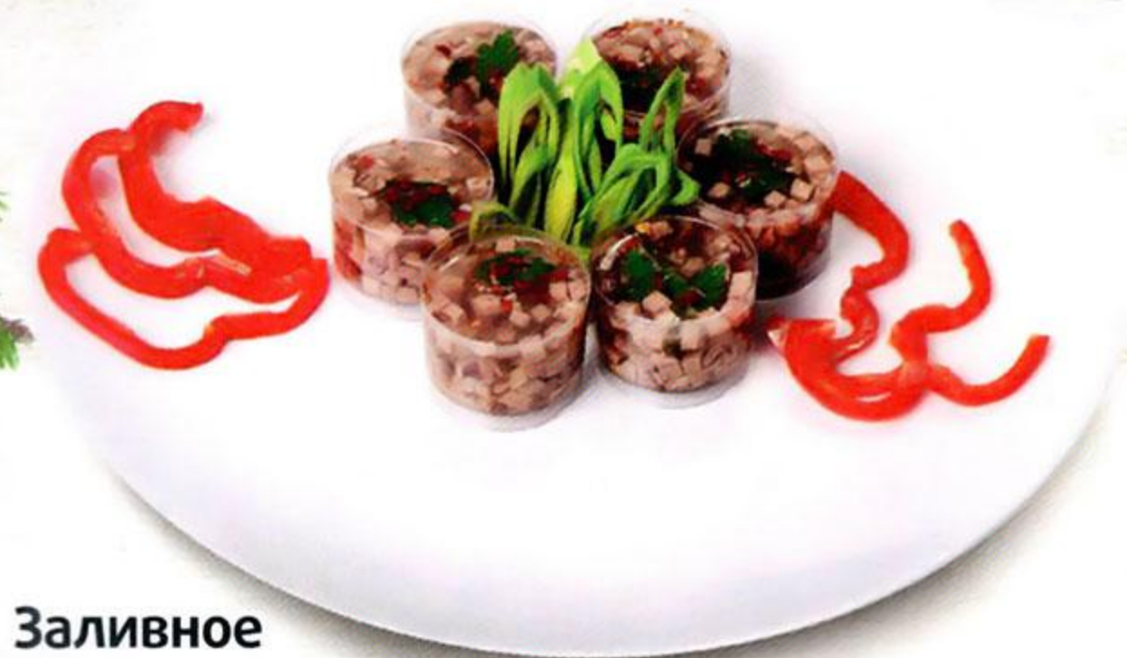
Заливное из языка, 6 x 40 г