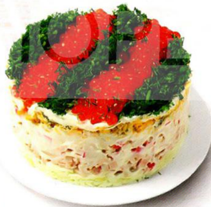
Салат Адмиральский, 100 г