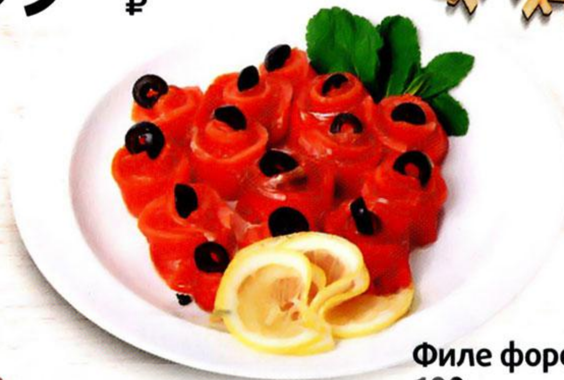
Филе форели, 100 г