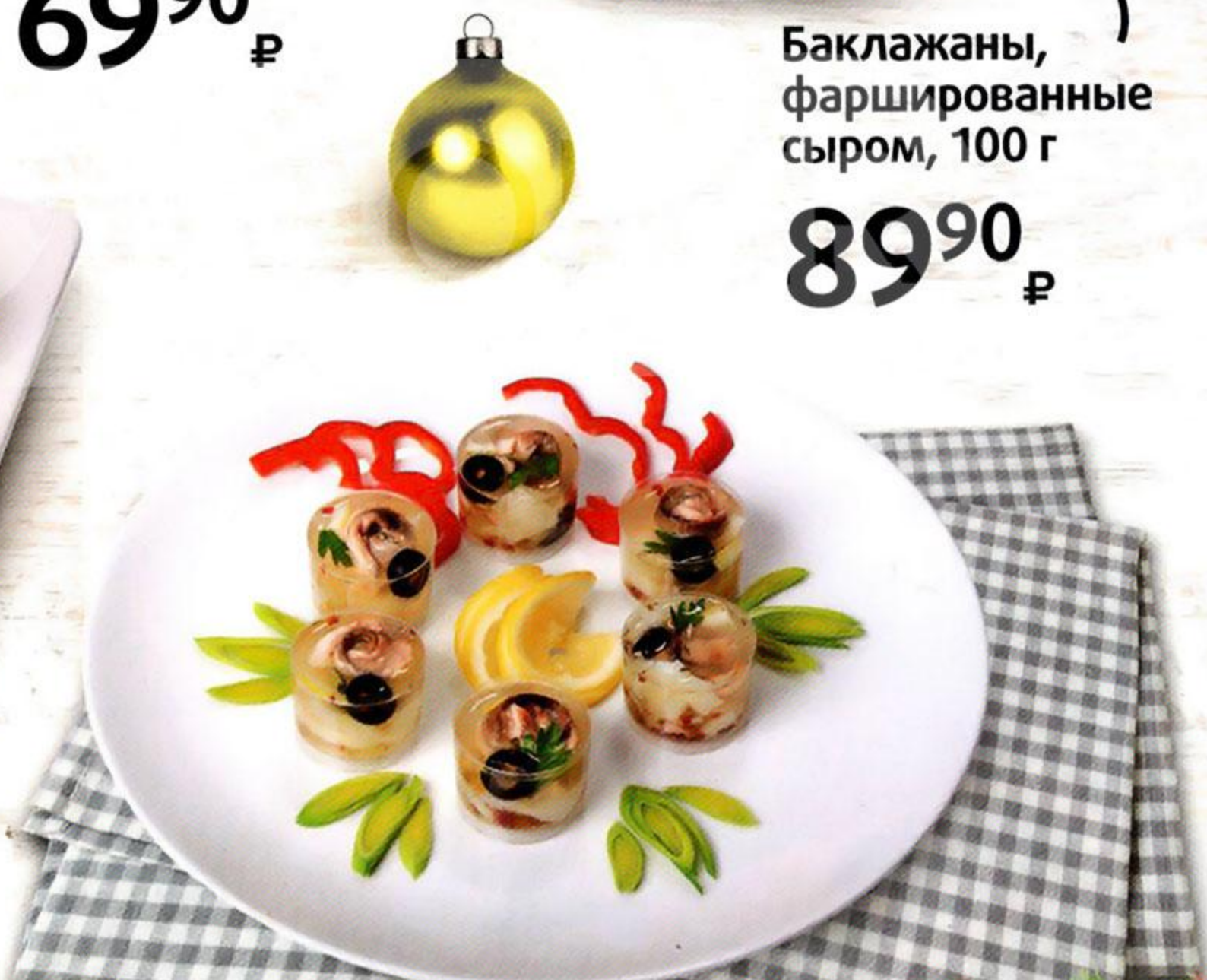
Баклажаны, фаршированные сыром, 100 г