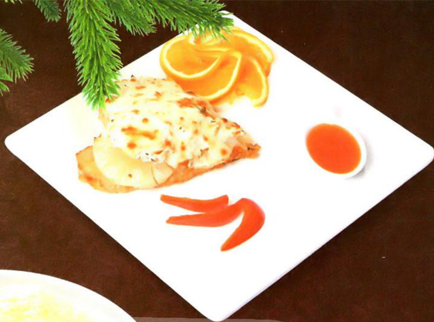
Филе куриное с ананасом Горячее сердце, 100 г