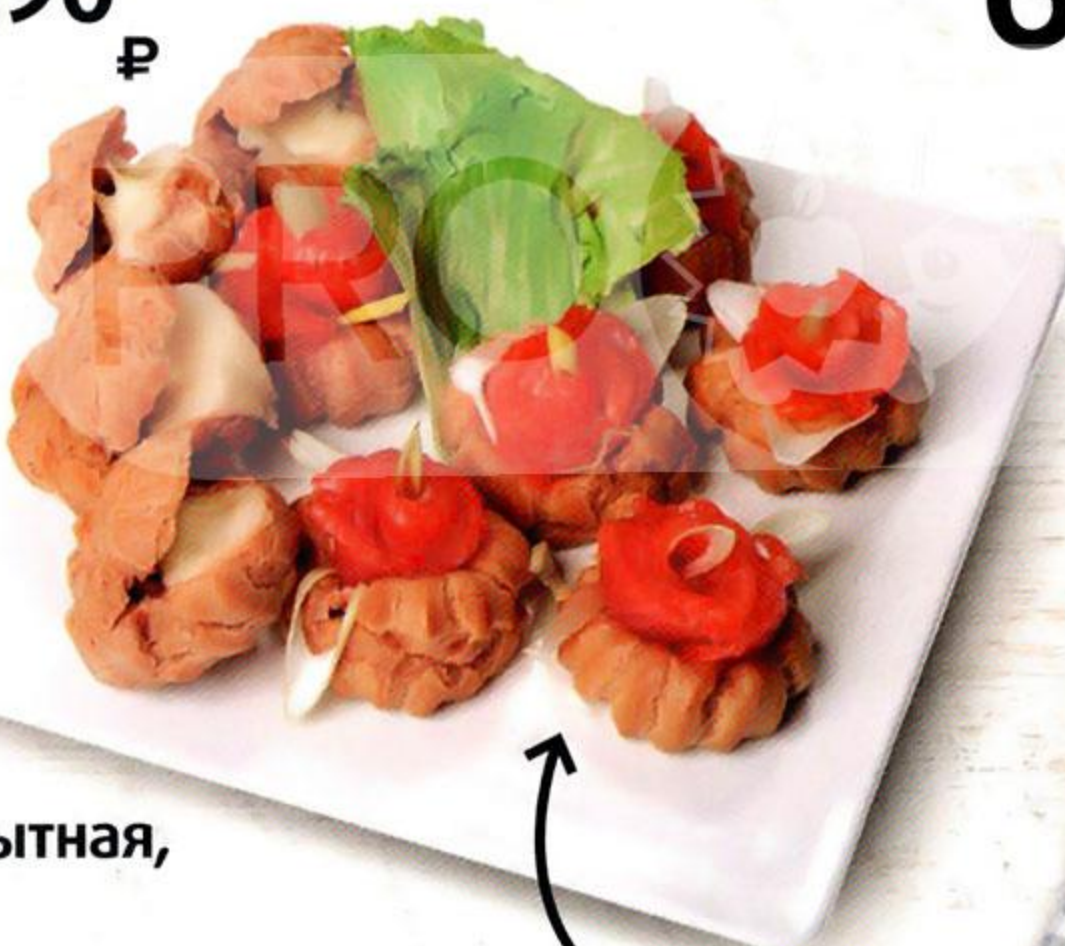
Закуска Сытная, 6 x 40 г