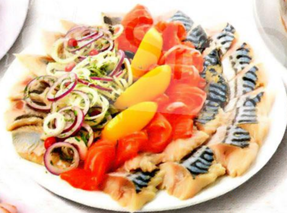
Тарелка рыбная, 250 г