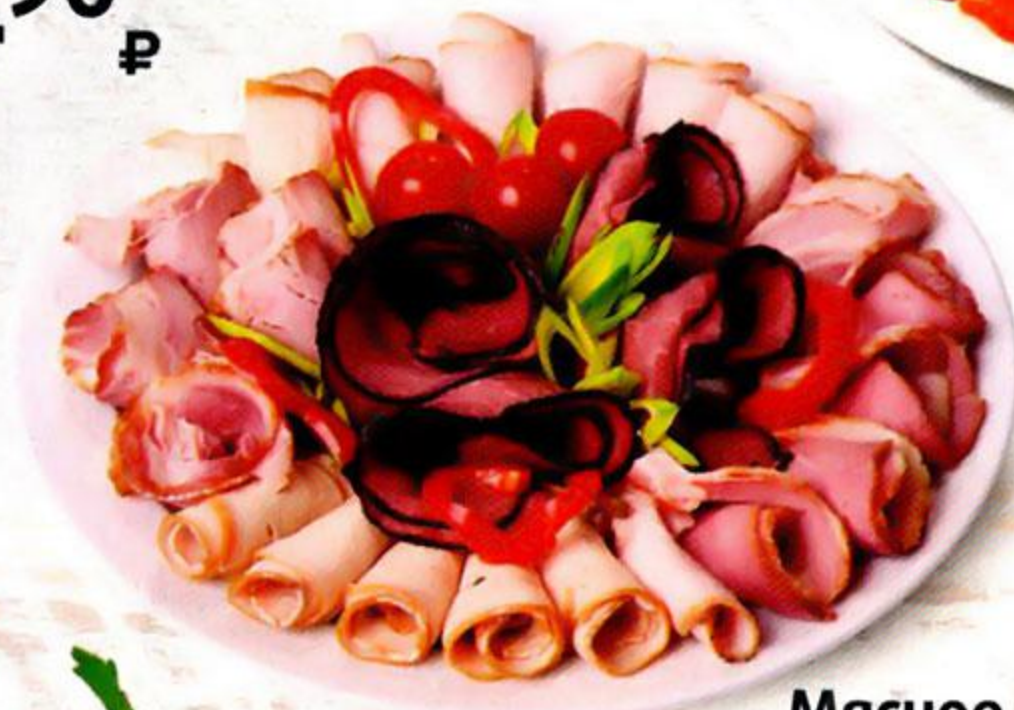
Мясное ассорти, 250 г