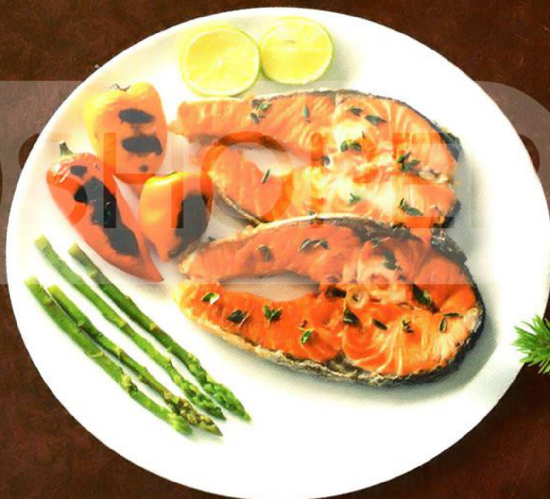
Стейк семги, гриль, 100 г