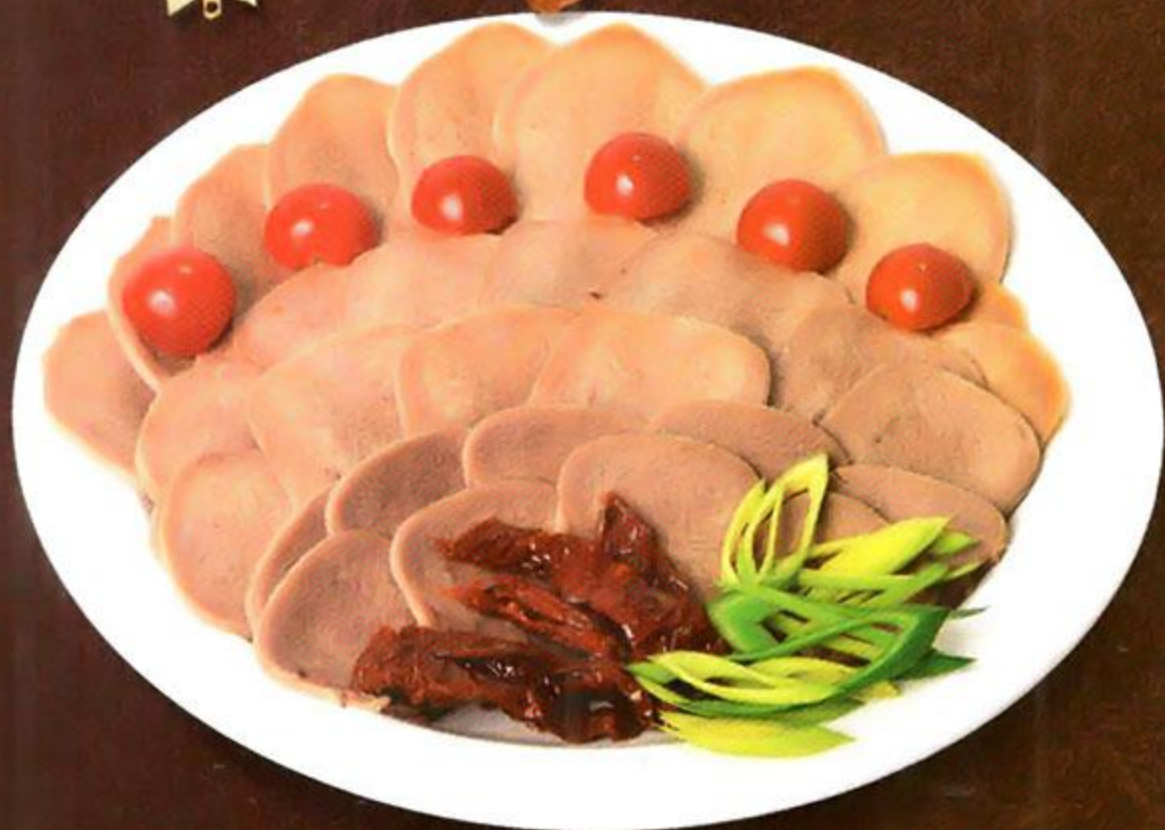
Язык говяжий, отварной, 100 г