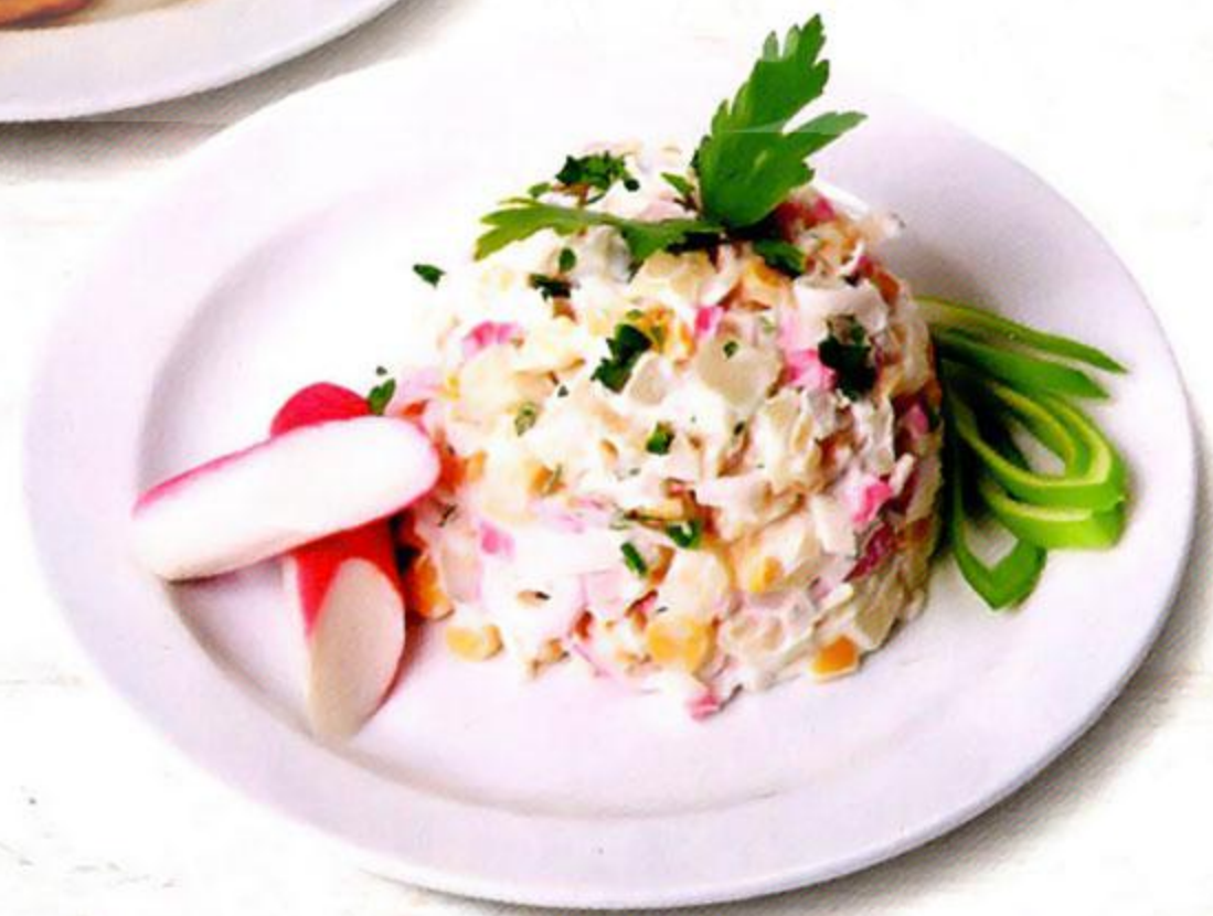
Салат Традиционный, 100 г