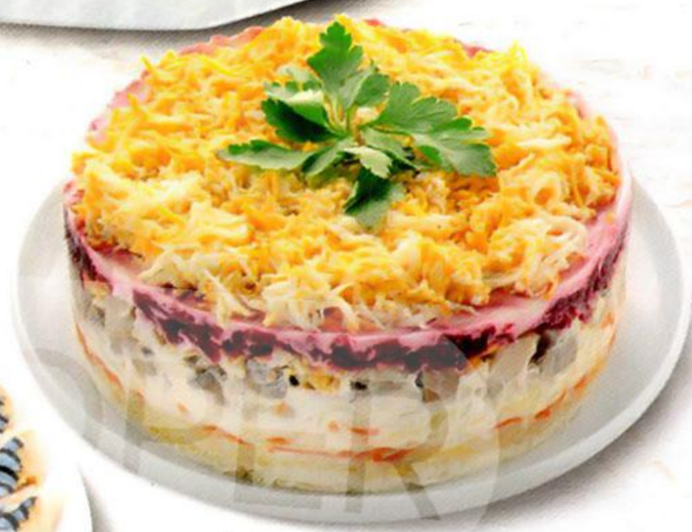
Сельдь под шубой, 100 г