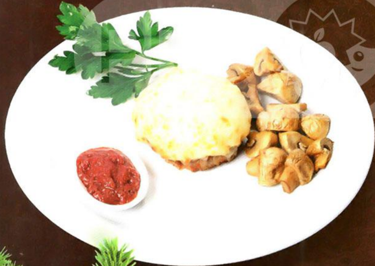
Свинина с грибами, 100 г