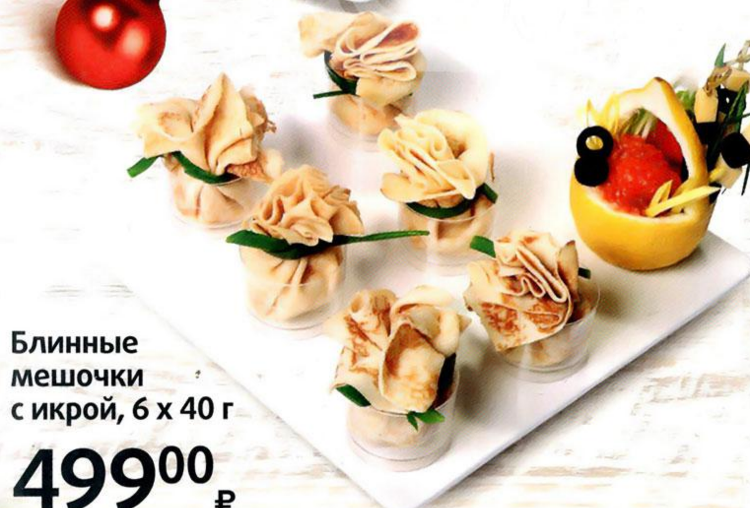
Блинные мешочки с икрой, 6 x 40 г