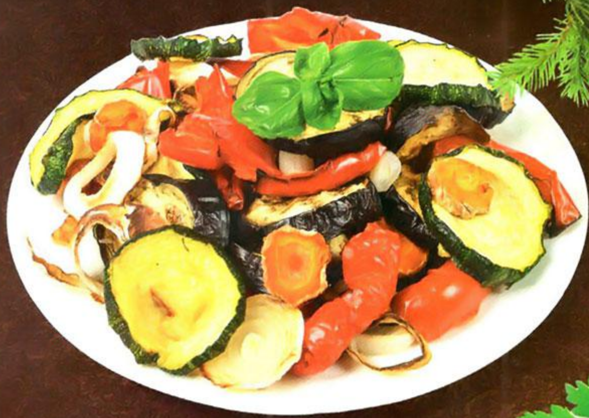
Овощи гриль, 100 г