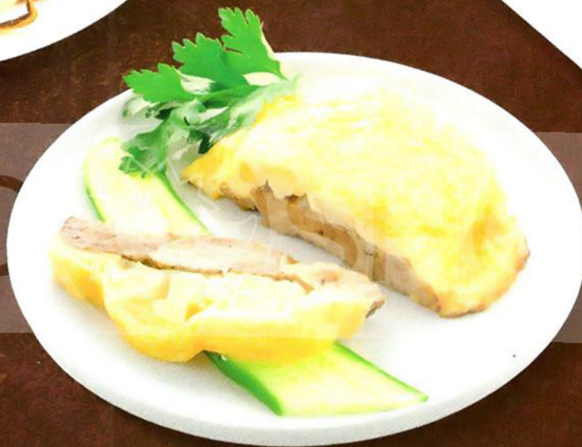
Шейка Зимняя сказка, 100 г