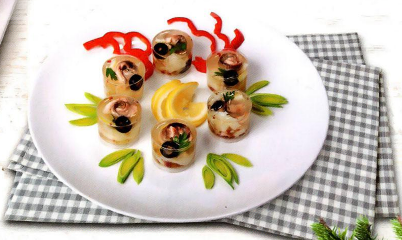
Заливное из рыбы, 6 x 40 г