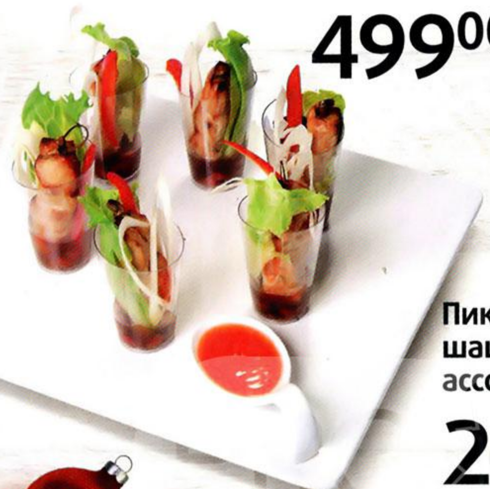
Пикантные шашлычки, ассорти, 6 x 40 г