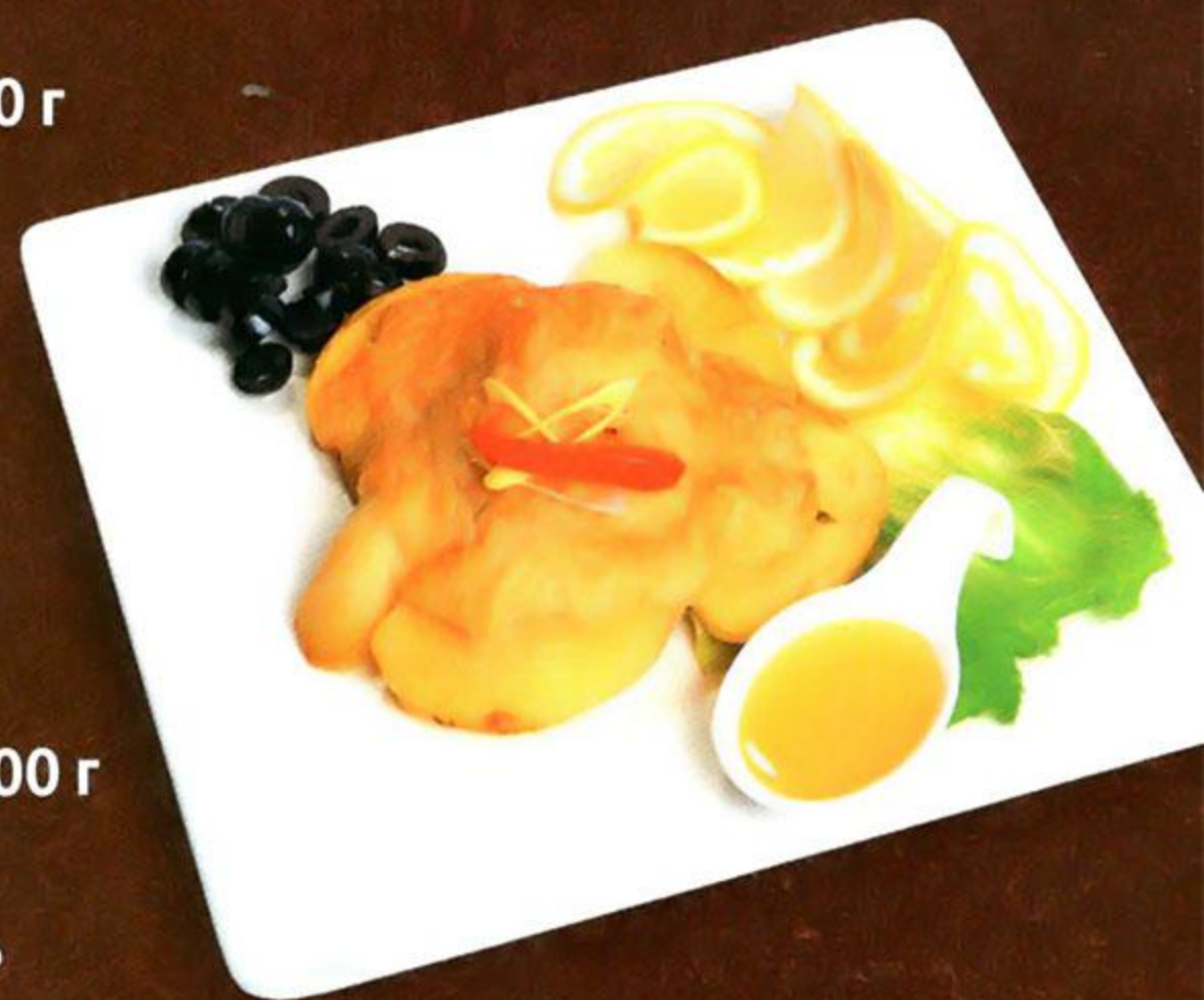
Филе рыбы, запеченное по-русски, 100 г