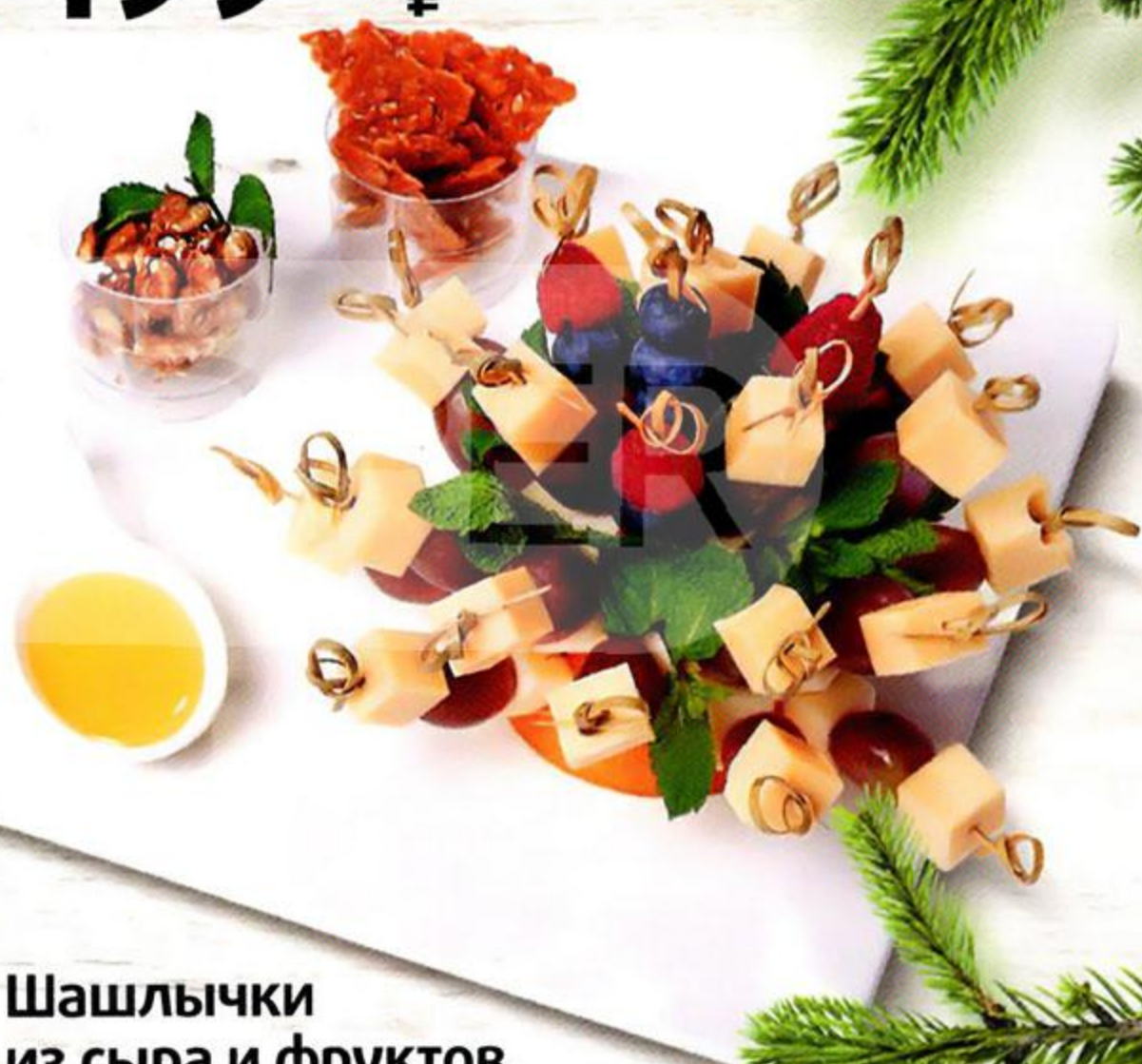
Шашлычки из сыра и фруктов, 6 x 40 г