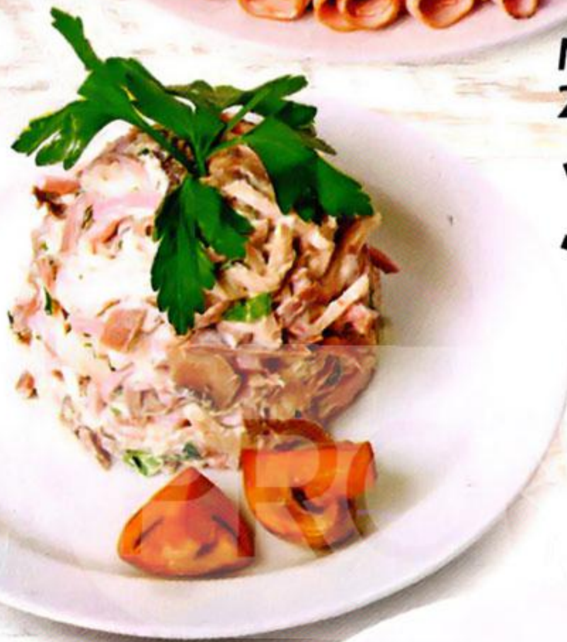
Салат Фаворит, 100 г