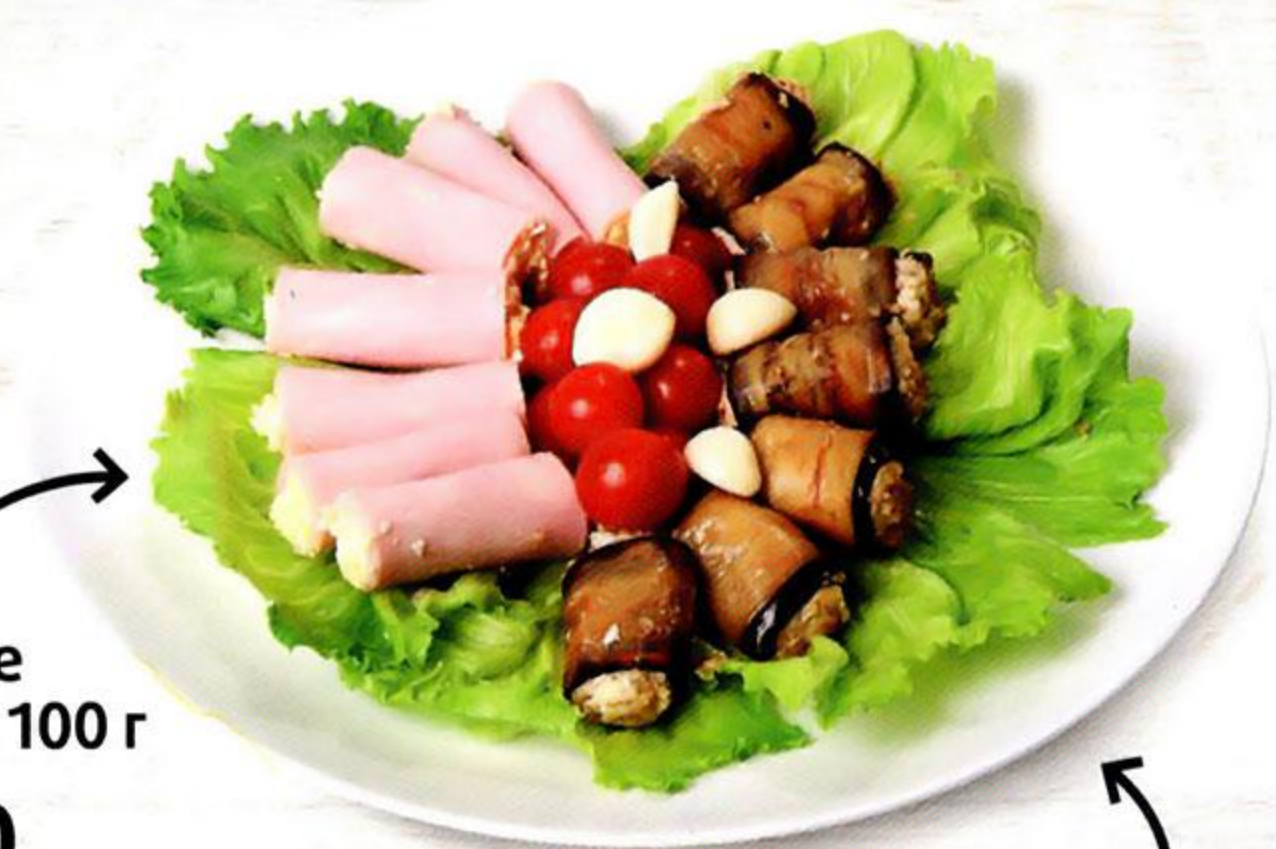
Ветчинные ролетики, 100 г