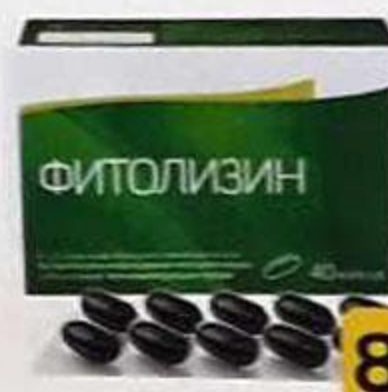
ТАБЛ. 355+120 МГ, №60 ЛП-N(000158)-(PГ-RU)