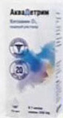
ТАБЛ. П. О. 75 МГ, №100 П N013875/01