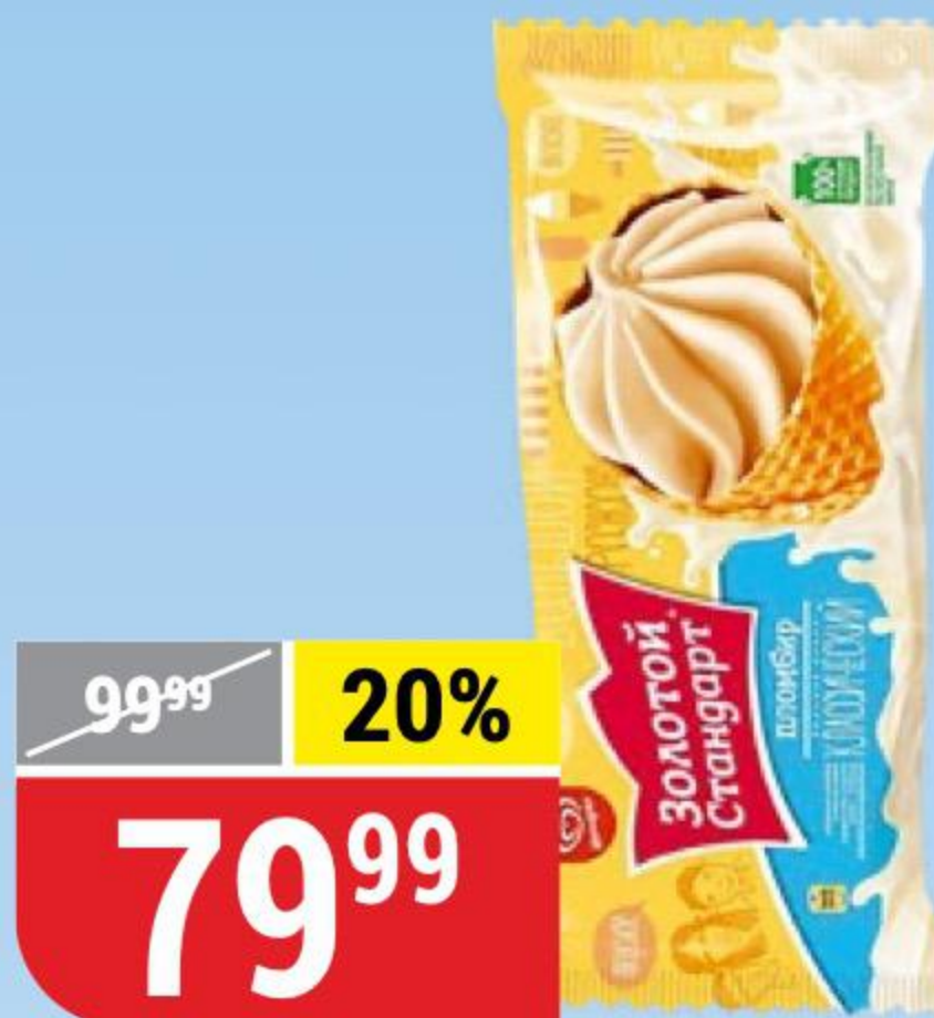
МОРОЖЕНОЕ ЗОЛОТОЙ СТАНДАРТ пломбир, рожок, Инмарко, 100 г 122146