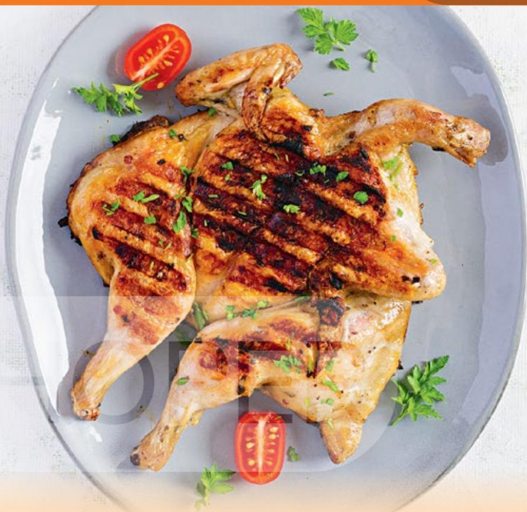
ЦЫПЛЕНОК ТАБАКА в сливочном маринаде, охлажденный, Ситно, 1 кг 5243