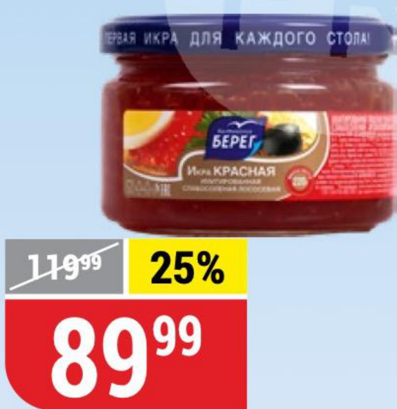
ИКРА КРАСНАЯ имитированная, Балтийский Берег, 220 г 134405