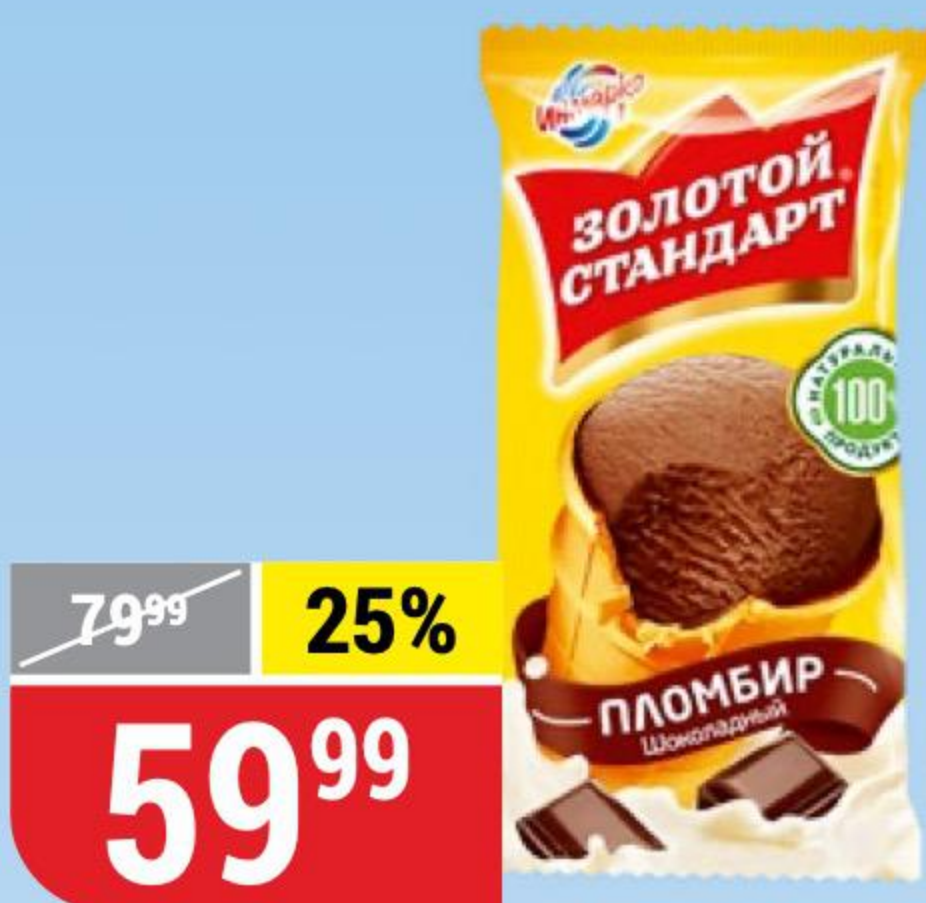
МОРОЖЕНОЕ ЗОЛОТОЙ СТАНДАРТ пломбир шоколадный, в вафельном стаканчике, Инмарко, 86 г 129699