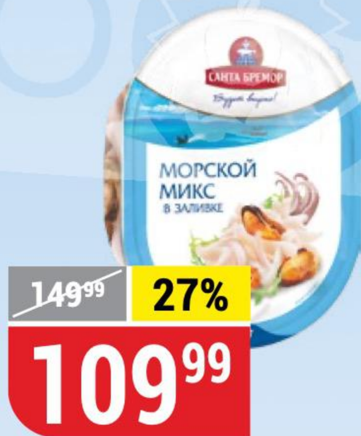
КОКТЕЙЛЬ ИЗ МОРЕПРОДУКТОВ МОРСКОЙ МИКС Санта Бремор, 180 г 147557