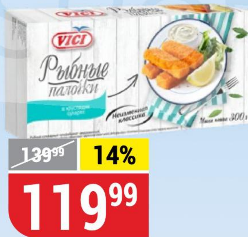
ПАЛОЧКИ РЫБНЫЕ Vici, 300 г 162314