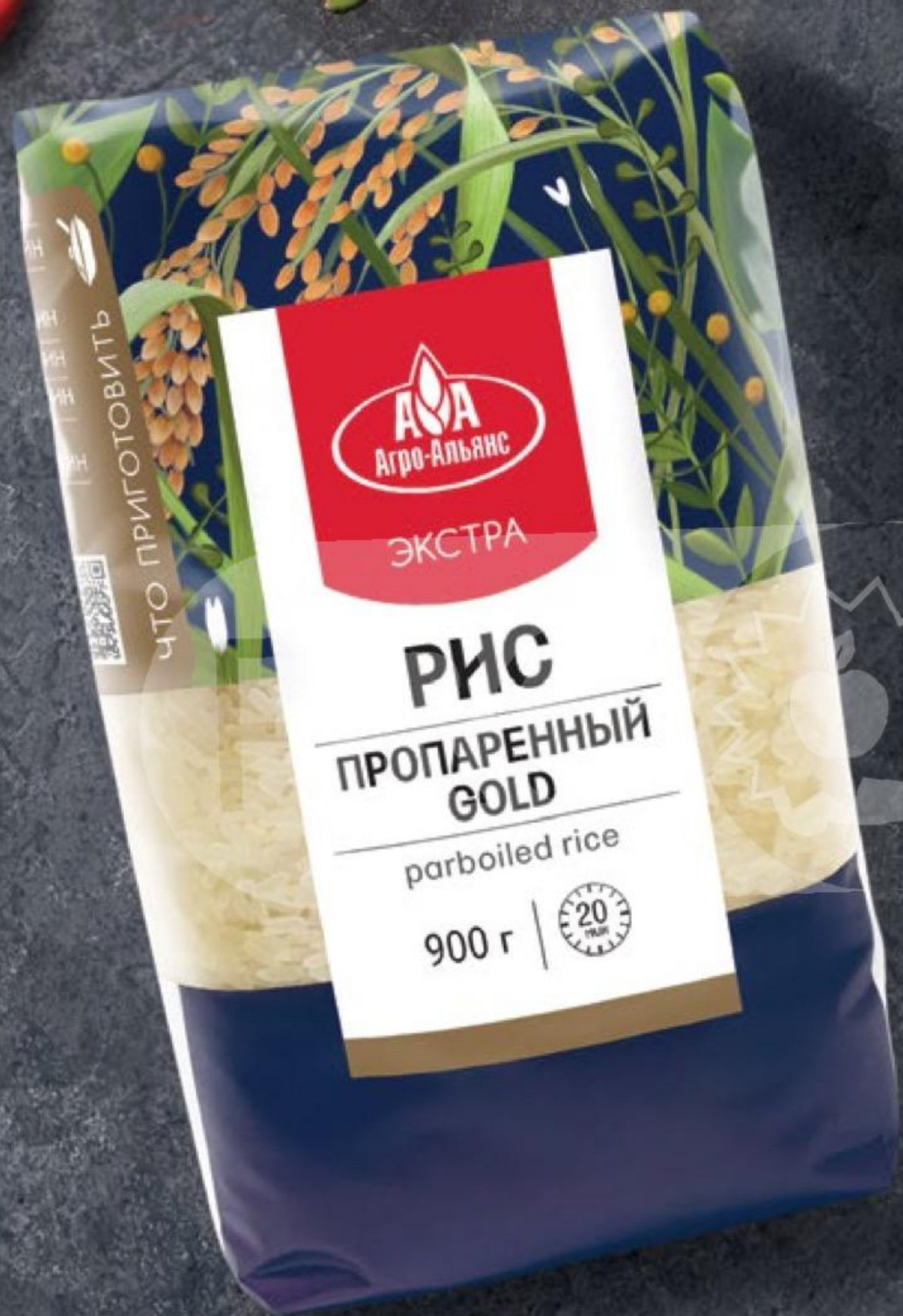
РИС ЭЛИТНЫЙ ПРОПАРЕННЫЙ GOLD Агро-Альянс, 900 г 100524