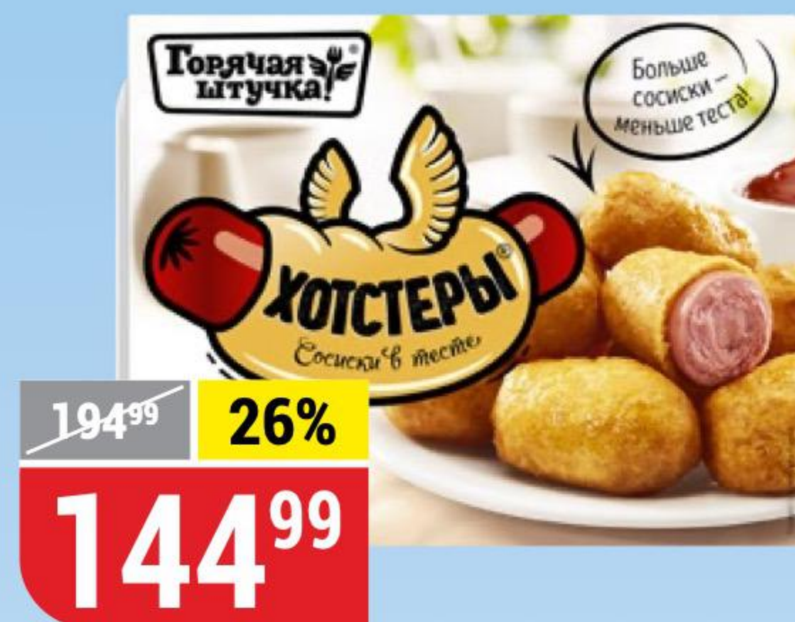
ХОТСТЕРЫ Горячая Штучка, 250 г 131168