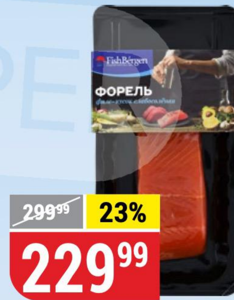
ФОРЕЛЬ слабосоленая, филе-кусок, FishBergen, 150 г 164793