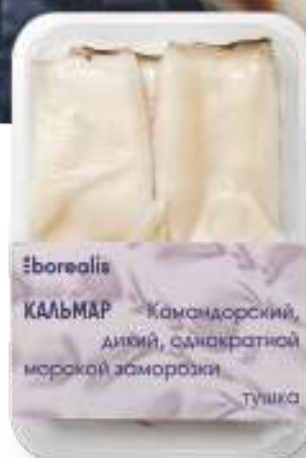
КАЛЬМАР КОМАНДОРСКИЙ ТУШКА БЕЗ КОЖИ 500 Г