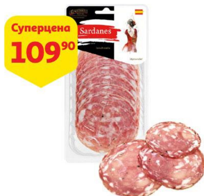
Колбаса ЕГОРЬЕВСКАЯ КГФ Sardanes сырокопченая нарезка, 70 г