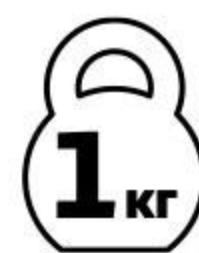
Шейка свиная ЧЕРКИЗОВО в маринаде для запекания охлажденная, 1 кг