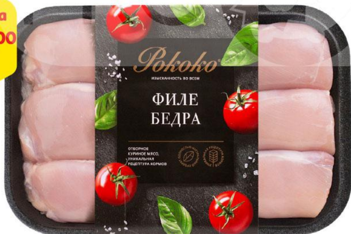
Филе бедра РОКОКО охлажденное, 750 г