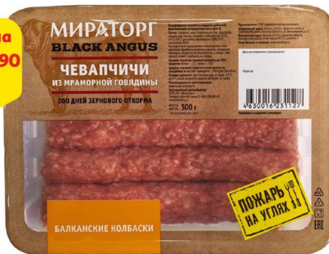
Колбаски МИРАТОРГ Чевапчичи из говядины Black Angus охлажденные, 300 г