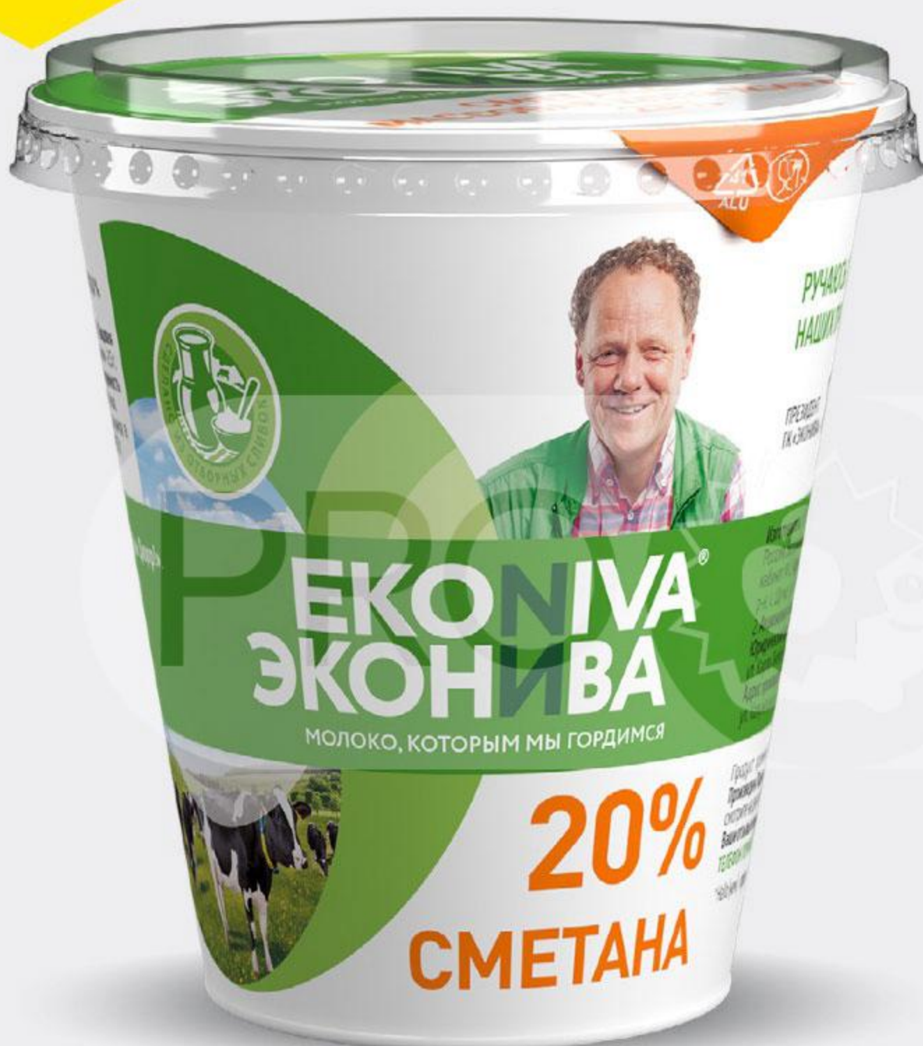
Сметана EKONIVA 20%, 300 г