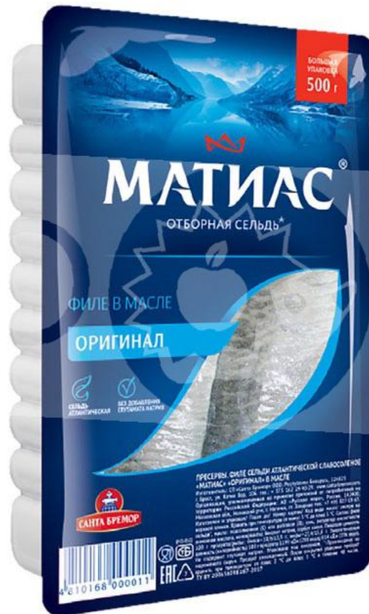
Филе сельди САНТА БРЕМОР Матиас деликатесное, 500 г