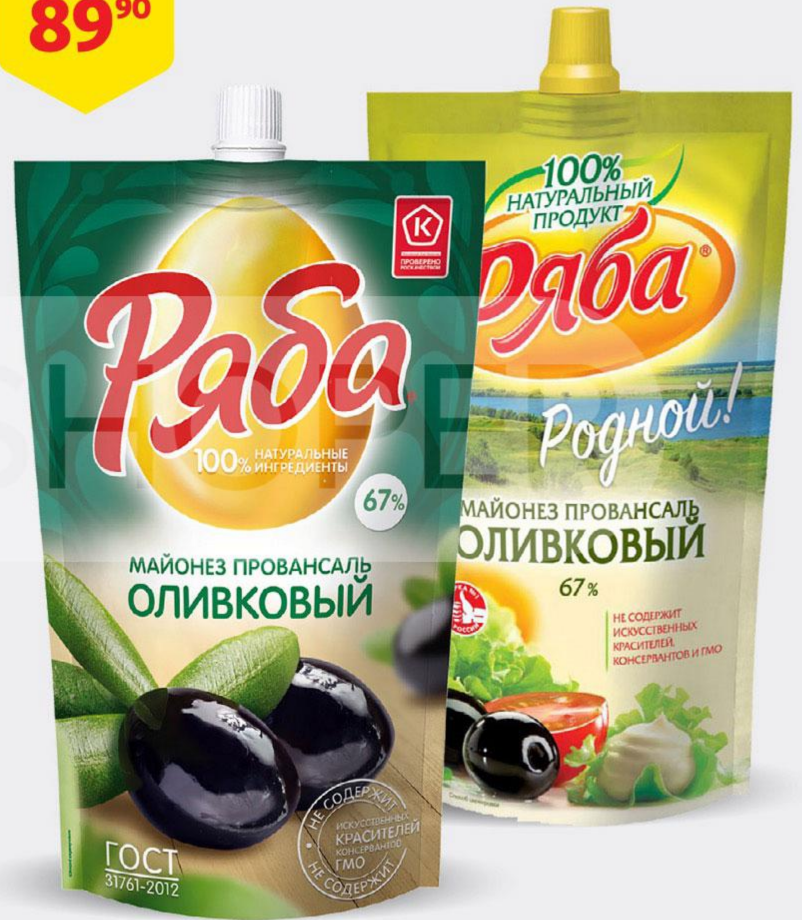
Майонез РЯБА Провансаль оливковый 67%, 372 г