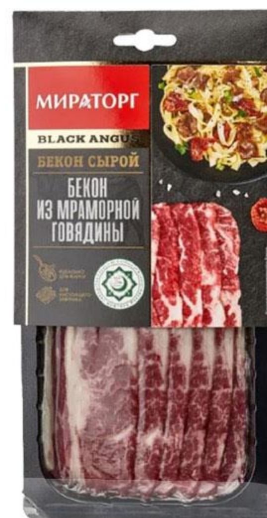
Бекон МИРАТОРГ говяжий мраморный охлажденный, 190 г