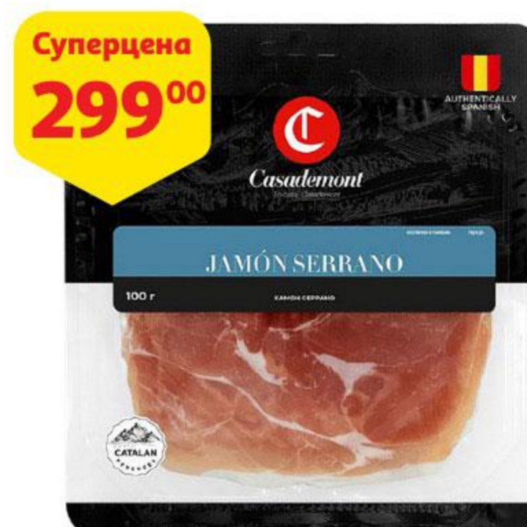
Хамон CASADEMONT Серрано сыровяленый нарезка, 100 г