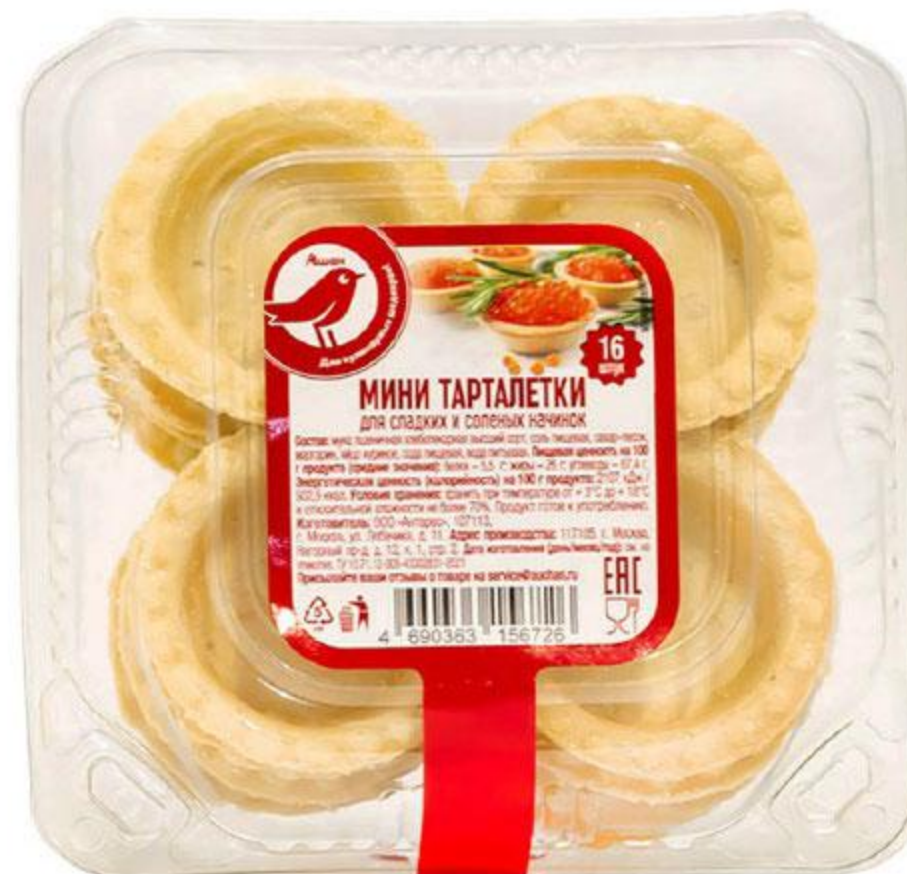
Тарталетки АШАН, 130 г