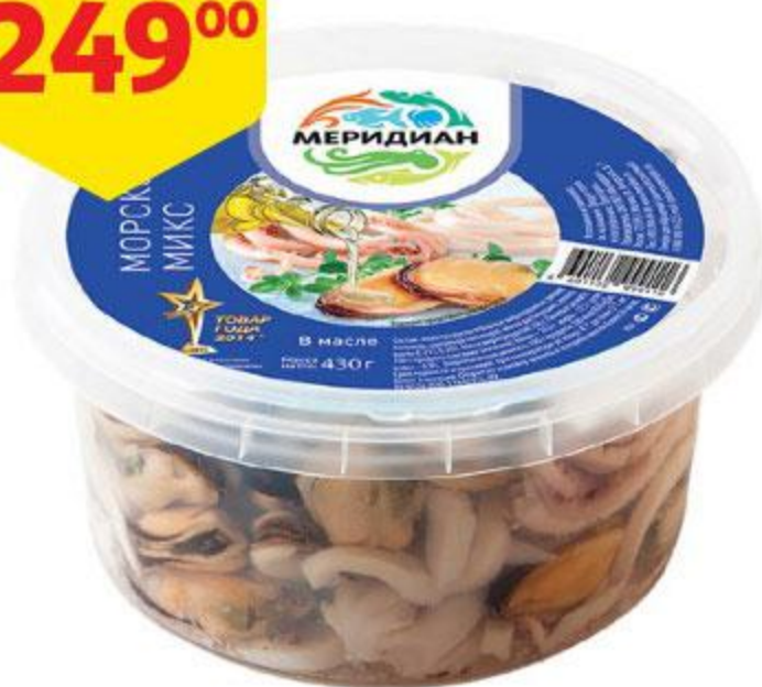
Коктейль из морепродуктов МЕРИДИАН Морской микс в масле, 430 г