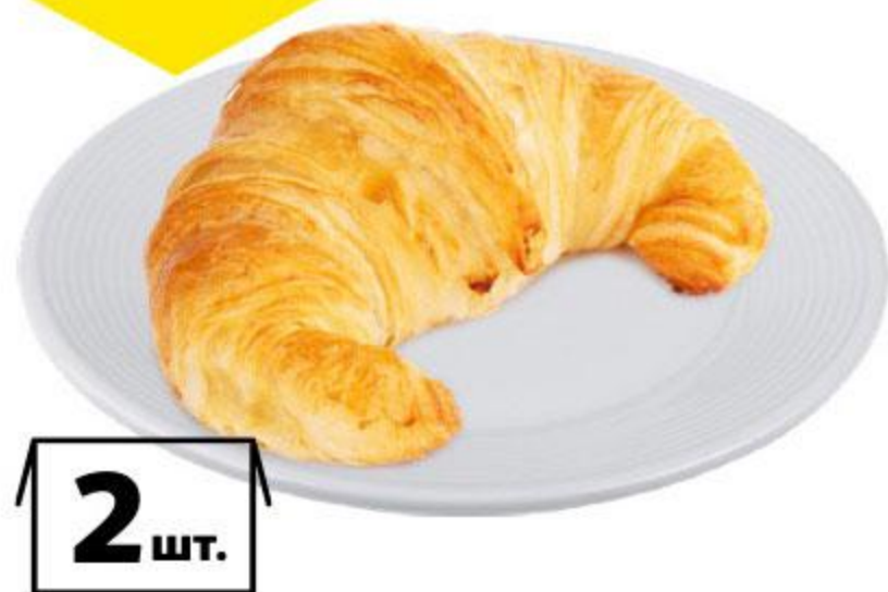
Круассан на сливочном масле, 2 шт.