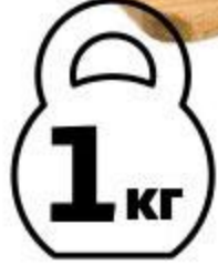
Горбуша горячего копчения тушка, 1 кг