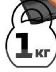
Рыба масляная ОЛИВА кусок холодного копчения, 1 кг