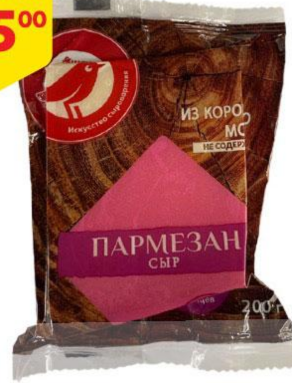
Сыр АШАН Пармезан, 200 г