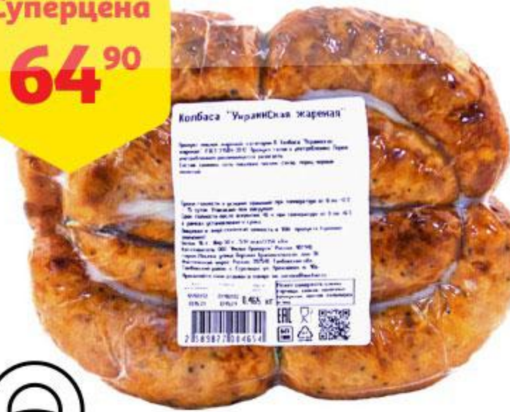
Колбаса АШАН Украинская жареная, 100 г