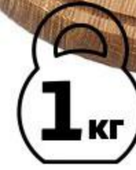
Марлин филе холодного копчения, 1 кг