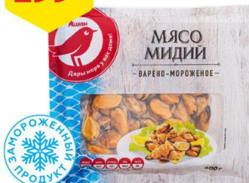
Мясо мидий АШАН варено-мороженое, 400 г