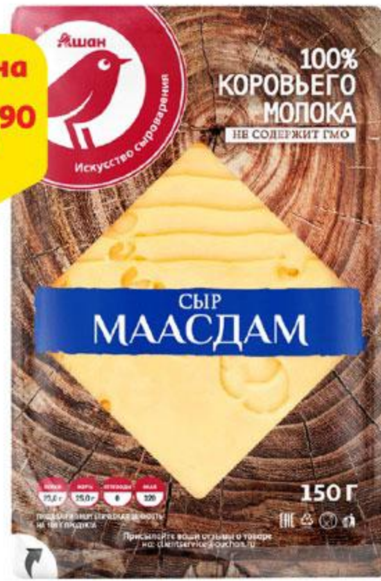
Сыр АШАН Маасдам нарезка 45%, 150 г