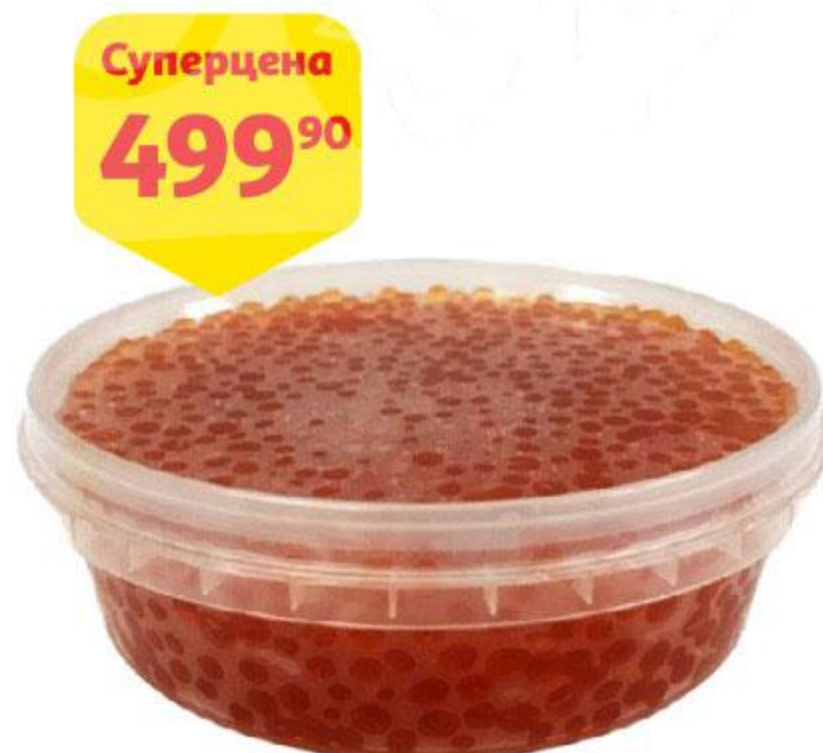
Икра лососевая ТУН горбуши зернистая, 100 г