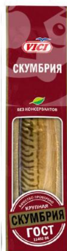
Скумбрия VICI Атлантическая холодного копчения резаная без головы крупная, 480 г