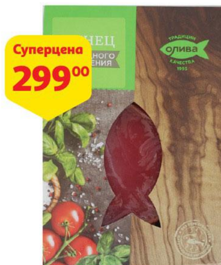
Тунец филе-кусочки холодного копчения, 150 г