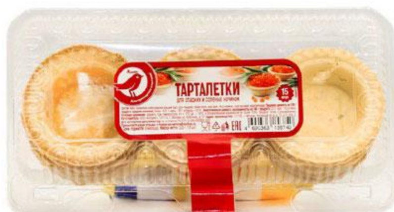
Тарталетки АШАН, 220 г