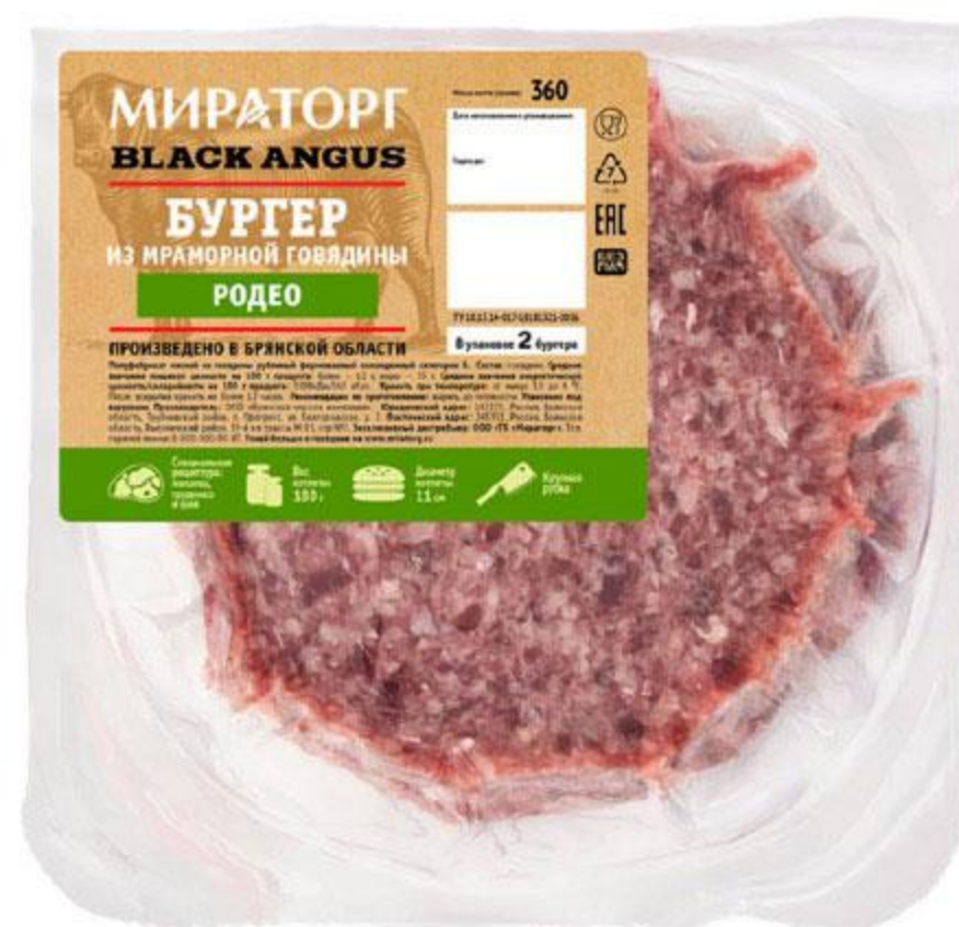
Бургер МИРАТОРГ Родео из мраморной говядины Black Angus охлажденный, 360 г