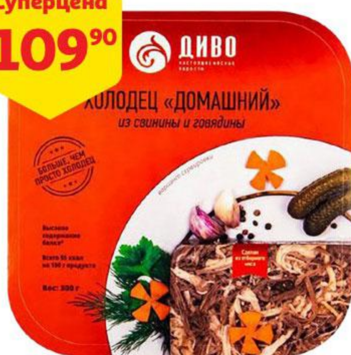
Холодец ДИВО Домашний из свинины и говядины, 300 г