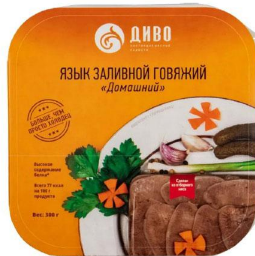
Язык ДИВО заливной говяжий Домашний, 300 г