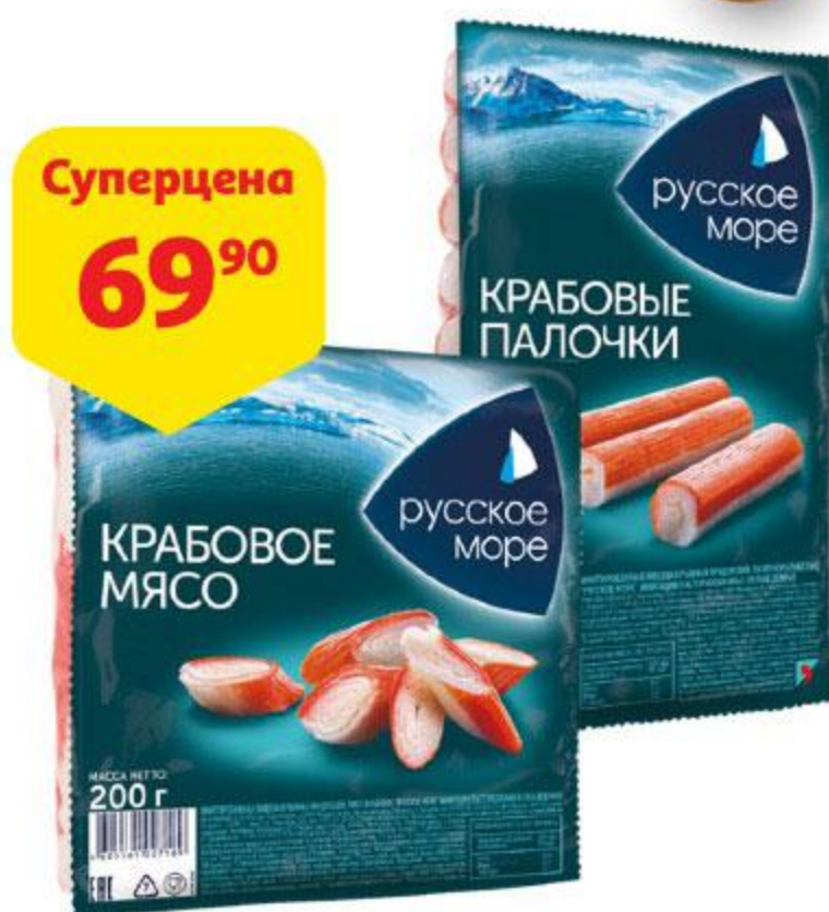
Крабовые палочки / крабовое мясо РУССКОЕ МОРЕ охлажденные, 200 г