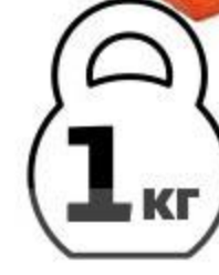
Кижуч холодного копчения спинка, 1 кг