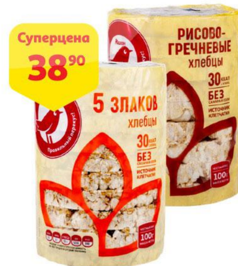
Хлебцы АШАН 5 злаков / рисово-гречневые, 100 г