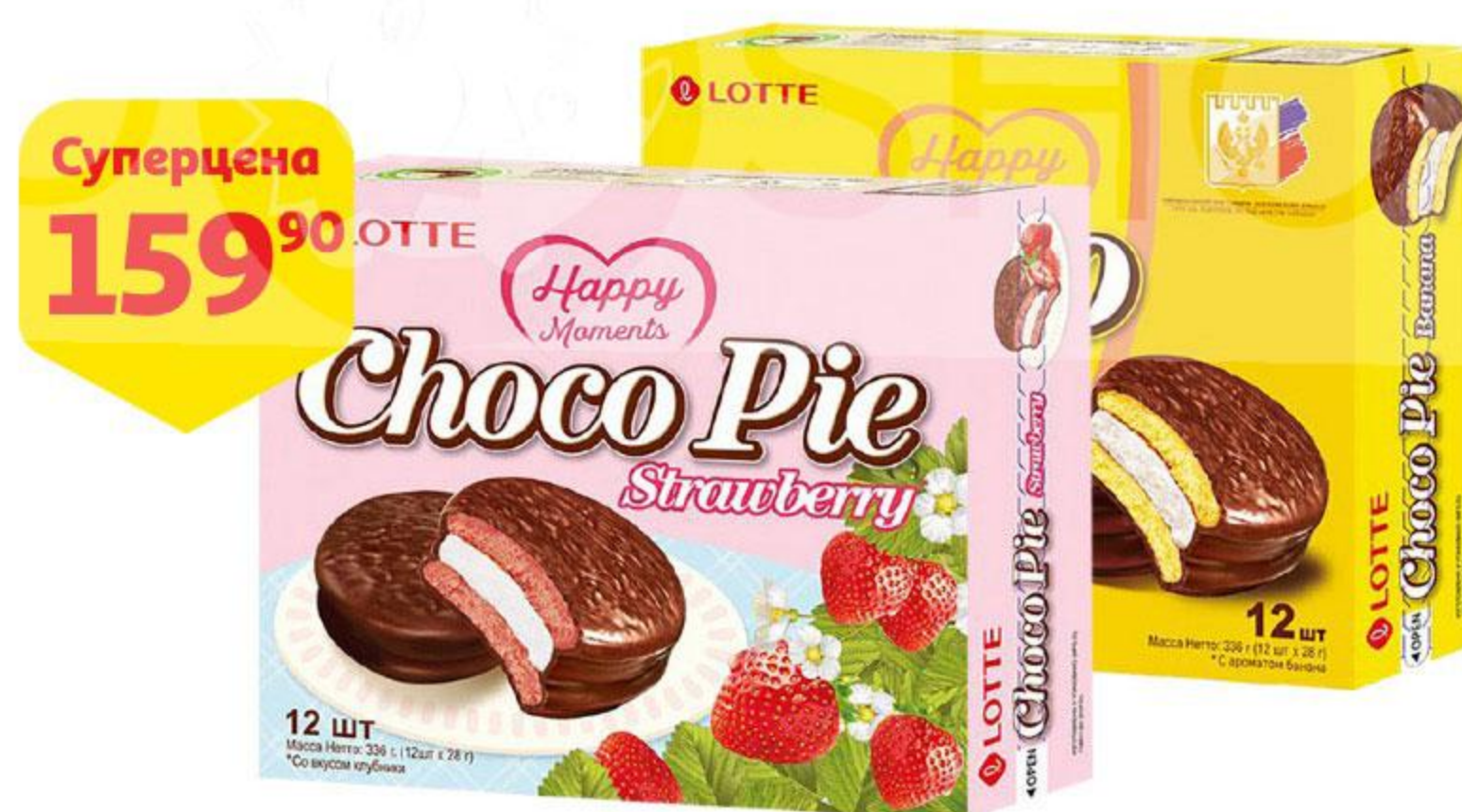
Печенье LOTTE Choco Pie Strawberry бисквитное со вкусом клубники / прослоенное глазированное со вкусом банана, 336 г