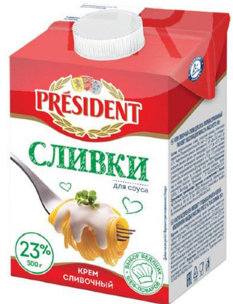
Сливки PRESIDENT ультрапастеризованные 23%, 500 мл