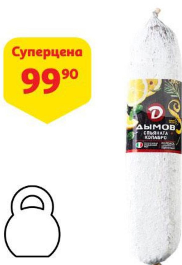
Колбаса ДЫМОВ Сяляма Спяната Колабро сыровяленая, 100 г