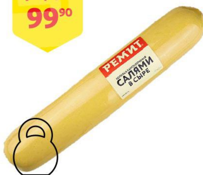
Колбаса РЕМИТ Салами в сыре сырокопченая, 100 г