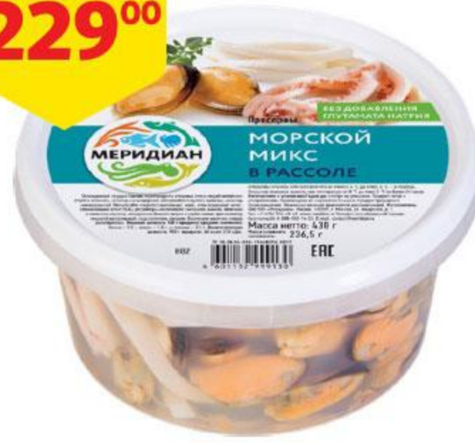
Коктейль из морепродуктов МЕРИДИАН Морской микс в рассоле, 430 г