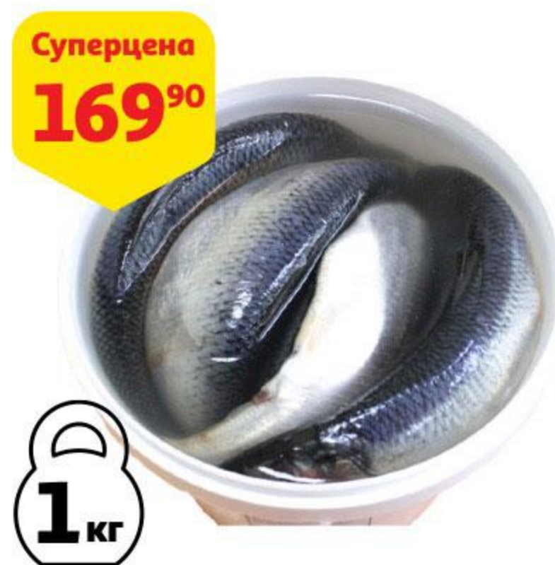
Сельдь ОЛИВА Тихоокеанская слабосоленая с головой, 1 кг