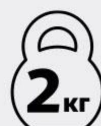
Мука МАКФА пшеничная высший сорт, 2 кг