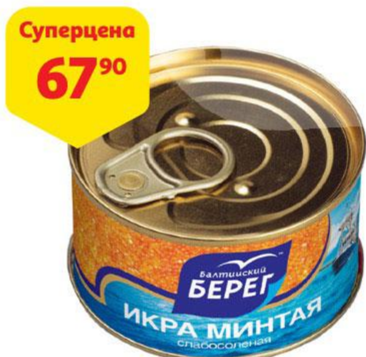
Икра минтая БАЛТИЙСКИЙ БЕРЕГ слабосоленая, 130 г