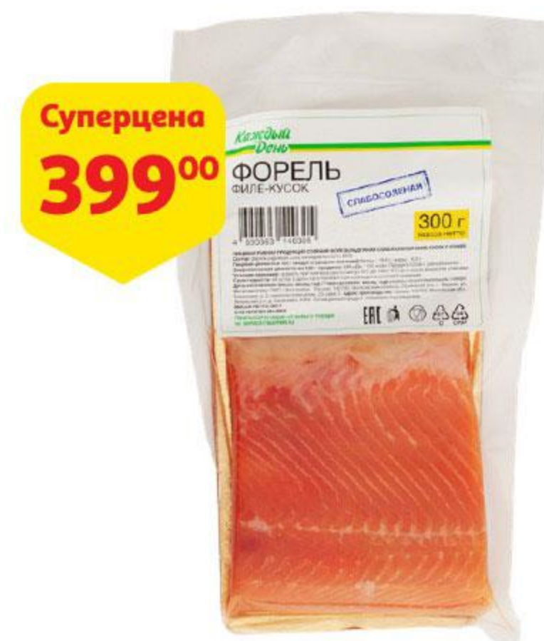
Форель КАЖДЫЙ ДЕНЬ филе-кусочек слабой соли, 300 г