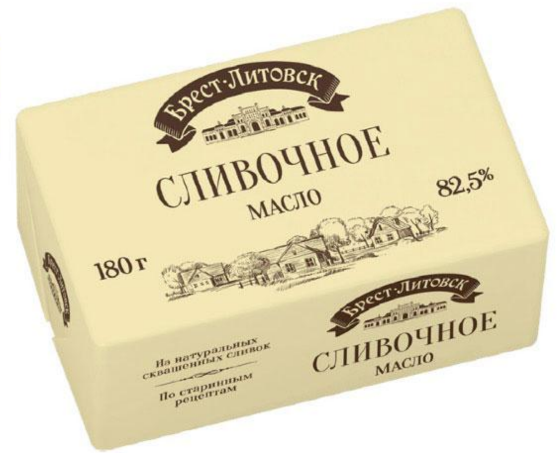
Масло сладкосливочное БРЕСТ-ЛИТОВСК несоленое 82,5%, 180 г