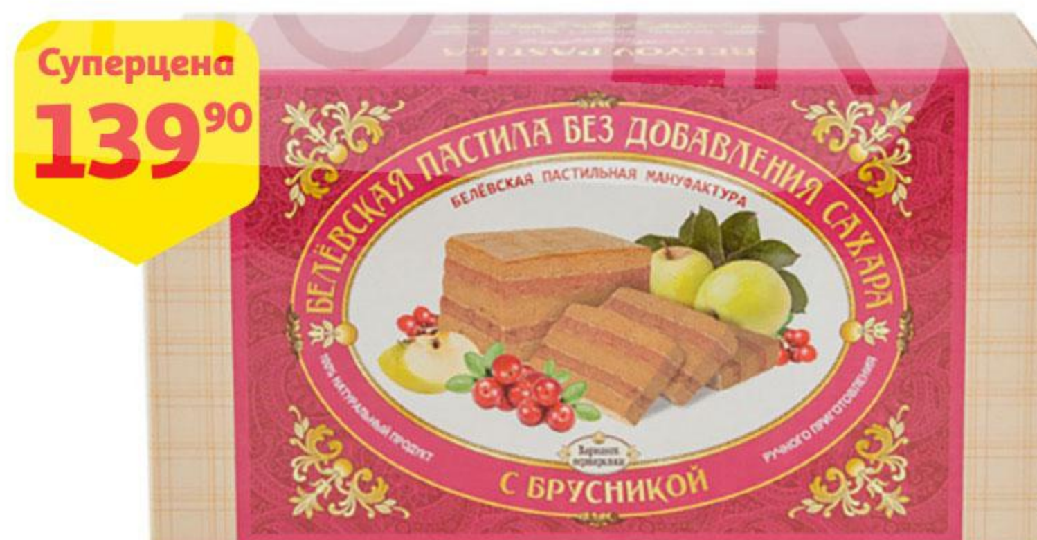
Пастила БЕЛЕВСКАЯ ПАСТИЛЬНАЯ МАНУФАКТУРА классическая / с брусникой, 200 г