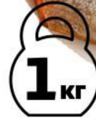
Форель АШАН балык холодного копчения, 1 кг