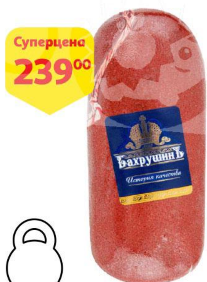
Бастурма БАХРУШИНЪ, 100 г