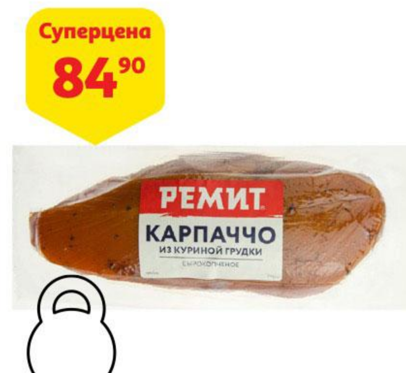
Карпаччо РЕМИТ из куриной грудки сырокопченое, 100 г