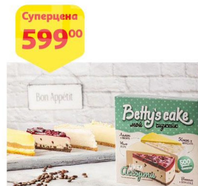
Пирог сырный BETTY'S CAKE Чизкейк Ассорти мини, 500 г

* Ассортимент товара, участвующего в акции, уточняйте в магазинах АШАН, на территории которых проводится данная акция.