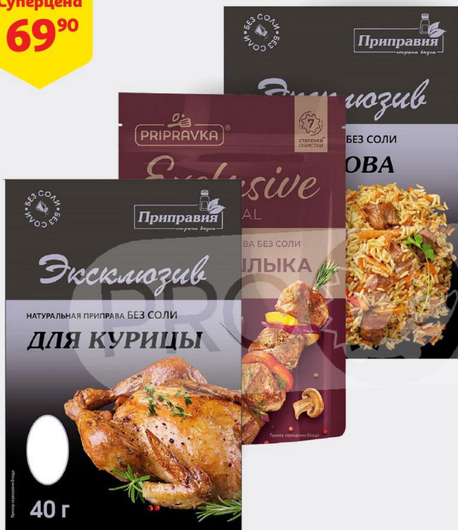
Приправа PRIPRAVKA Exclusive Professional натуральная без соли, 40-45 г, в ассортименте*