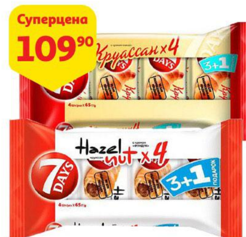
Круассаны 7DAYS, 260-265 г, в ассортименте*