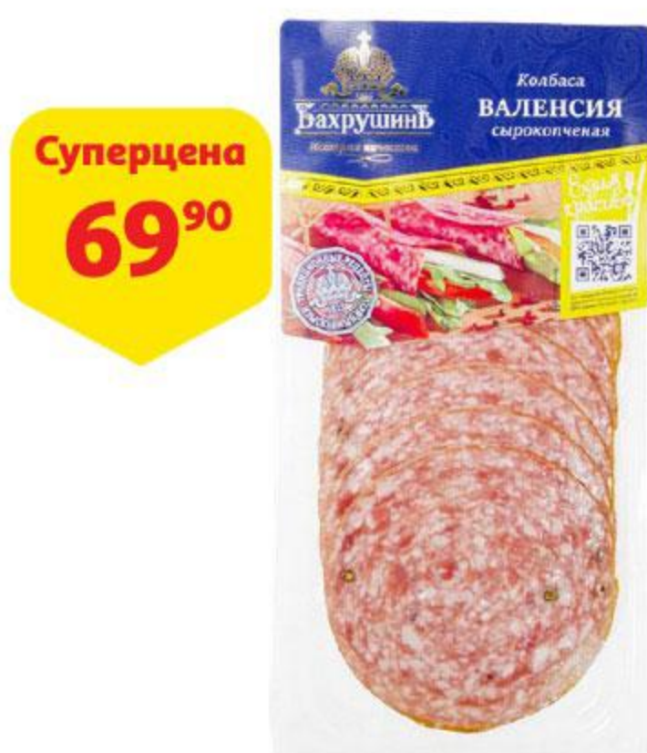
Колбаса БАХРУШИНЪ Валенсия сырокопченая нарезка, 70 г