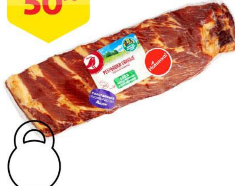
Ребрышки свиные АШАН копчено-вареные, 100 г