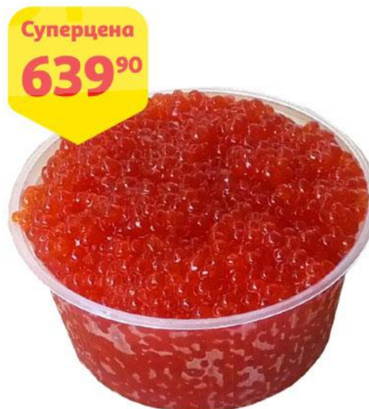
Икра нерки, 100 г