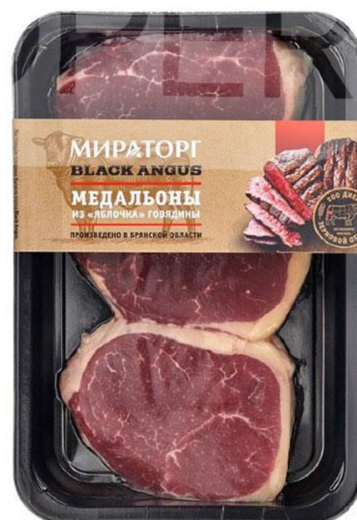
Медальоны МИРАТОРГ говяжьи из яблочка охлажденные, 490 г