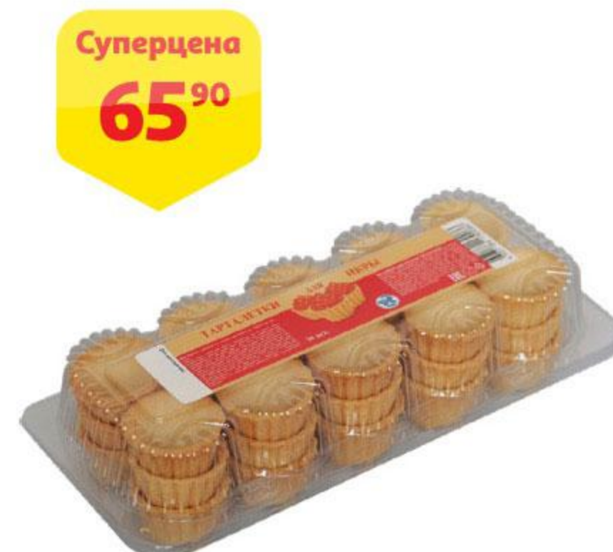
Тарталетки для икры КИТ, 30 шт., 180 г