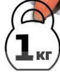
Горбуша холодного копчения спинка, 1 кг