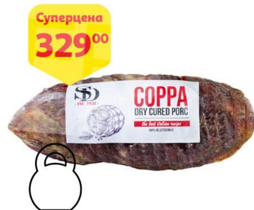
Деликатес из свинины СЫТНЫЙ ДОМ Coppa сыровяленый, 100 г