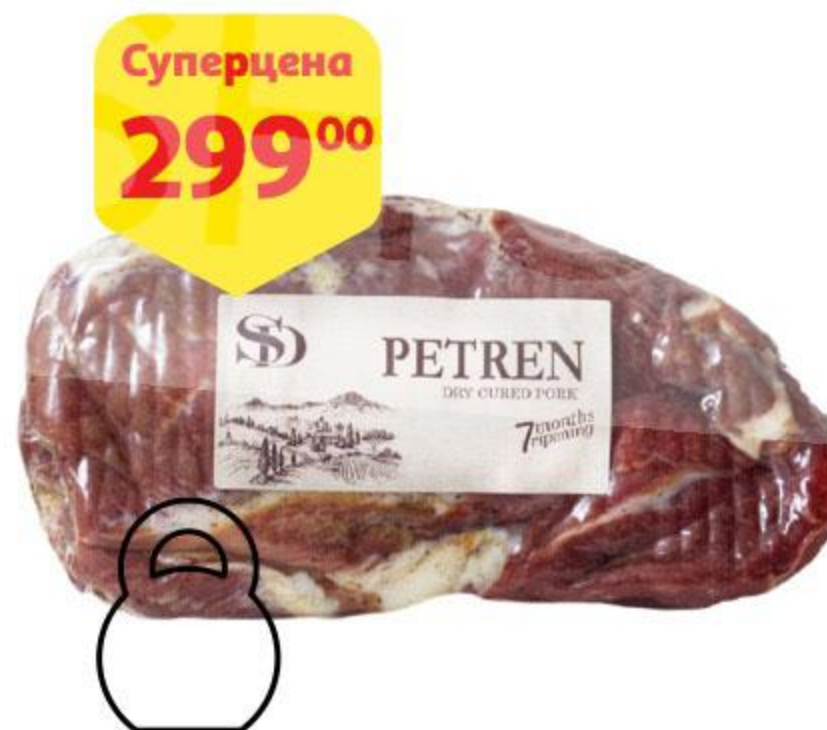
Деликатес из свинины СЫТНЫЙ ДОМ Petren сыровяленый, 100 г