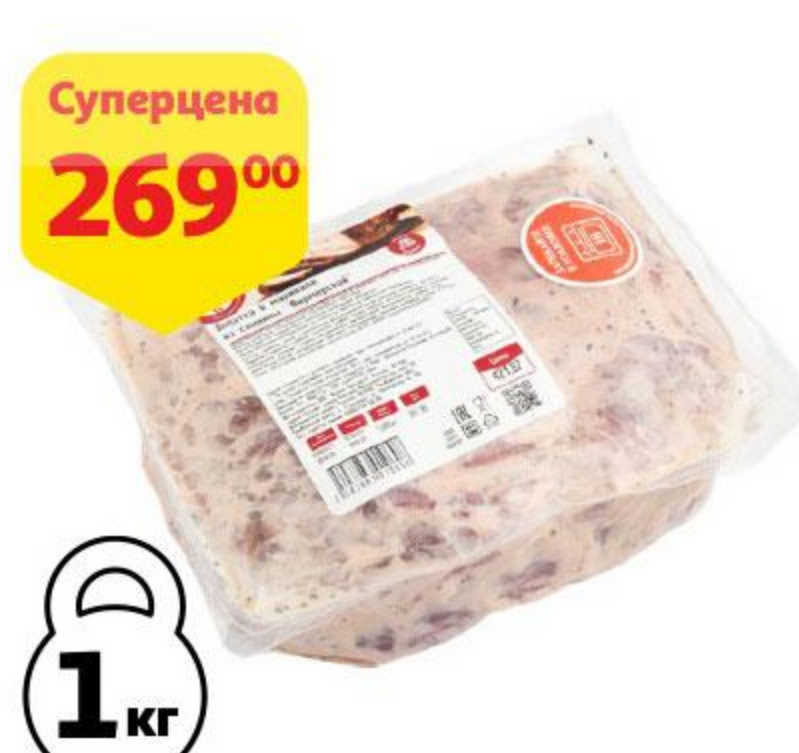
Лопатка АШАН в маринаде из свинины Фермерской охлажденная, 1 кг