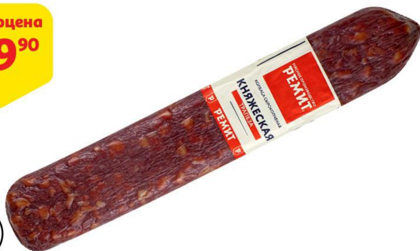
Колбаса РЕМИТ Княжеская Трапеза сырокопченая, 100 г