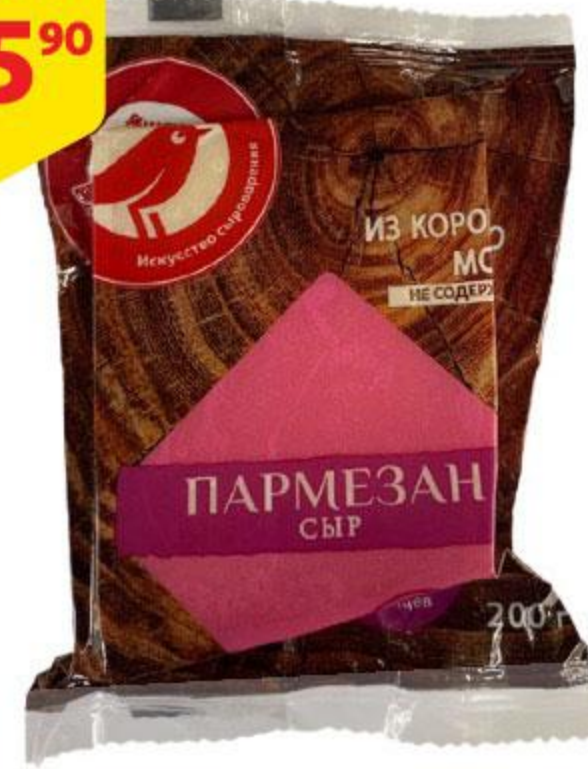
Сыр АШАН Пармезан, 200 г