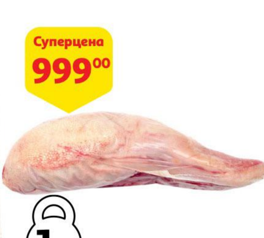
Язык говяжий ЭКОЛЬ Халяль охлажденный, 1 кг