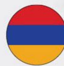
Вино ХОРОВАЦ красное / белое сухое, 0,75 л Армения