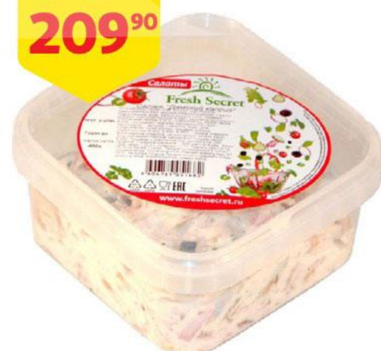
Салат FRESHSECRET Дамский каприз, 400 г