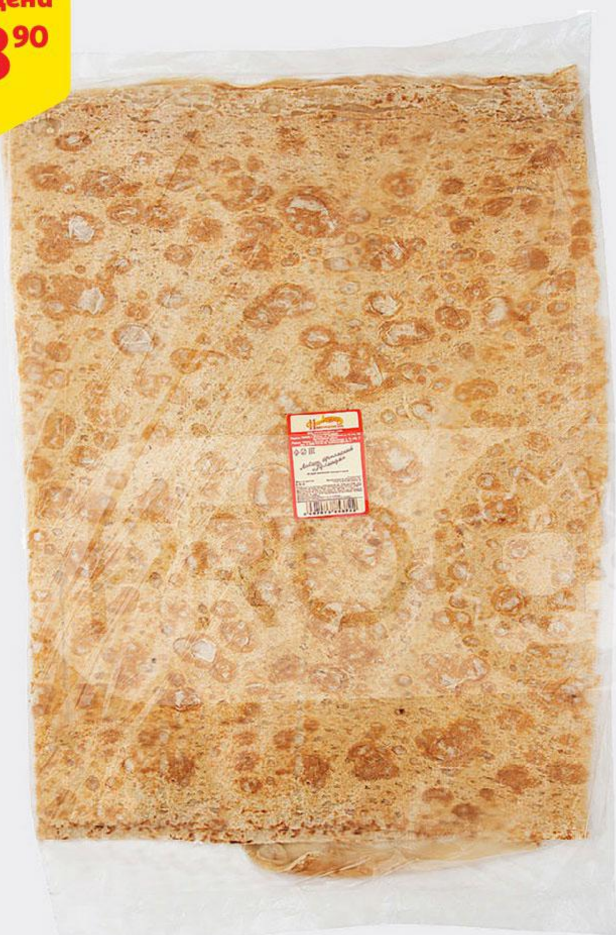
Лаваш НИЖЕГОРОДСКИЙ ХЛЕБ Армянский премиум, 360 г