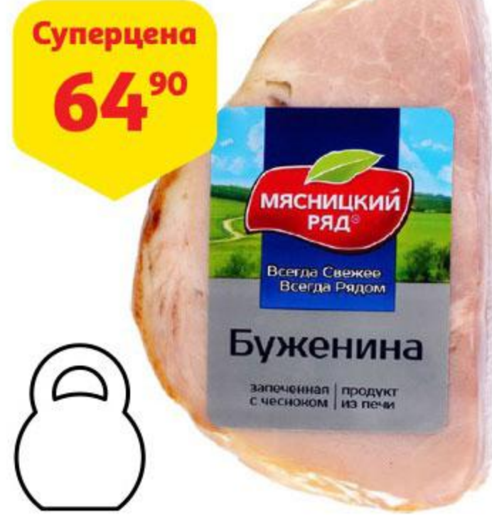
Суперцена 64 90 Буженина МЯСНИЦКИЙ РЯД запеченная варено-копченая, 100 г