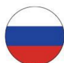
Коньяк ШУСТОФФ Эсте 40%, 0,5 л Россия