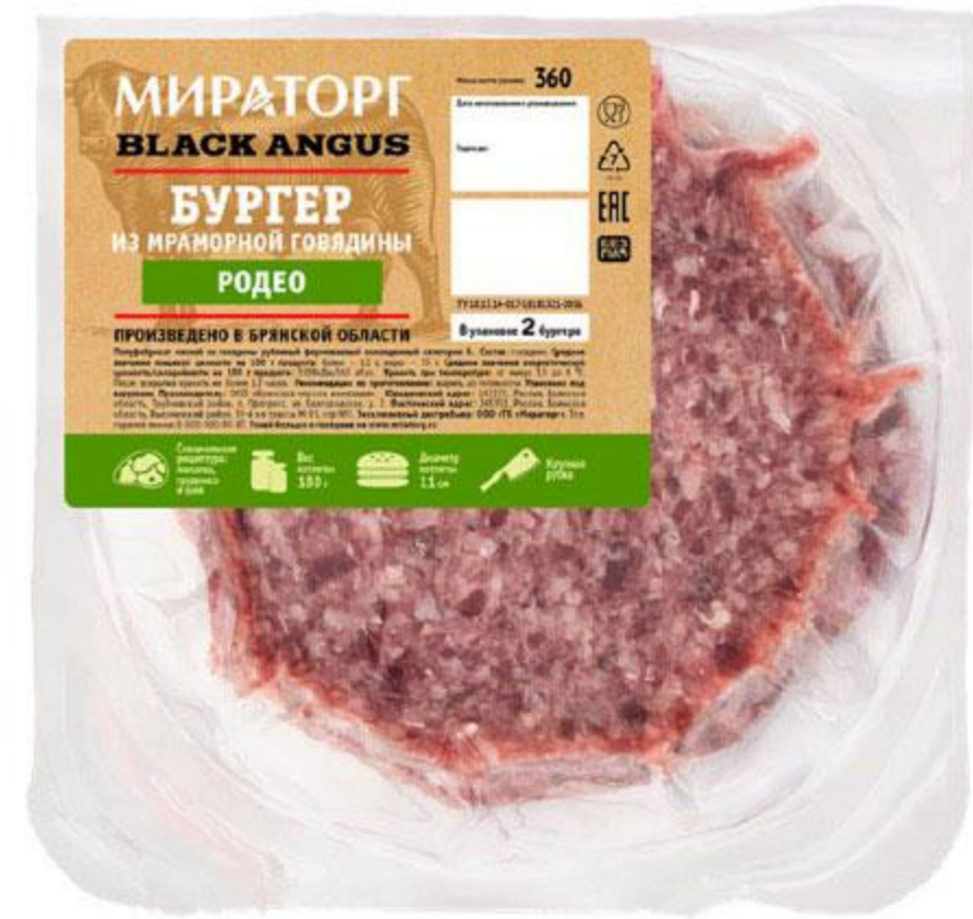
Бургер МИРАТОРГ Родео из мраморной говядины Black Angus охлажденный, 360 г