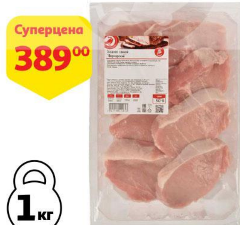
Эскалоп свиной АШАН Фермерский охлажденный, 1 кг