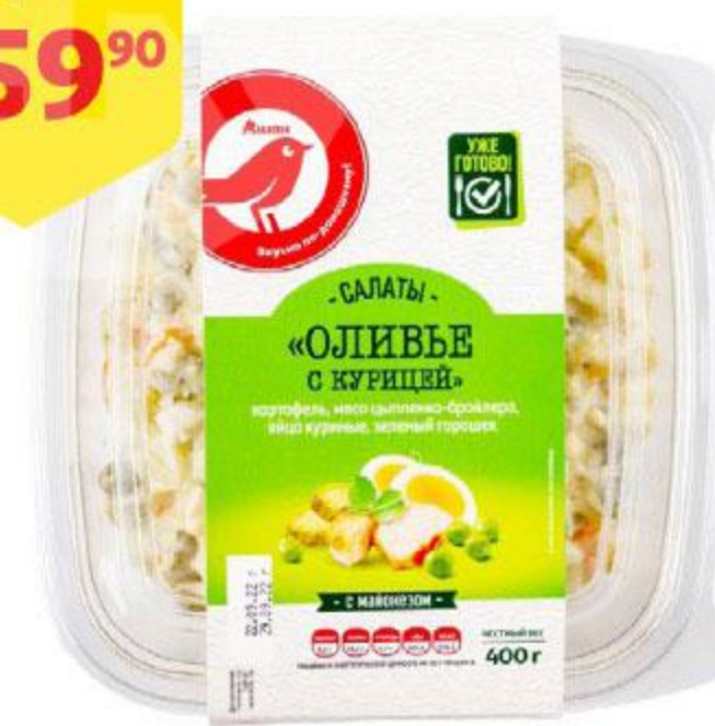
Салат АШАН Оливье с курицей, 400 г