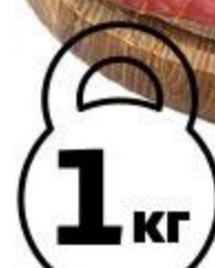
Тунец филе холодного копчения, 1 кг