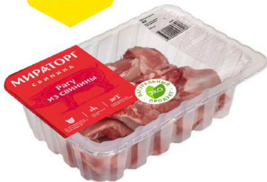
Ранг МИРАТОРГ охлажденное, 400 г