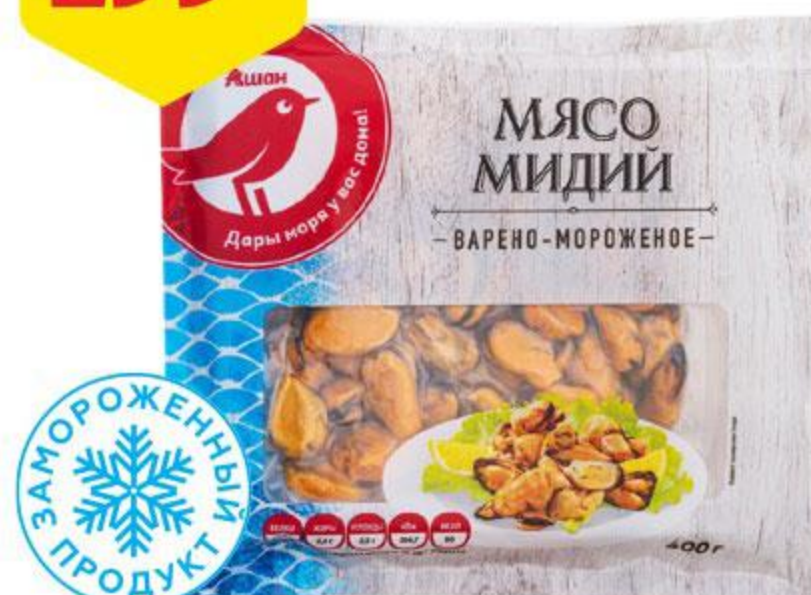
Мясо мидий АШАН варено-мороженое, 400 г