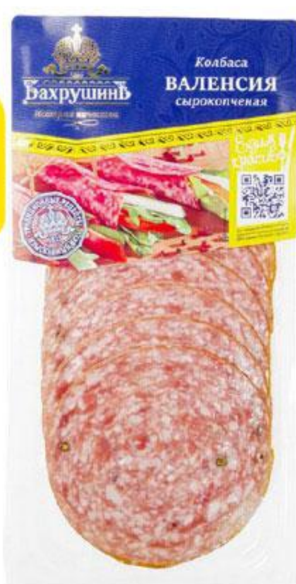
Колбаса БАХРУШИНЬ Валенсия сырокопченая нарезка, 70 г