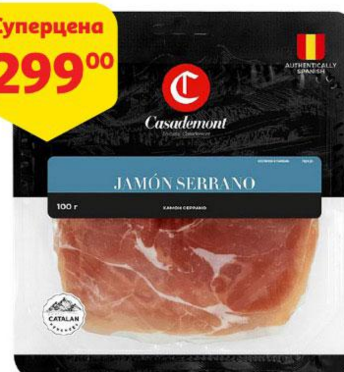
Хамон CASADEMONT Серрано сыровяленый нарезка, 100 г