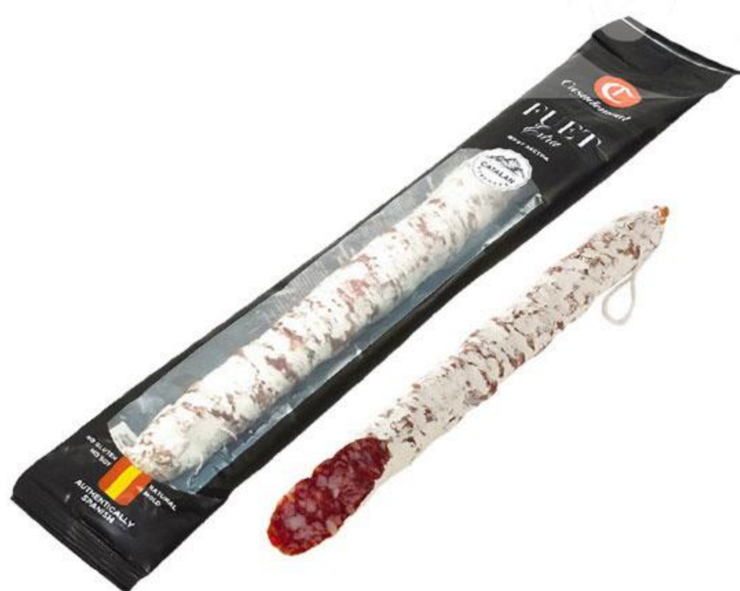
Колбаса CASADEMONT Фуэт Экстра сыровяленая, 150 г