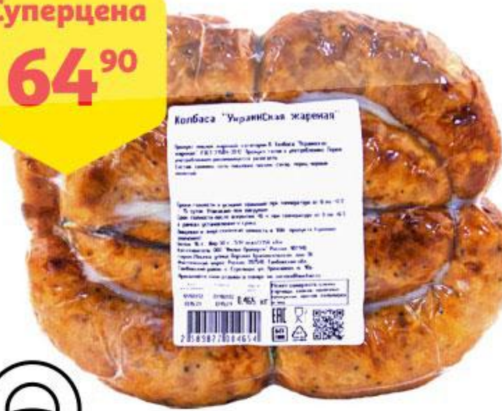
Колбаса АШАН Украинская жареная, 100 г