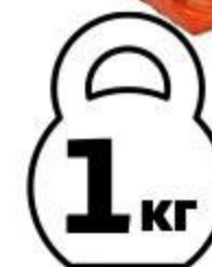
Кижуч холодного копчения спинка, 1 кг