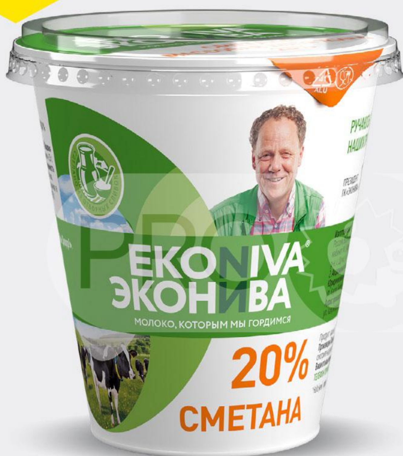
Сметана EKONIVA 20%, 300 г