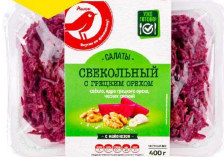
Салат АШАН Свекольный с грецким орехом