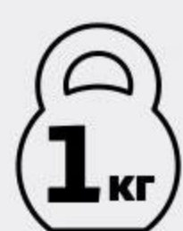
Говядина АШАН Фермерская духовая охлажденная, 1 кг