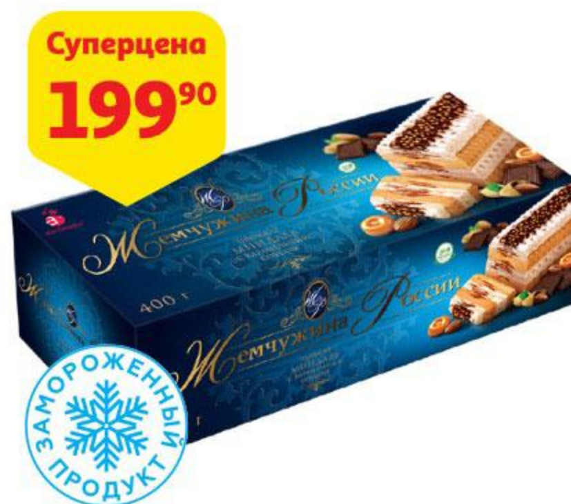
Мороженое АЙСБЕРРИ Жемчужина России рулет карамель с орехами, 400 г