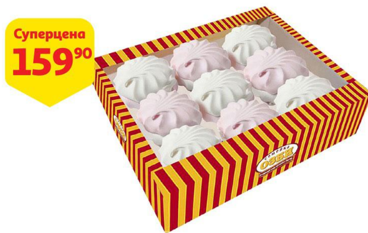
Зефир СЕМЕЙКА ОЗБИ ванильный / бело-розовый, 540 г