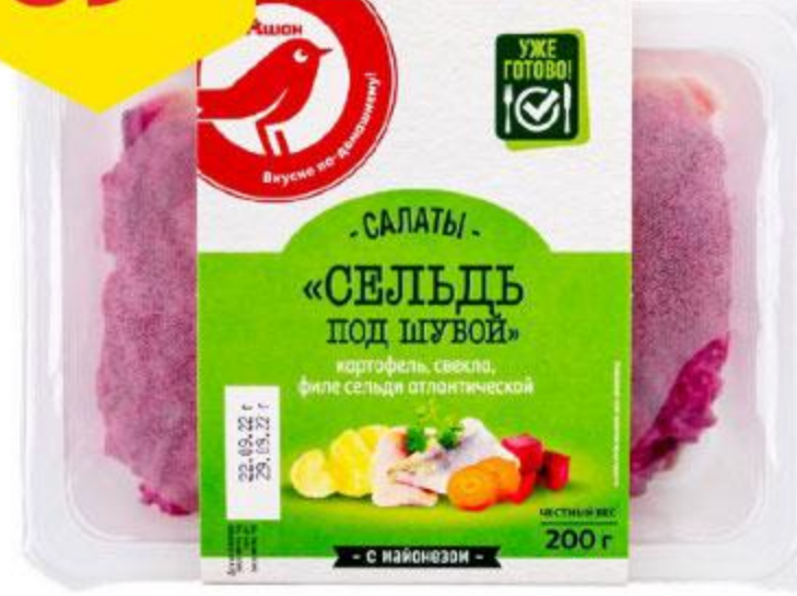
Салат АШАН Сельдь под шубой, 200 г