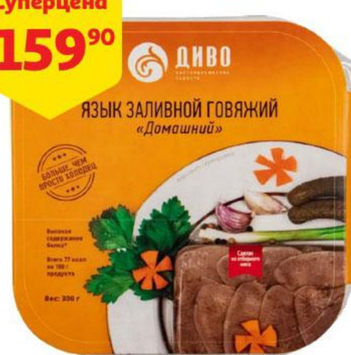
Язык ДИВО заливной говяжий Домашний, 300 г