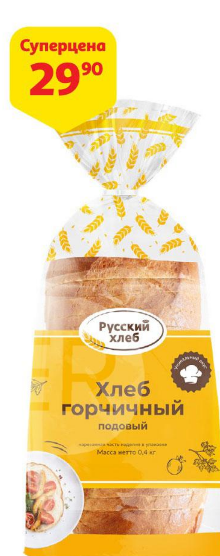
Хлеб РУССКИЙ ХЛЕБ Горчичный нарезка, 400 г