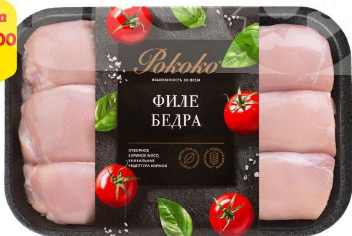
Филе бедра РОКОКО охлажденное, 750 г