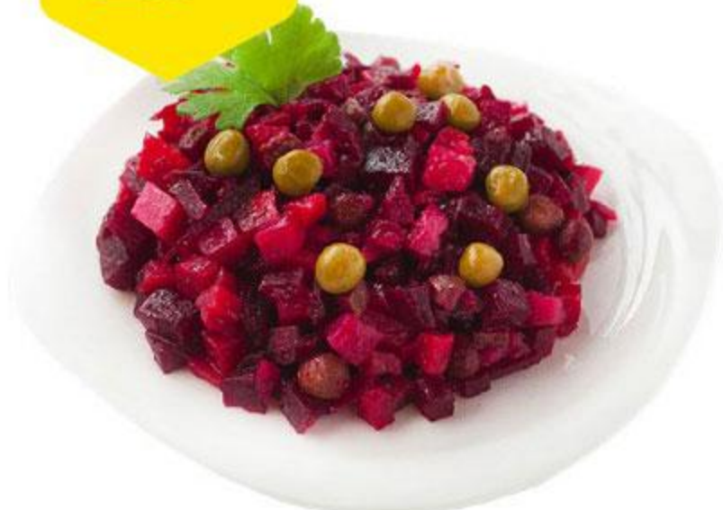
Салат Винегрет, 100 г