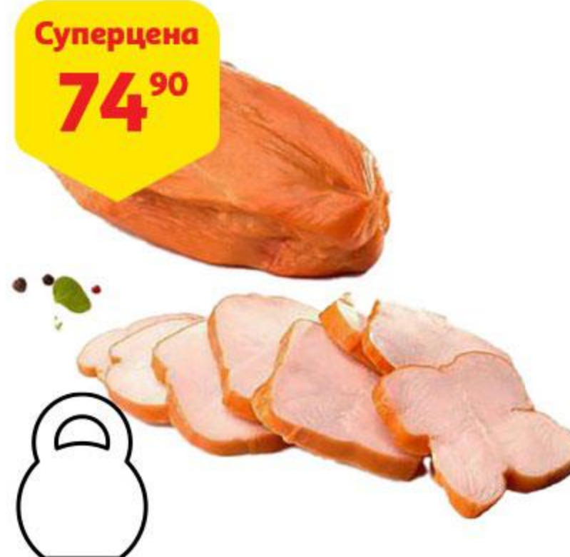
Суперцена 74 90 Филе грудки куриной варено-копченное, 100 г