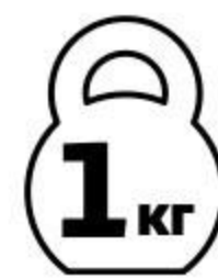
Ребрышки свиные БЛИЖНИЕ ГОРКИ Пикантные для запекания охлажденные, 1 кг