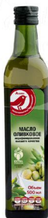
Масло оливковое АШАН нерафинированное, 500 мл