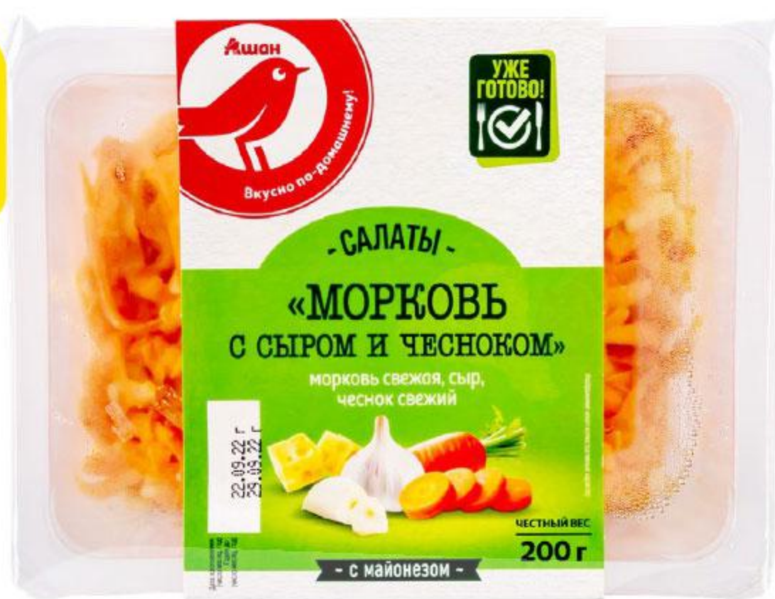
Салат АШАН Морковь с чесноком и сыром, 200 г