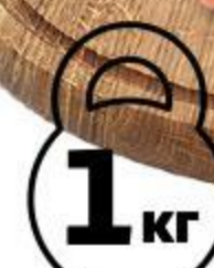
Марлин филе холодного копчения, 1 кг