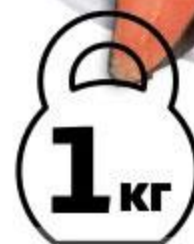
Горбуша холодного копчения спинка, 1 кг