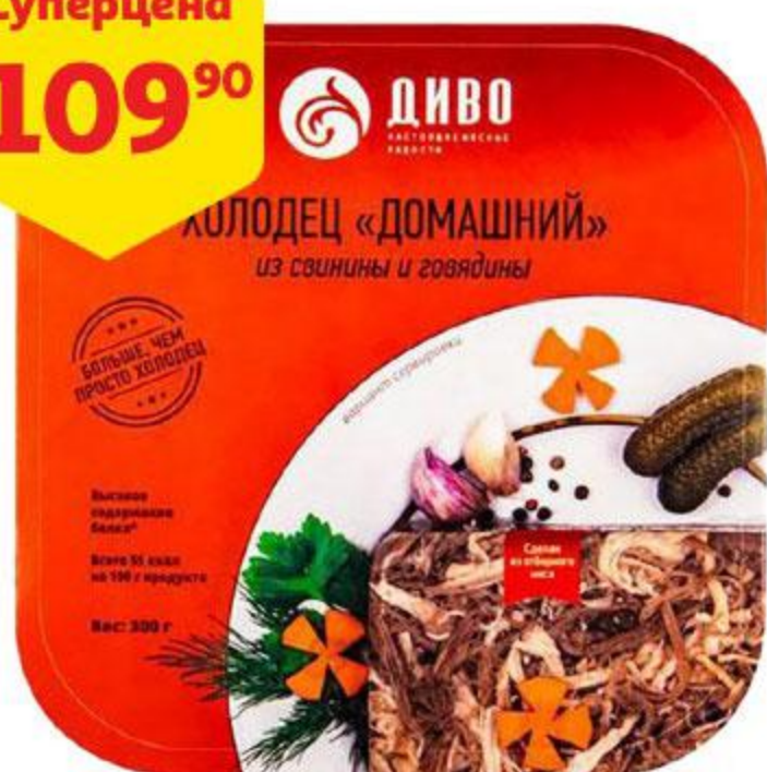
Холодец ДИВО Домашний из свинины и говядины, 300 г