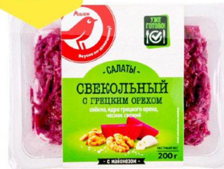
Салат АШАН Свекольный с грецким орехом, 200 г