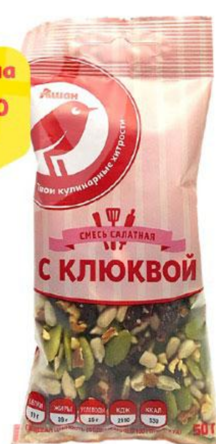
Смесь салатная АШАН с клюквой, 50 г