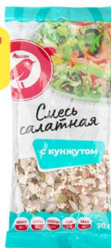
Смесь салатная АШАН с кунжутом, 50 г