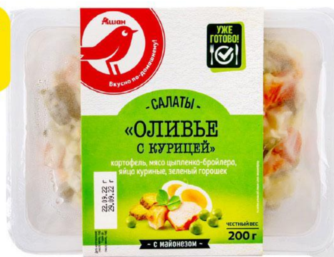
Салат АШАН Оливье с курицей, 200 г