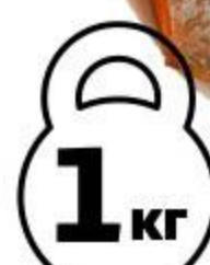
Форель АШАН балык холодного копчения, 1 кг