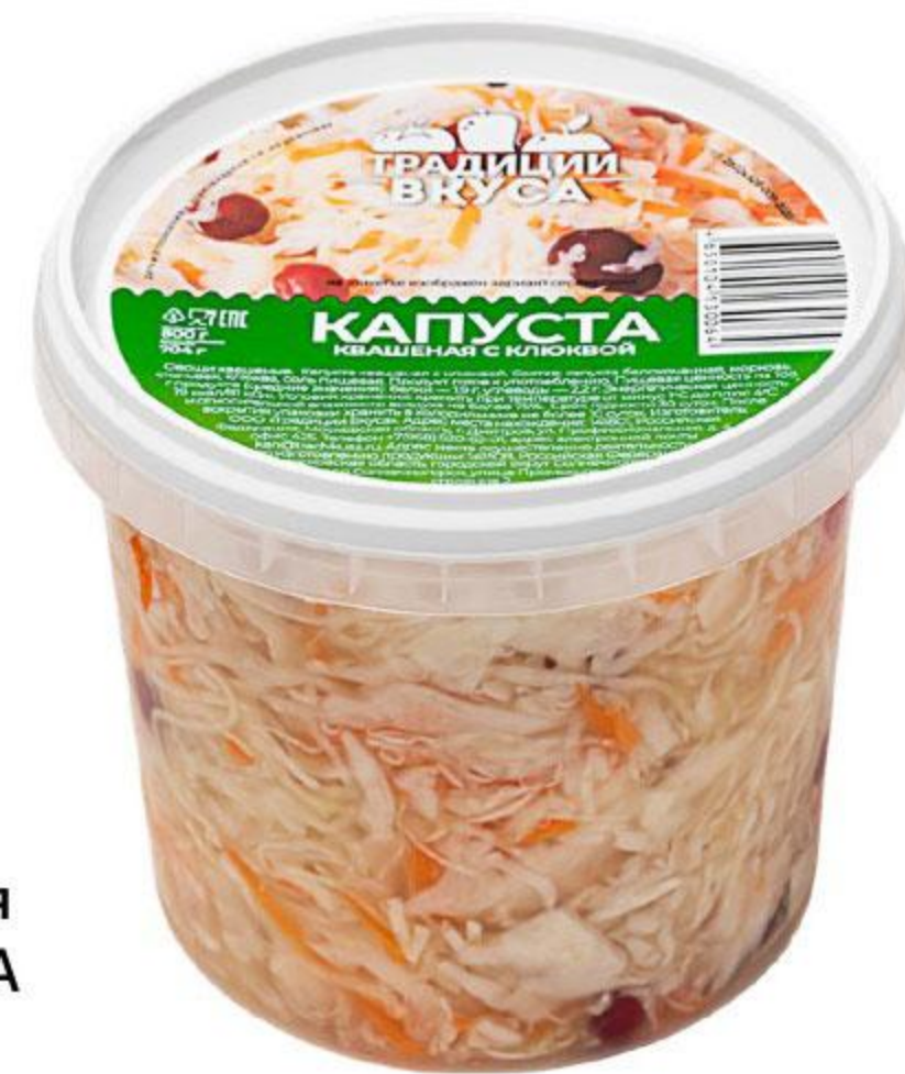
Капуста квашеная ТРАДИЦИИ ВКУСА с клюквой, 900 г