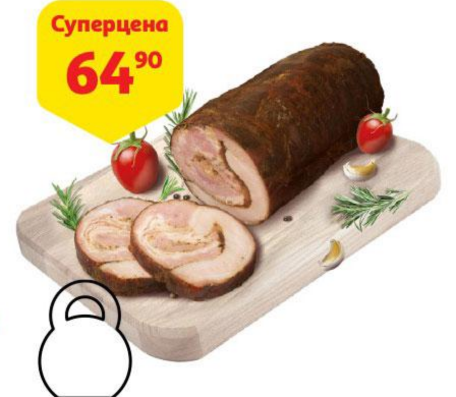
Суперцена 64 90 Панчетта МЯСНИЦКИЙ РЯД с можжевельником, 100 г