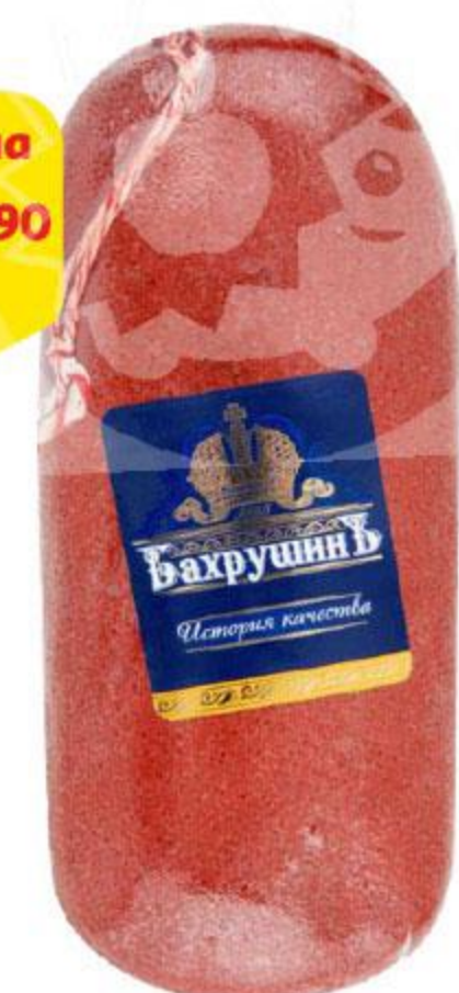
Бастурма БАХРУШИНЬ, 100 г