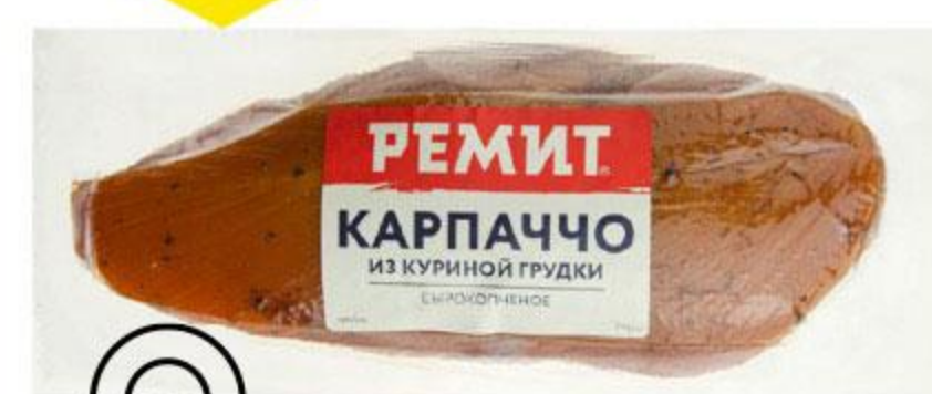
Карпаччо РЕМИТ из куриной грудки сырокопченое, 100 г