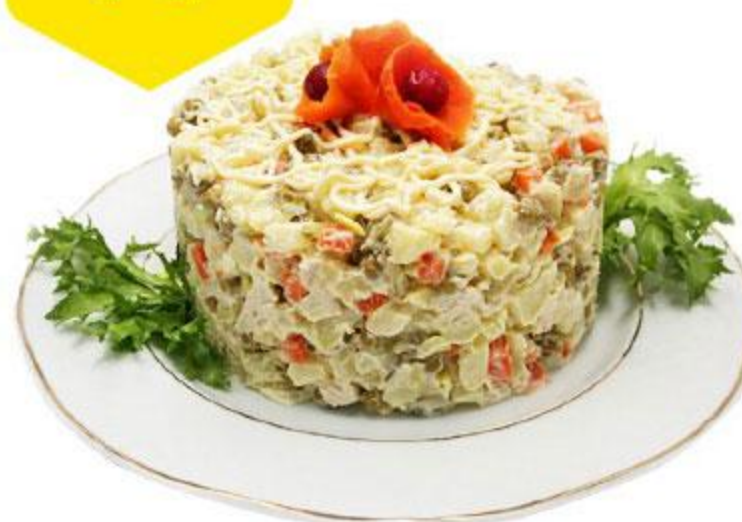
Салат Столичный, 100 г