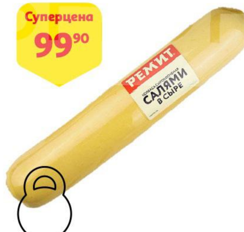
Суперцена 99 90 Колбаса РЕМИТ Салами в сыре сырокопченая, 100 г