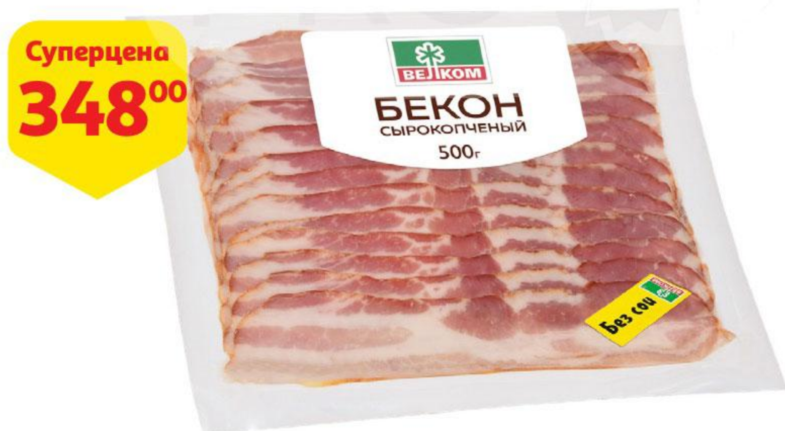
Бекон ВЕЛКОМ сырокопченый нарезка, 500 г