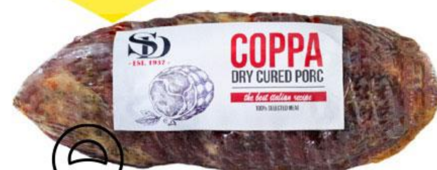
Деликатес из свинины СЫТНЫЙ ДОМ Coppa сыровяленый, 100 г