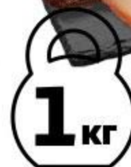
Рыба масляная ОЛИВА кусок холодного копчения, 1 кг