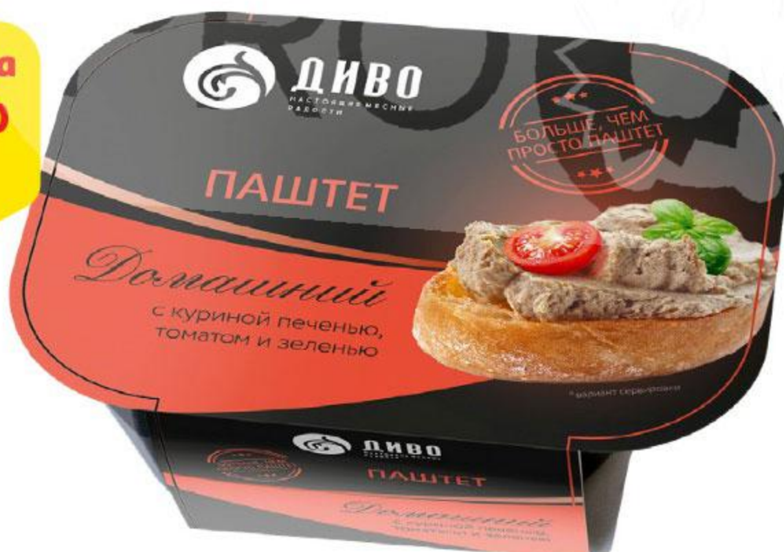
Паштет ДИВО Домашний с куриной печенью-томатом-зеленью, 150 г