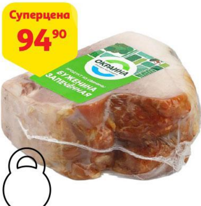
Суперцена 94 90 Буженина ОКРАИНА запеченная, 100 г