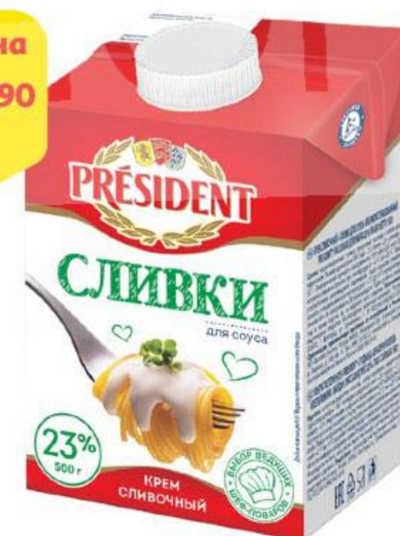
Сливки PRESIDENT ультрапастеризованные 23%, 500 мл