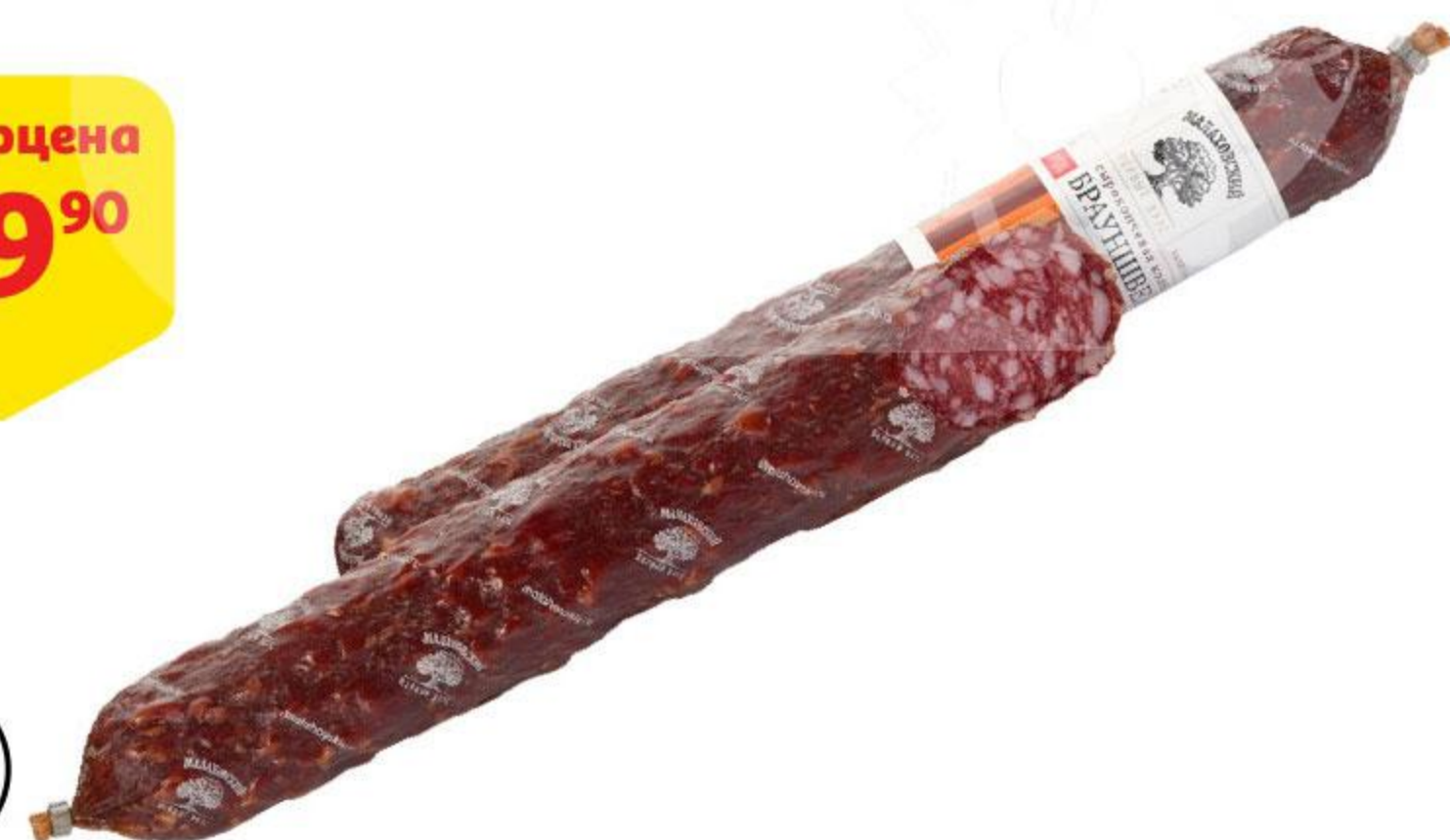
Колбаса МАЛАХОВСКИЙ МК Брауншвейгская сырокопченая, 100 г