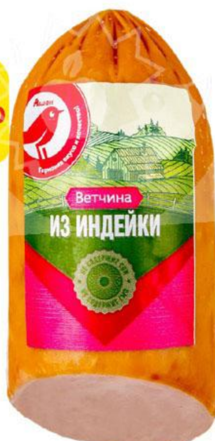
Ветчина АШАН из индейки, 400 г