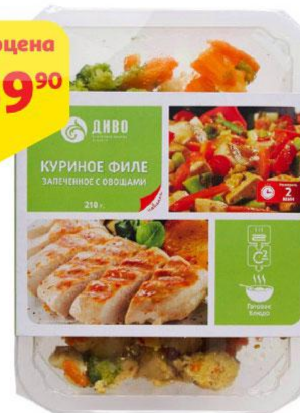
Филе куриное ДИВО запеченное с овощами, 210 г