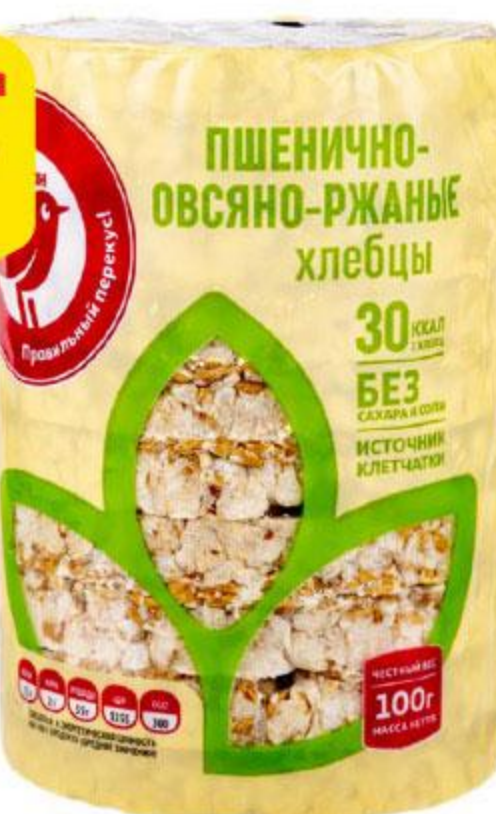
Хлебцы АШАН пшенично-овсяно-ржаные, 100 г