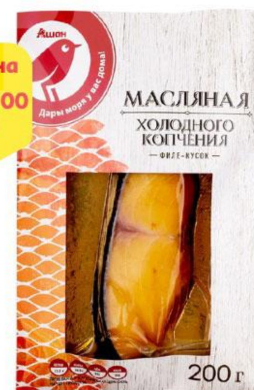
Рыба масляная АШАН филе-кусочек холодного копчения, 200 г