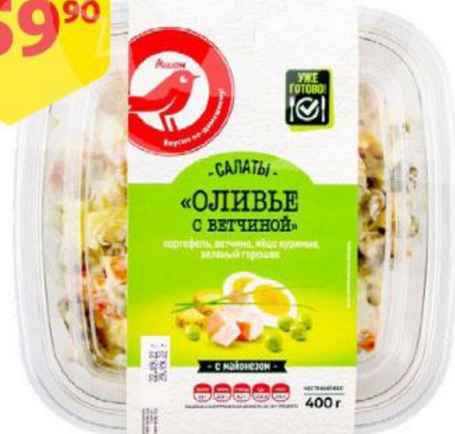
Салат АШАН Оливье с ветчиной, 400 г