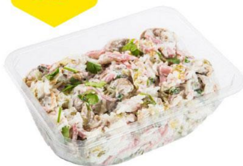
Салат Пальчики оближешь, 100 г