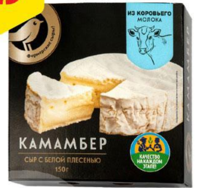
Сыр АШАН Камамбер из коровьего молока, 150 г