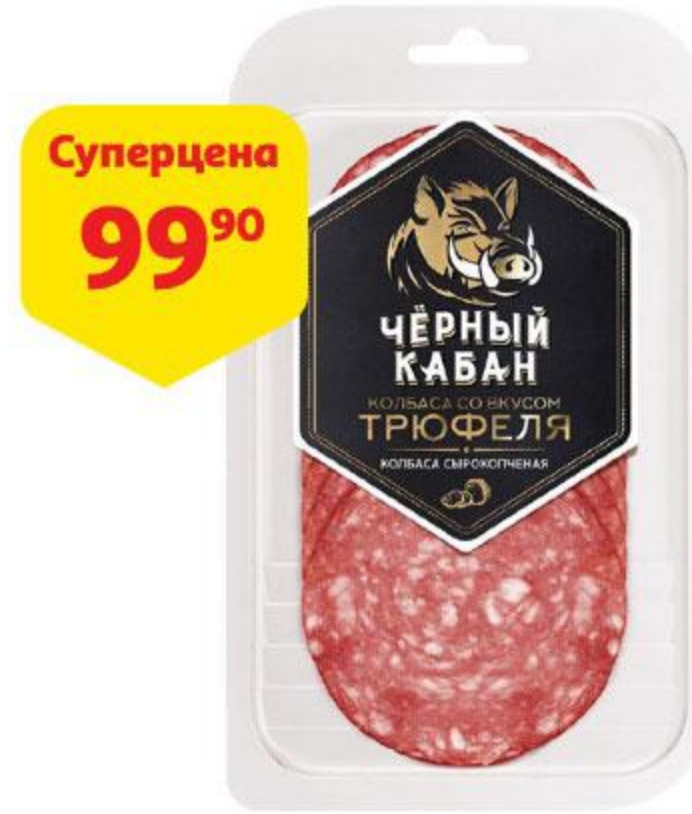
Суперцена 99 90 Колбаса ЧЕРНЫЙ КАБАН со вкусом трюфеля сырокопченая нарезка, 85 г

Идея сервировки: предлагаем вам свернуть из тонких слайсов «розочки», а из более плотных ломтиков конусы — это придаст блюдам объем.