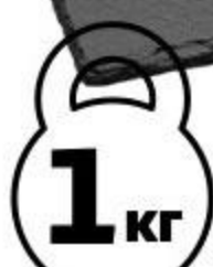
Нерка холодного копчения тушка, 1 кг