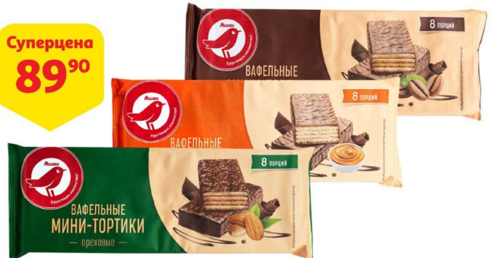
Торт вафельный АШАН порционный ореховый / со сгущенным молоком / кофейный, 200 г