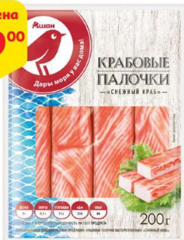
Крабовые палочки АШАН Снежный краб, 200 г