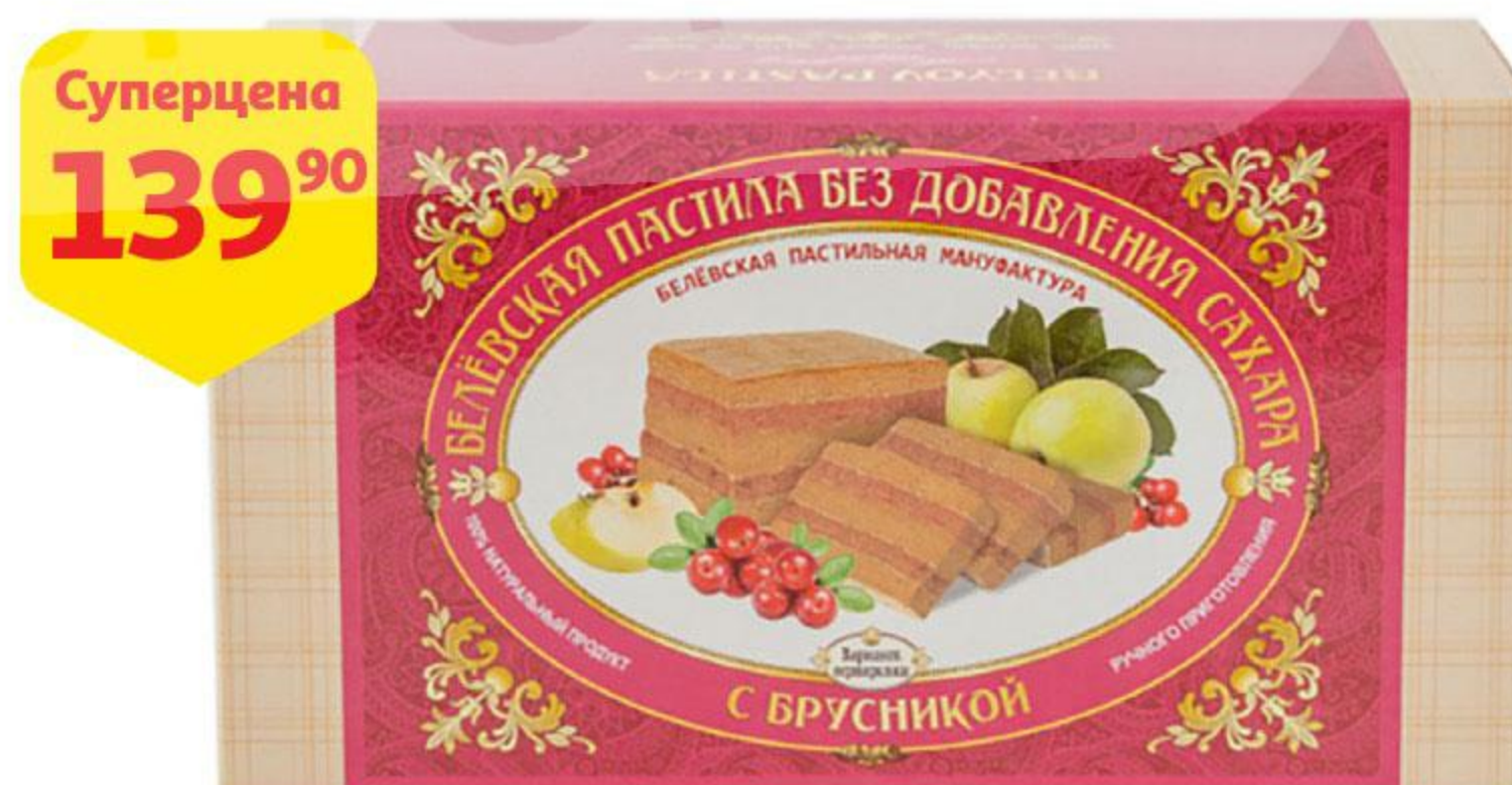
Пастила БЕЛЕВСКАЯ ПАСТИЛЬНАЯ МАНУФАКТУРА классическая / с брусникой, 200 г