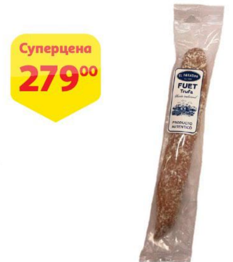
Суперцена 279 00 Колбаса EL PARADOR Fuet trufa с трюфелем сыровяленая, 110 г