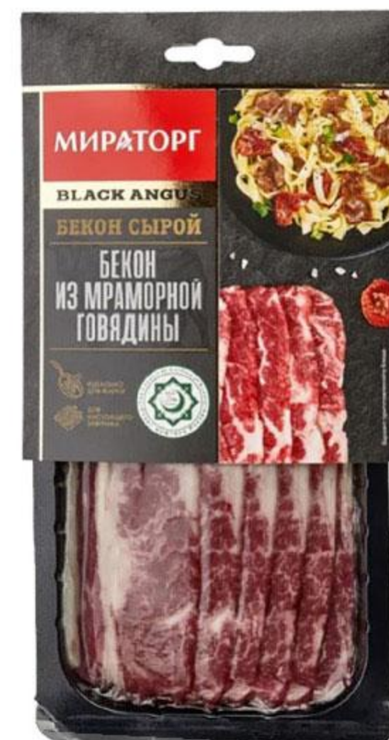
Бекон МИРАТОРГ говяжий мраморный охлажденный, 190 г