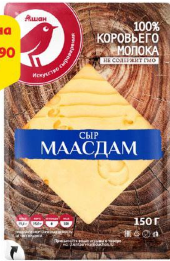
Сыр АШАН Маасдам нарезка 45%, 150 г