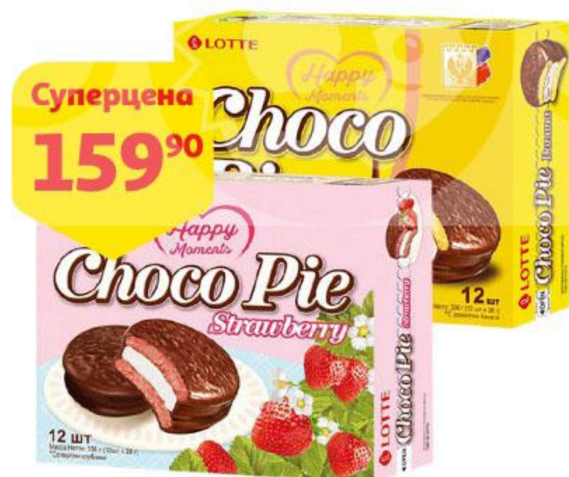
Печенье LOTTE Choco Pie Strawberry бисквитное со вкусом клубники / прослоенное глазированное со вкусом банана, 336 г

5. Процедите клюквенный чай через два слоя марли, разлейте по бокалам из толстого стекла и подайте на стол. Можно украсить целыми ягодами клюквы и палочками корицы.