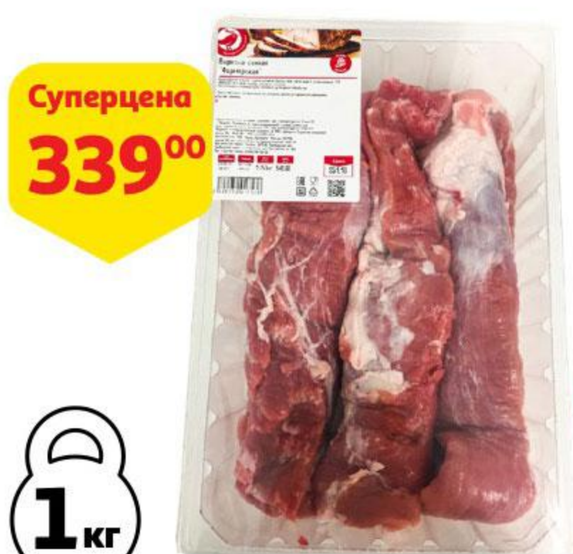
Вырезка свиная АШАН Фермерская охлажденная, 1 кг