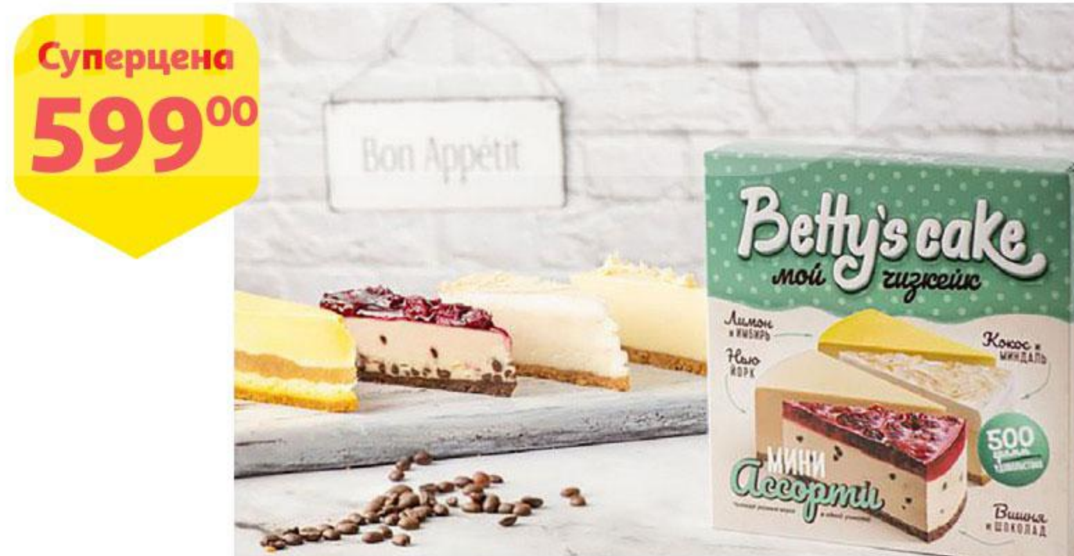
Пирог сырный BETTY'S CAKE Чизкейк Ассорти мини, 500 г

* Ассортимент товара, участвующего в акции, уточняйте в магазинах АШАН, на территории которых проводится данная акция.