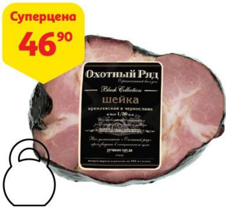
Суперцена 46 90 Шейка ОХОТНЫЙ РЯД Кремлевская в черносливе, 100 г