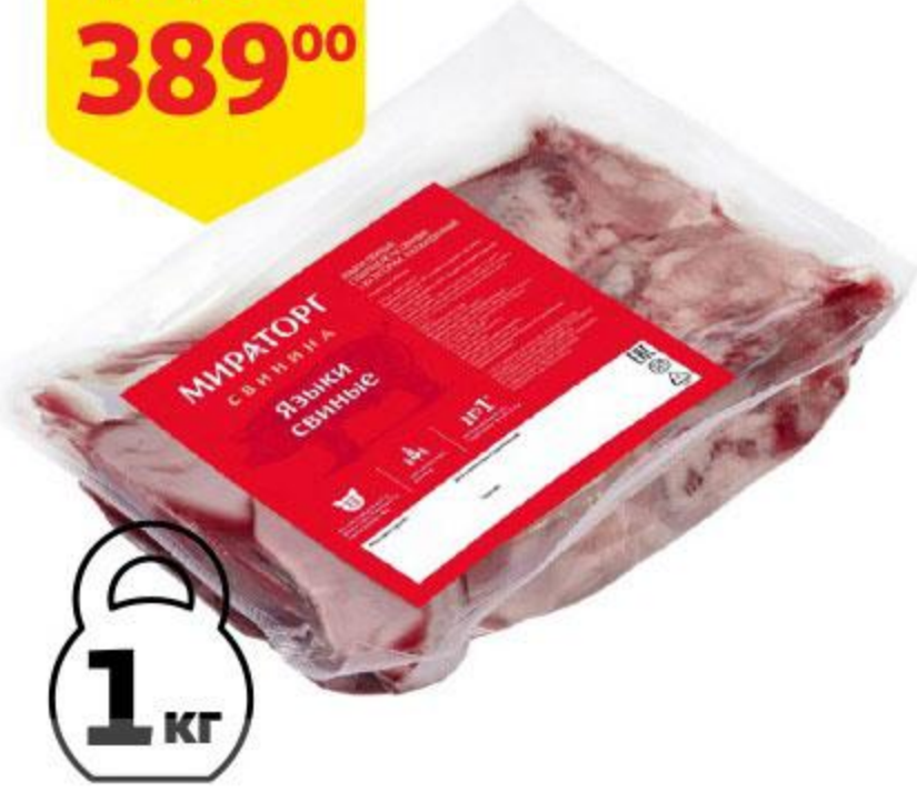
Язык свиной МИРАТОРГ охлажденный, 1 кг