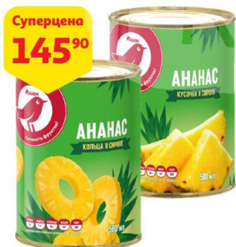
Ананасы АШАН кольца / кусочки в сиропе, 580 мл