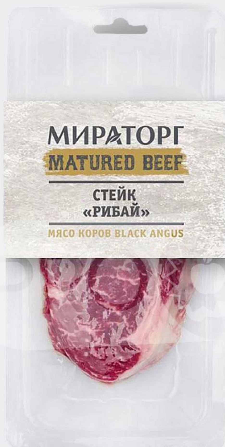
Стейк МИРАТОРГ Рибай охлажденный, 250 г