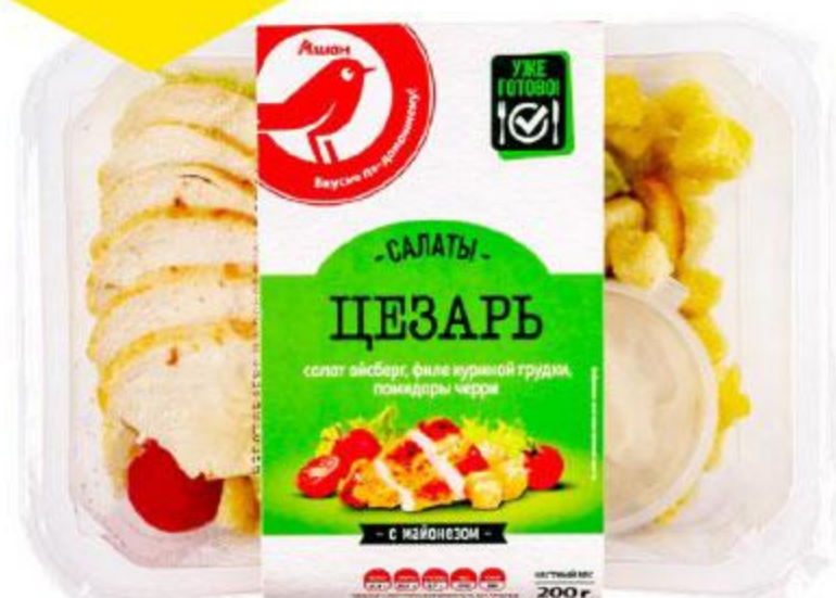
Салат АШАН Цезарь с курицей, 200 г