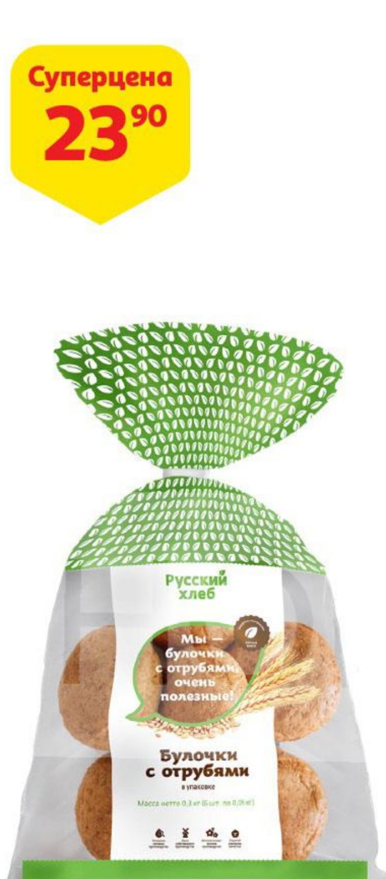
Булочки РУССКИЙ ХЛЕБ с отрубями, 6 шт. x 50 г