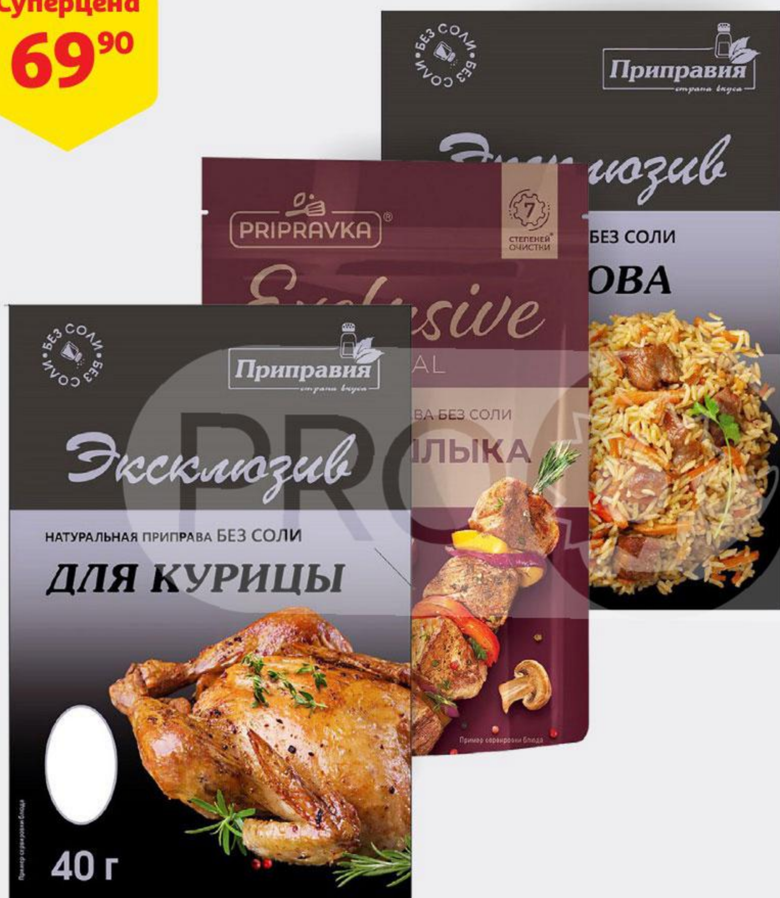
Приправа PRIPRAVKA Exclusive Professional натуральная без соли, 40-45 г, в ассортименте*