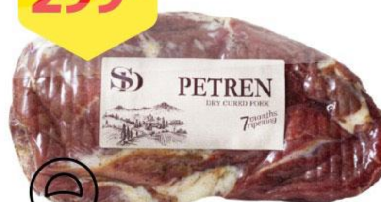
Деликатес из свинины СЫТНЫЙ ДОМ Petren сыровяленый, 100 г