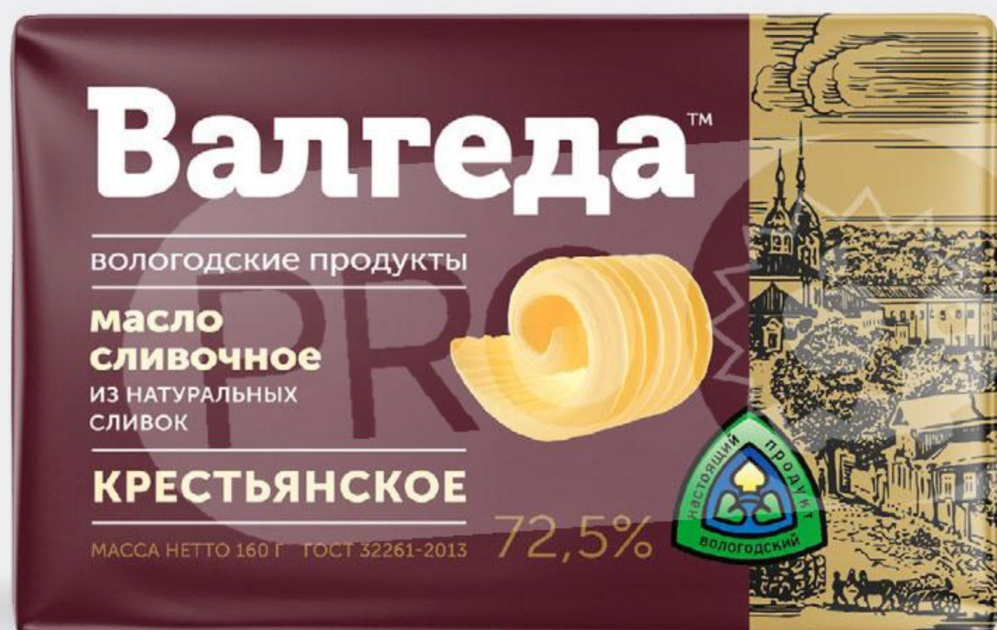
Масло ВАЛГЕДА Крестьянское 72,5%, 160 г