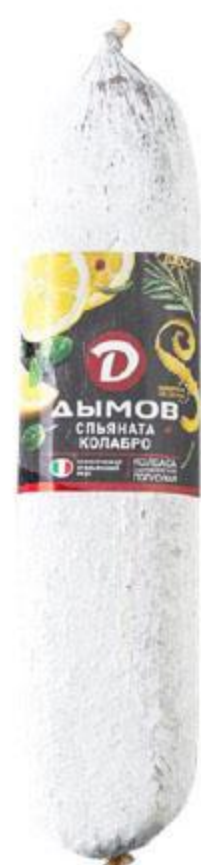
Колбаса ДЫМОВ Салями Спяната Колобро сыровяленая, 100 г