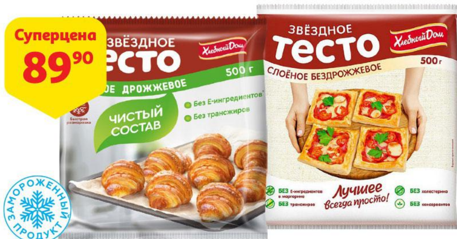
Тесто слоеное ХЛЕБНЫЙ ДОМ Звездное дрожжевое / бездрожжевое, 500 г