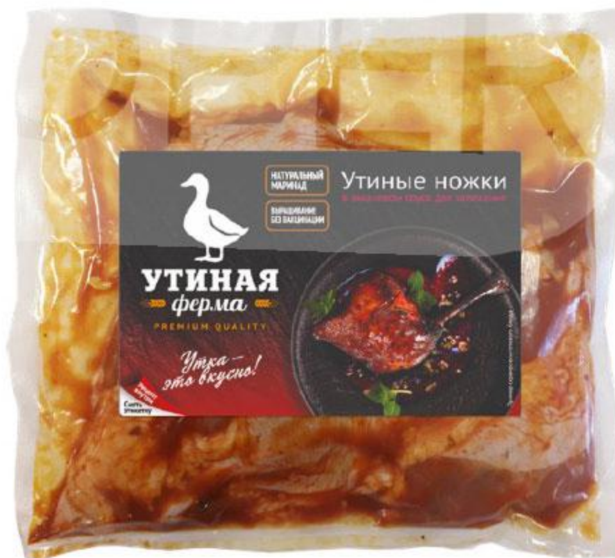
Утиные ножки УТИНАЯ ФЕРМА в вишневом соусе для запекания охлажденные, 1 кг