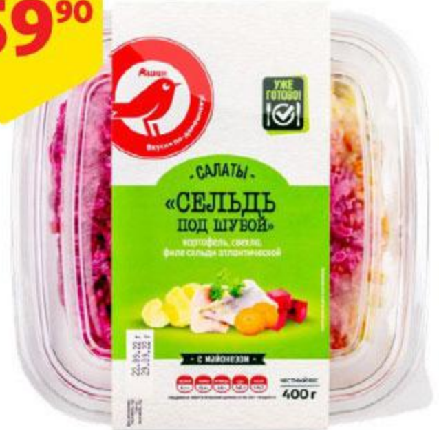
Салат АШАН Сельдь под шубой, 400 г