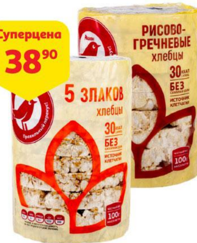
Хлебцы АШАН 5 злаков / рисово-гречневые, 100 г