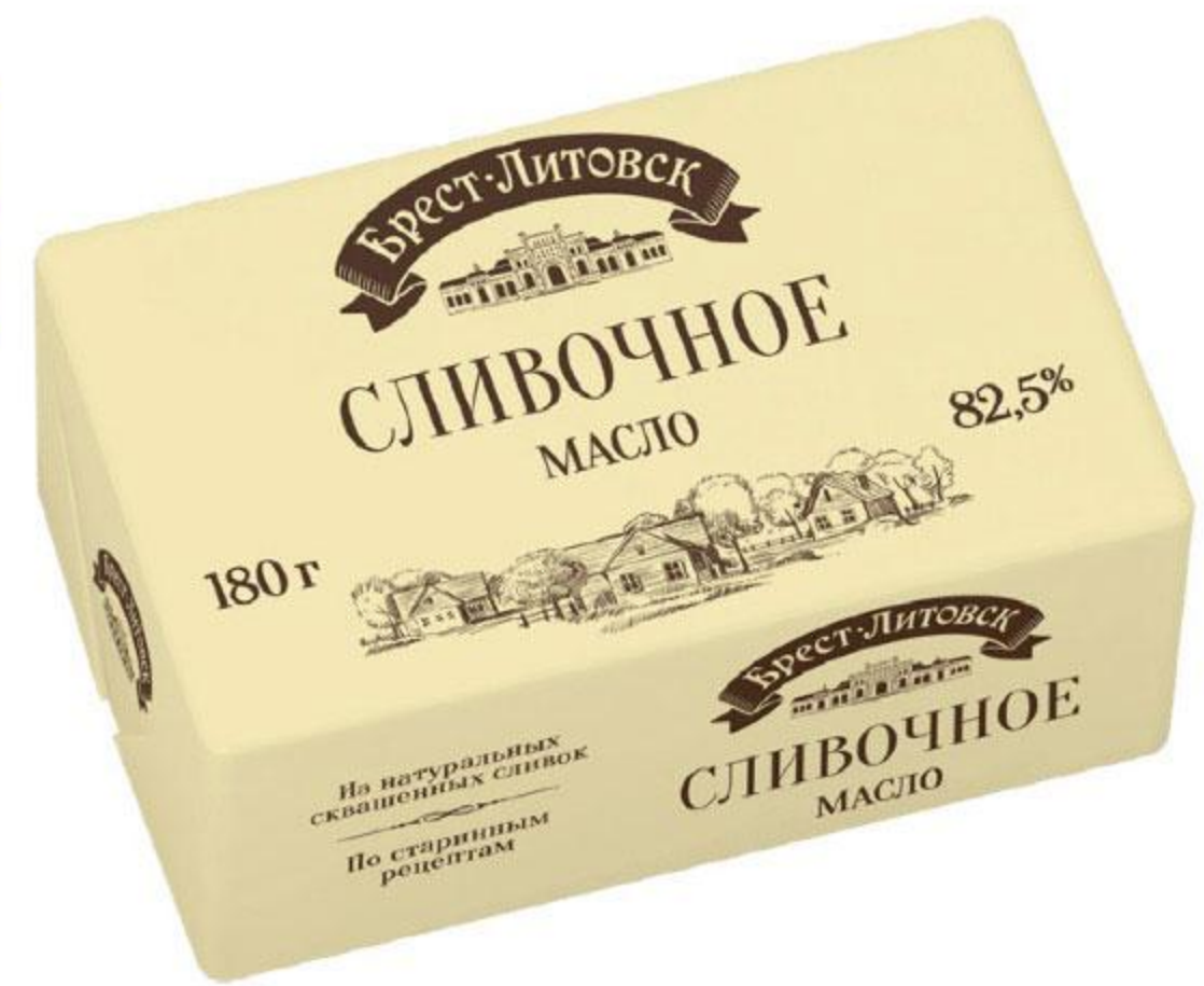
Масло сладкосливочное БРЕСТ-ЛИТОВСК несоленое 82,5%, 180 г