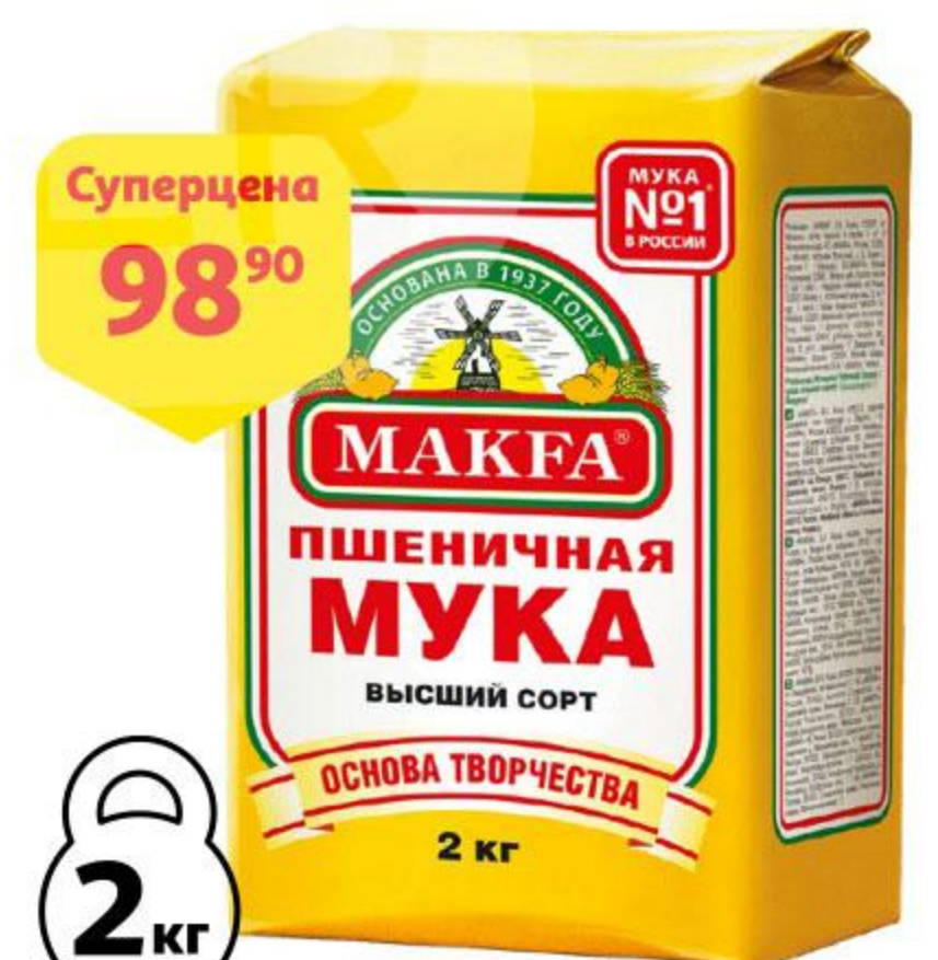
Мука МАКФА пшеничная высший сорт, 2 кг

ЧРЕЗМЕРНОЕ УПОТРЕБЛЕНИЕ АЛКОГОЛЯ ВРЕДИТ ВАШЕМУ ЗДОРОВЬЮ