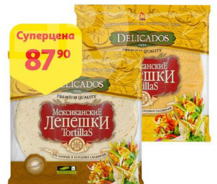
Суперцена 87 90 Лепешки DELICADOS Tortillas мексиканские пшеничные оригинальные / сырные, 400 г