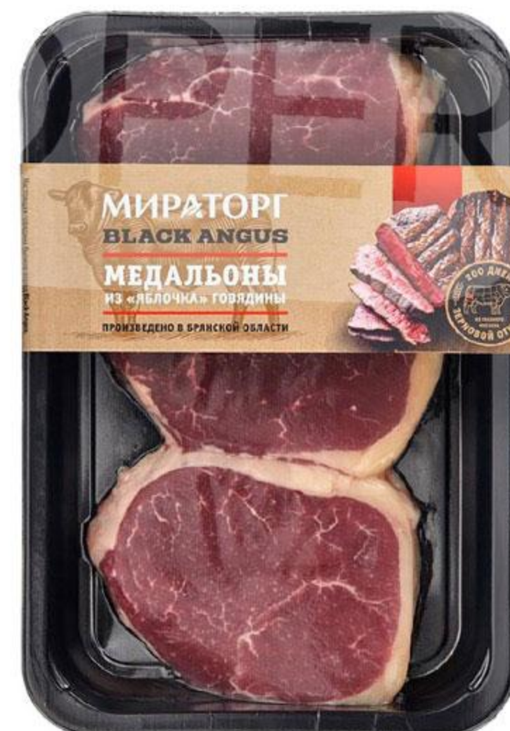
Медальоны МИРАТОРГ говяжьи из яблочка охлажденные, 490 г