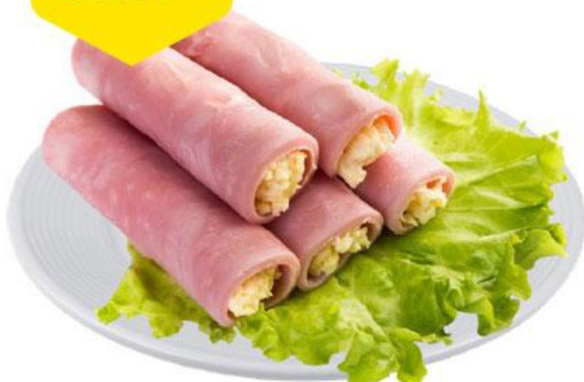
Рулетки ветчина и сыр, 100 г