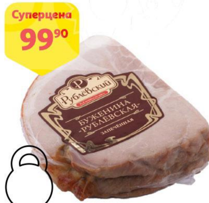
Суперцена 99 90 Буженина РУБЛЕВСКИЙ запеченная, 100 г