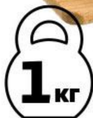
Горбуша горячего копчения тушка, 1 кг