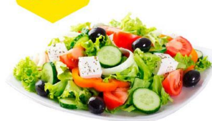
Салат Греческий, 100 г