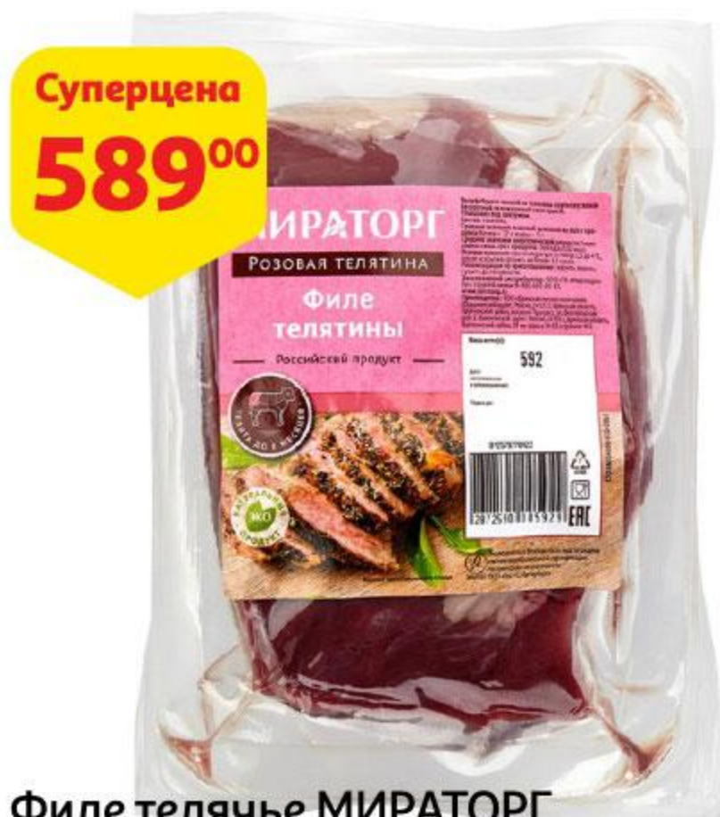
Филе телячье МИРАТОРГ охлажденное, 600 г