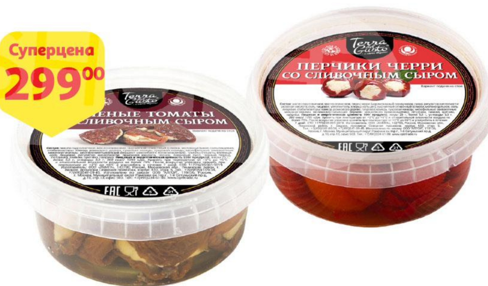
Вяленые томаты / Перец черри TERRA DEL GUSTO с сыром, 250 г