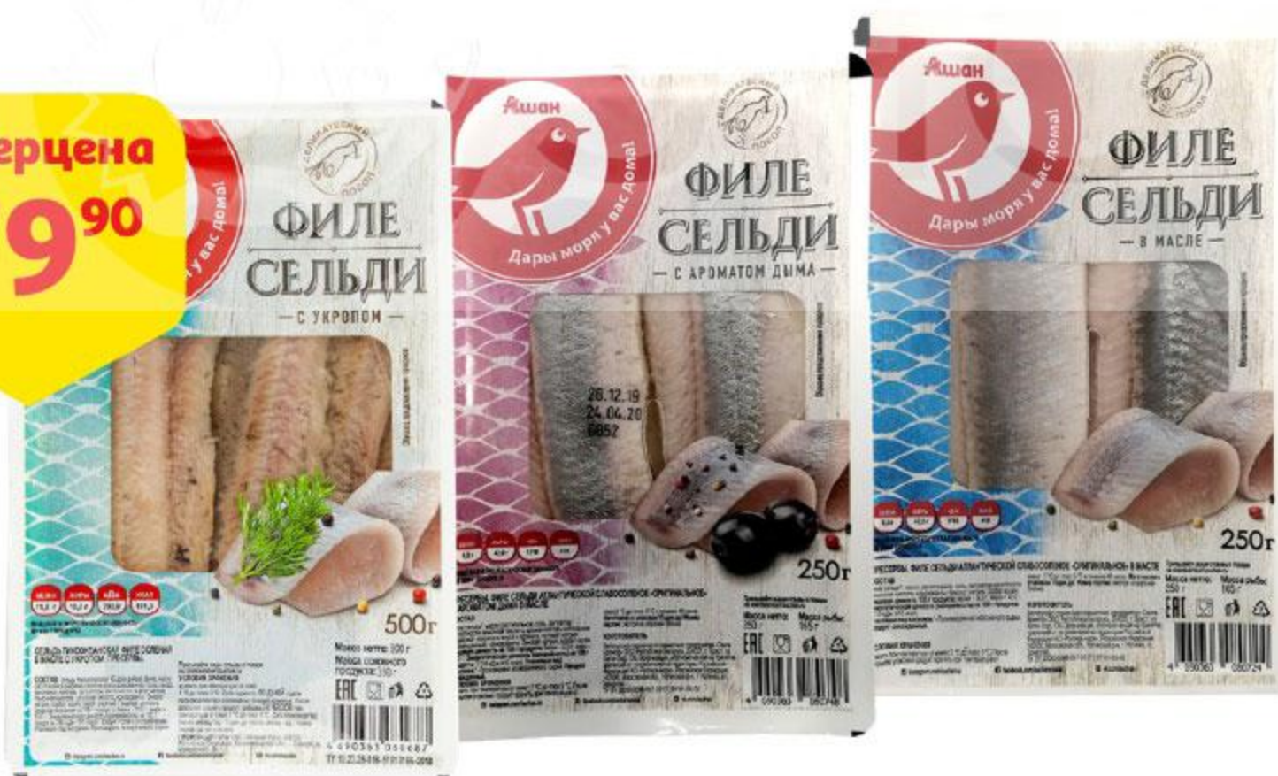
Филе сельди АШАН Оригинальное / с укропом / с ароматом дыма в масле, 250 г