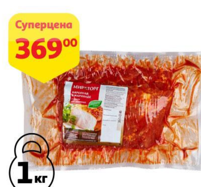
Карбонад свиной МИРАТОРГ в маринаде охлажденный, 1 кг