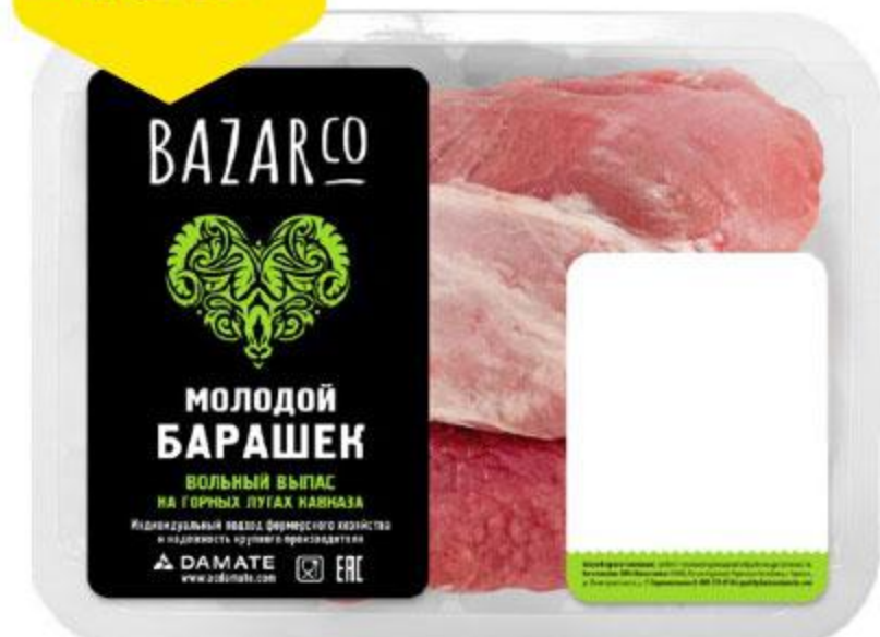
Мякоть окорока бараньего BAZARCO охлажденная, 400 г