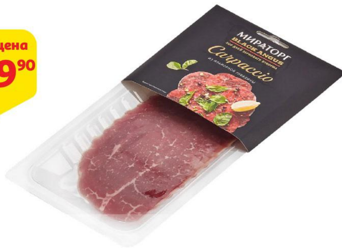
Карпаччо МИРАТОРГ из говядины охлажденное, 90 г