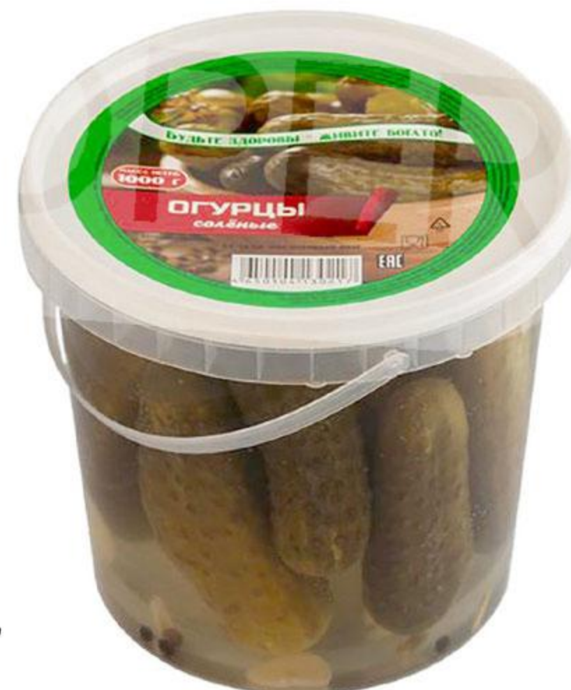
Огурцы соленые ТРАДИЦИИ ВКУСА, 1 кг