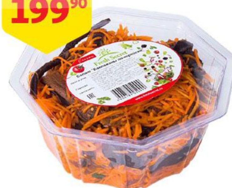
Салат По-корейски FRESH SECRET баклажаны с морковью, 600 г