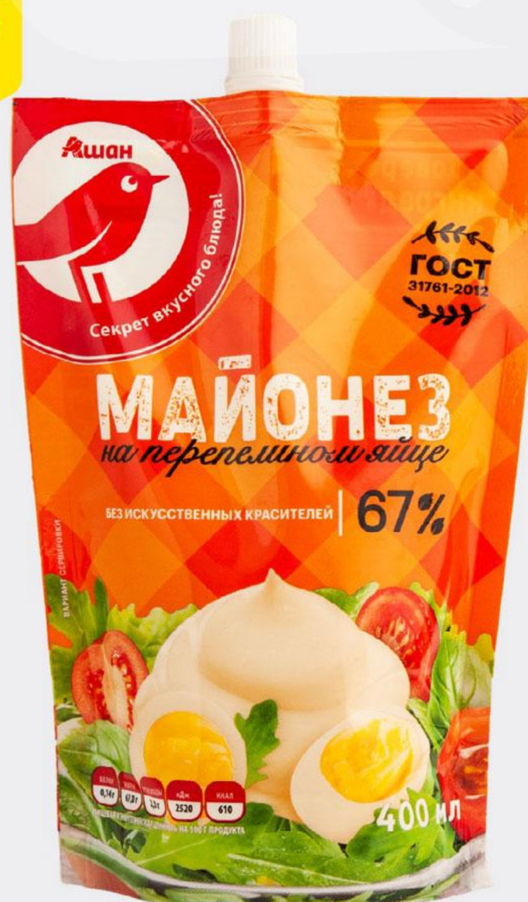
Майонез АШАН провансаль / на перепелином яйце 67%, 400 мл