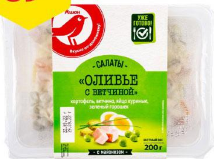
Салат АШАН Оливье с ветчиной, 200 г