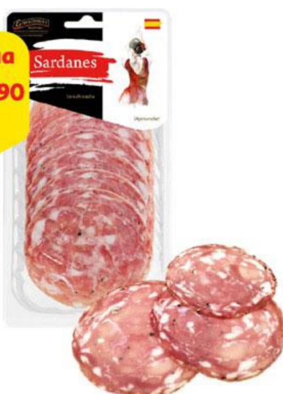
Колбаса ЕГОРЬЕВСКАЯ КГФ Sardanes сырокопченая нарезка, 70 г