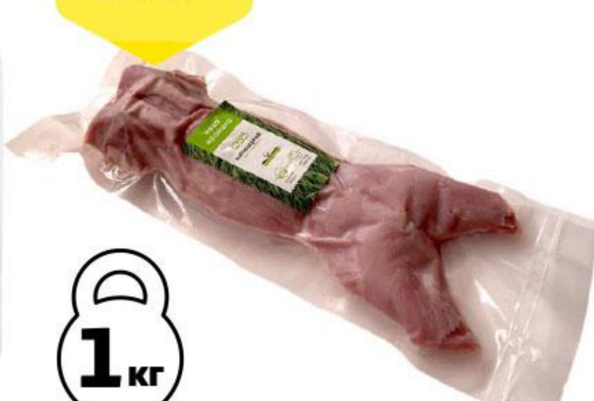
Тушка кролика МАЗАЙЦЕВО охлажденная, 1 кг