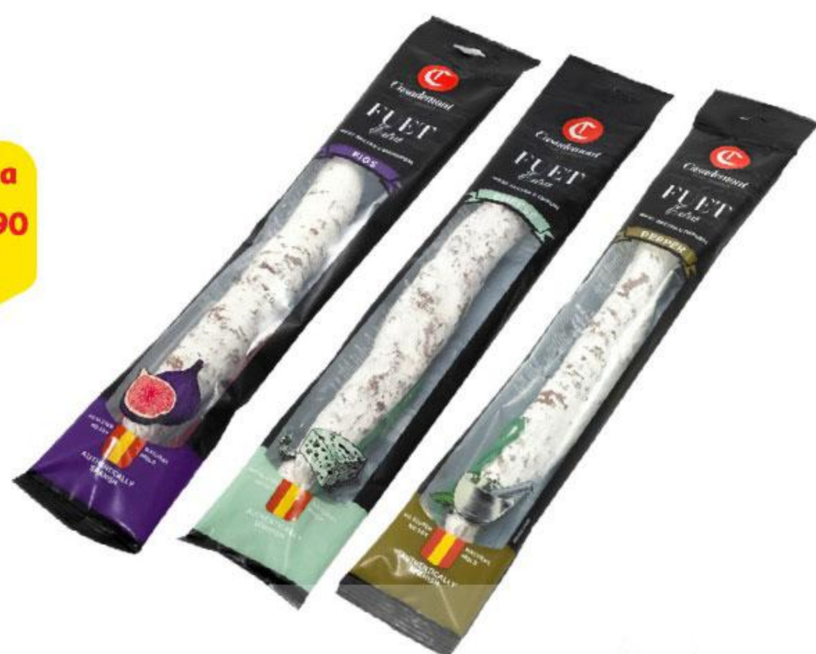
Колбаса CASADEMONT Фуэт Экстра сыровяленая с перцем / с сыром / с инжиром, 150 г