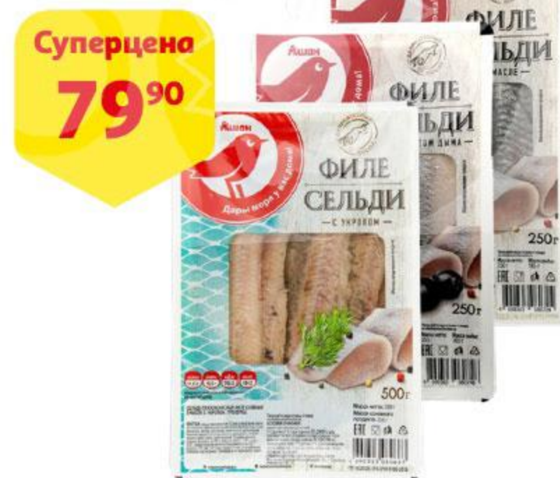
Филе сельди АШАН Оригинальное / с укропом / с ароматом дыма в масле, 250 г