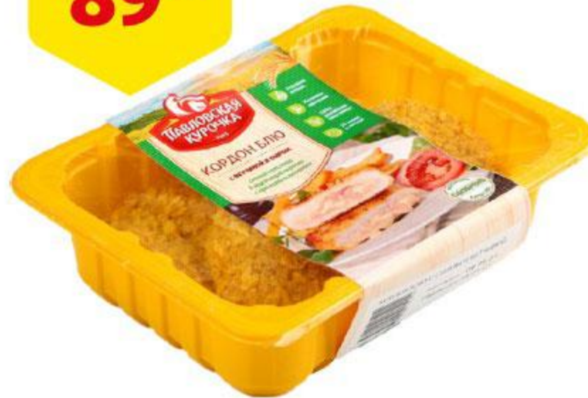
Кордон блю ПАВЛОВСКАЯ КУРОЧКА с сыром и ветчиной охлажденный, 400 г