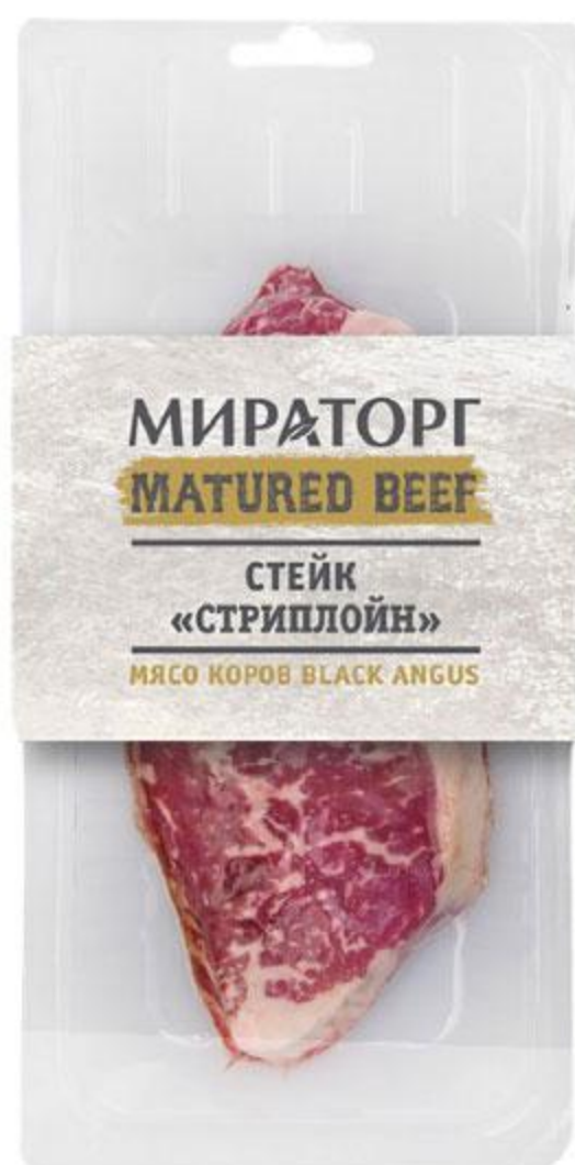
Стейк МИРАТОРГ Стриплойн охлажденный, 250 г