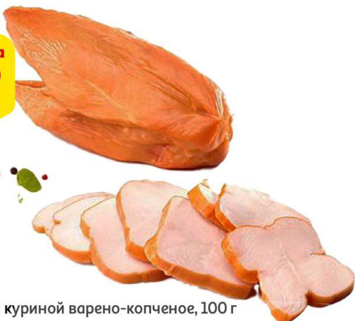
Филе грудки куриной варено-копченое, 100 г