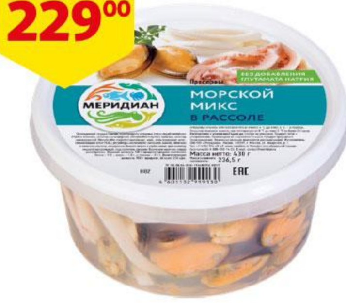
Коктейль из морепродуктов МЕРИДИАН Морской микс в рассоле, 430 г