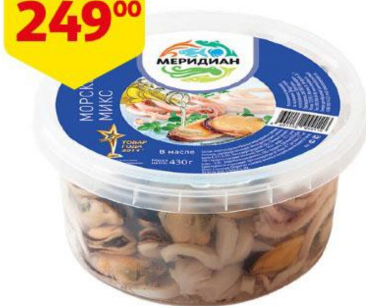
Коктейль из морепродуктов МЕРИДИАН Морской микс в масле, 430 г