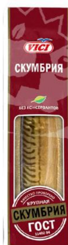
Скумбрия VICI Атлантическая холодного копчения резаная без головы крупная, 480 г