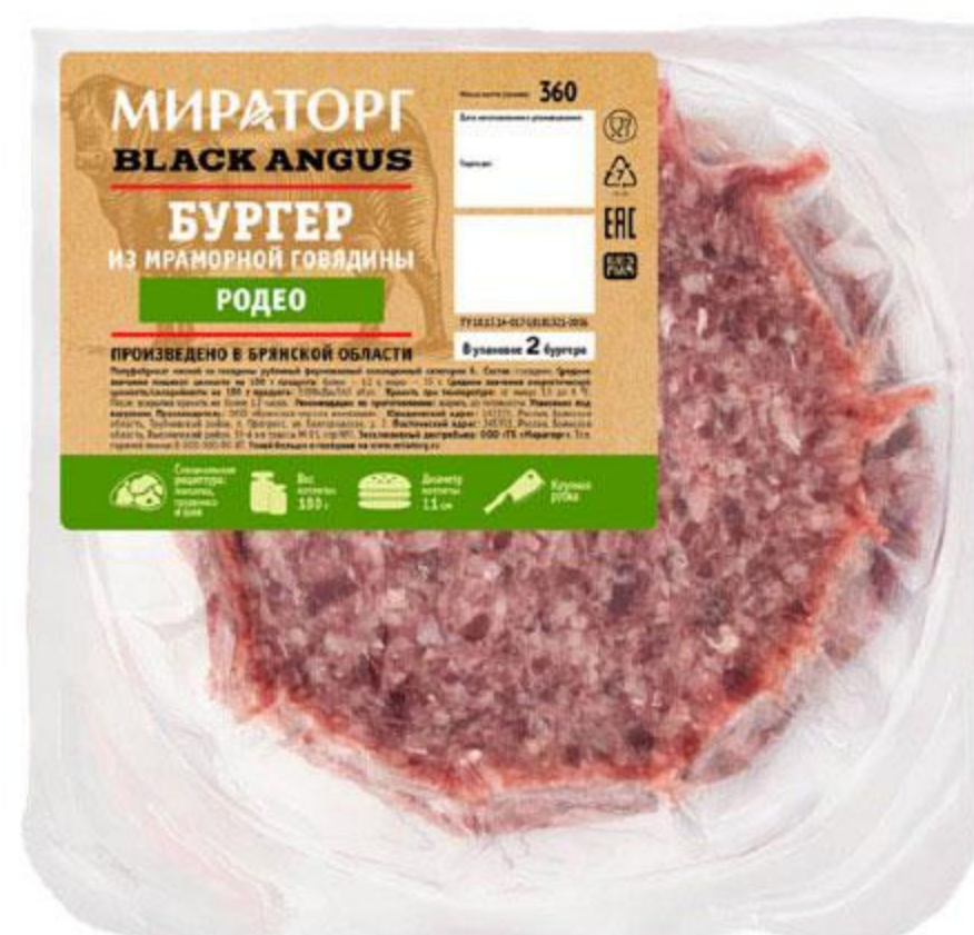
Бургер МИРАТОРГ Родео из мраморной говядины Black Angus охлажденный, 360 г