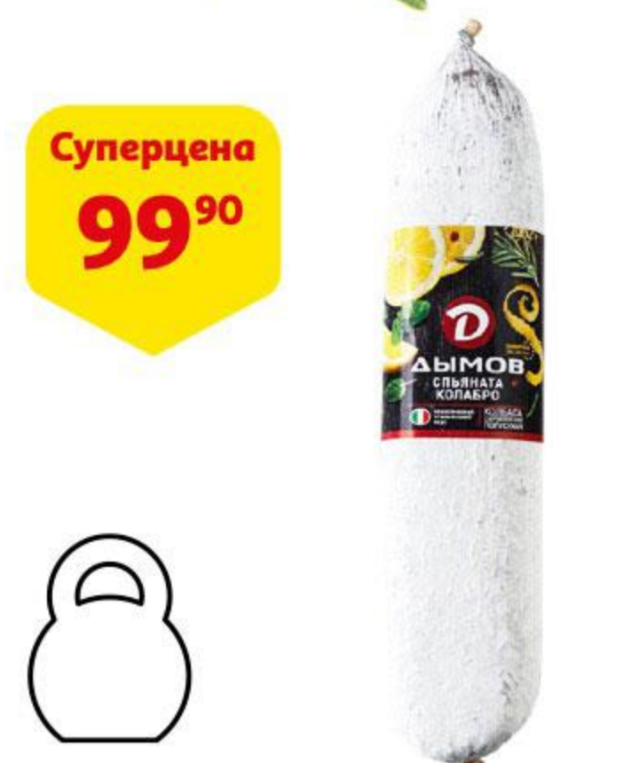
Колбаса ДЫМОВ Салами Спяната Колабро сыровяленая, 100 г