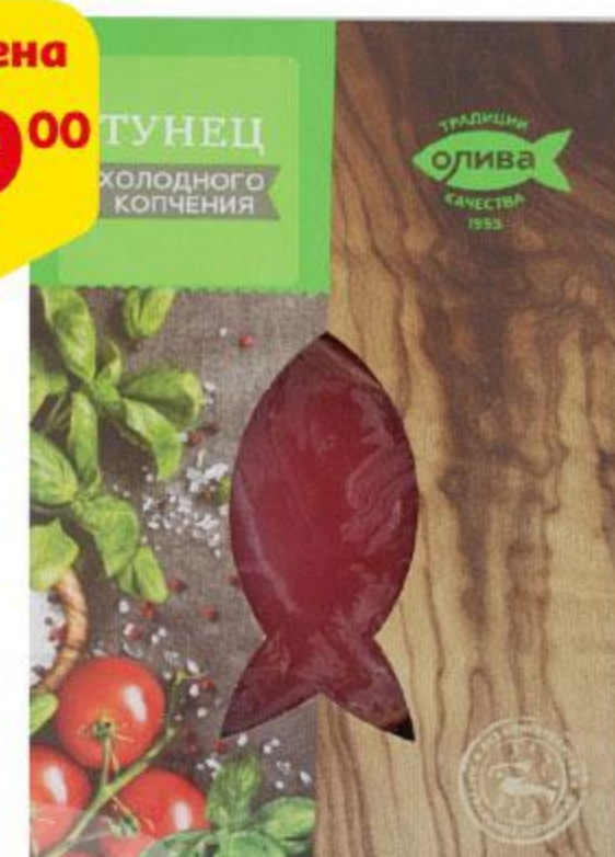
Тунец ОЛИВА филе-кусочки холодного копчения, 150 г