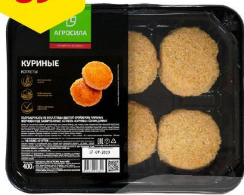
Котлеты куриные ЧЕЛНЫ-БРОЙЛЕР охлажденные, 400 г