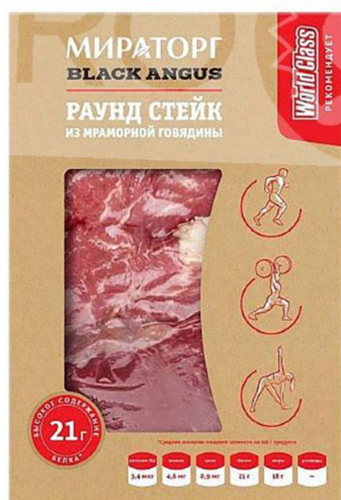
Раунд стейк МИРАТОРГ из мраморной говядины Black Angus охлажденный, 470 г