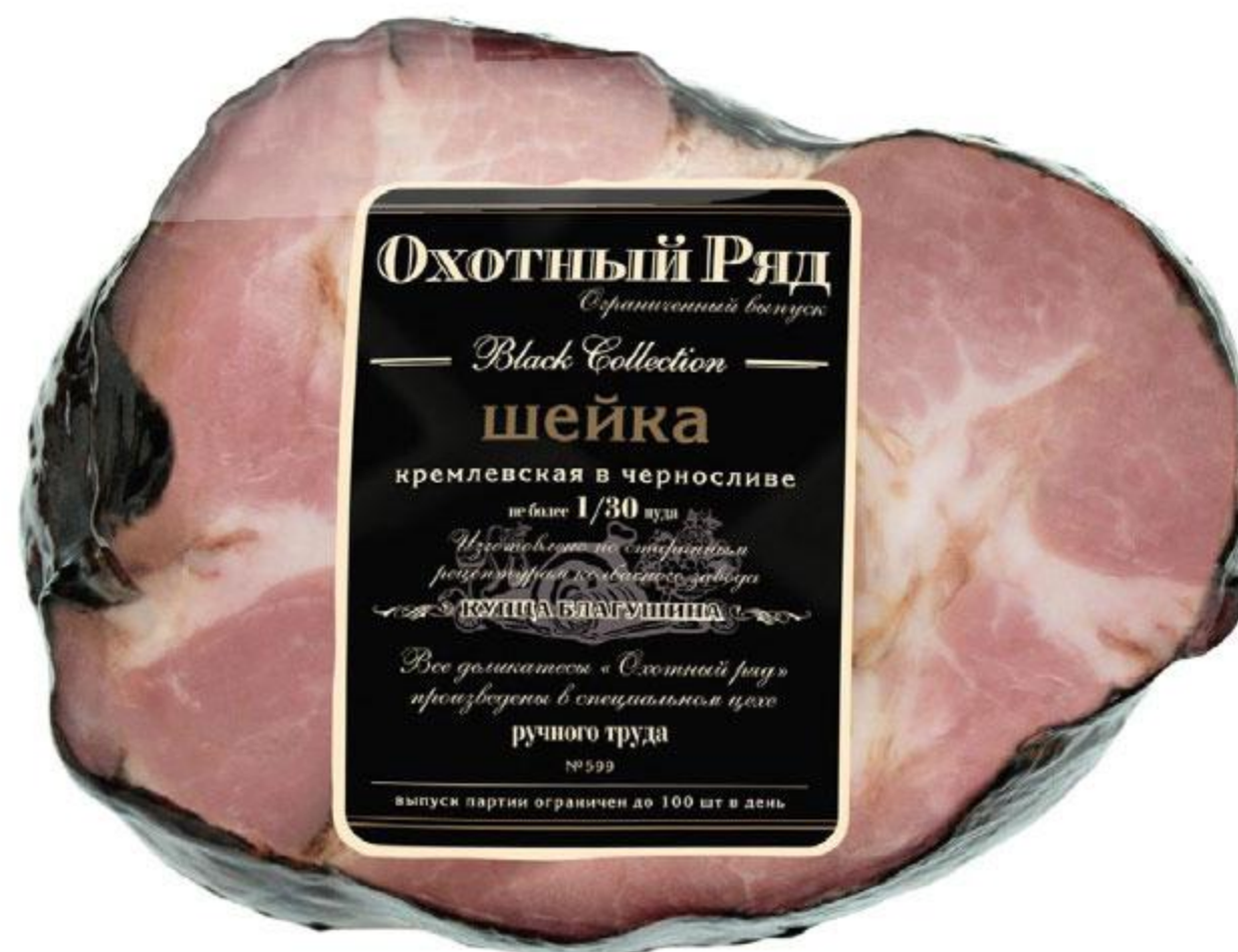
Шейка ОХОТНЫЙ РЯД Кремлевская в черносливке, 100 г