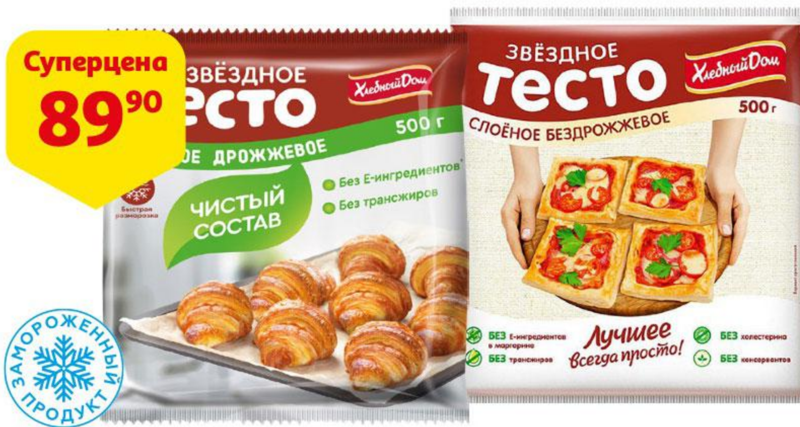
Тесто слоеное ХЛЕБНЫЙ ДОМ Звездное дрожжевое / бездрожжевое, 500 г