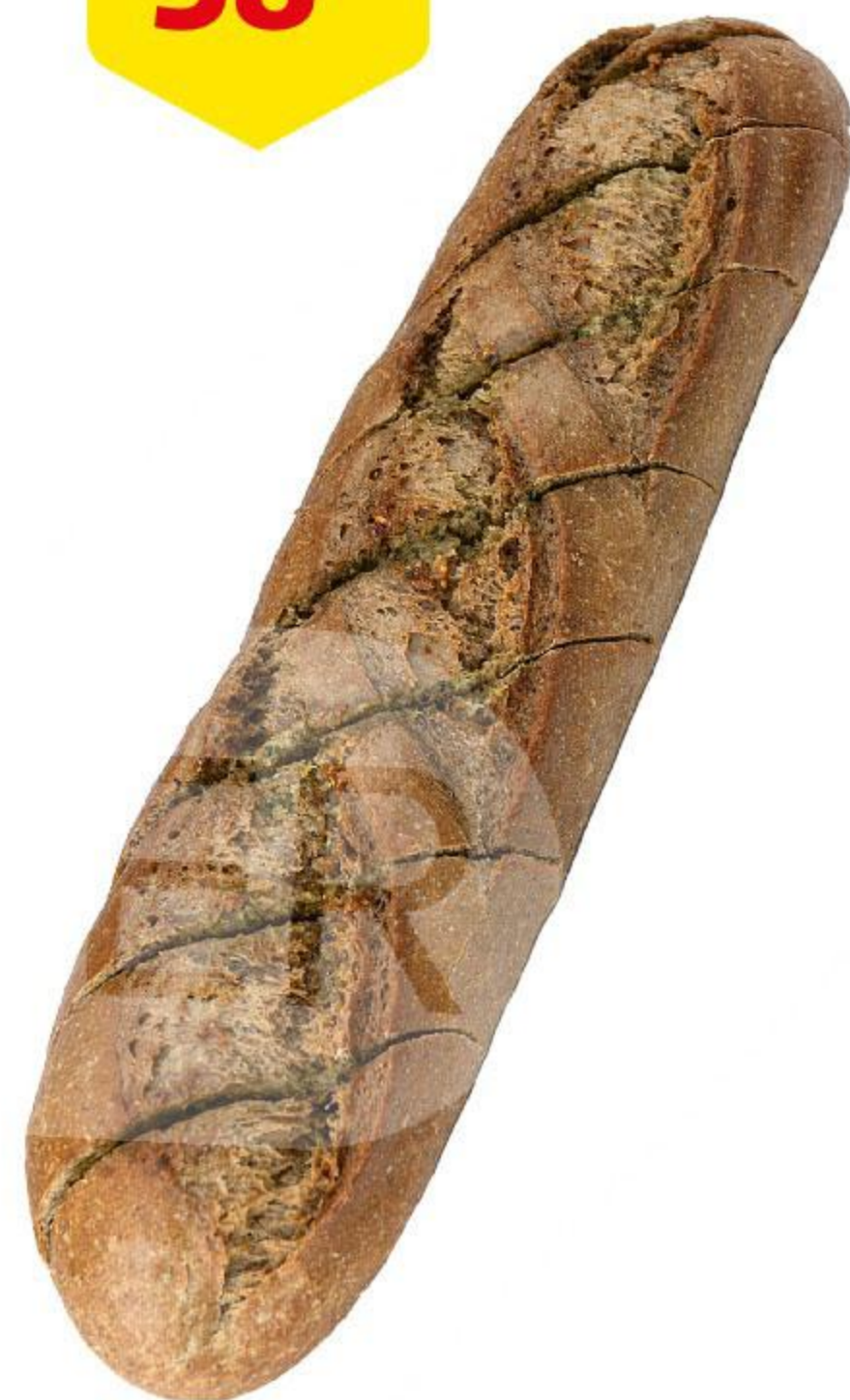
Багет ржаной с чесноком, 155 г