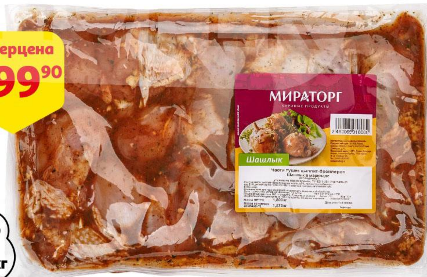
Шашлык из цыпленка-бройлера МИРАТОРГ охлажденный, 1 кг