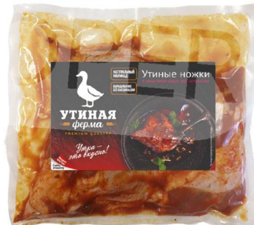
Утиные ножки УТИНАЯ ФЕРМА в вишневом соусе для запекания охлажденные, 1 кг