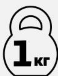
Шашлык АШАН Барбекю из свинины Фермерской охлажденный, 1 кг