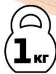
Мякоть окорока свиного АШАН охлажденная, 1 кг