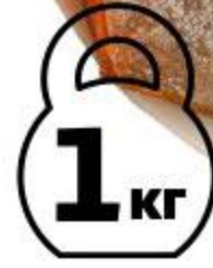
Форель АШАН балык холодного копчения, 1 кг