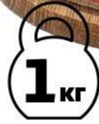
Тунец филе холодного копчения, 1 кг