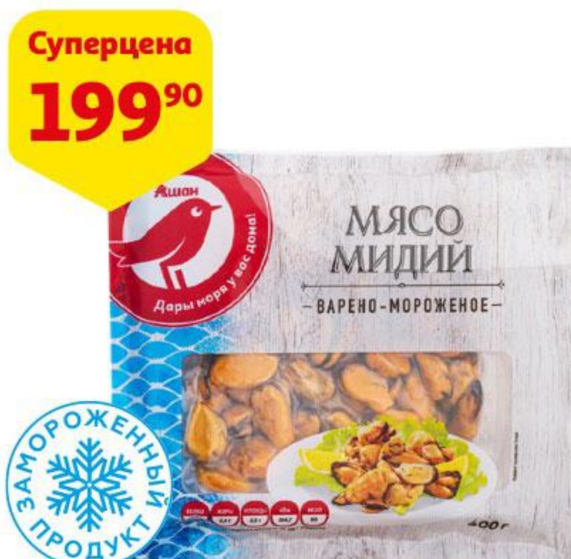
Мясо мидий АШАН варено-мороженое, 400 г