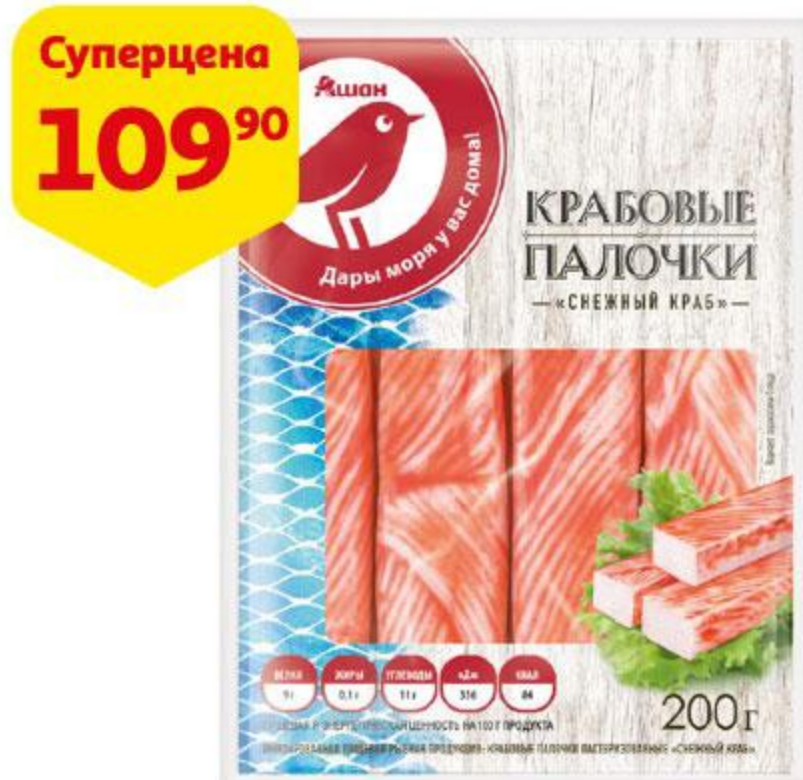
Крабовые палочки АШАН Снежный краб, 200 г