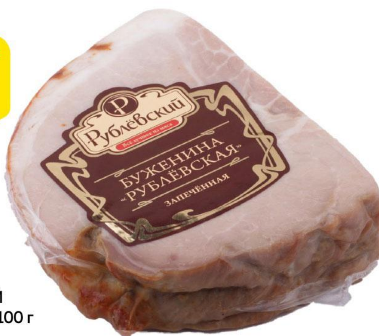
Буженина РУБЛЕВСКИЙ запеченная, 100 г