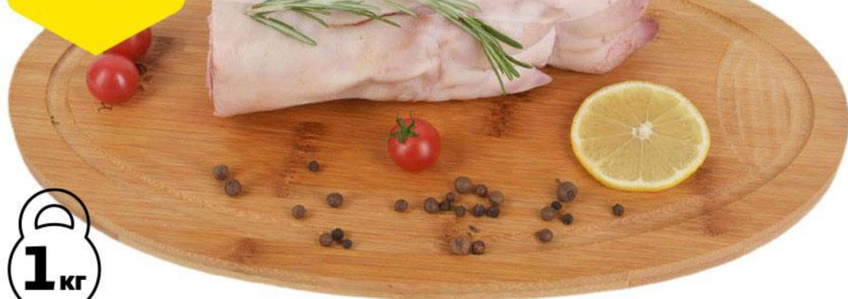
Ноги свиные Фермерские охлажденные, 1 кг