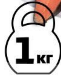
Горбуша холодного копчения спинка, 1 кг