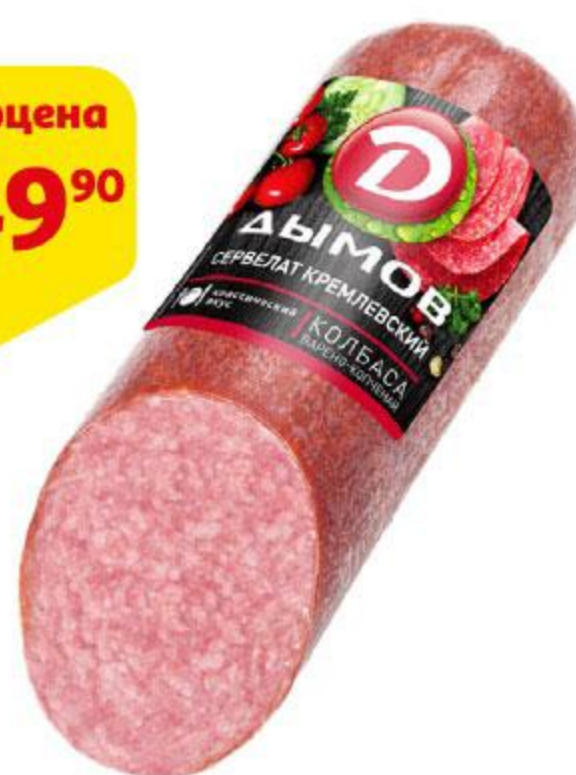
Колбаса ДЫМОВ Сервелат Кремлевский варено-копченый, 330 г