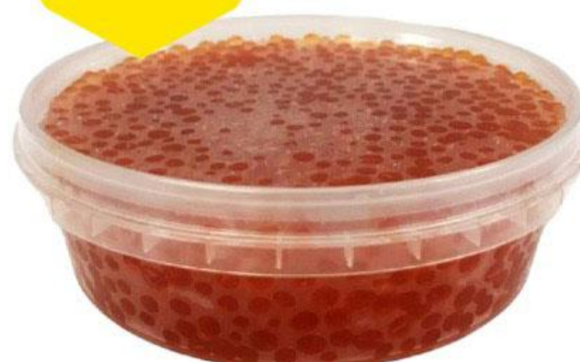
Икра лососевая ТУН горбуши зернистая, 100 г