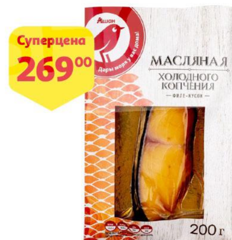
Рыба масляная АШАН филе-кусочек холодного копчения, 200 г