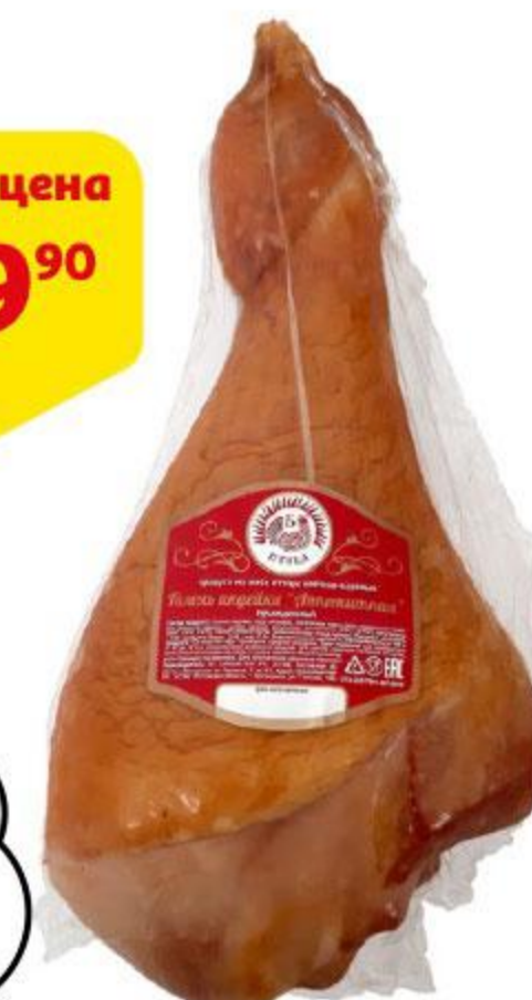
Голень индейки Б ПТИЦА Аппетитная, 100 г