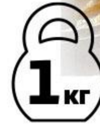
Кролик ЛИПЕЦКИЙ КРОЛИК в апельсиновом маринаде охлажденный, 1 кг