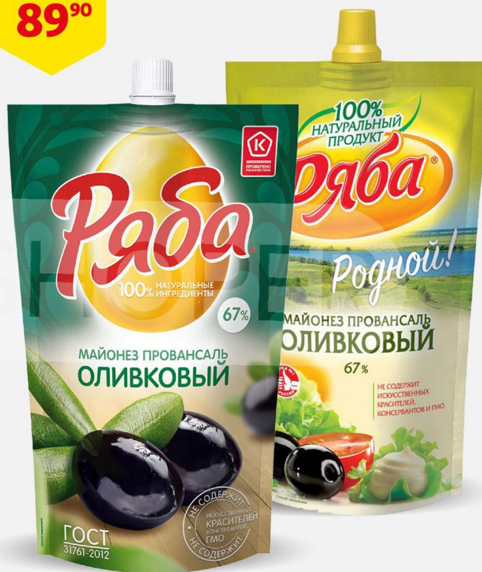
Майонез РЯБА Провансаль оливковый 67%, 372 г