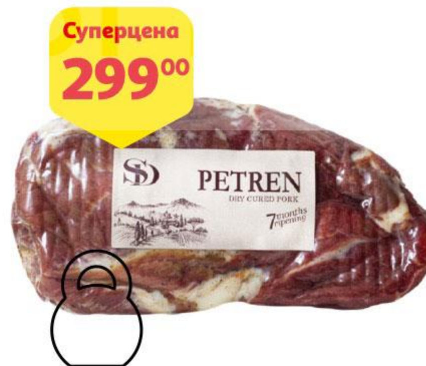
Деликатес из свинины СЫТНЫЙ ДОМ Petren сыровяленый, 100 г