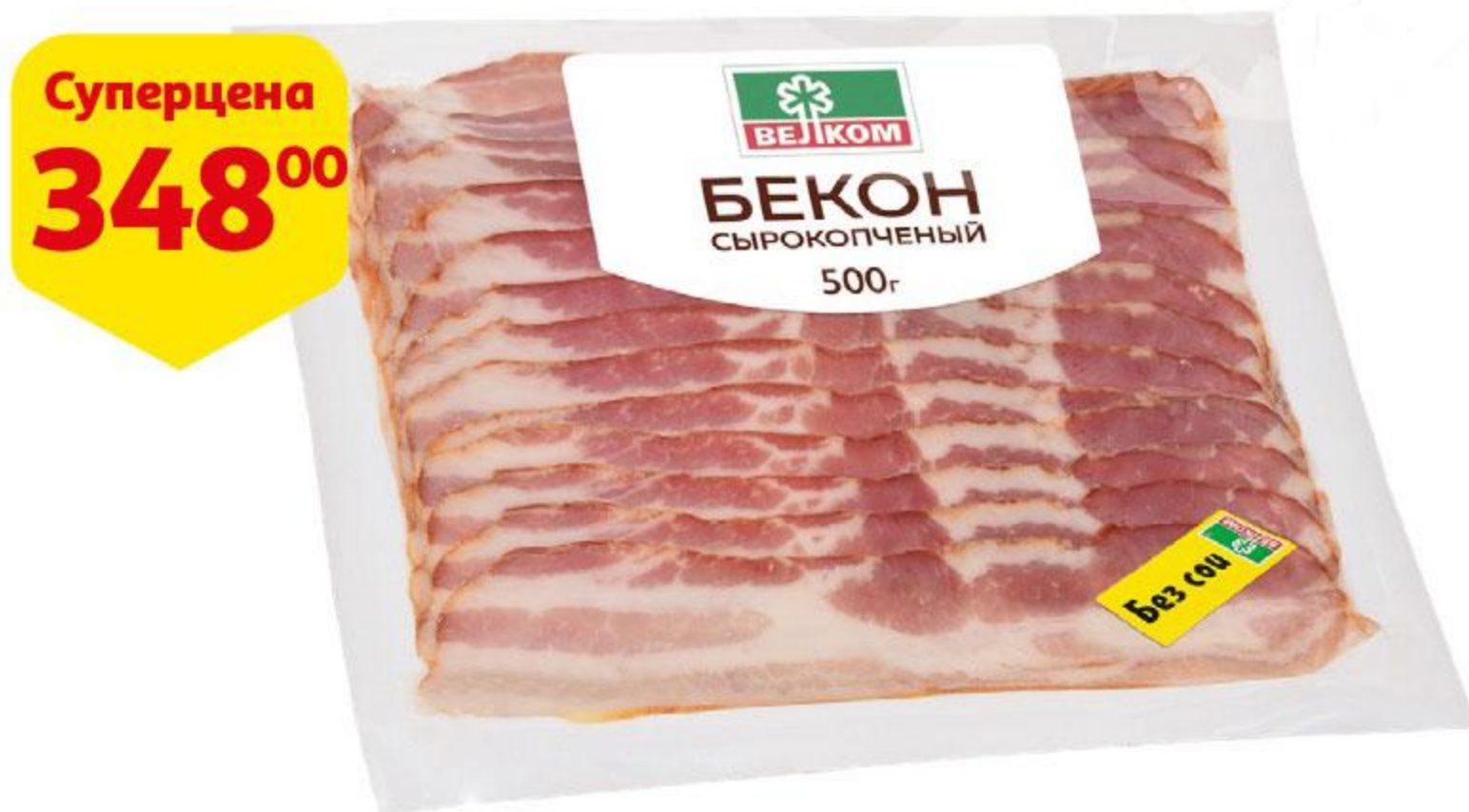
Бекон ВЕЛКОМ сырокопченый нарезка, 500 г