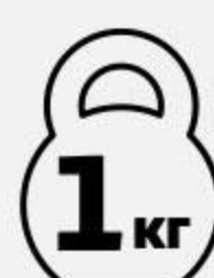
Шейка свиная ЧЕРКИЗОВО в маринаде для запекания охлажденная, 1 кг