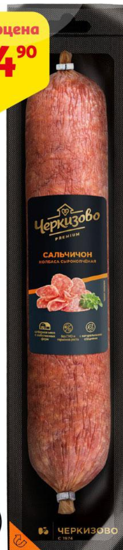
Колбаса ЧЕРКИЗОВО Сальчичон сырокопченая, 100 г