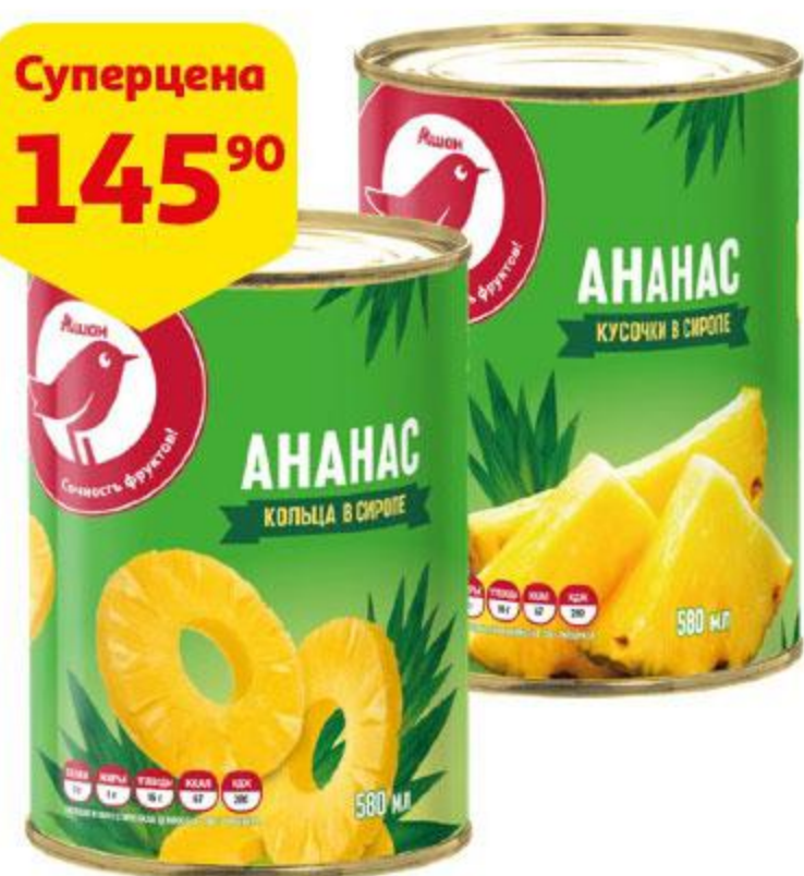
Ананасы АШАН кольца / кусочки в сиропе, 580 мл