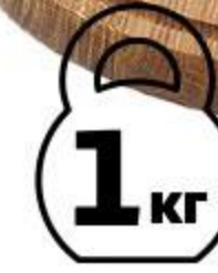
Марлин филе холодного копчения, 1 кг