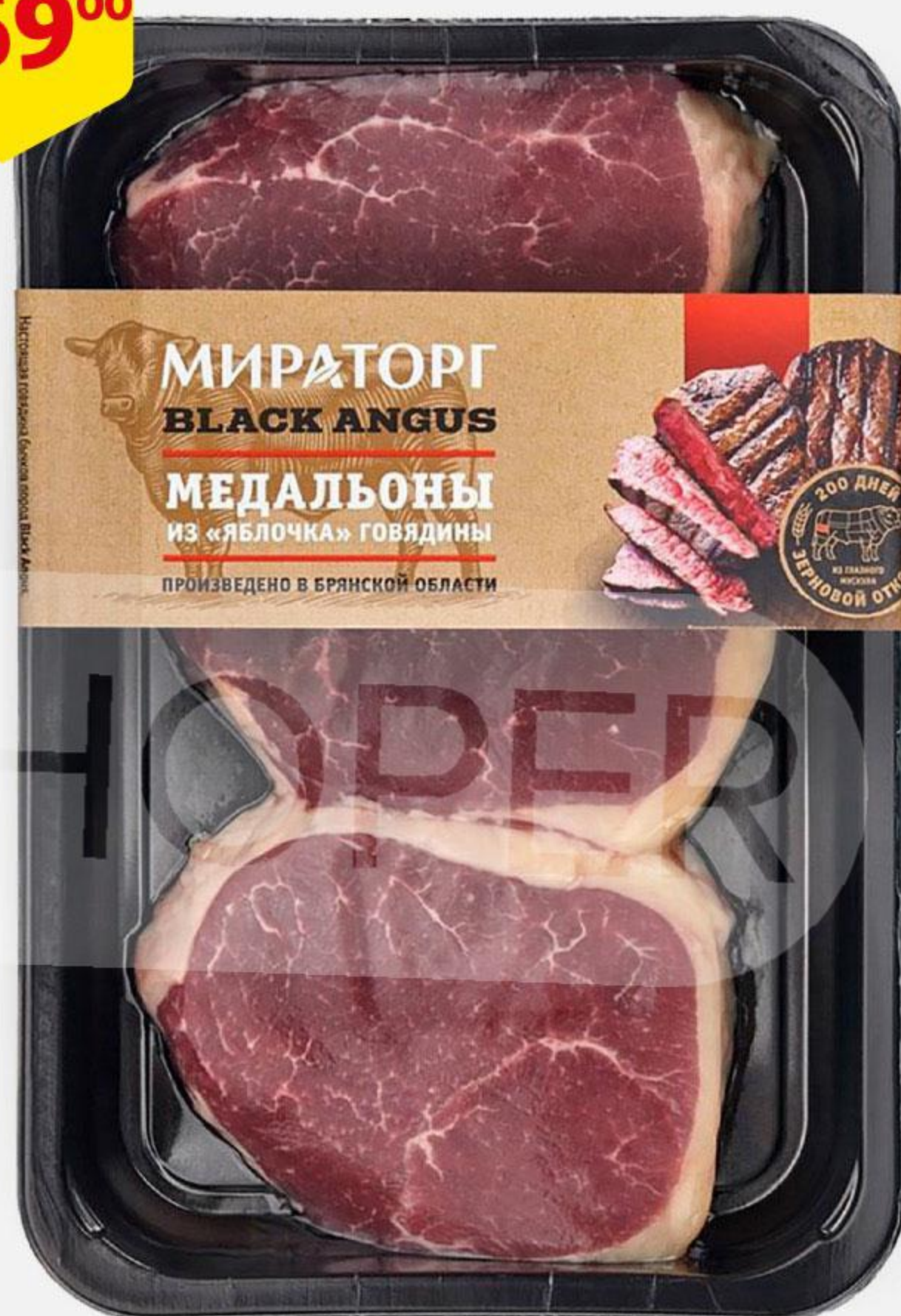
Медальоны МИРАТОРГ говяжьи из яблочка охлажденные, 490 г