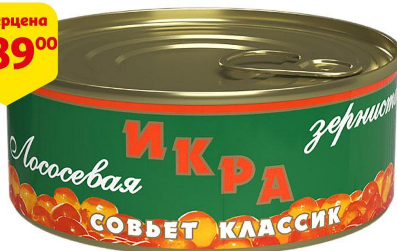
Икра лососевая СОВЬЕТ Классик, 105 г