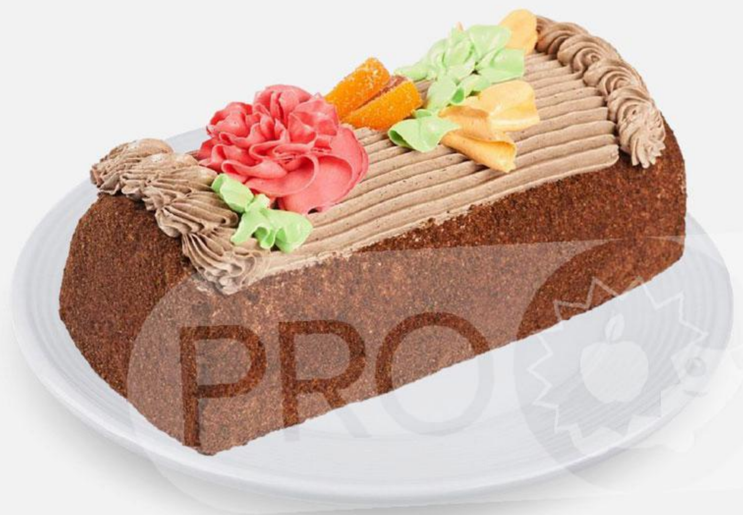
Торт Сказка, 450 г