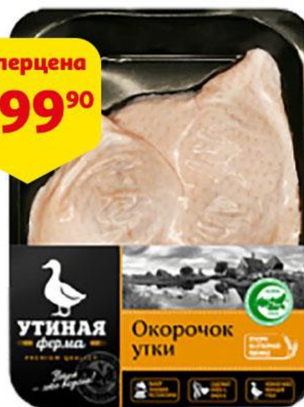
Окорочок утки УТИНАЯ ФЕРМА охлажденный, 470 г