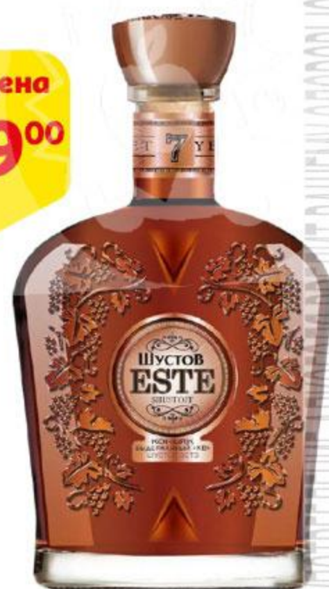
Коньяк ШУСТОФФ Эсте, 0,5 л