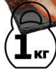
Рыба масляная ОЛИВА кусок холодного копчения, 1 кг