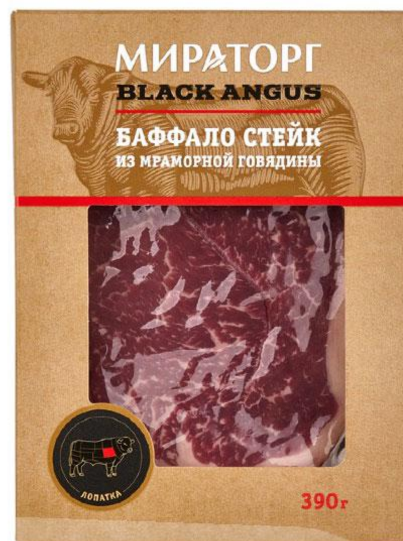
Стейк МИРАТОРГ Баффало говяжий охлажденный, 390 г