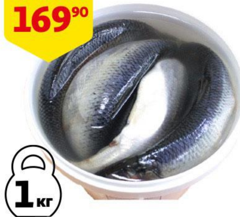
Сельдь ОЛИВА Тихоокеанская слабосоленая с головой, 1 кг