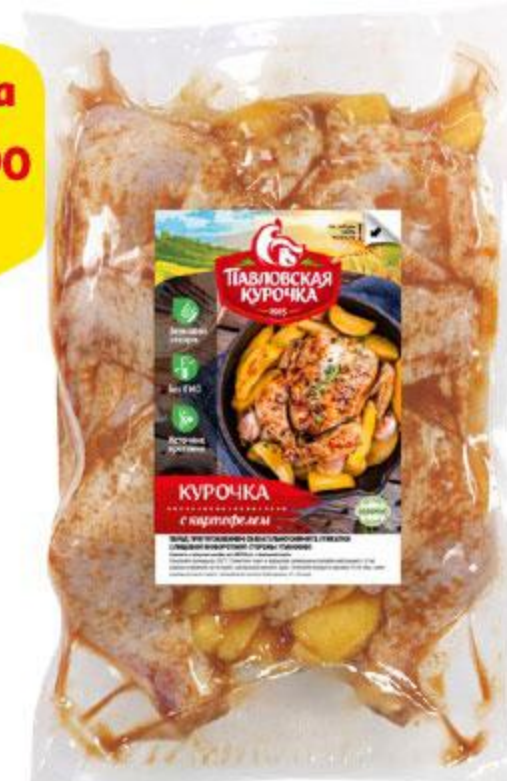
Курочка ПАВЛОВСКАЯ КУРОЧКА с картофелем в пикантном соусе, 1 кг