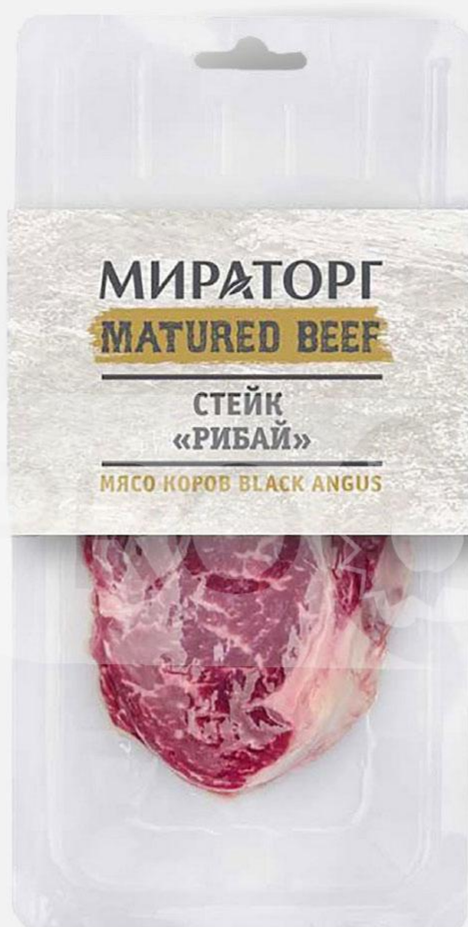
Стейк МИРАТОРГ Рибай охлажденный, 250 г