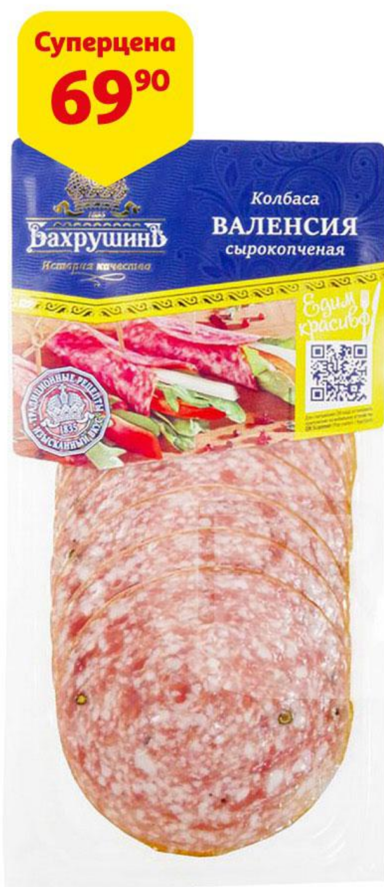
Колбаса БАХРУШИНЪ Валенсия сырокопченая нарезка, 70 г