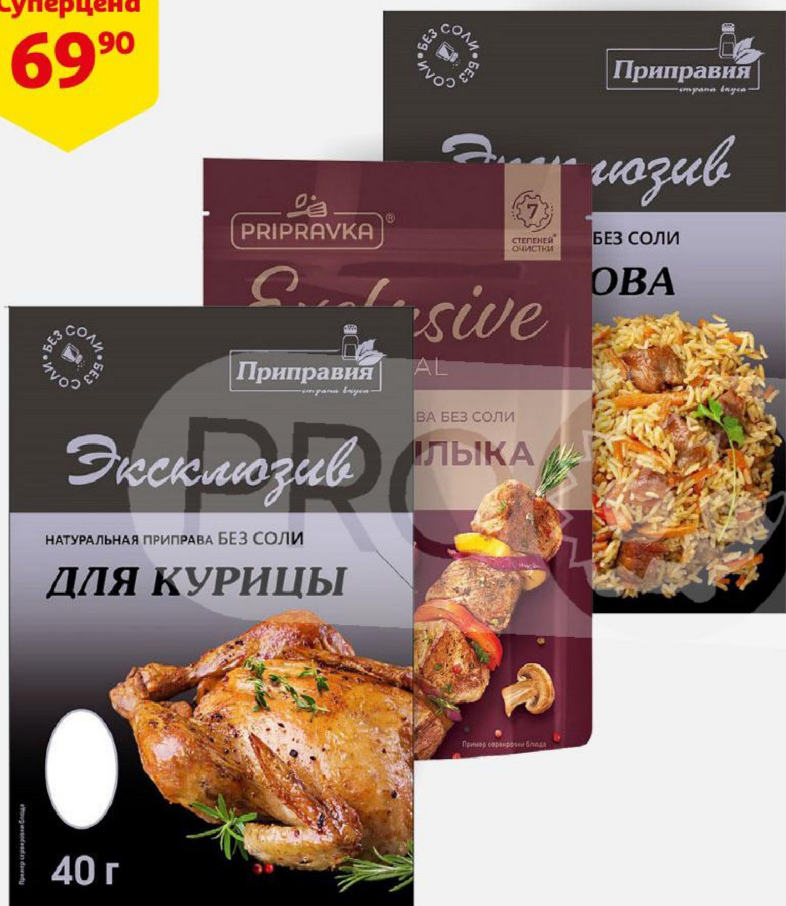
Приправа PRIPRAVKA Exclusive Professional натуральная без соли, 40-45 г, в ассортименте*