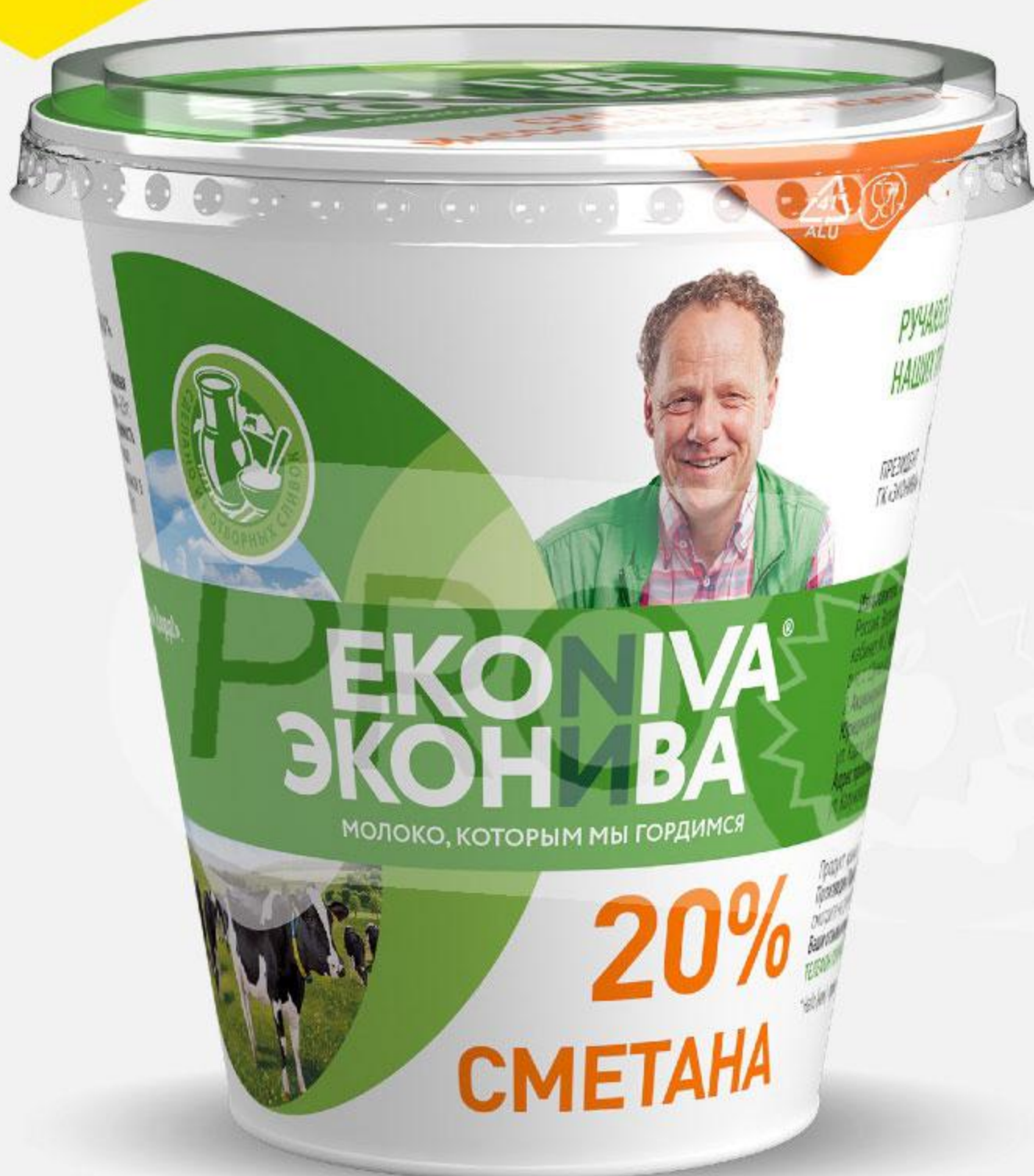
Сметана EKONIVA 20%, 300 г