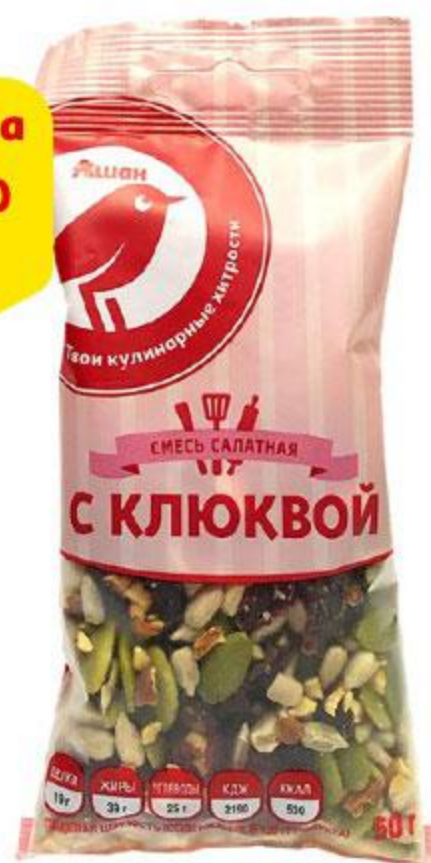
Смесь салатная АШАН с клюквой, 50 г