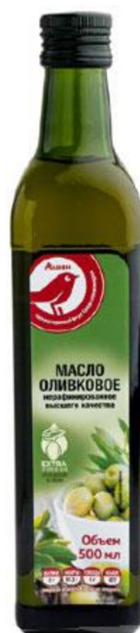
Масло оливковое АШАН нерафинированное, 500 мл