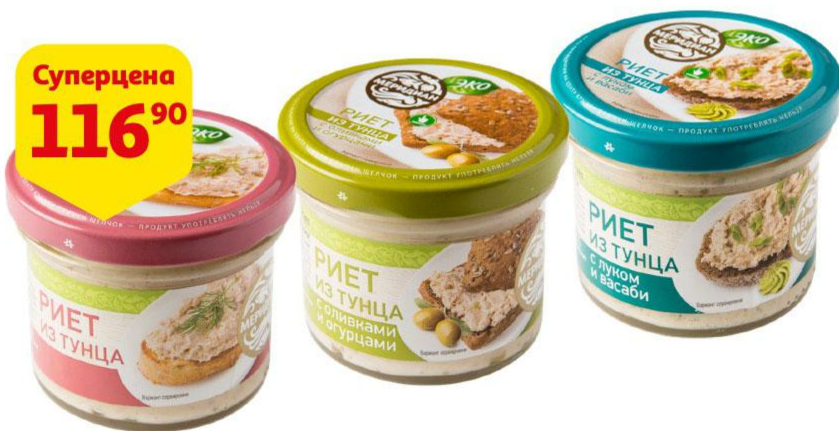
Риет МЕРИДИАН из тунца / с оливками и огурцами / с васabi и луком, 100 г