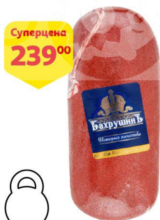
Бастурма БАХРУШИНЪ, 100 г