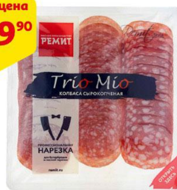
Колбаса РЕМИТ Trio Mio Ассорти сырокопченая нарезка, 100 г