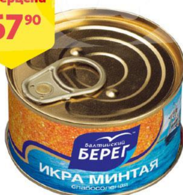
Икра минтая БАЛТИЙСКИЙ БЕРЕГ слабосоленая, 130 г