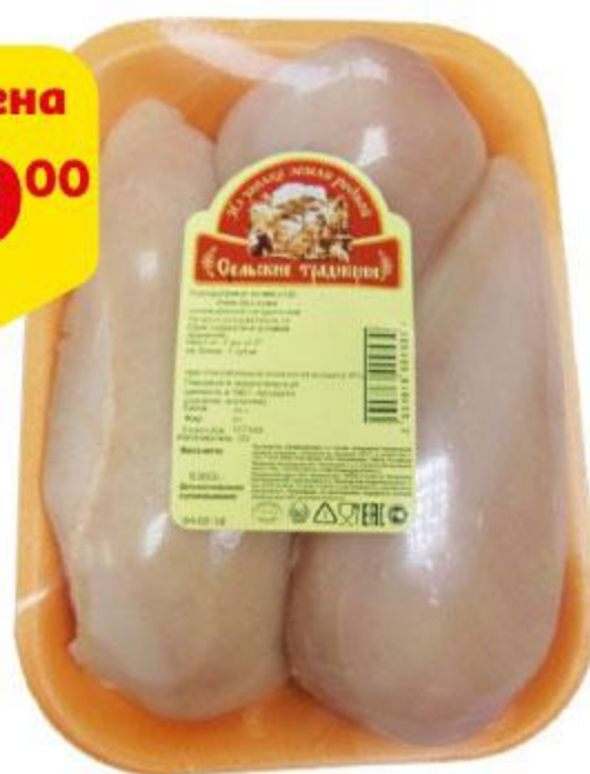
Филе цыпленка-бройлера СЕЛЬСКИЕ ТРАДИЦИИ без кожи охлажденное, 1 кг