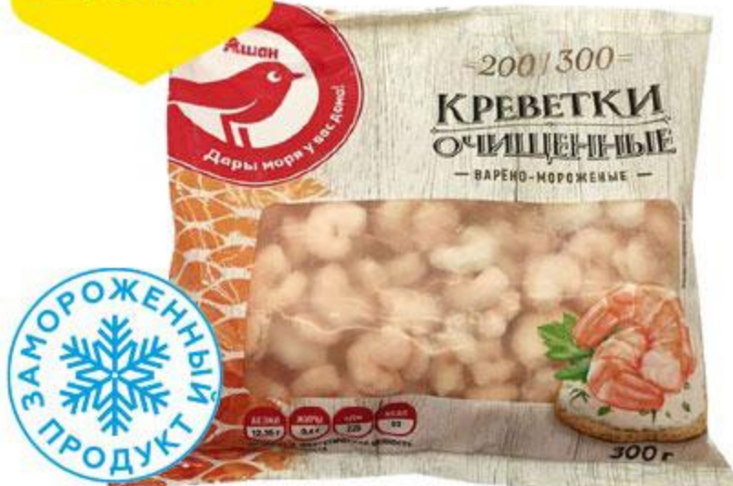
Креветки АШАН варено-мороженые очищенные 200/300, 300 г