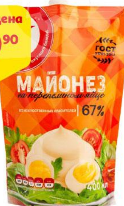
Майонез АШАН провансаль / на перепелином яйце 67%, 400 мл