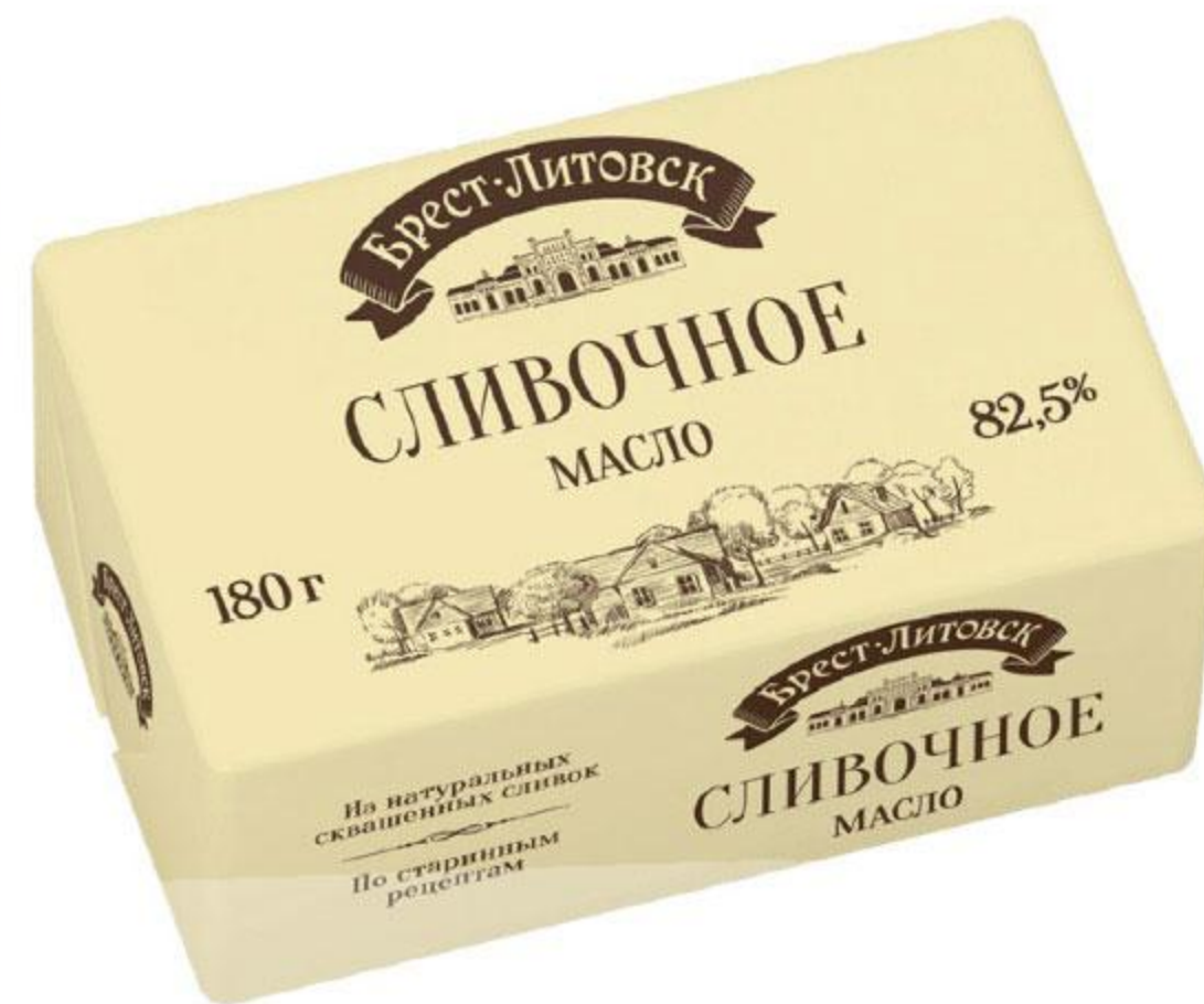
Масло сладкосливочное БРЕСТ-ЛИТОВСК несоленое 82,5%, 180 г