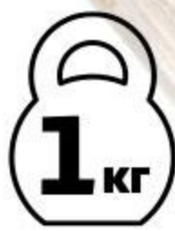
Цыпленок табака АГРОСИЛА охлажденный, 1 кг