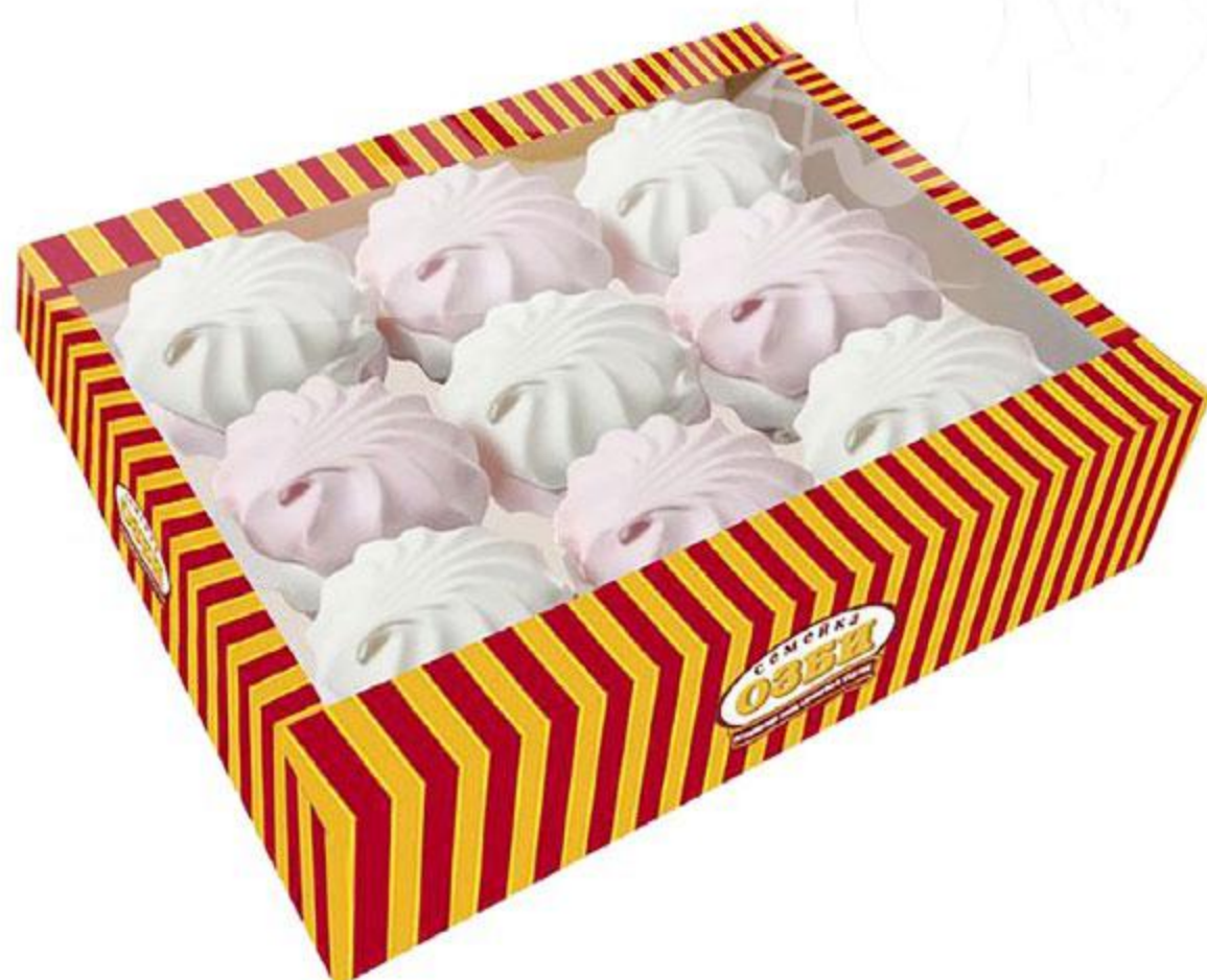
Зефир СЕМЕЙКА ОЗБИ ванильный / бело-розовый, 540 г