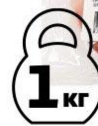
Мякоть корейки свиной АШАН охлажденная, 1 кг