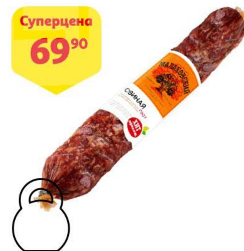
Колбаса МАЛАХОВСКИЙ МК Свиная сырокопченая, 100 г