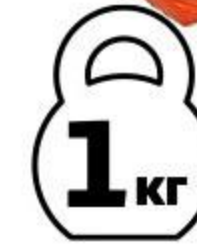
Кижуч холодного копчения спинка, 1 кг