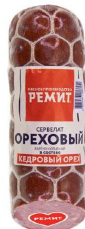
Колбаса РЕМИТ Сервелат Ореховый варено-копченый, 360 г