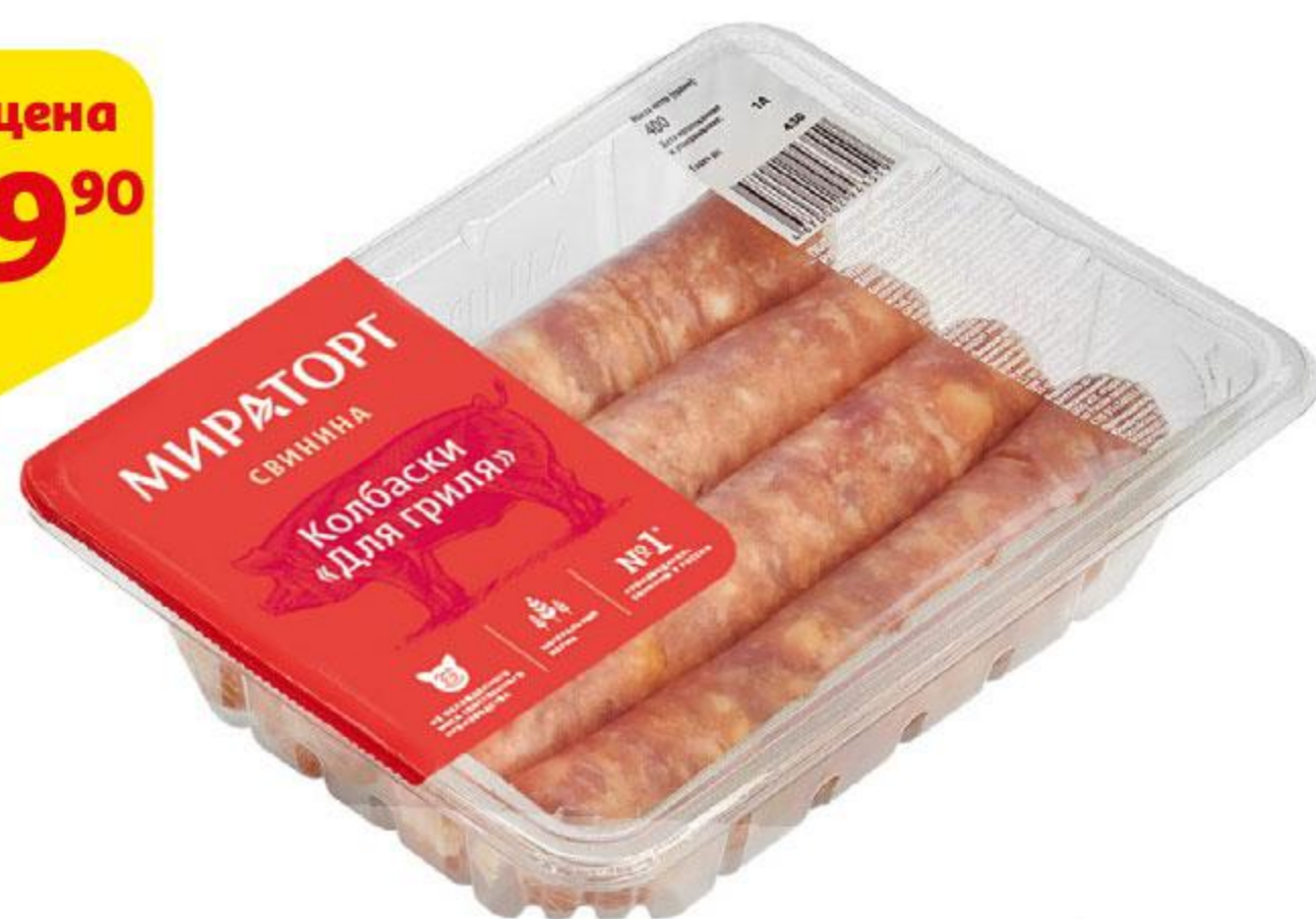
Колбаски МИРАТОРГ Для гриля охлажденные, 400 г