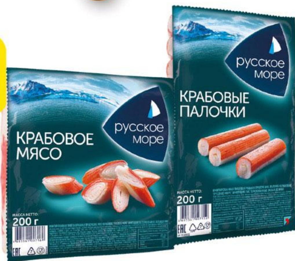
Крабовые палочки / крабовое мясо РУССКОЕ МОРЕ охлажденные, 200 г