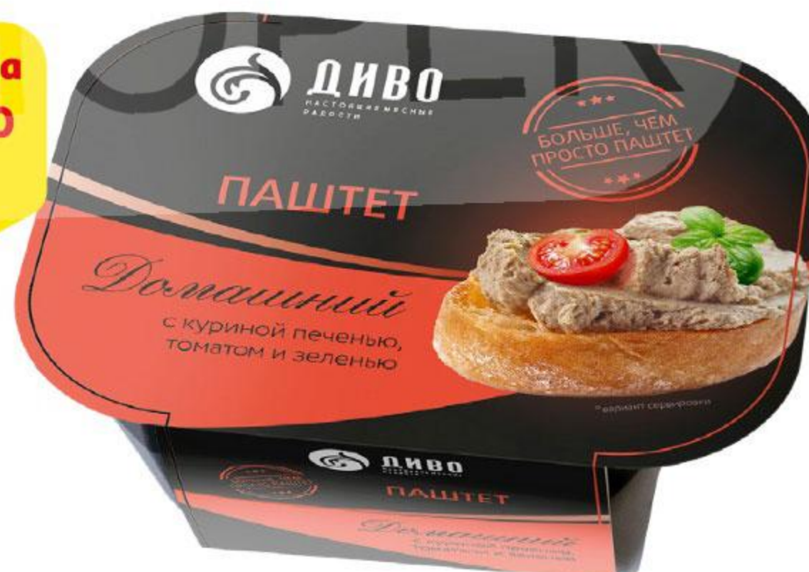
Паштет ДИВО Домашний с куриной печенью-томатом-зеленью, 150 г