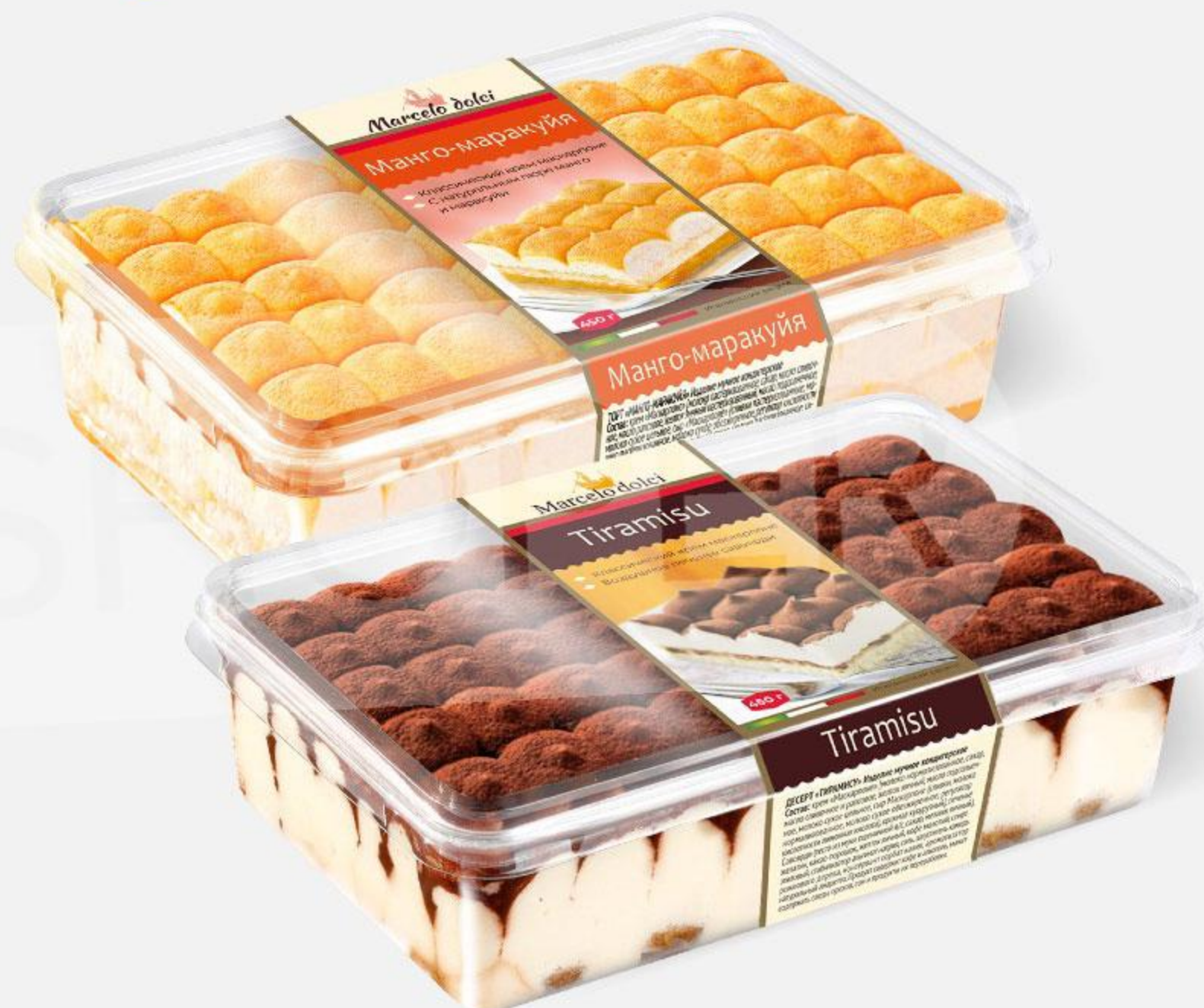
Торт MARCELO DOLCI Тирамису / Манго-маракуйя, 450 г