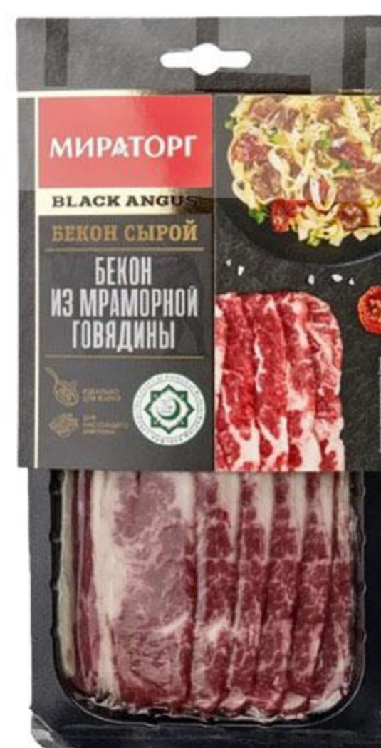
Бекон МИРАТОРГ говяжий мраморный охлажденный, 190 г