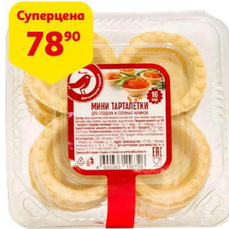
Тарталетки АШАН, 130 г