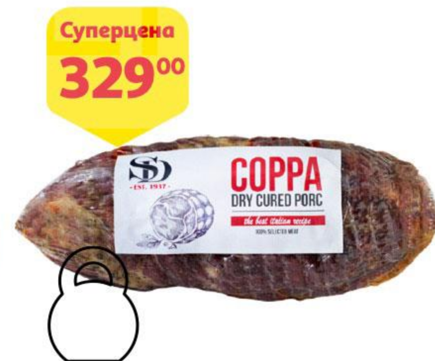
Деликатес из свинины СЫТНЫЙ ДОМ Coppa сыровяленый, 100 г