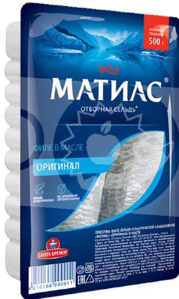
Филе сельди САНТА БРЕМОР Матиас деликатесное, 500 г