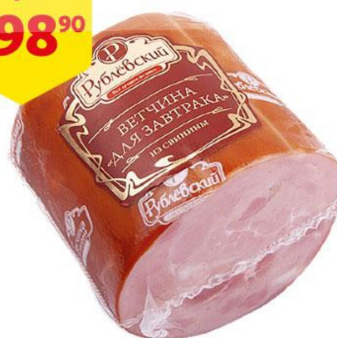
Ветчина РУБЛЕВСКИЙ Для завтрака, 400 г