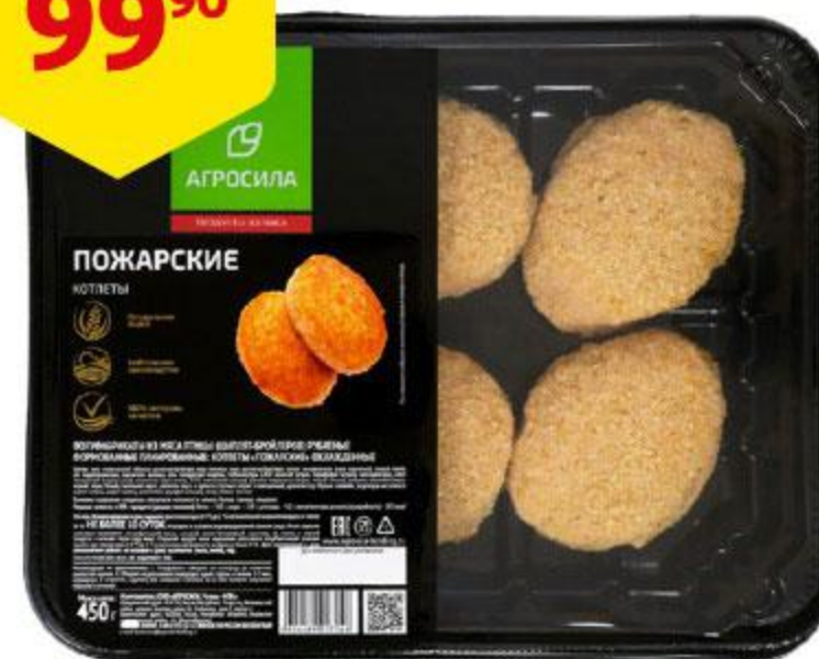
Котлеты ЧЕЛНЫ-БРОЙЛЕР Пожарские охлажденные, 450 г