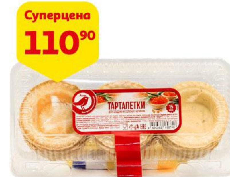
Тарталетки АШАН, 220 г