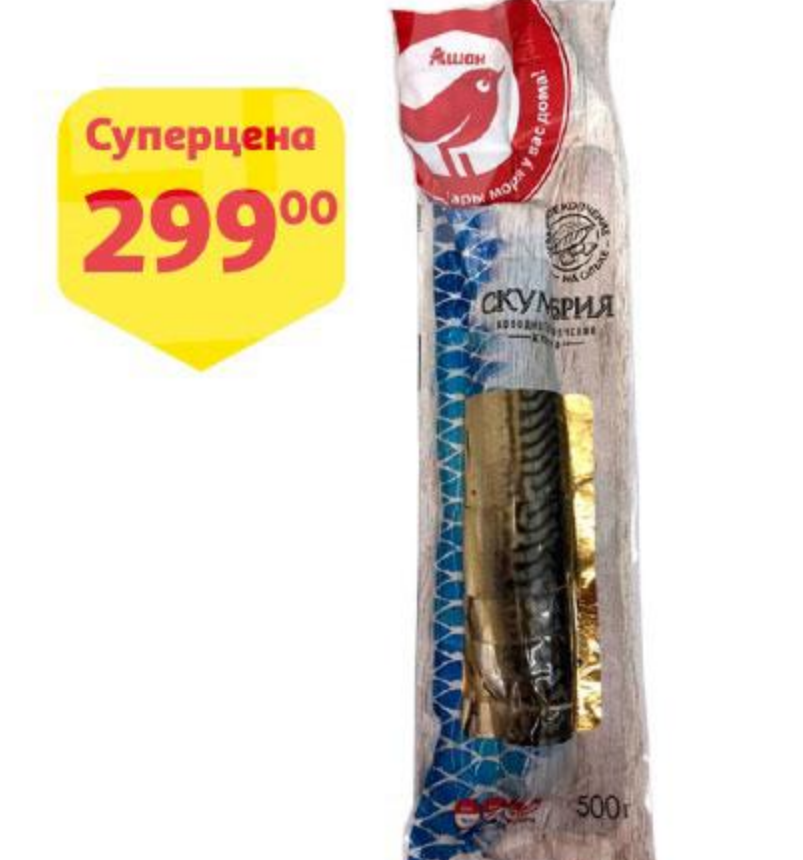
Скумбрия АШАН без головы холодного копчения, 500 г