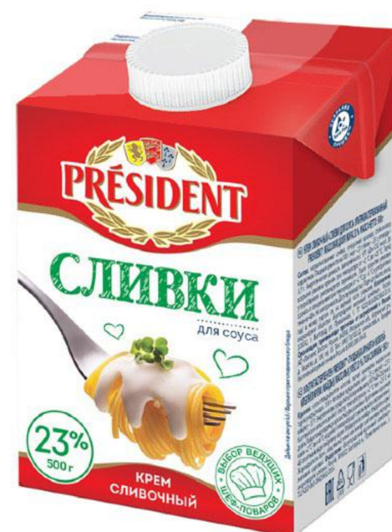
Сливки PRESIDENT ультрапастеризованные 23%, 500 мл