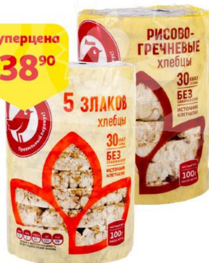
Хлебцы АШАН 5 злаков / рисово-гречневые, 100 г