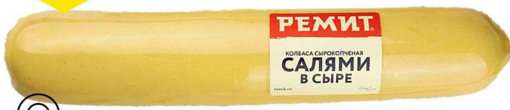
Колбаса РЕМИТ Салями в сыре сырокопченая, 100 г