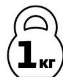
Ребрышки свиные МИРАТОРГ Барбекю охлажденные, 1 кг