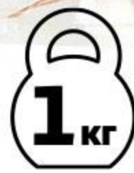
Хвост говяжий МИРАТОРГ охлажденный, 1 кг