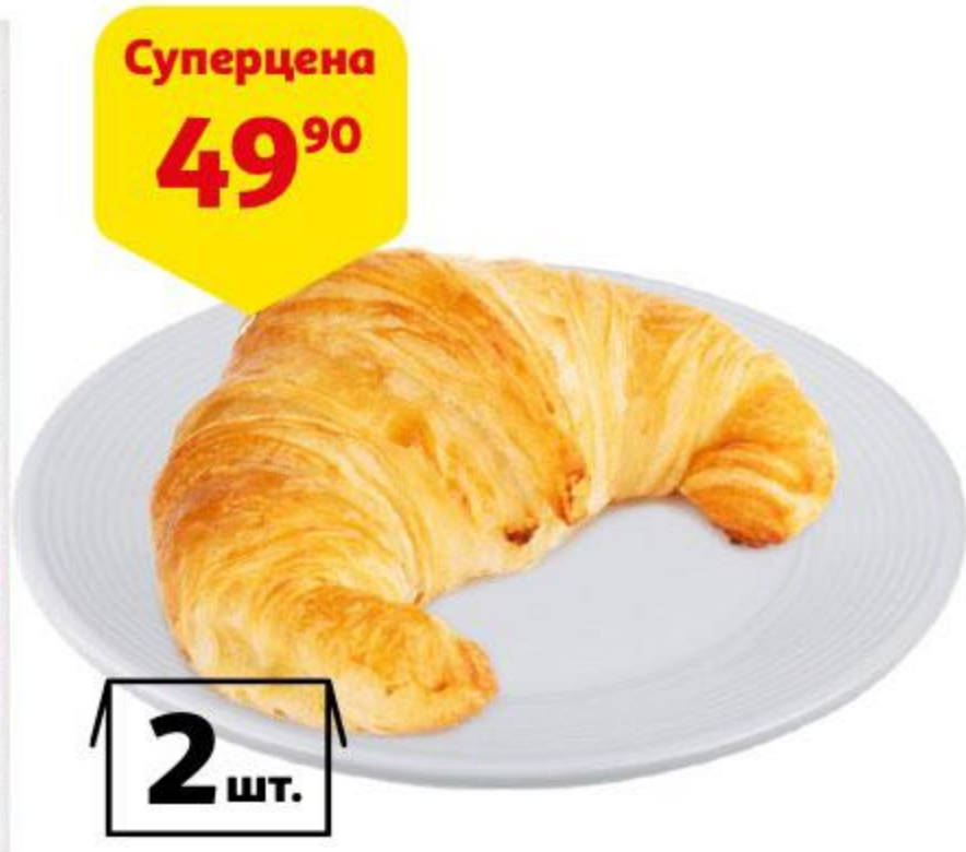
Круассан на сливочном масле, 2 шт.