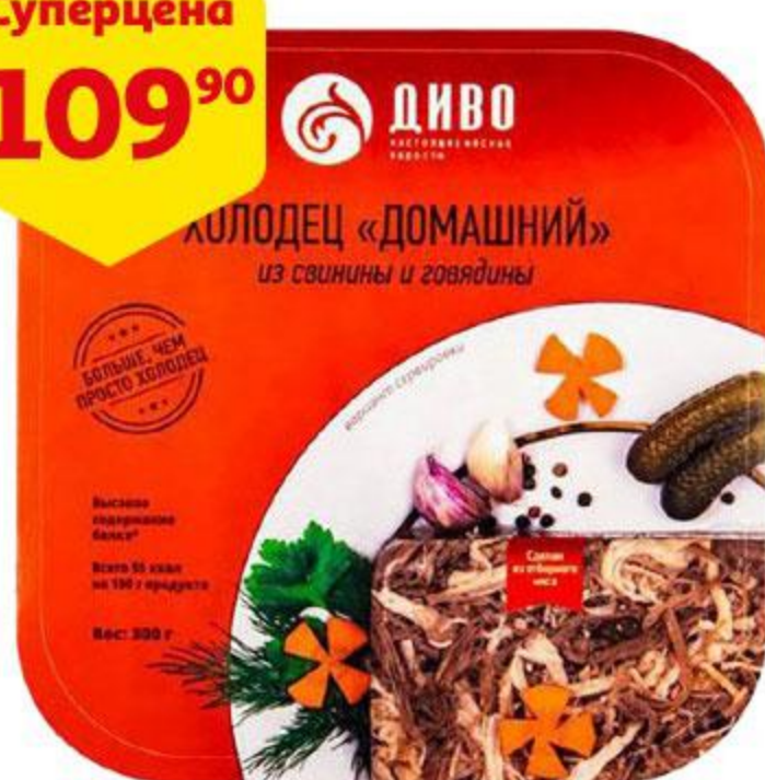
Холодец ДИВО Домашний из свинины и говядины, 300 г