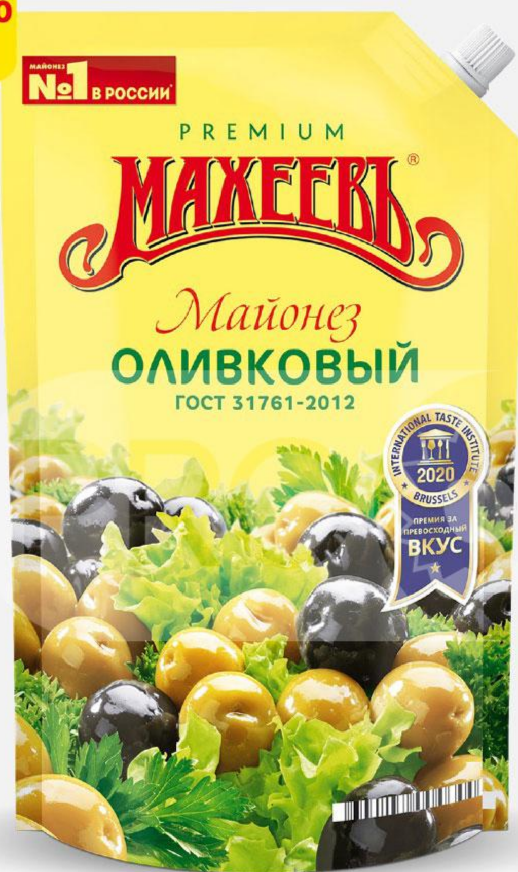
Майонез МАХЕЕВЪ оливковый 50,5%, 770 г