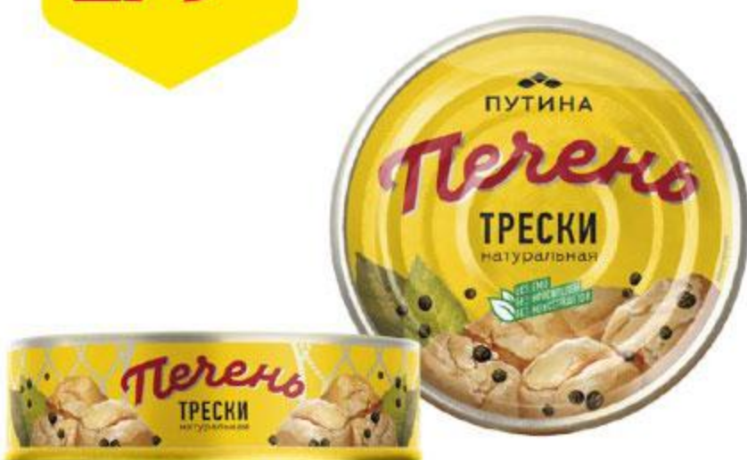
Печень трески ПУТИНА, 150 г