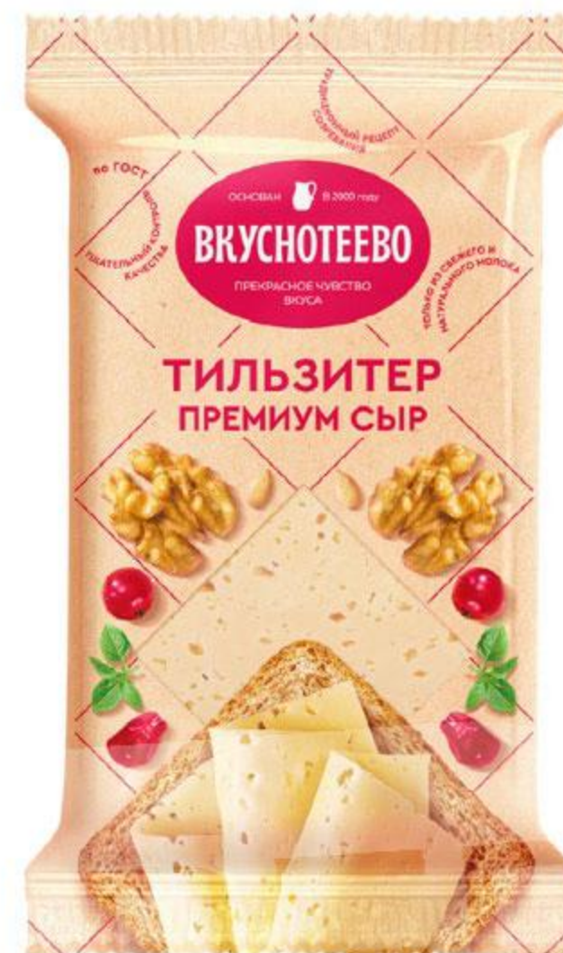
Сыр полутвердый ВКУСНОТЕЕВО Тильзитер Премиум 45%, 200 г