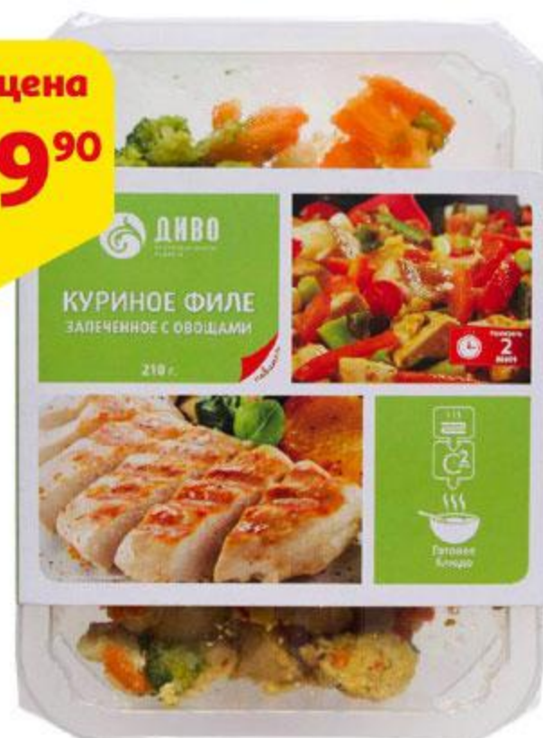
Филе куриное ДИВО запеченное с овощами, 210 г