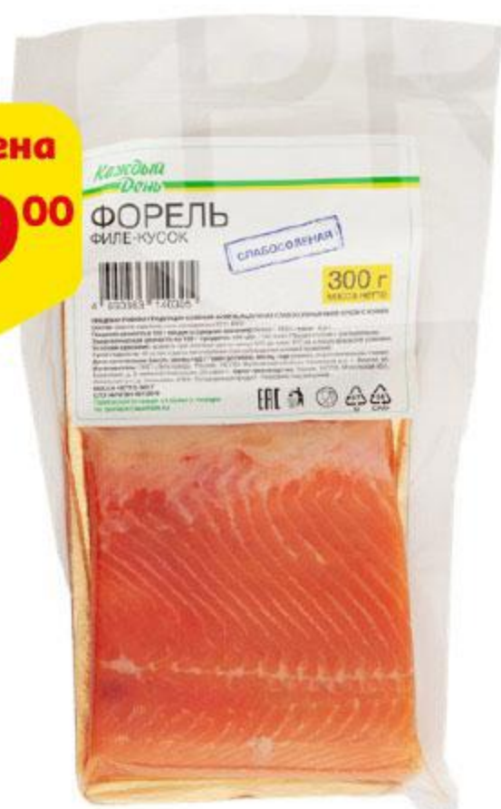
Форель КАЖДЫЙ ДЕНЬ филе-кусочек слабой соли, 300 г