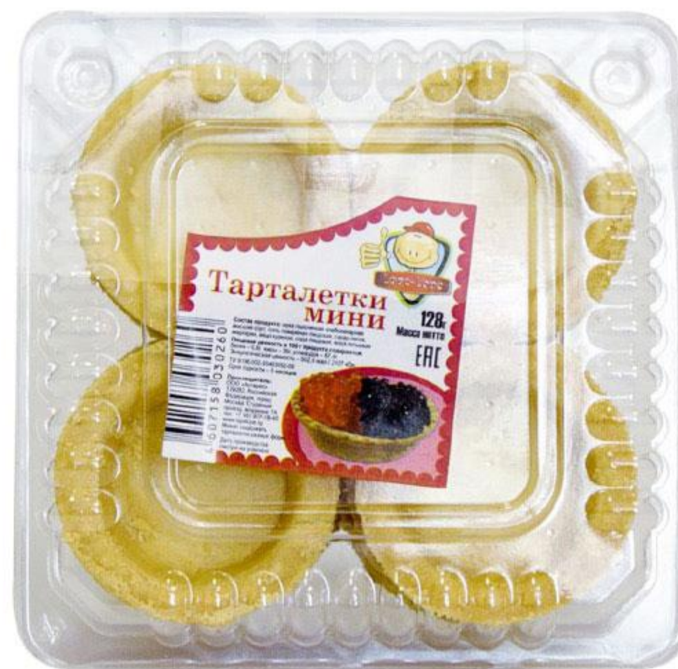
Тарталетки LOPE-LOPE мини, 128 г