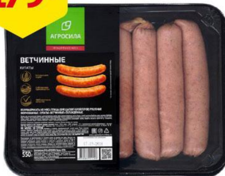
Купаты ЧЕЛНЫ-БРОЙЛЕР Ветчинные охлажденные, 550 г