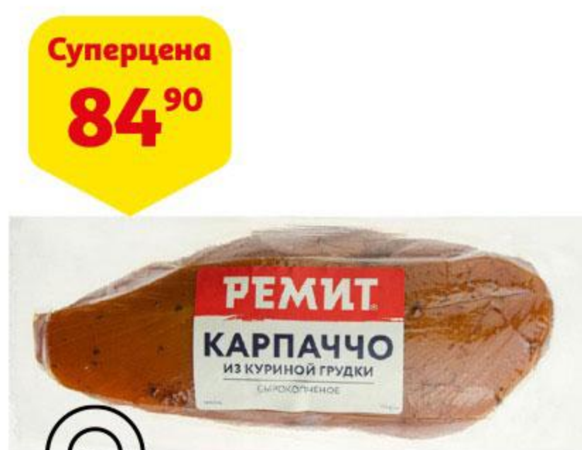
Карпаччо РЕМИТ из куриной грудки сырокопченое, 100 г