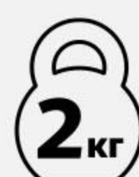
Мука МАКФА пшеничная высший сорт, 2 кг