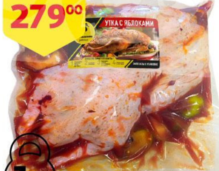
Утка ДОМАШНЯЯ УТОЧКА с яблоками охлажденная, 1 кг