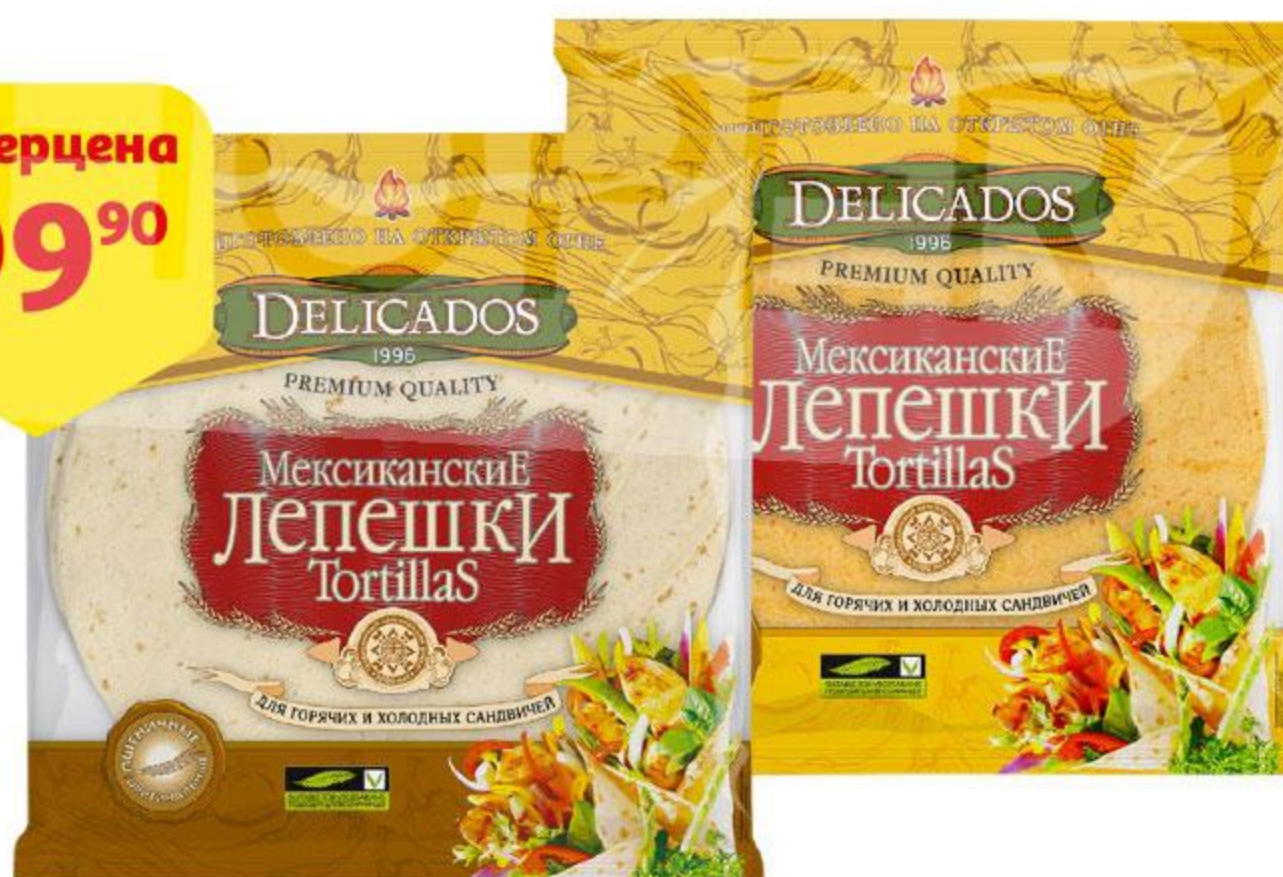
Лепешки DELICADOS Tortillas мексиканские пшеничные оригинальные / сырные / томатные, 400 г