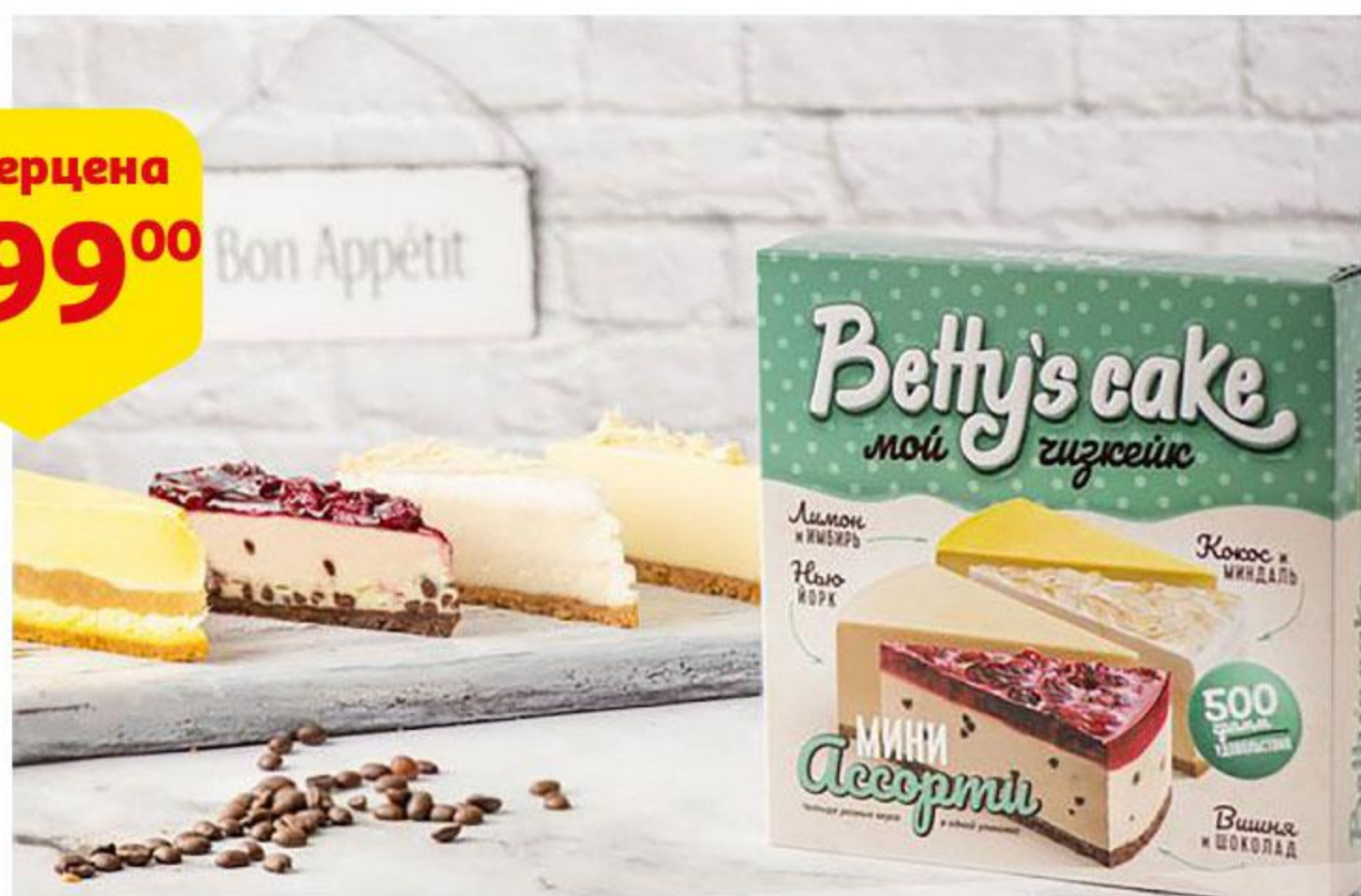
Пирог сырный BETTY'S CAKE Чизкейк Ассорти мини, 500 г