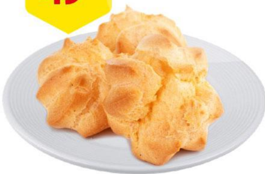
Шукеты, 100 г