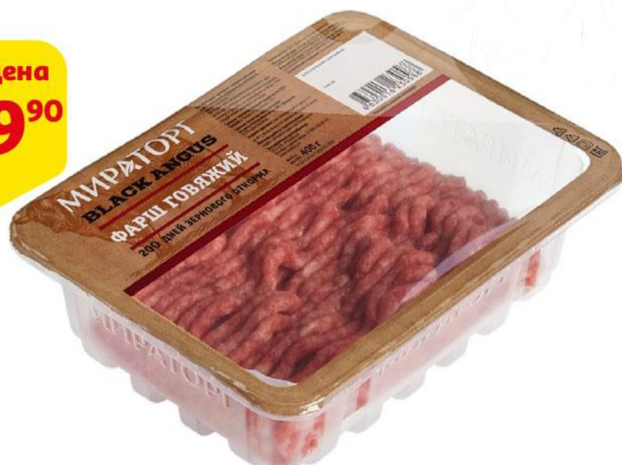
Фарш МИРАТОРГ из говядины Black Angus охлажденный, 400 г