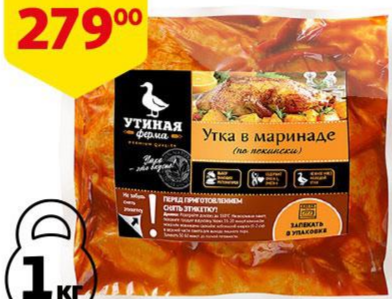
Утка УТИНАЯ ФЕРМА По-пекински в маринаде охлажденная, 1 кг