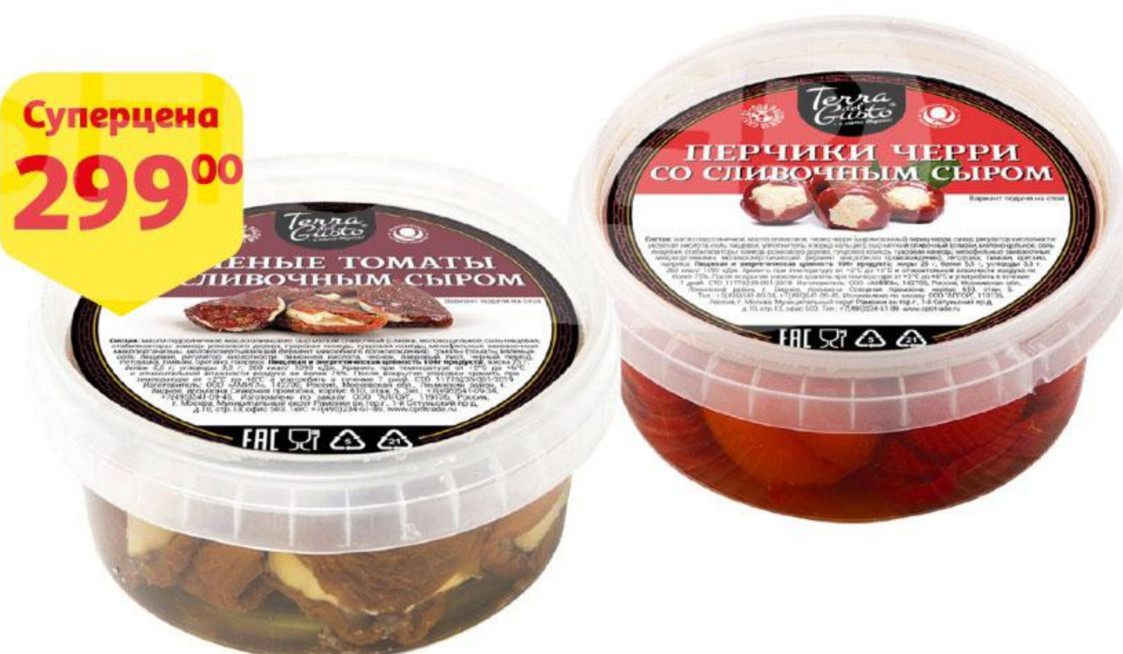
Вяленые томаты / Перец черри TERRA DEL GUSTO с сыром, 250 г