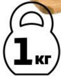
Горбуша горячего копчения тушка, 1 кг