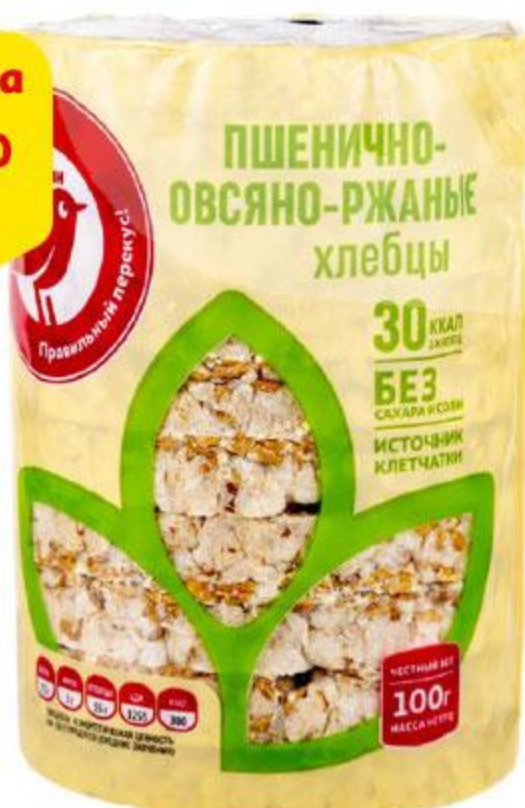
Хлебцы АШАН пшенично-овсяно-ржаные, 100 г