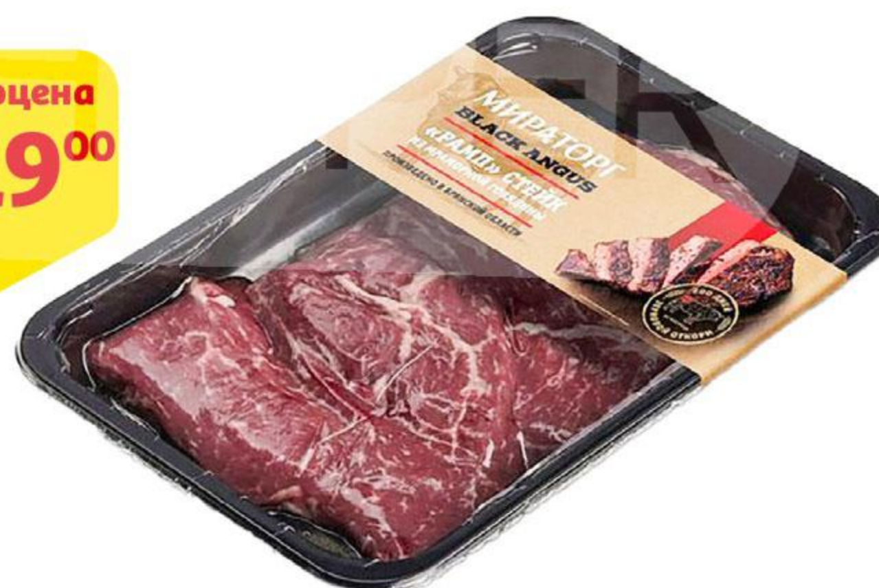
Стейк МИРАТОРГ Рамп из мраморной говядины Black Angus охлажденный, 480 г