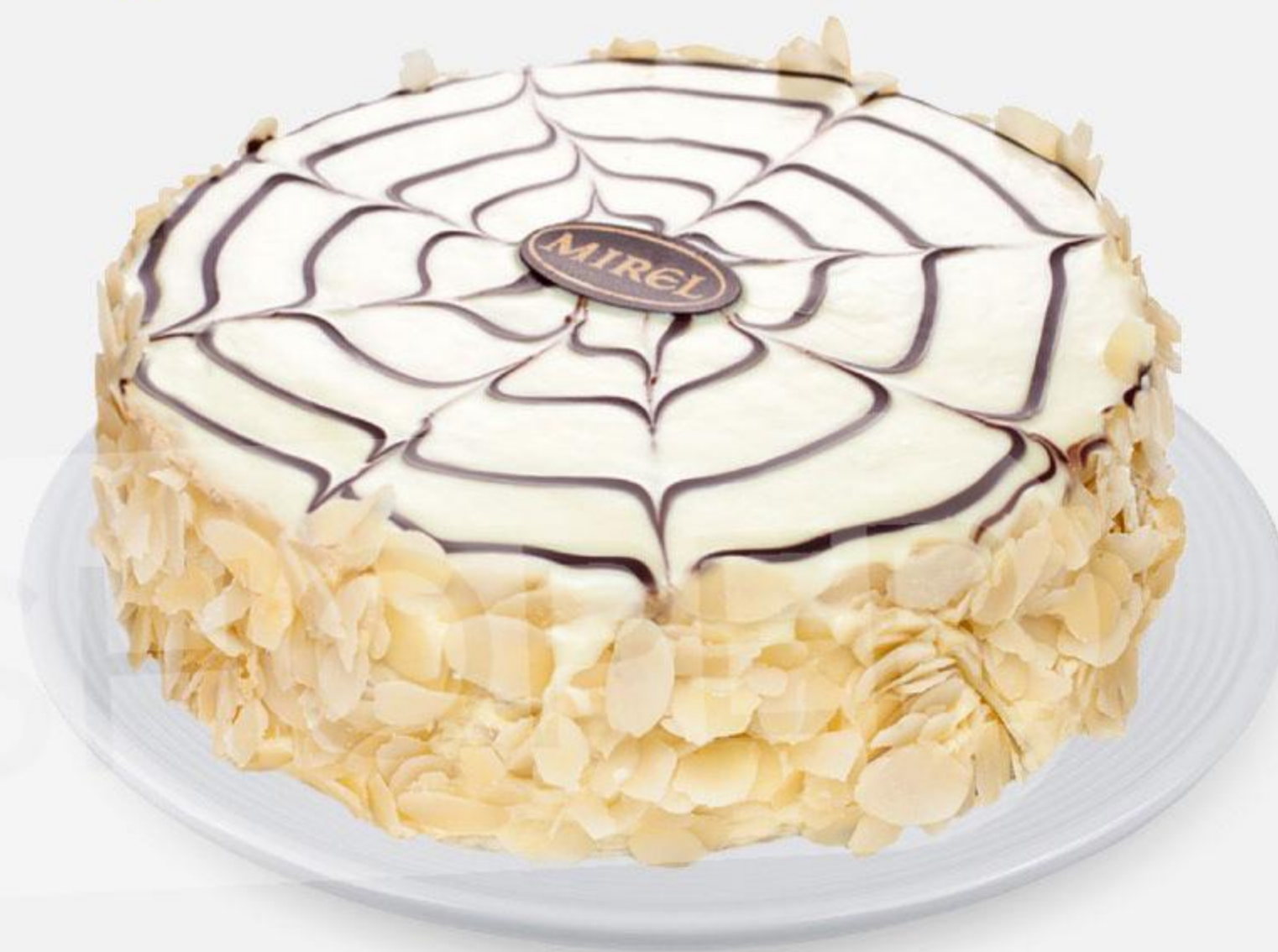
Торт MIREL Эстерхази, 650 г