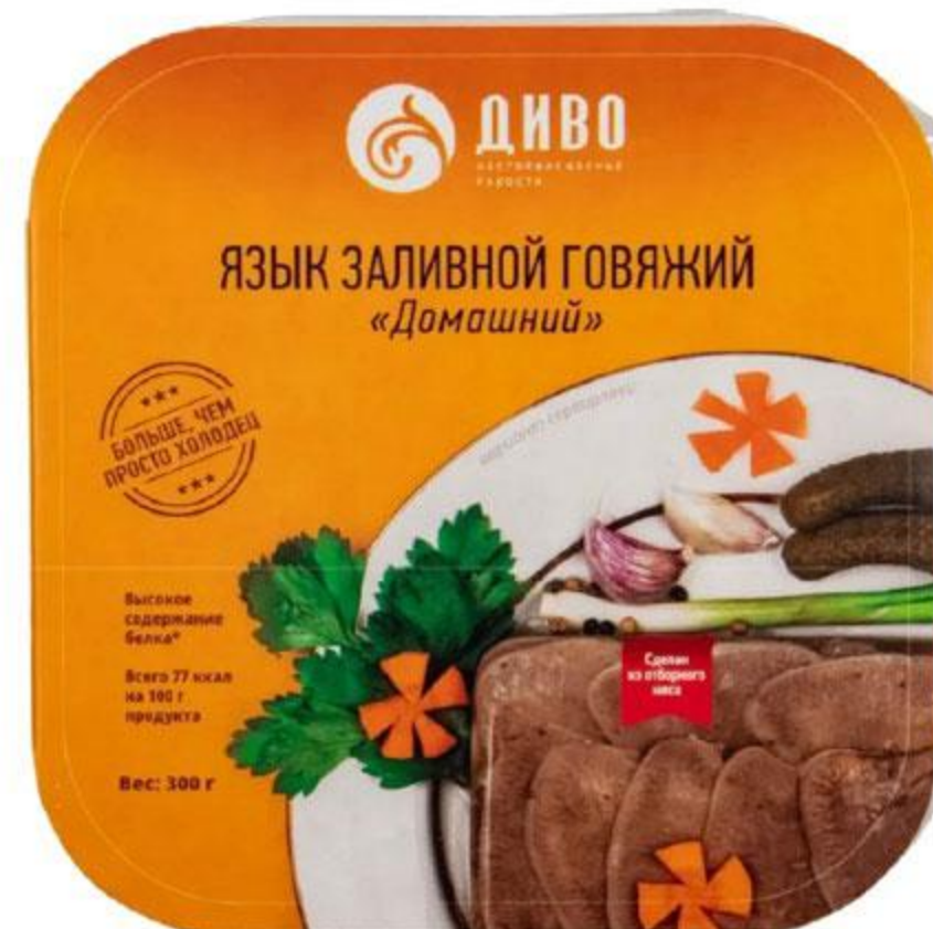
Язык ДИВО заливной говяжий Домашний, 300 г