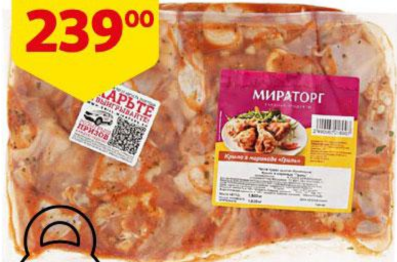
Крыло куриное МИРАТОРГ Гриль в маринаде охлажденное, 1 кг