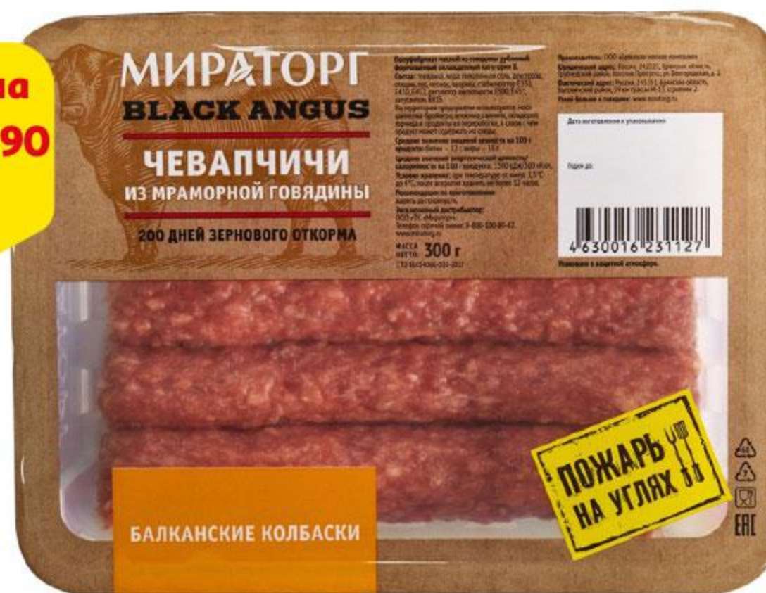
Колбаски МИРАТОРГ Чевапчичи из говядины Black Angus охлажденные, 300 г