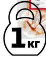
Рулька свиная МИРАТОРГ в специях для запекания охлажденная, 1 кг