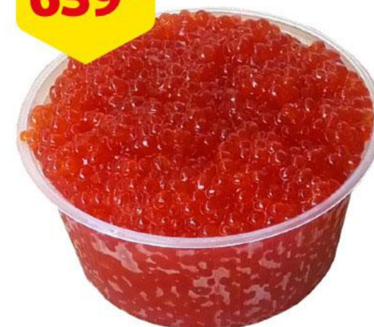
Икра нерки, 100 г