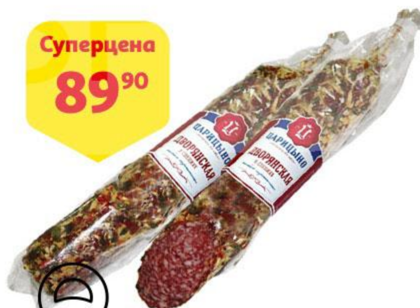
Колбаса ЦАРИЦЫНО Дворянская в специях сырокопченая, 100 г