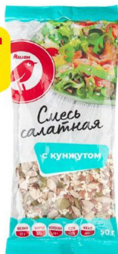
Смесь салатная АШАН с кунжутом, 50 г