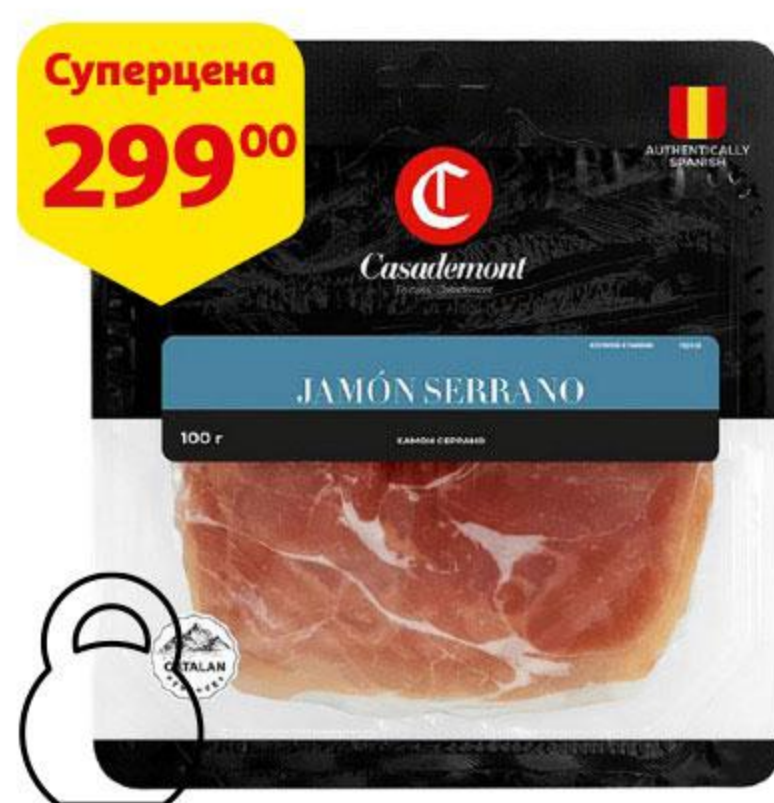
Хамон CASADEMONT Серрано сыровяленый нарезка, 100 г