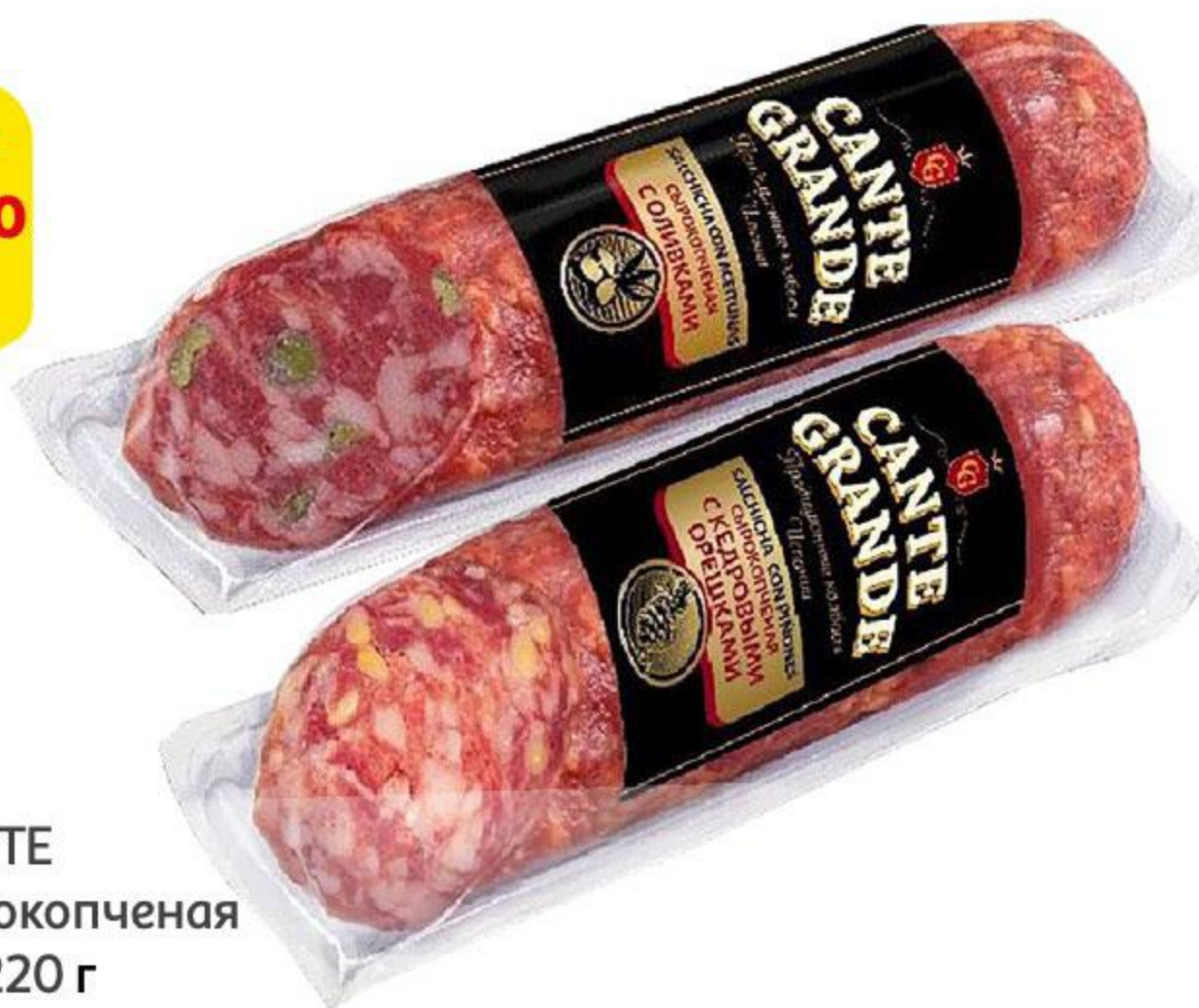
Колбаса CANTE GRANDE сырокопченая с оливками, 220 г