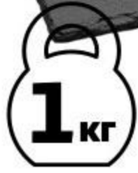
Нерка холодного копчения тушка, 1 кг