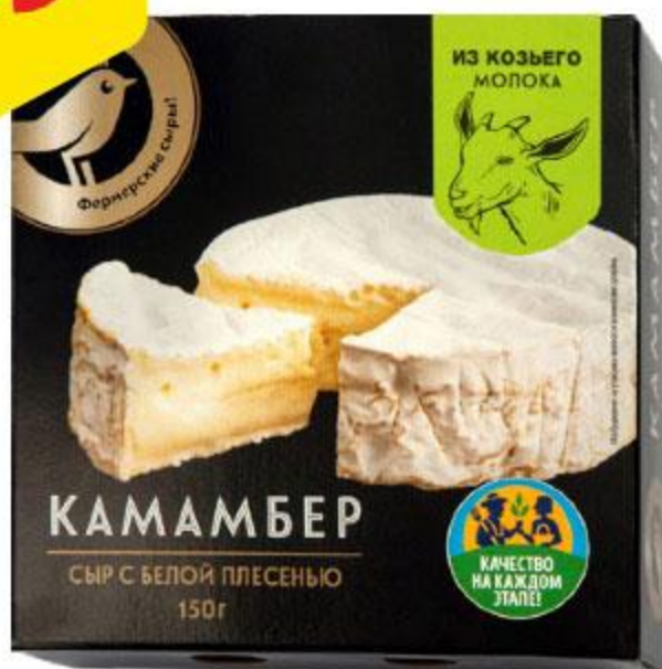
Сыр АШАН Камамбер из козьего молока, 150 г