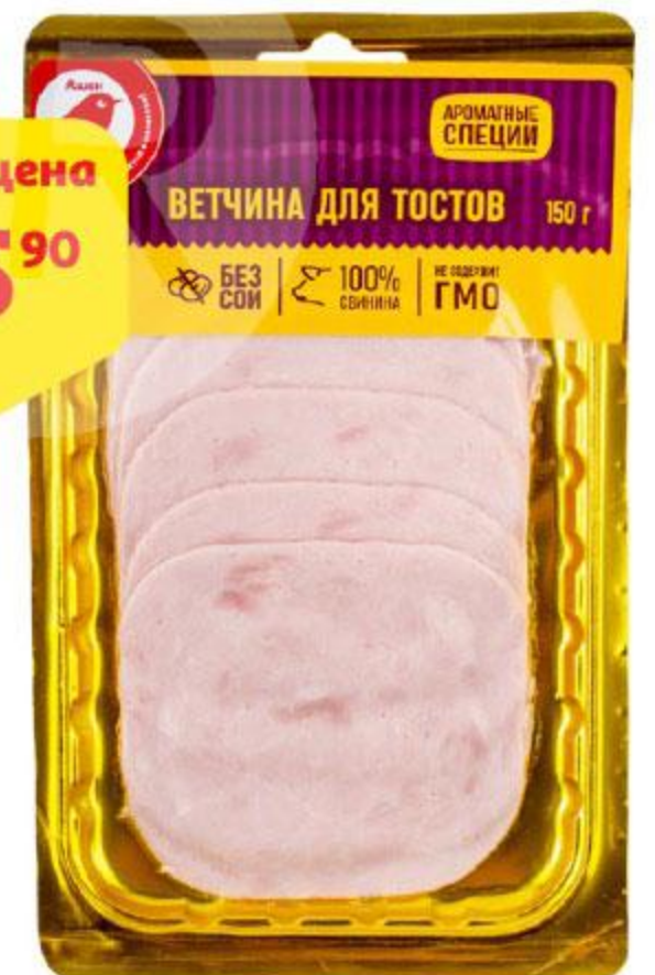
Ветчина АШАН для тостов нарезка, 150 г