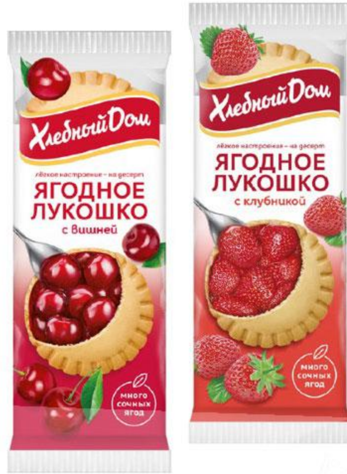
Ягодное лукошко ХЛЕБНЫЙ ДОМ, 140 г, в ассортименте*