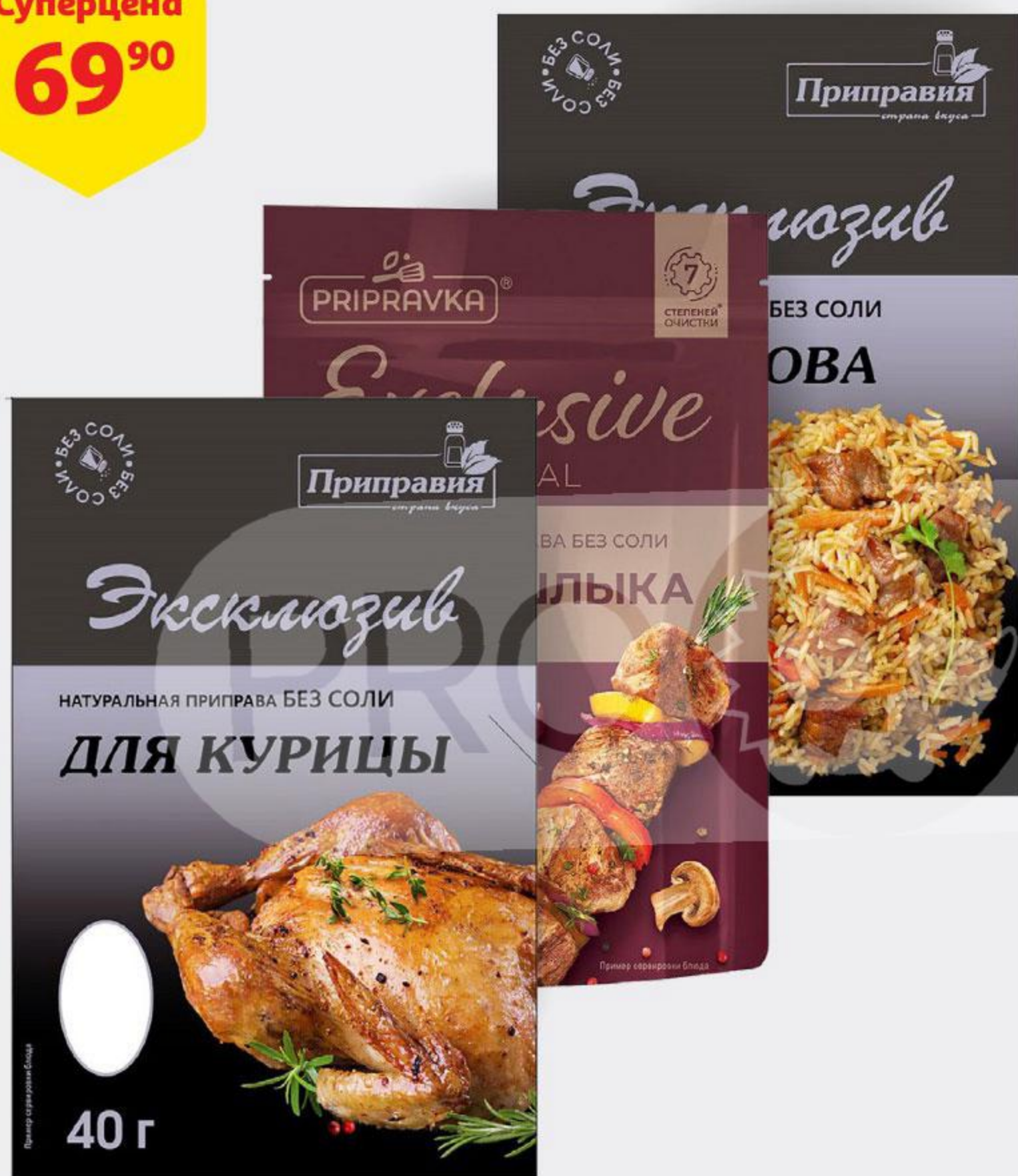
Приправа PRIPRAVKA Exclusive Professional натуральная без соли, 40-45 г, в ассортименте*