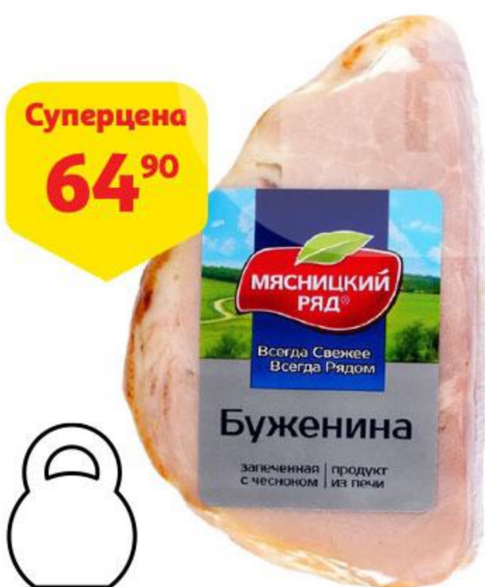
Буженина МЯСНИЦКИЙ РЯД запеченная варено-копченая, 100 г