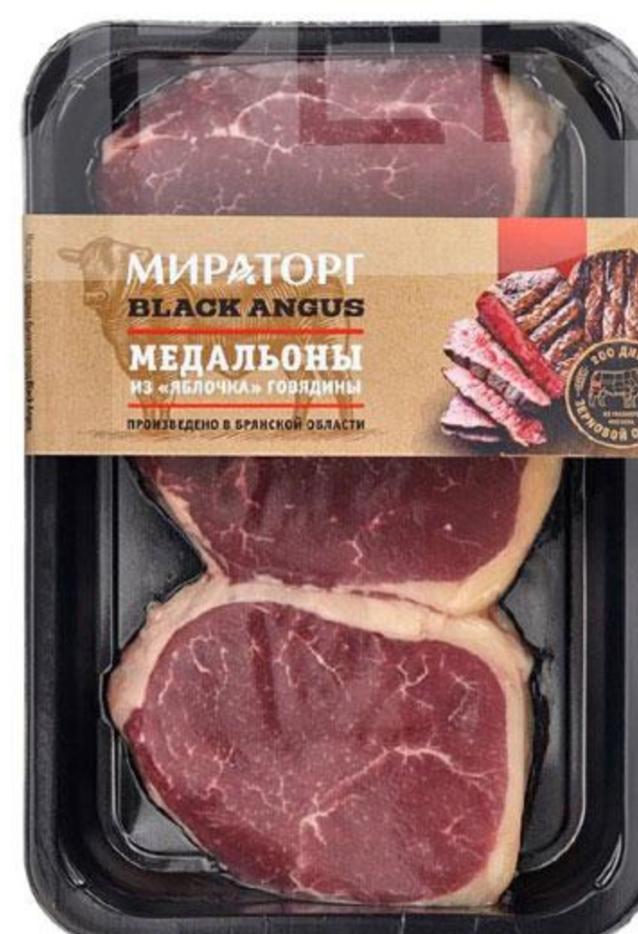
Медальоны МИРАТОРГ говяжьи из яблочка охлажденные, 490 г