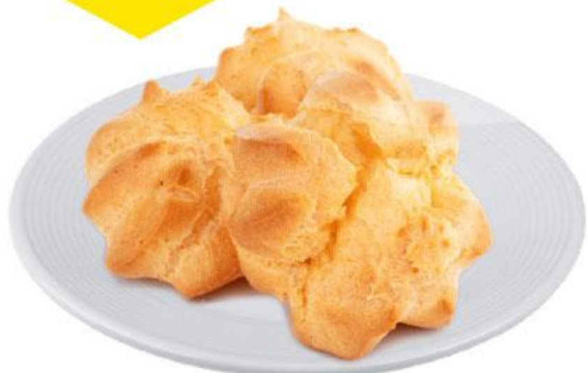
Шукеты, 100 г