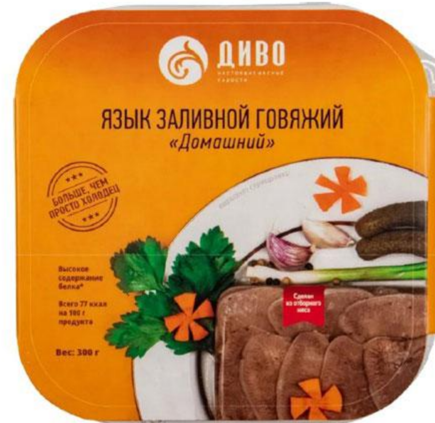
Язык ДИВО заливной говяжий Домашний, 300 г