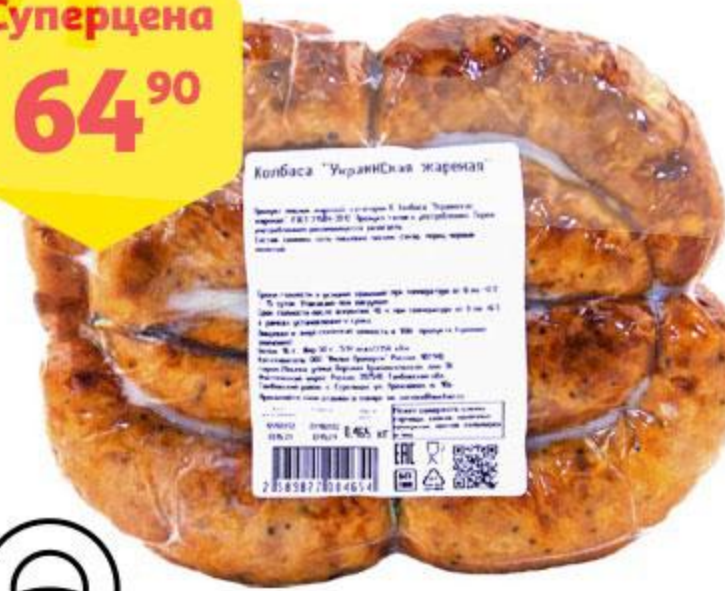
Колбаса АШАН Украинская жареная, 100 г