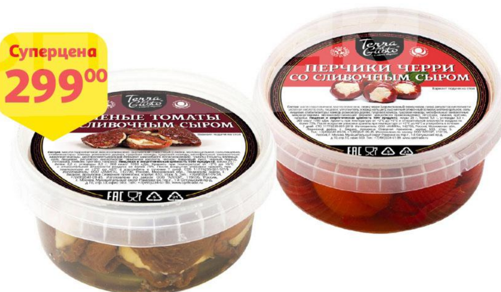
Вяленые томаты / Перец черри TERRA DEL GUSTO с сыром, 250 г