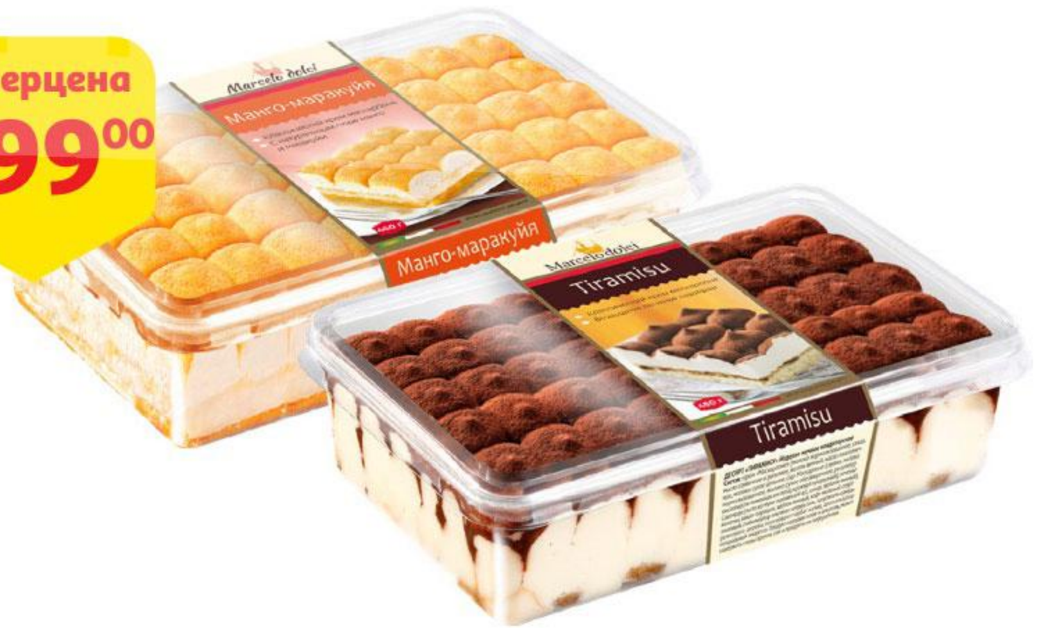
Торт MARCELO DOLCI Тирамису / Манго-маракуйя, 450 г