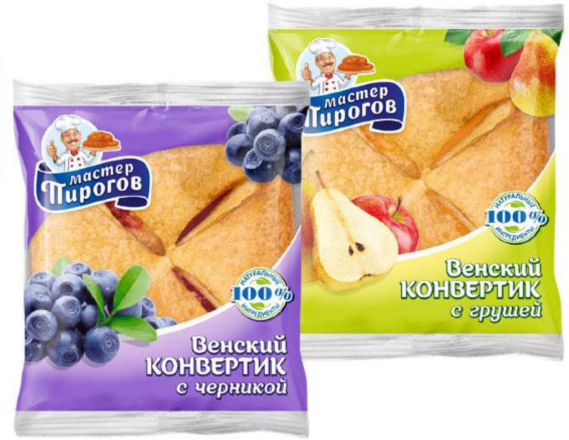
Слойка МАСТЕР ПИРОГОВ Венский конвертик, 70 г, в ассортименте*