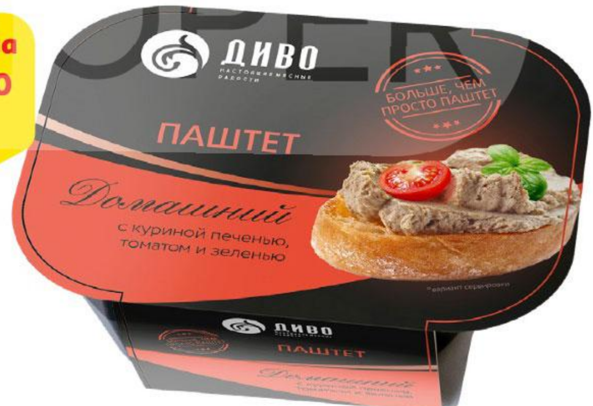
Паштет ДИВО Домашний с куриной печенью-томатом-зеленью, 150 г