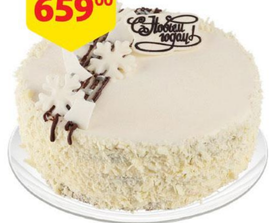
Торт Северная Венеция, 735 г