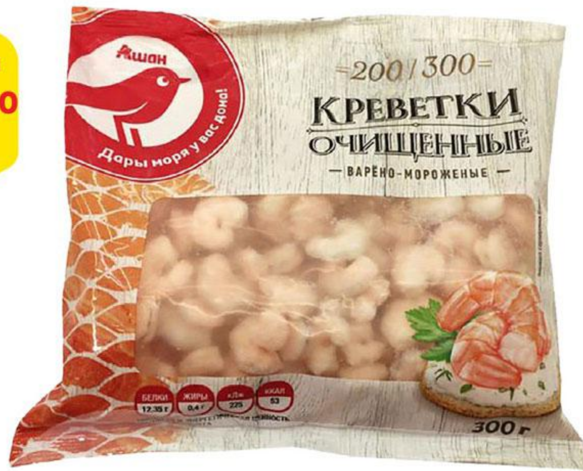
Креветки АШАН варено-мороженые очищенные 200/300, 300 г