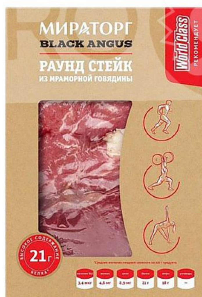
Раунд стейк МИРАТОРГ из мраморной говядины Black Angus охлажденный, 470 г