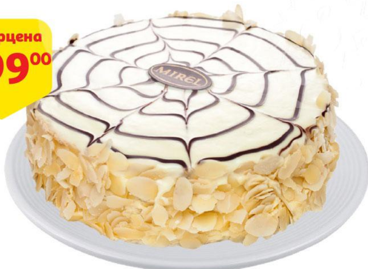
Торт MIREL Эстерхази, 650 г