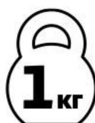
Ребрышки свиные МИРАТОРГ Барбекю охлажденные, 1 кг