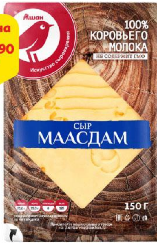
Сыр АШАН Маасдам нарезка 45%, 150 г