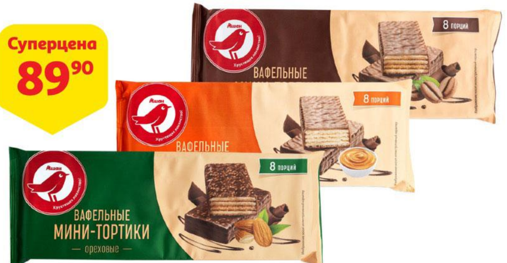
Торт вафельный АШАН порционный ореховый / со сгущенным молоком / кофейный, 200 г