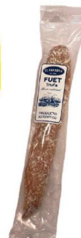
Колбаса EL PARADOR Fuet trufa с трюфелем сыровяленая, 110 г