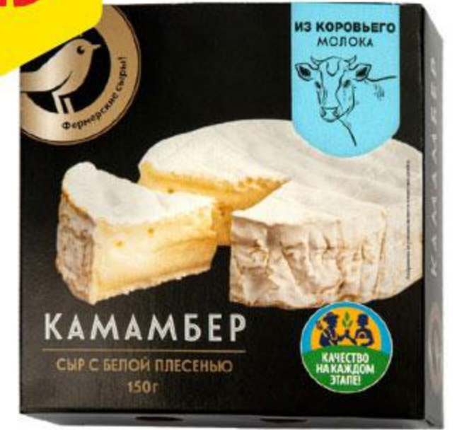
Сыр АШАН Камамбер из коровьего молока, 150 г