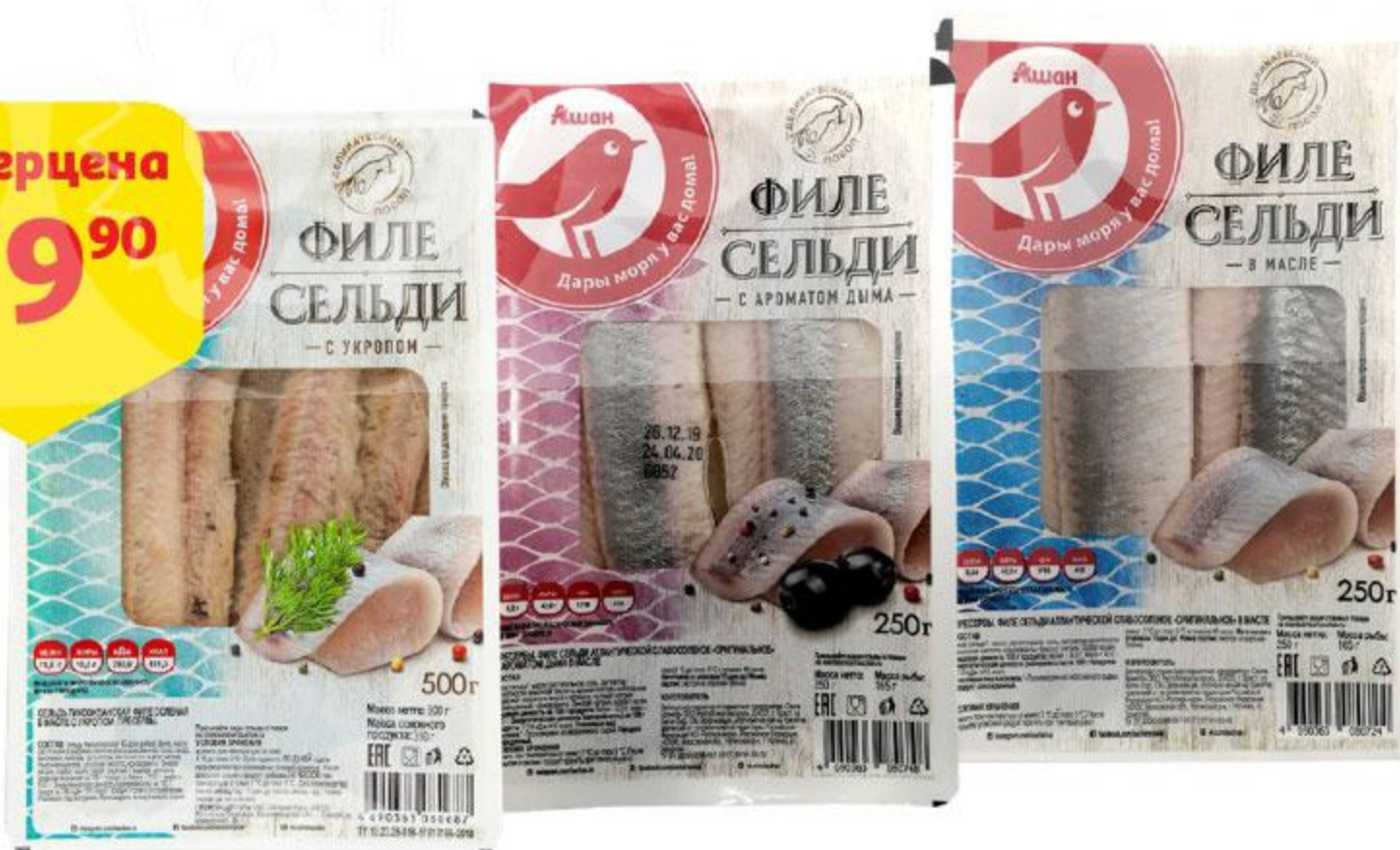
Филе сельди АШАН Оригинальное / с укропом / с ароматом дыма в масле, 250 г