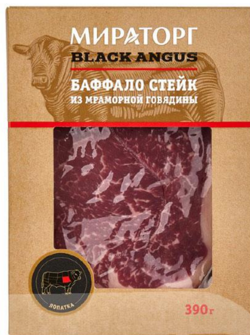
Стейк МИРАТОРГ Баффало говяжий охлажденный, 390 г