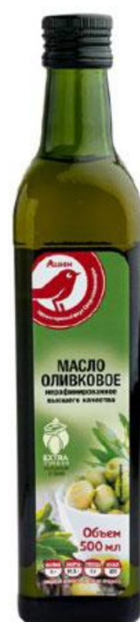
Масло оливковое АШАН нерафинированное, 500 мл