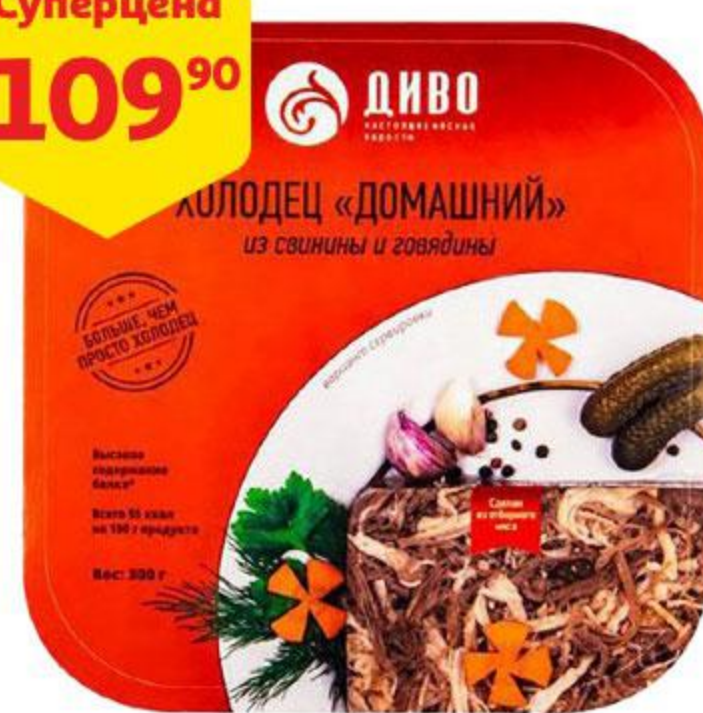
Холодец ДИВО Домашний из свинины и говядины, 300 г