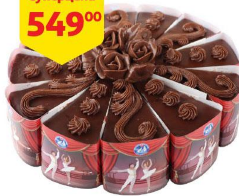
Торт бисквитный СЕВЕР-МЕТРОПОЛЬ Театральный, 800 г