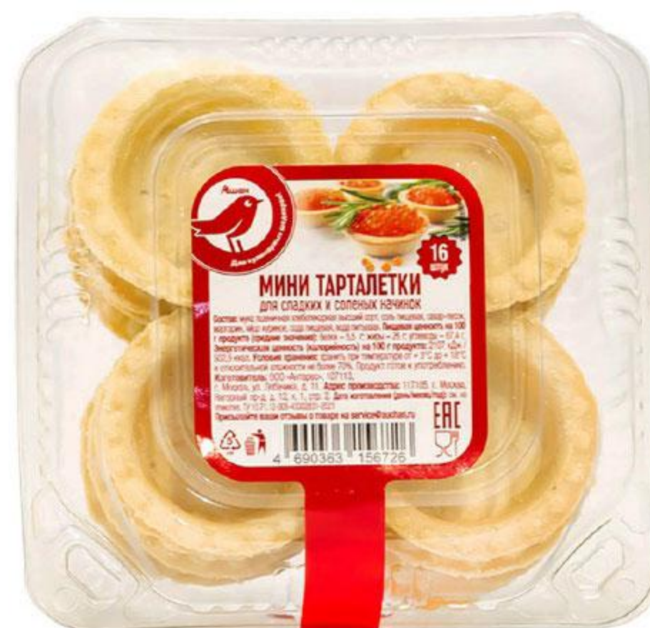
Тарталетки АШАН, 130 г