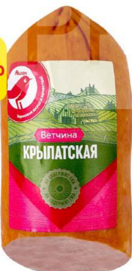
Ветчина АШАН Крылатская, 400 г