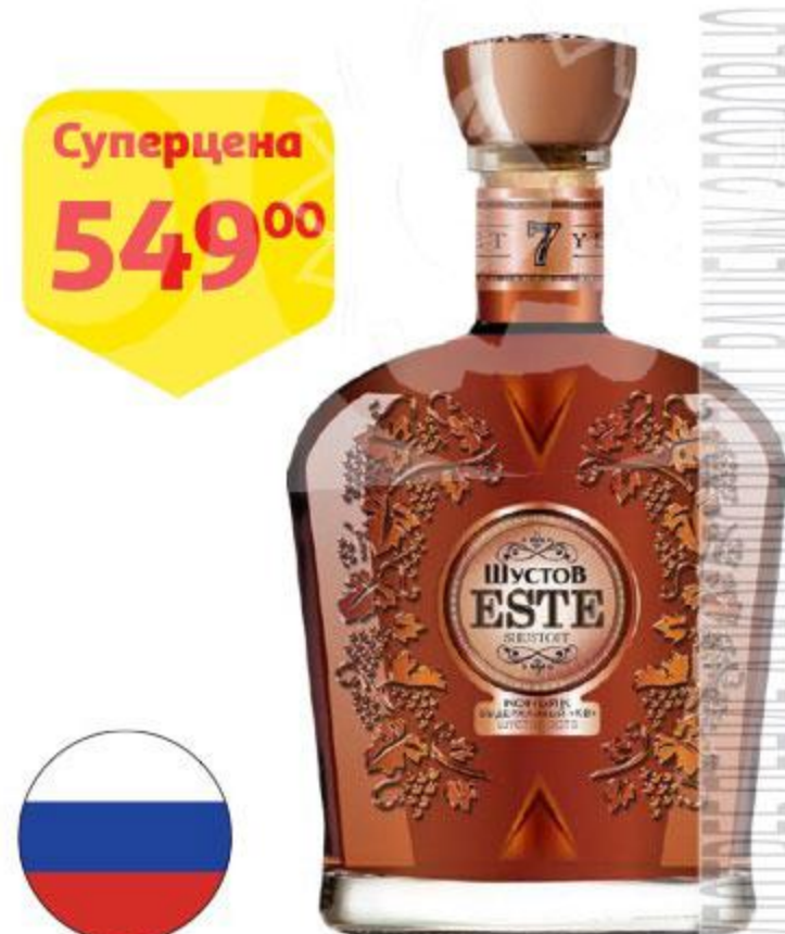
Коньяк ШУСТОФФ Эсте 40%, 0,5 л Россия