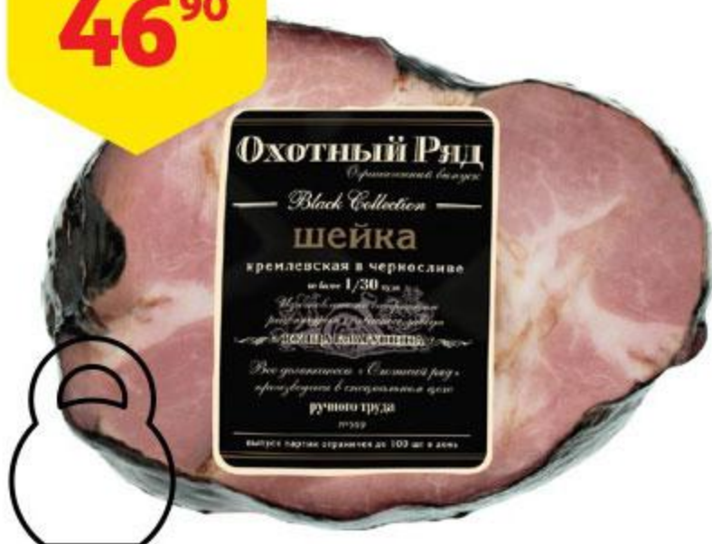
Шейка ОХОТНЫЙ РЯД Кремлевская в черносливе, 100 г