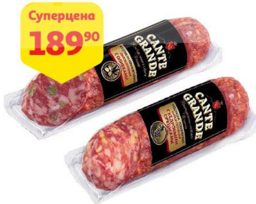
Колбаса CANTE GRANDE сырокопченая с оливками / с кедровыми орешками, 220 г