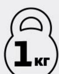
Говядина АШАН Фермерская духовая охлажденная, 1 кг