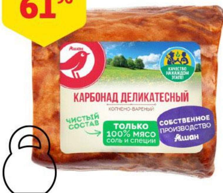
Карбонад АШАН Деликатесный, 100 г