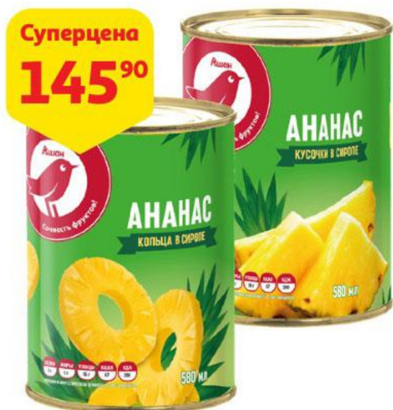
Ананасы АШАН кольца / кусочки в сиропе, 580 мл