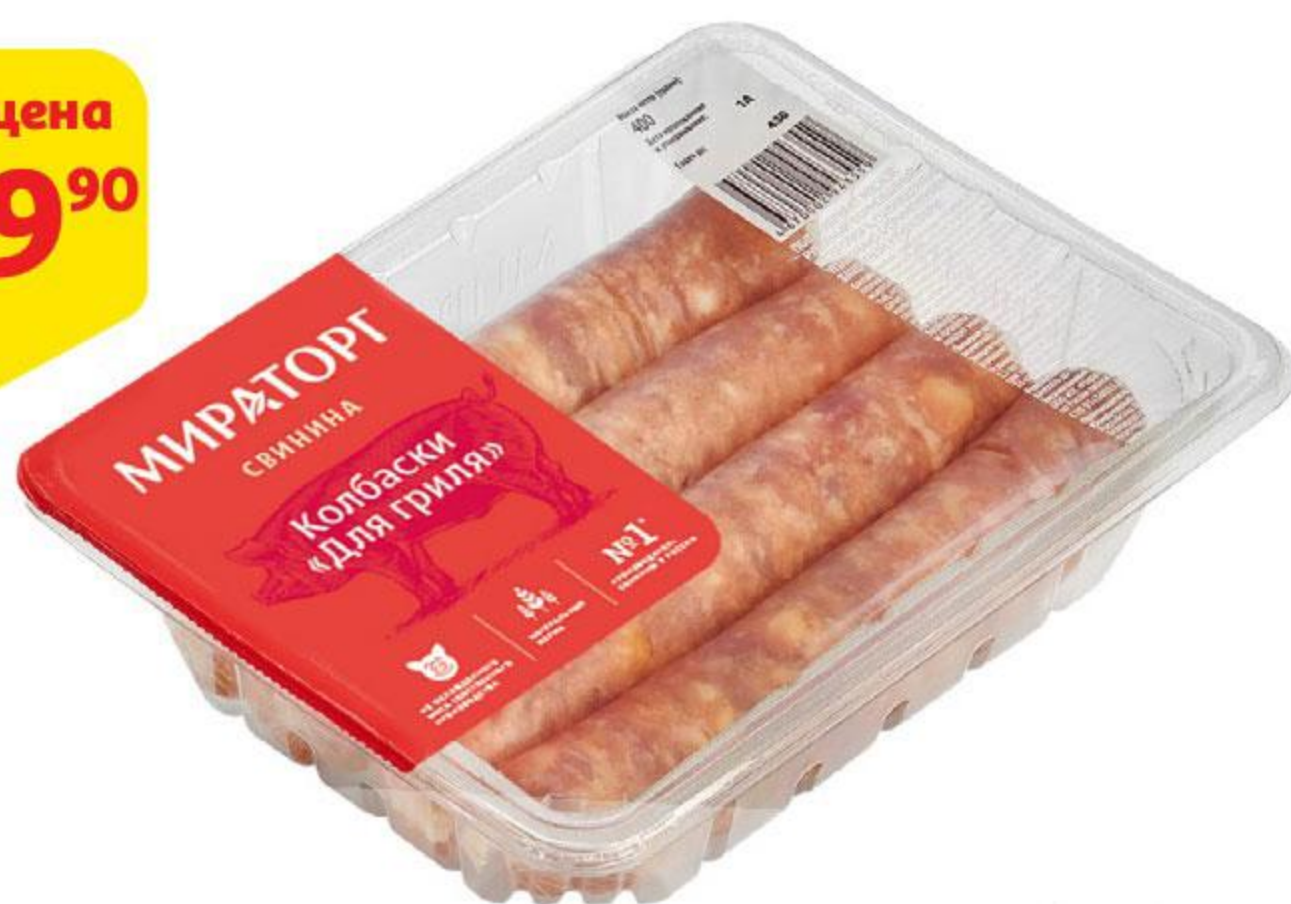
Колбаски МИРАТОРГ Для гриля охлажденные, 400 г