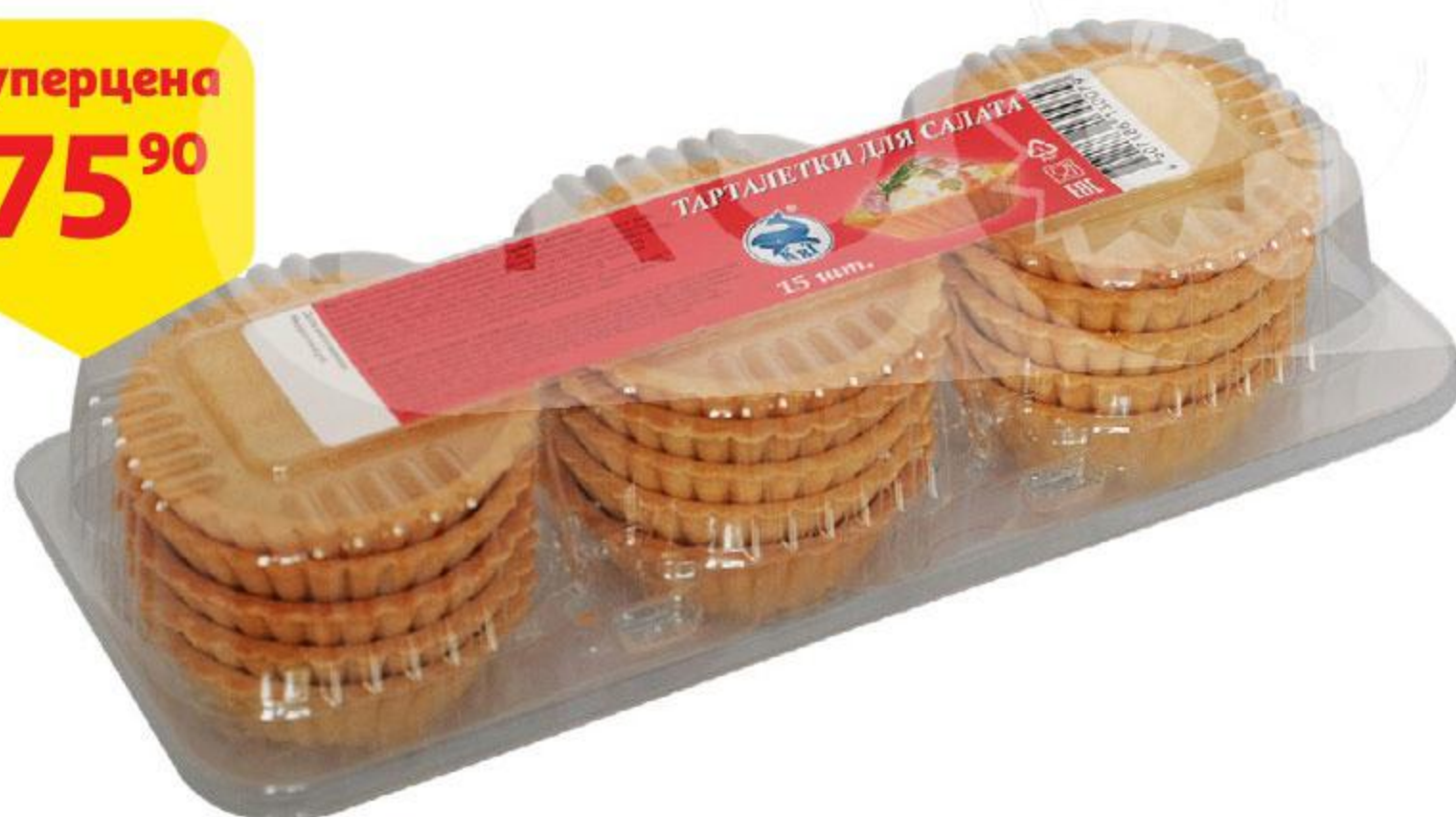
Таралетки для салата КИТ, 15 шт., 160 г