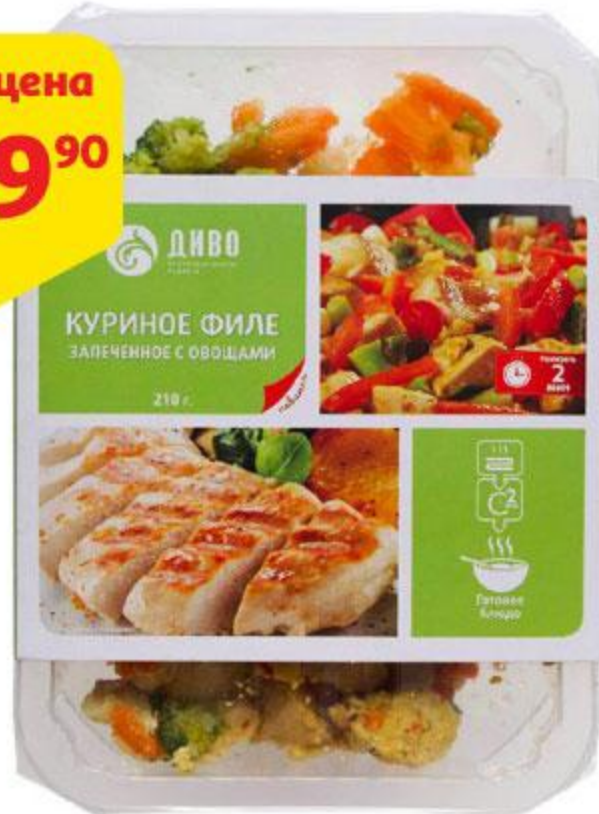
Филе куриное ДИВО запеченное с овощами, 210 г