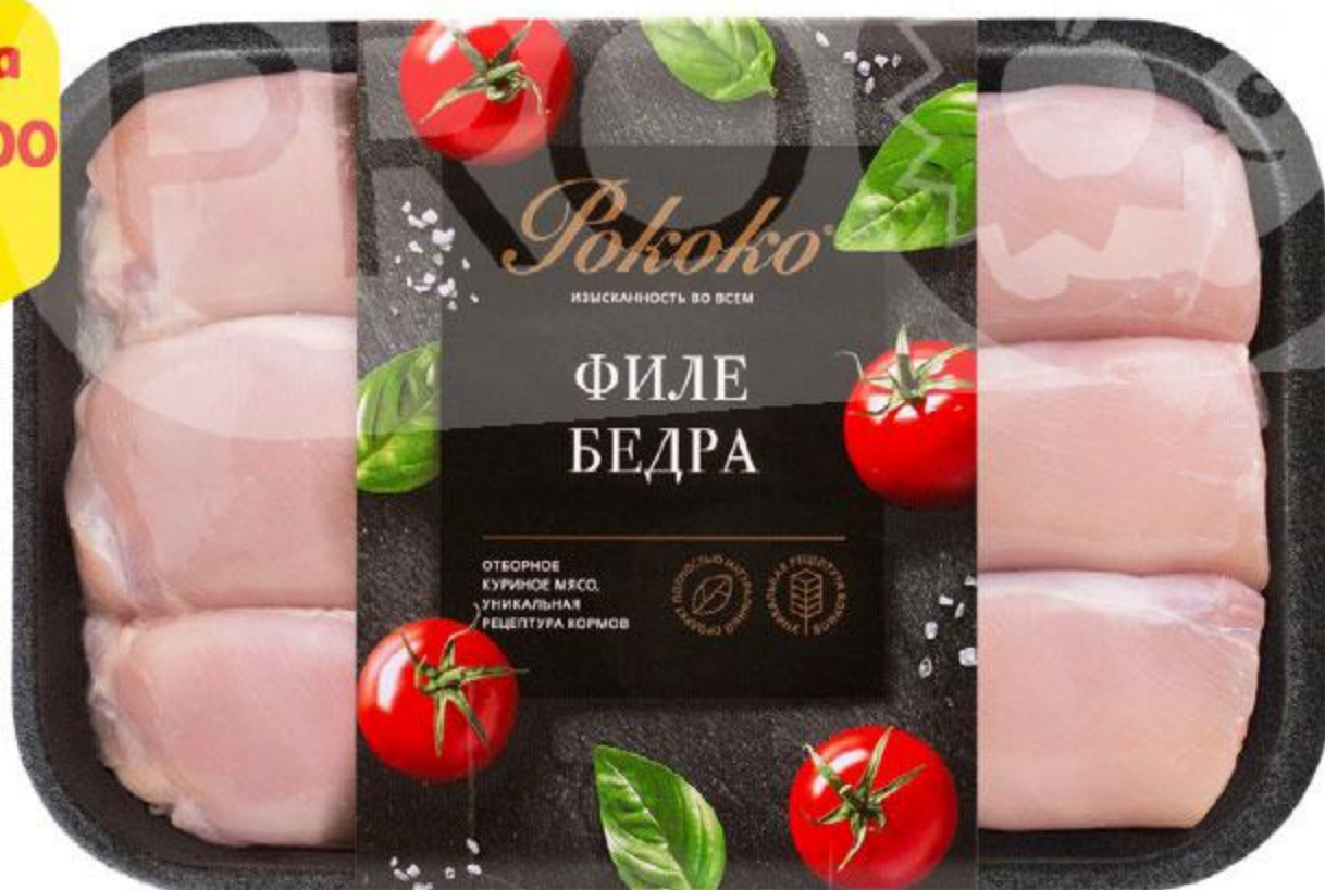
Филе бедра РОКОКО охлажденное, 750 г