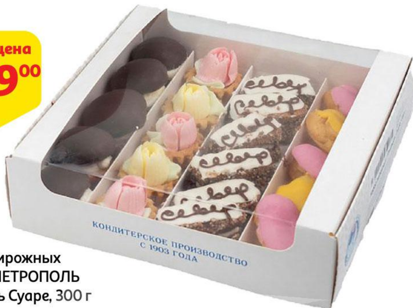
Набор пирожных СЕВЕР-МЕТРОПОЛЬ Птифюрь Суаре, 300 г