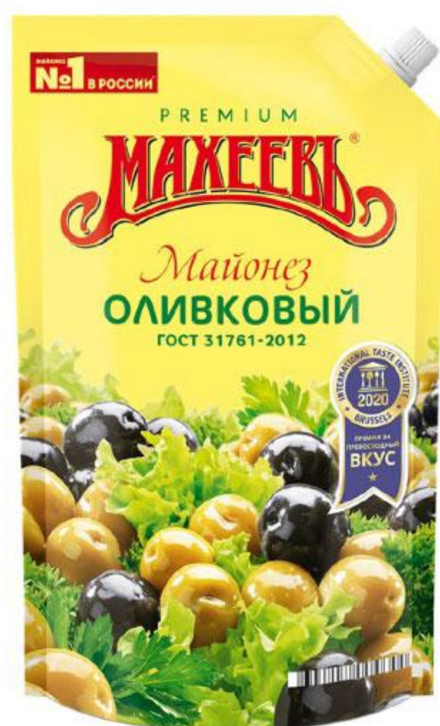
Майонез МАХЕЕВЪ оливковый 50,5%, 770 г