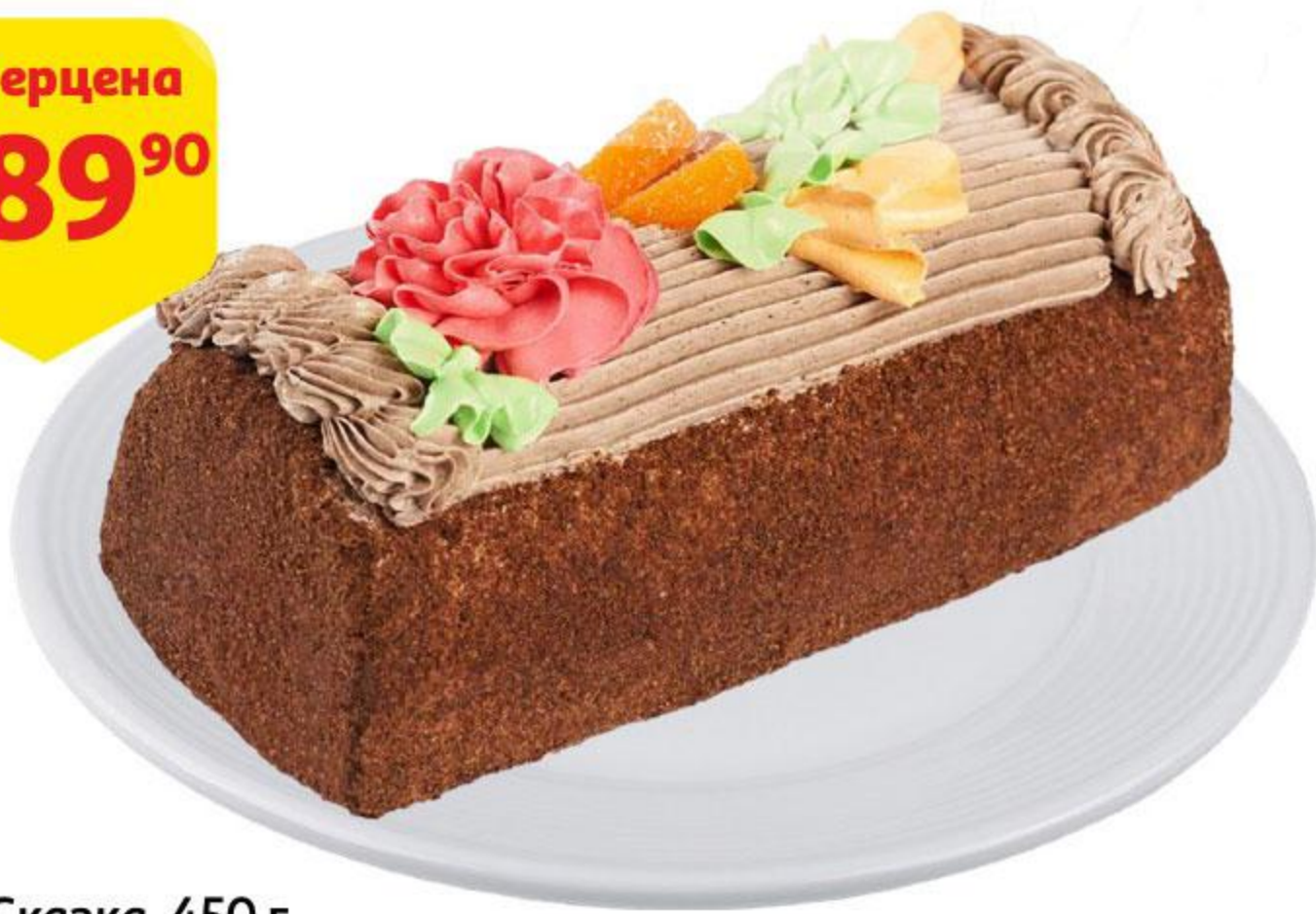
Торт Сказка, 450 г