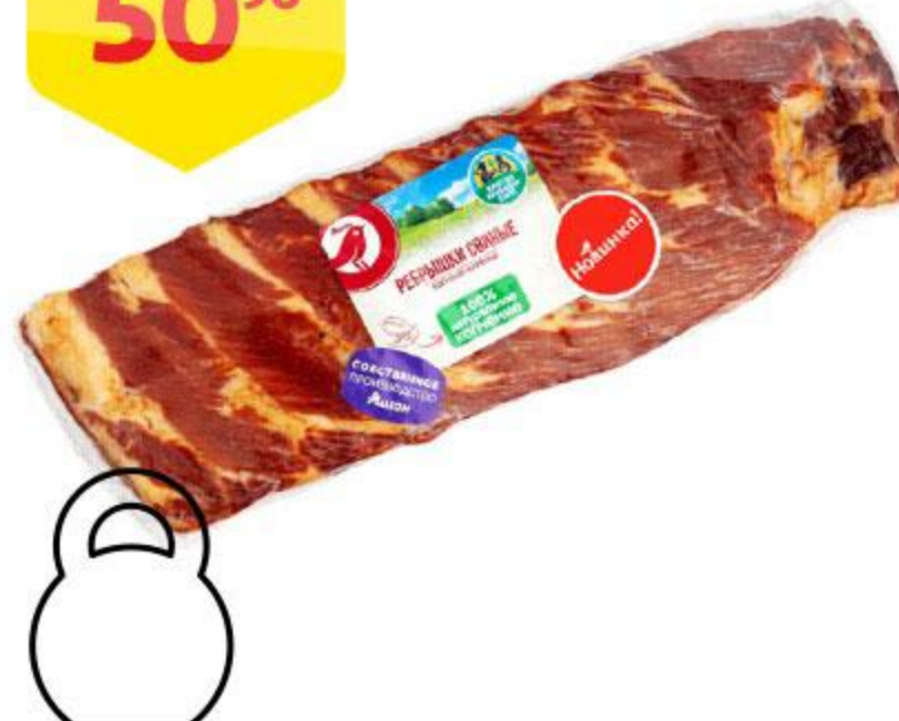
Ребрышки свиные АШАН копчено-вареные, 100 г