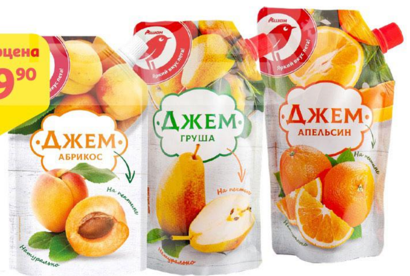
Джем АШАН абрикосовый / грушевый / апельсиновый, 270 г