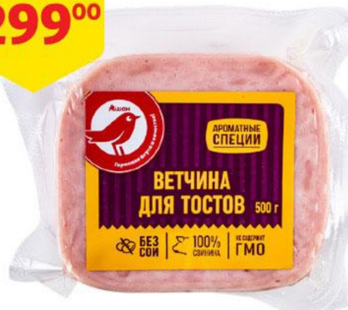
Ветчина АШАН для тостов, 500 г