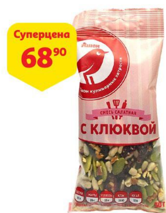
Смесь салатная АШАН с клюквой, 50 г