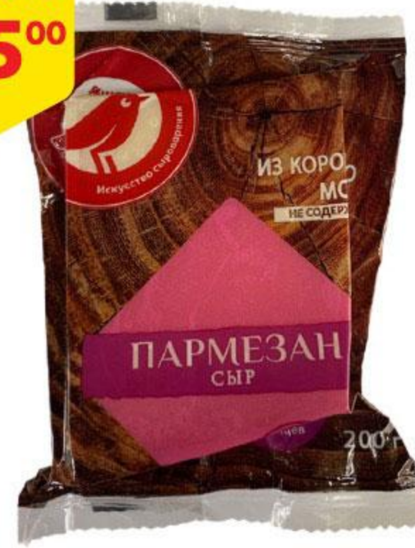
Сыр АШАН Пармезан, 200 г