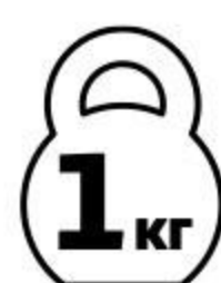
Шейка свиная ЧЕРКИЗОВО в маринаде для запекания охлажденная, 1 кг