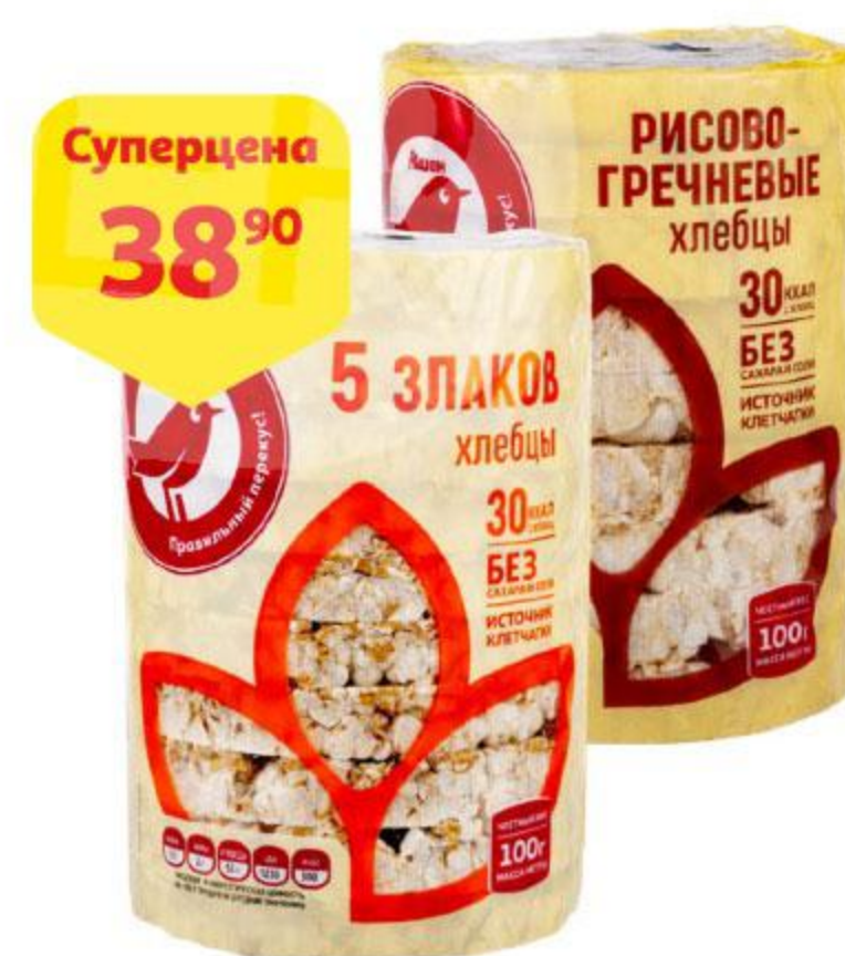
Хлебцы АШАН 5 злаков / рисово-гречневые, 100 г