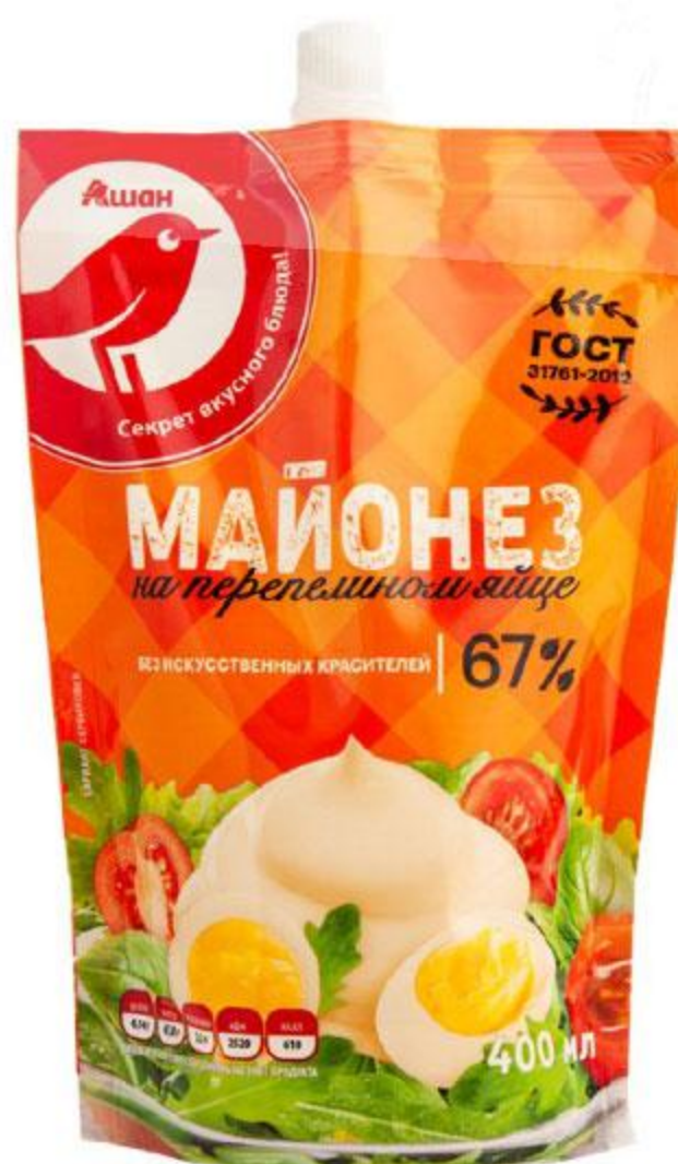
Майонез АШАН провансаль / на перепелином яйце 67%, 400 мл