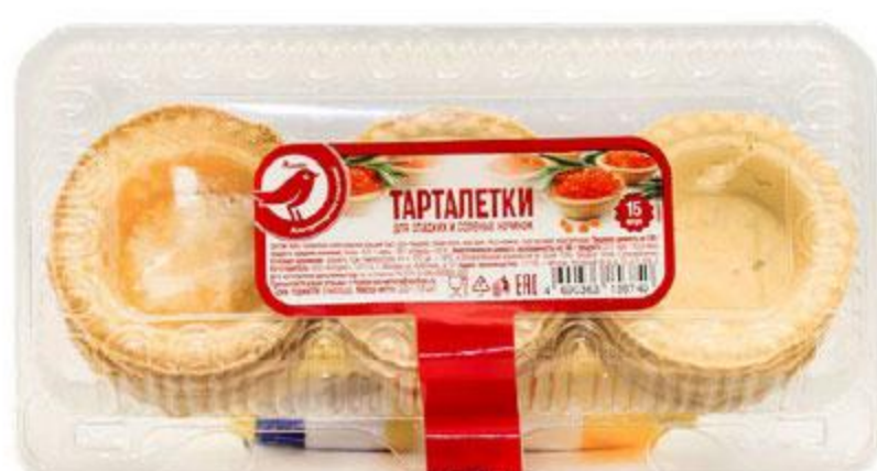
Тарталетки АШАН, 220 г