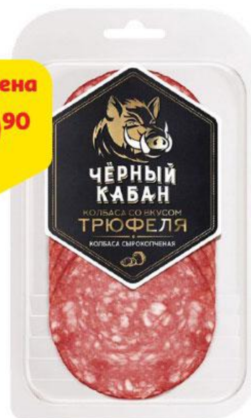
Колбаса ЧЕРНЫЙ КАБАН со вкусом трюфеля сырокопченая нарезка, 85 г