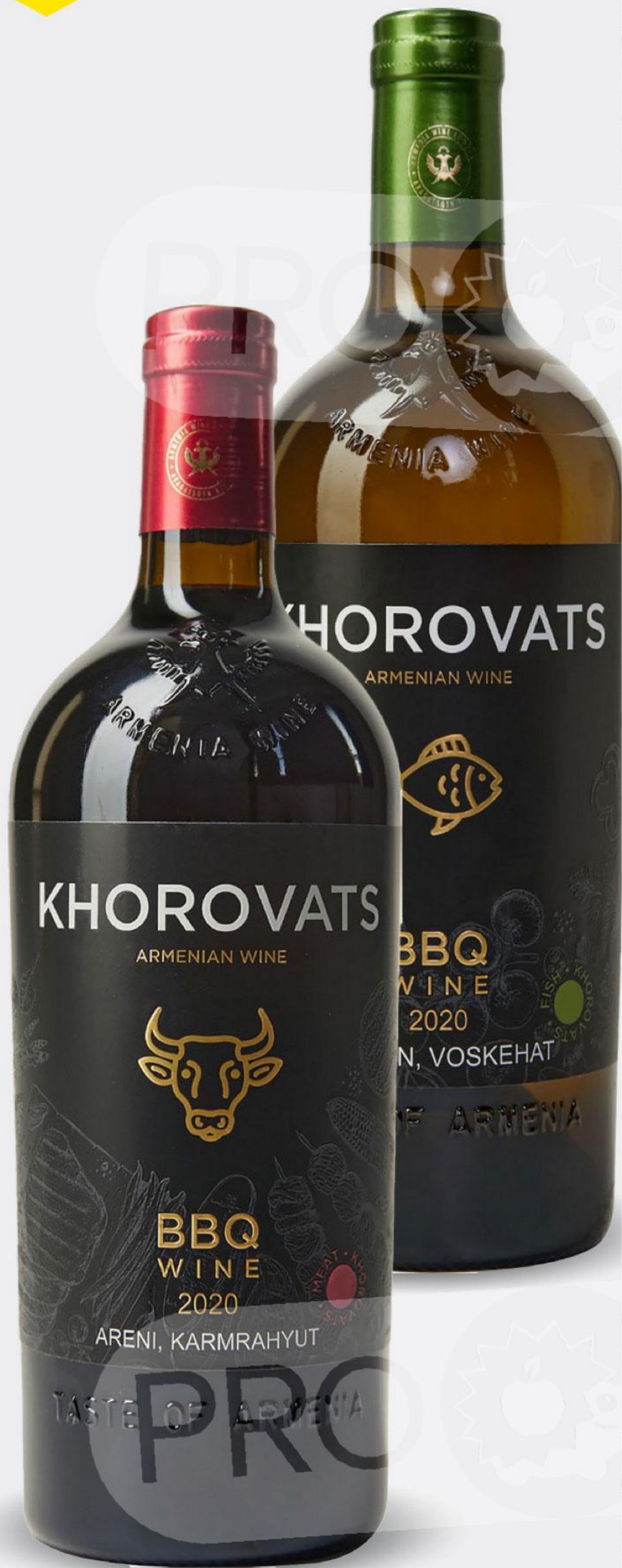
Вино ХОРОВАЦ красное / белое сухое, 0,75 л Армения

ЧРЕЗМЕРНОЕ УПОТРЕБЛЕНИЕ АЛКОГОЛЯ ВРЕДИТ ВАШЕМУ ЗДОРОВЬЮ