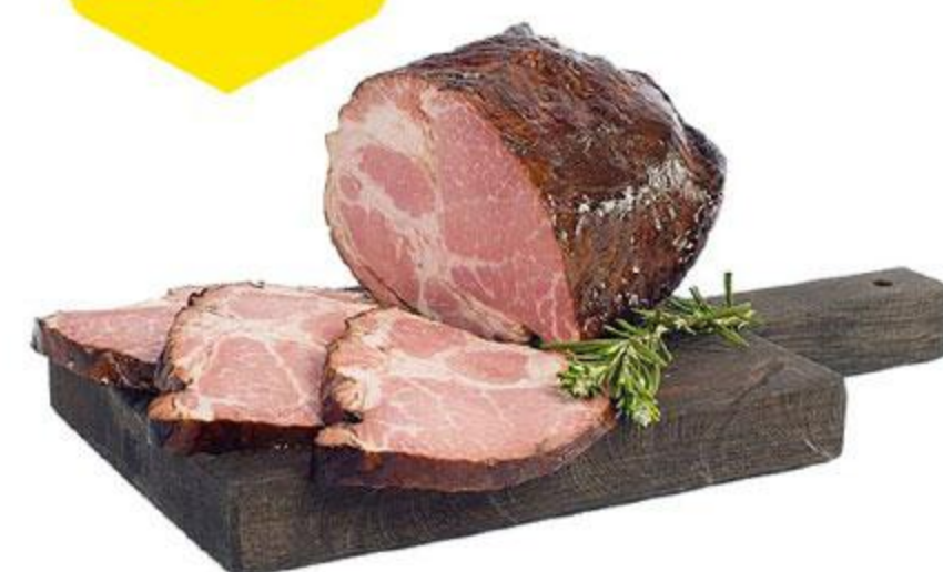
Шейка сырокопченая нарезка, 95 г