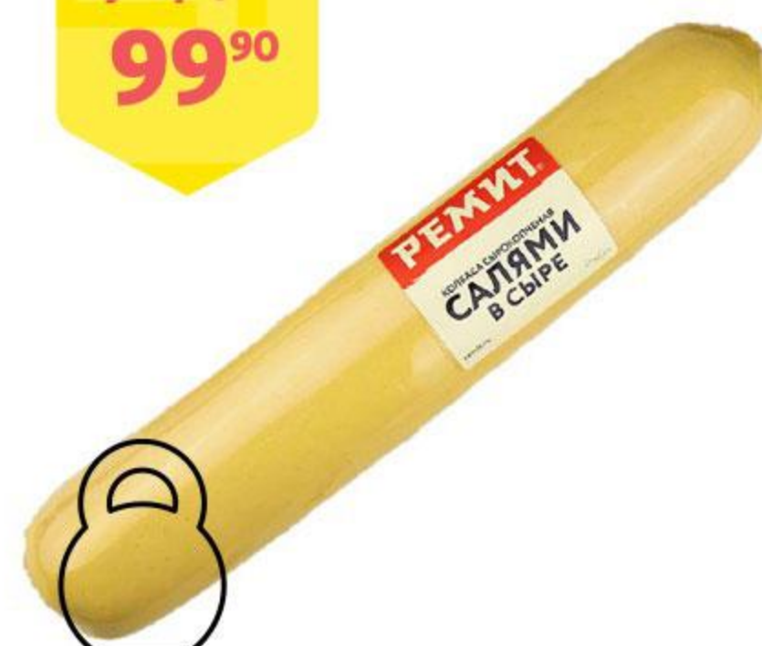
Колбаса РЕМИТ Салами в сыре сырокопченая, 100 г