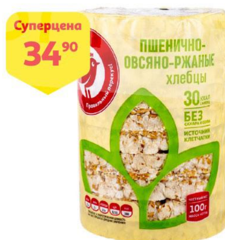
Хлебцы АШАН пшенично-овсяно-ржаные, 100 г