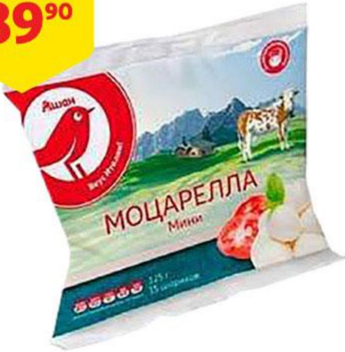
Сыр АШАН Моцарелла мини, 125 г