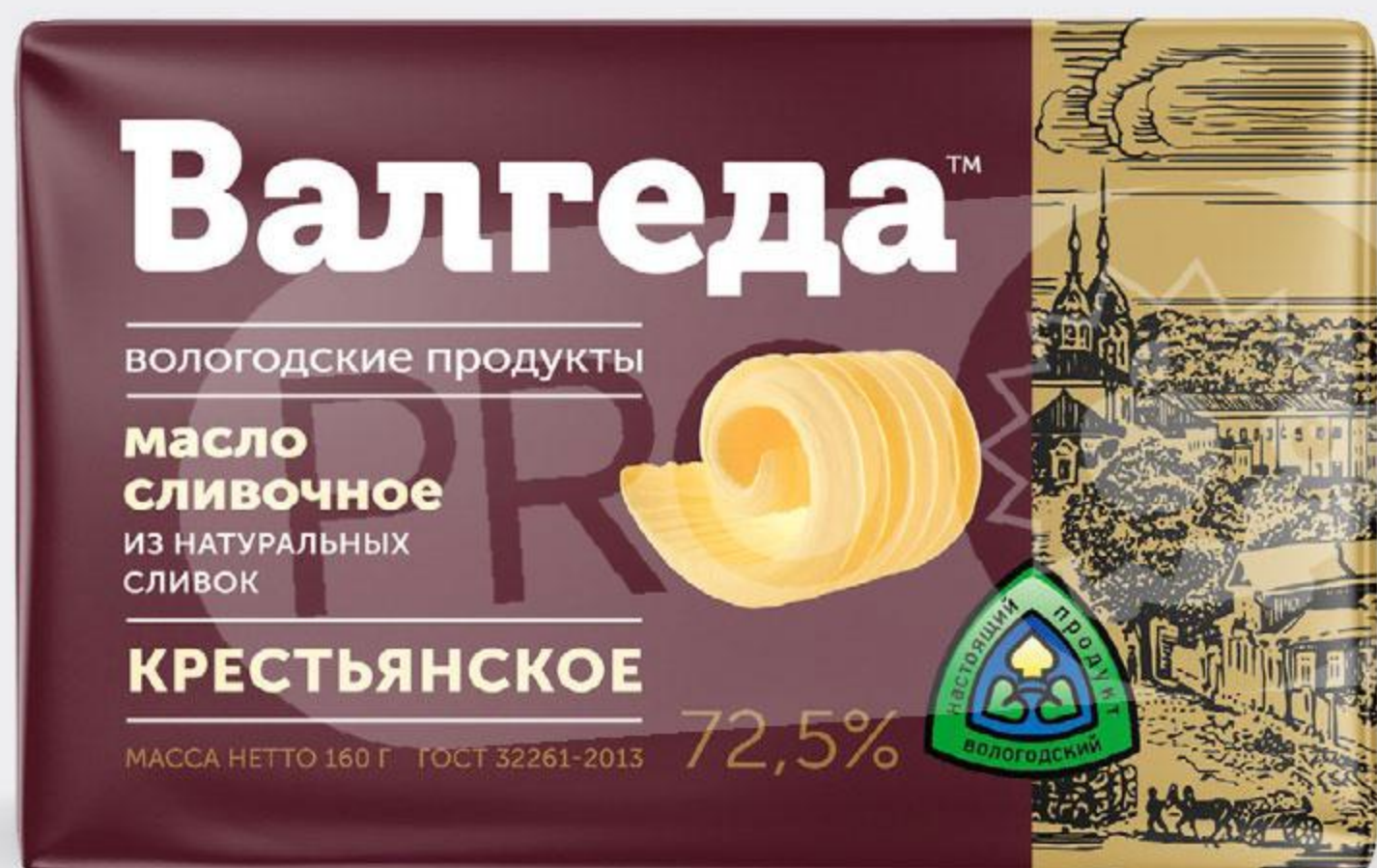
Масло ВАЛГЕДА Крестьянское 72,5%, 160 г