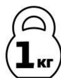
Ребрышки свиные БЛИЖНИЕ ГОРКИ Пикантные для запекания охлажденные, 1 кг