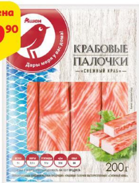
Крабовые палочки АШАН Снежный краб, 200 г