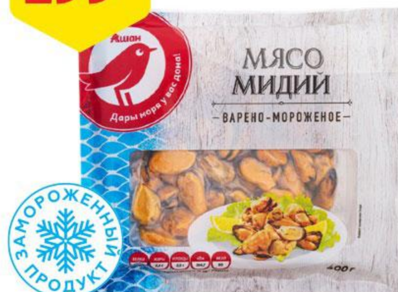
Мясо мидий АШАН варено-мороженое, 400 г