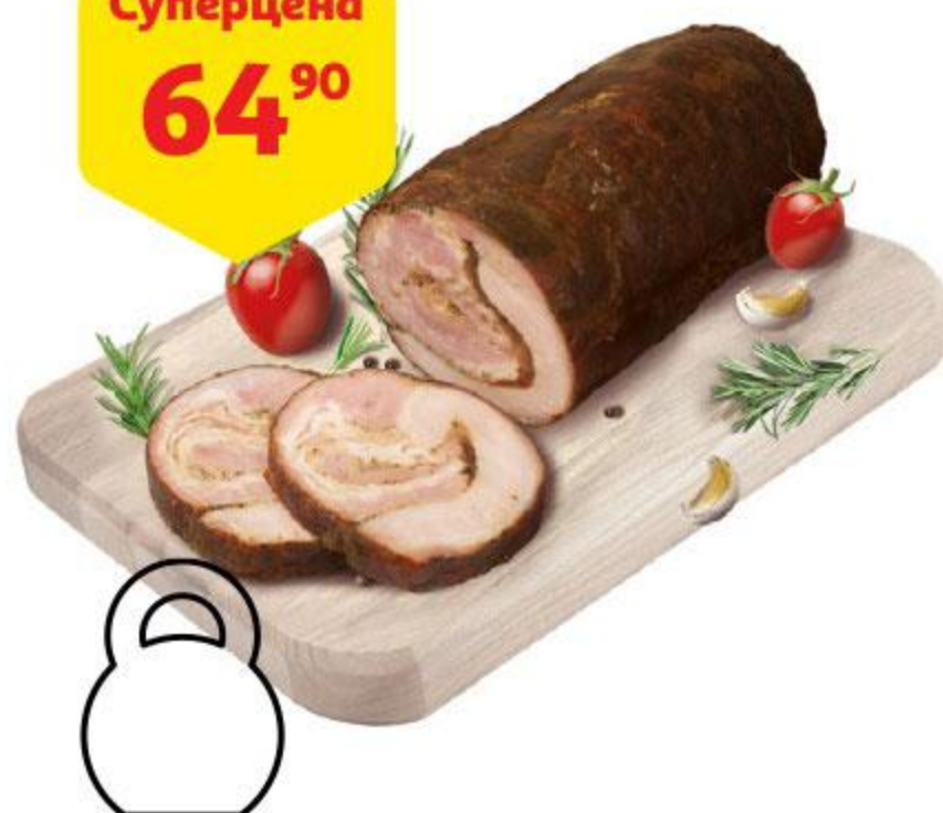
Панчетта МЯСНИЦКИЙ РЯД с можжевельником, 100 г