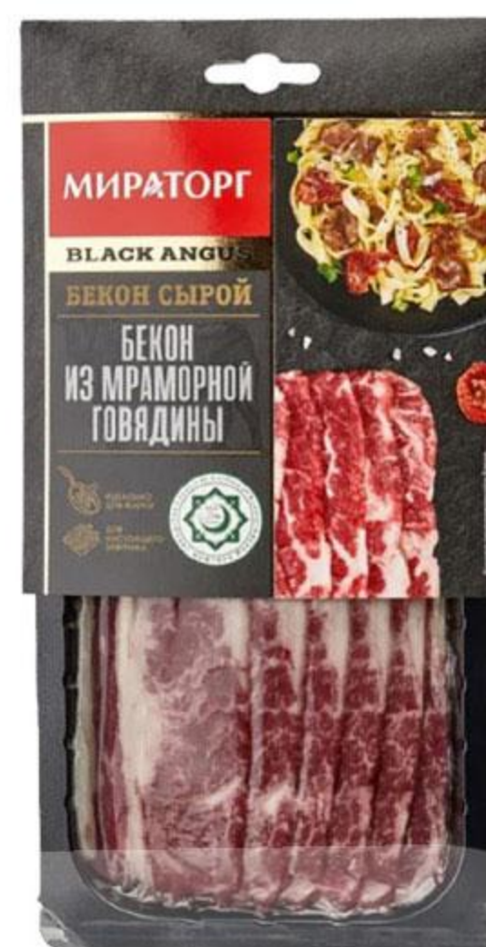
Бекон МИРАТОРГ говяжий мраморный охлажденный, 190 г