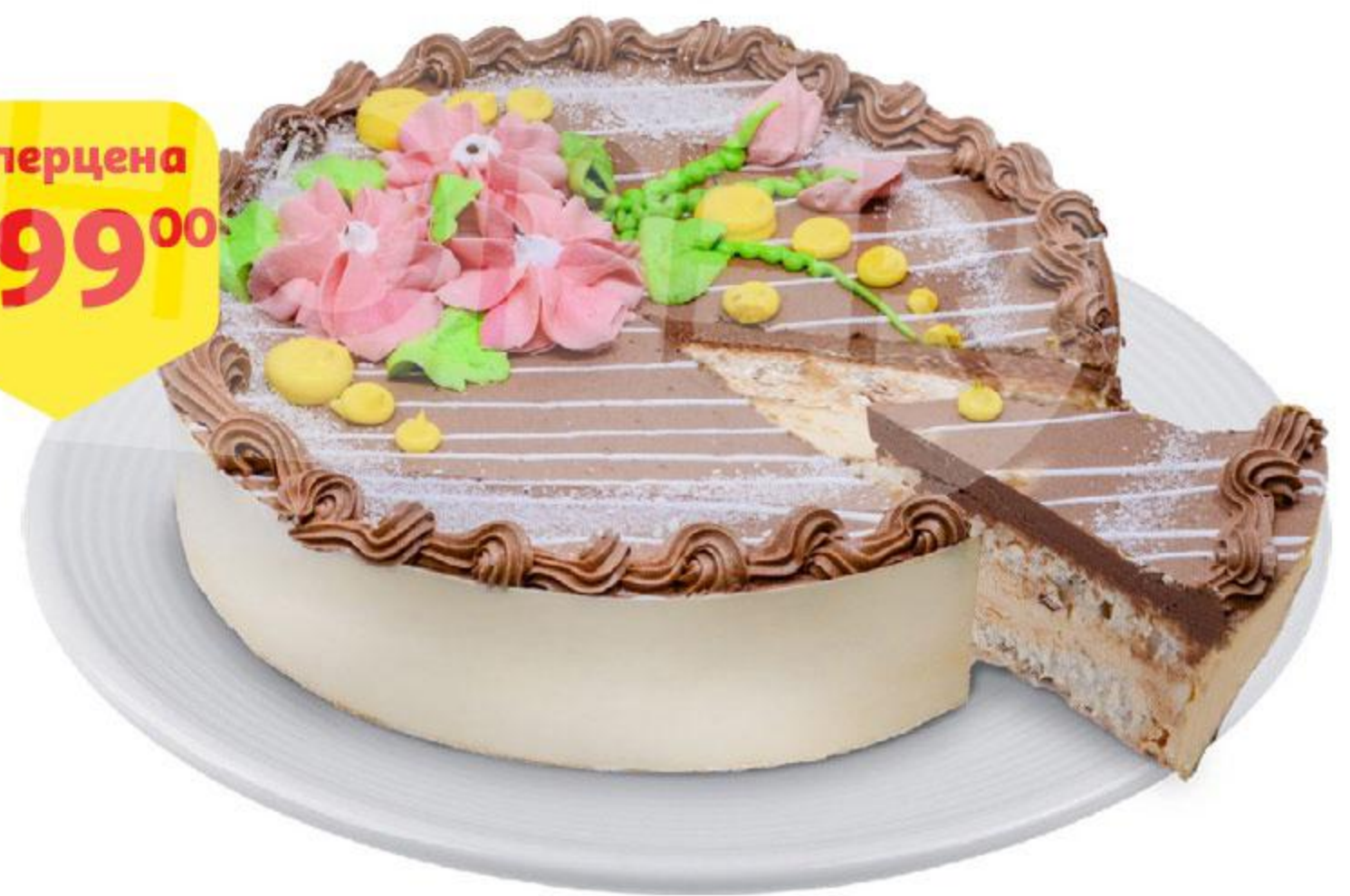
Торт ФИЛИ-БЕЙКЕР Новый Киевский, 900 г

* Ассортимент товара, участвующего в акции, уточняйте в магазинах АШАН, на территории которых проводится данная акция.