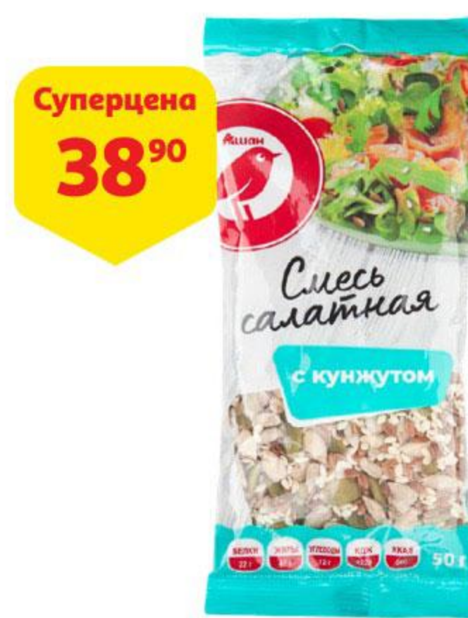
Смесь салатная АШАН с кунжутом, 50 г