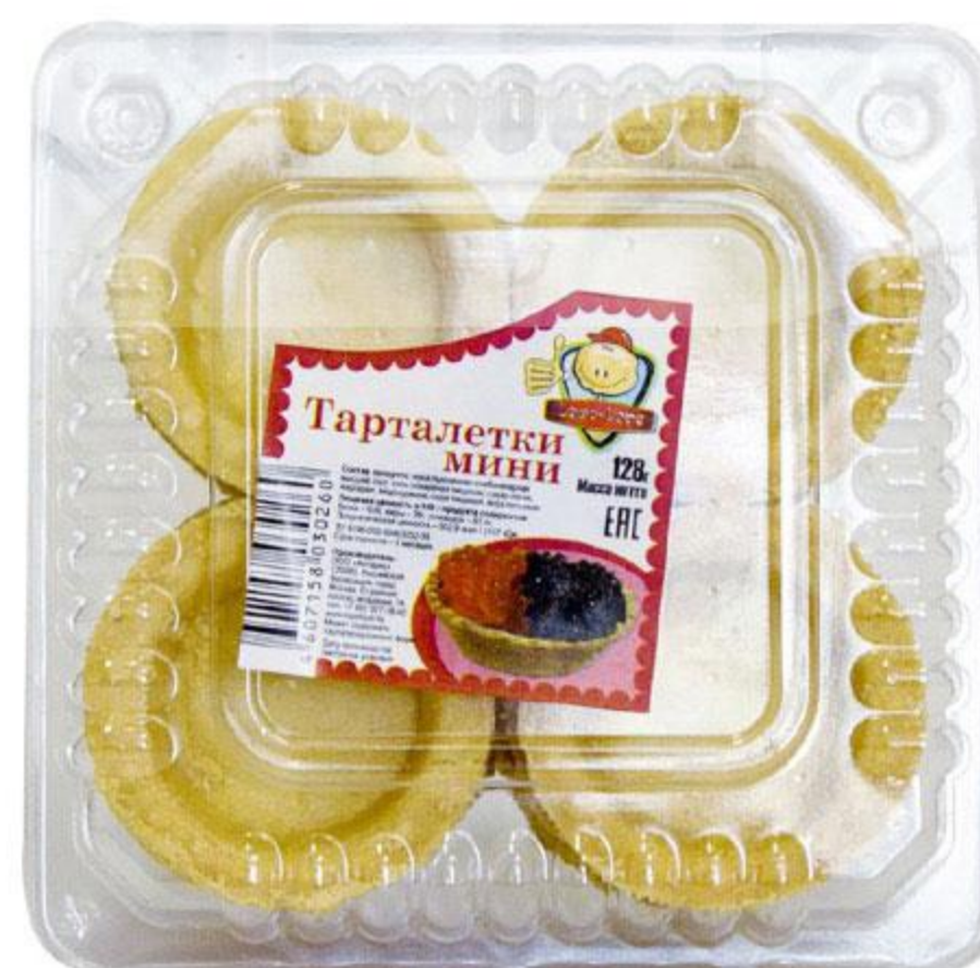
Тарталетки LOPE-LOPE мини, 128 г