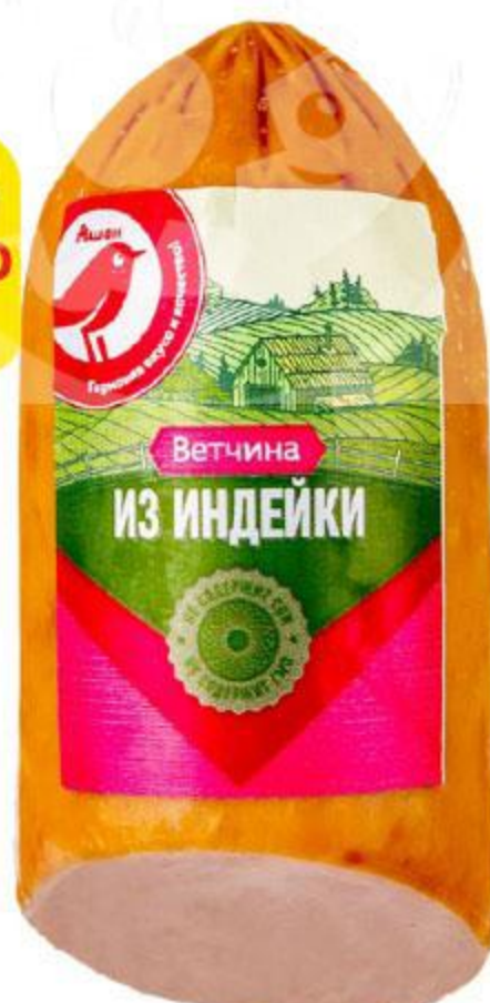
Ветчина АШАН из индейки, 400 г