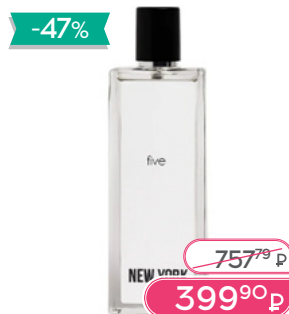
NEW YORK PERFUME FIVE