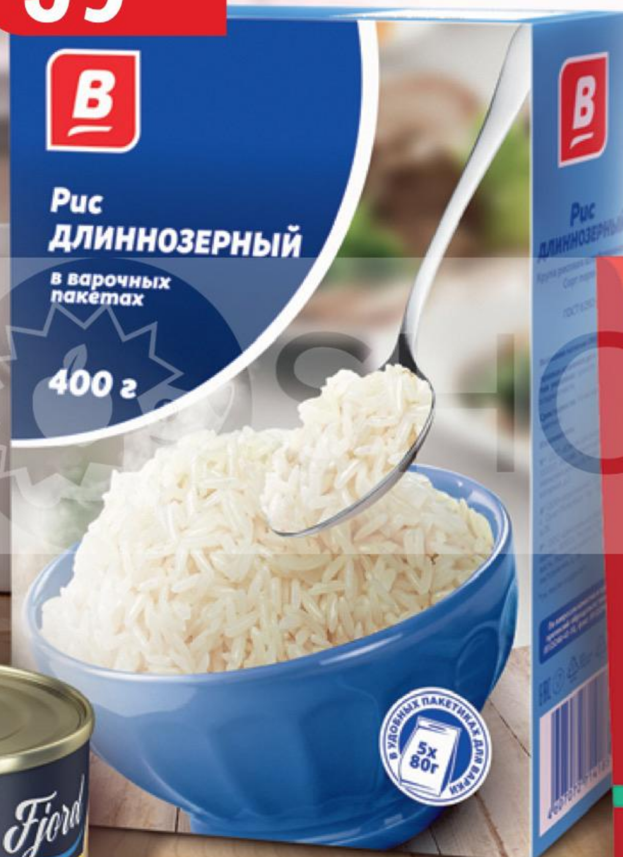
РИС ДЛИННОЗЕРНЫЙ В шлифованный, 5 пак. x 80 г 135363