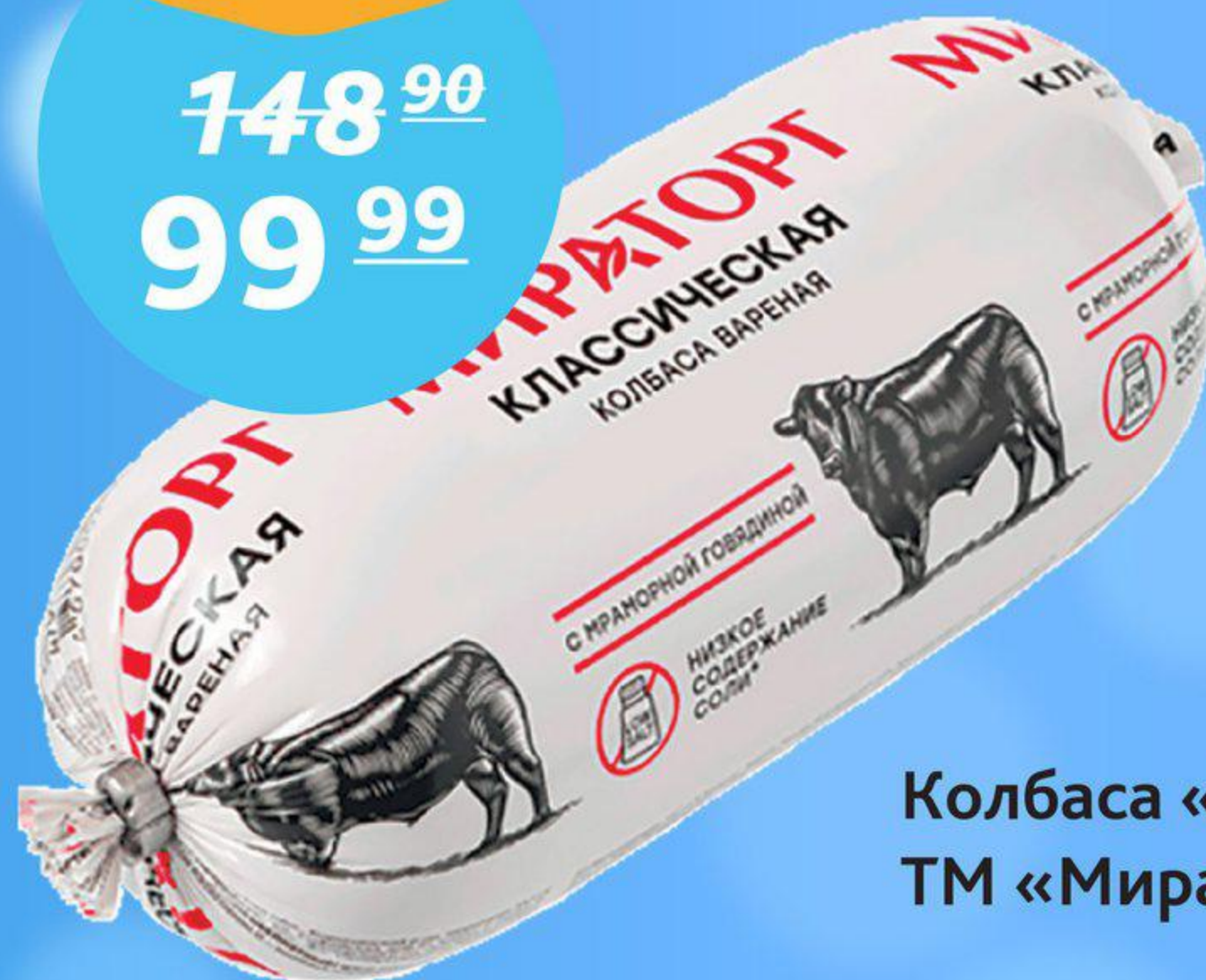
Колбаса «Классическая», ТМ «Мираторг», 470 г