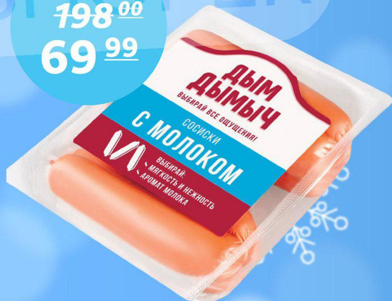
Сосиски «С молоком», ТМ «Дым Дымыч», 350 г