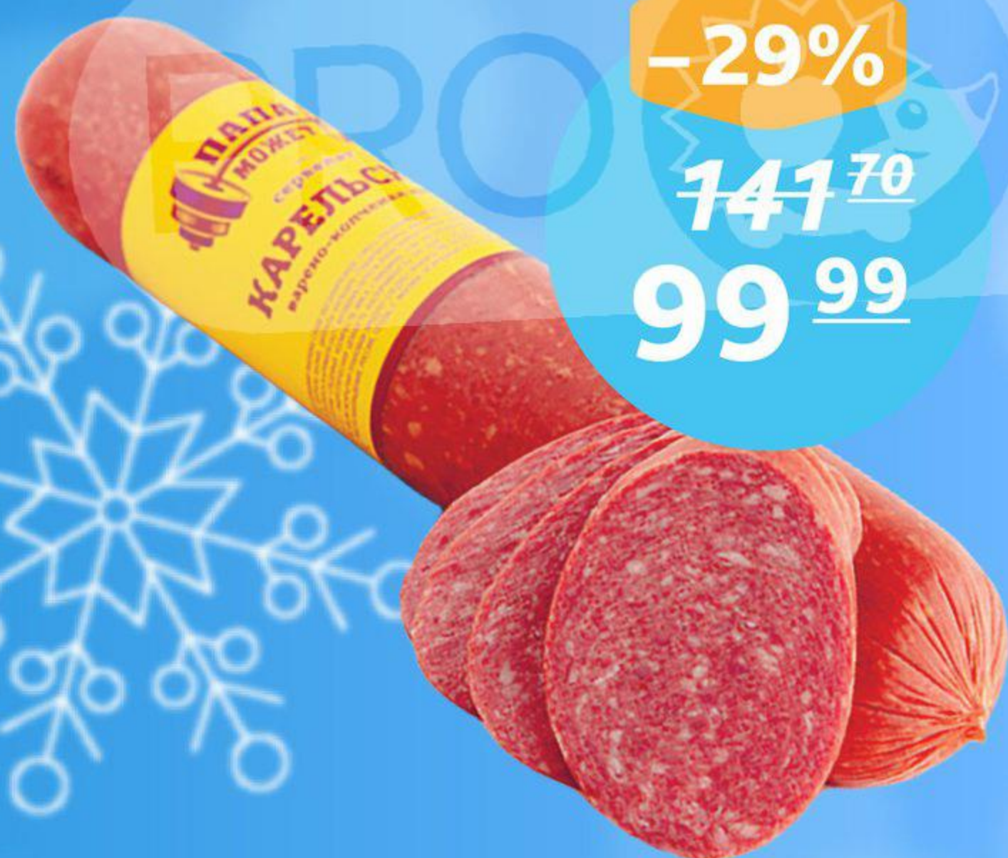
Колбаса сервелат «Карельский», ТМ «Папа Может», 280 г