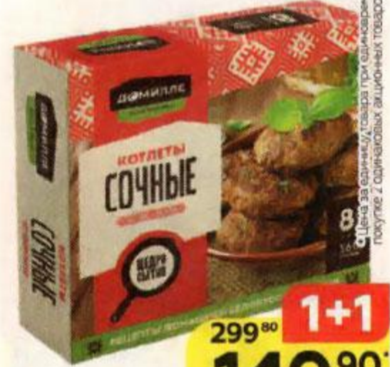
Котлеты ДОМИЛЛЕ сочные, 560 г