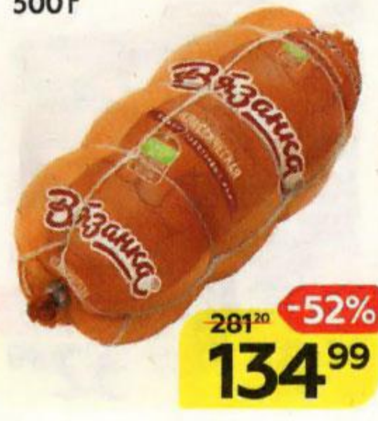
Колбаса ВЯЗАНКА , Классическая, вареная (Стародворские Колбасы), 500 г