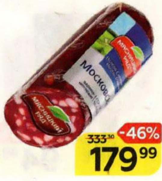
Колбаса МЯСНИЦКИЙ РЯД Московская, варено-копченая, 250 г