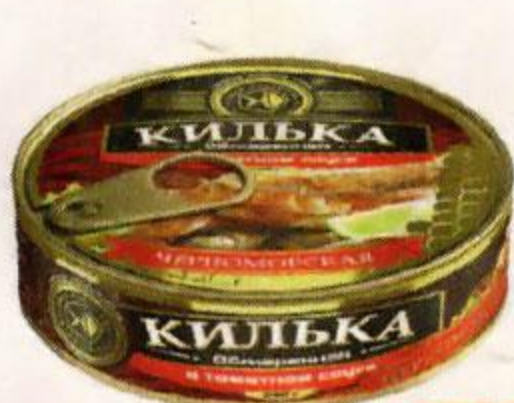
Килька ЗНАК КАЧЕСТВА черноморская, обжаренная, в томатном соусе, 240 г