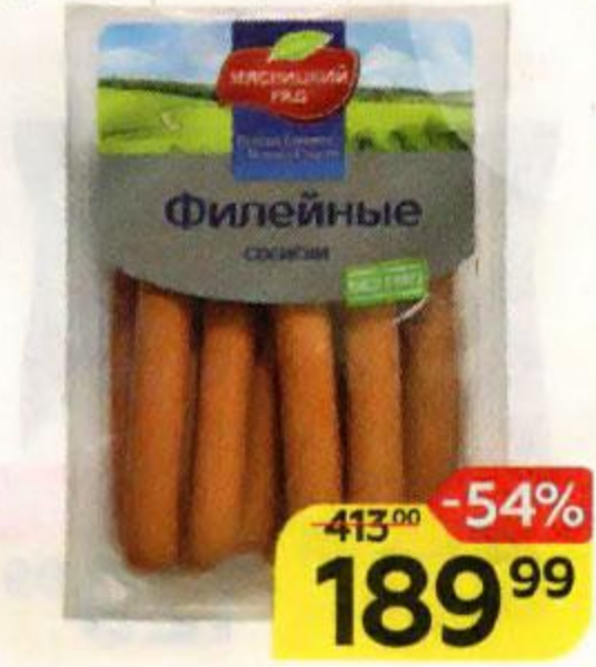
Сосиски ФИЛЕЙНЫЕ из мяса птицы, вареные (Мясницкий ряд), 730 г