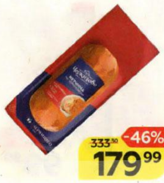
Ветчина ПО-ЧЕРКИЗОВСКИ (ЧМПЗ), 500 г