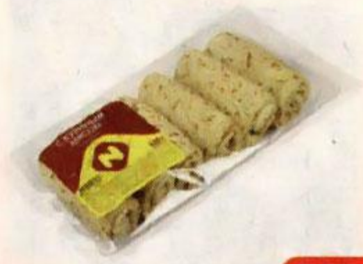
Блинчики ОСТАНКИНО , С куриным мясом (ОМПК), 420 г