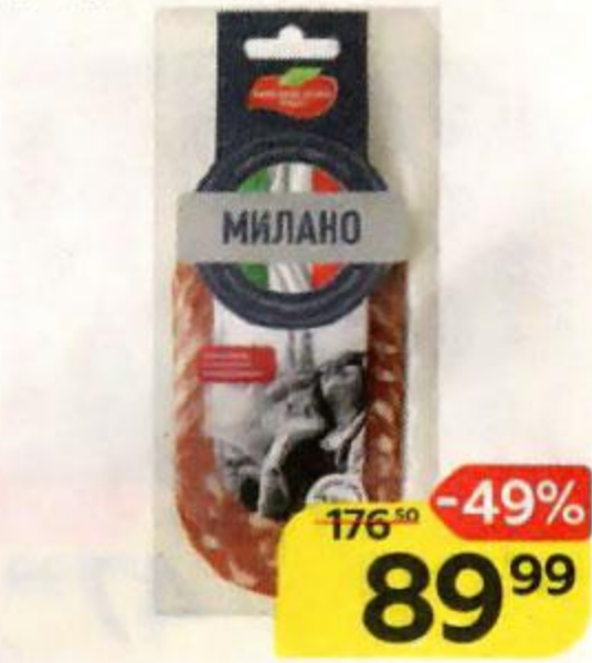
Колбаса МИЛАНО сыровяленая, нарезка (Мясницкий ряд), 90 г