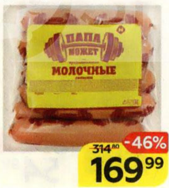
Сосиски ПАПА МОЖЕТ , Молочные, традиционные, (ОМПК), 600 г