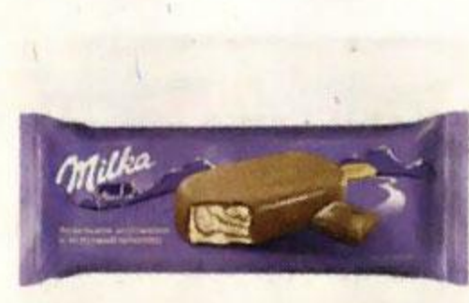
Мороженое MILKA эскимо ванильно-шоколадное, 62 г