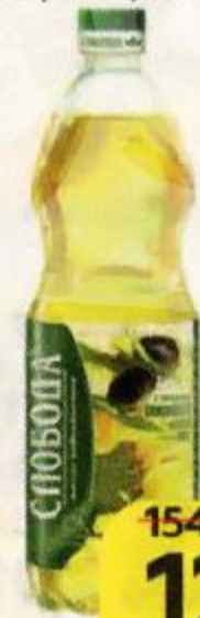
Масло СЛОБОДА , Подсолнечное с добавлением оливкового, рафинированное, 1 л