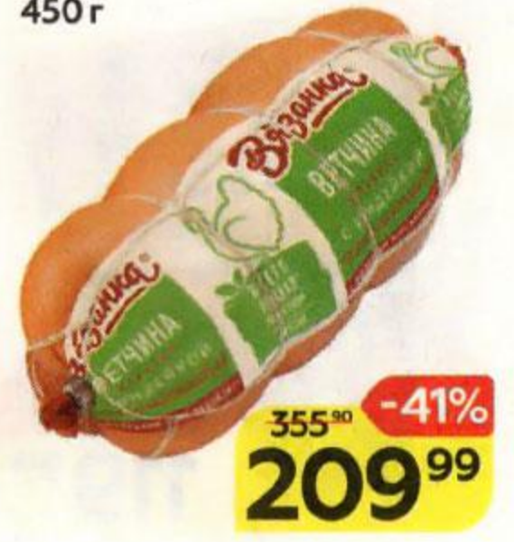
Ветчина ВЯЗАНКА с индейкой, вареная (Стародворские Колбасы), 450 г