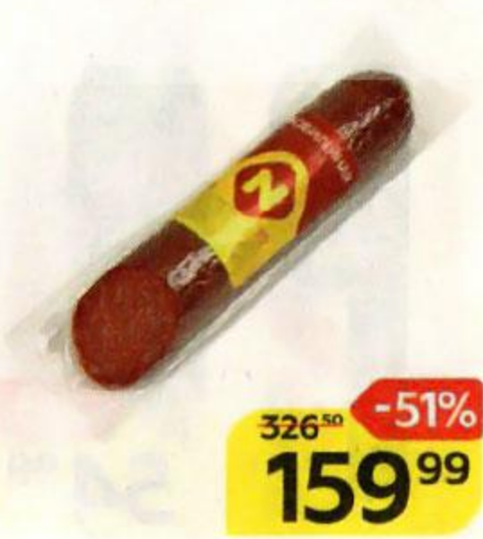
Колбаса ЮБИЛЕЙНАЯ сырокопченая (ОМПК), 250 г