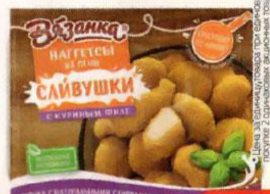
Наггетсы ВЯЗАНКА Сливушки, куриные, из печи, 250 г