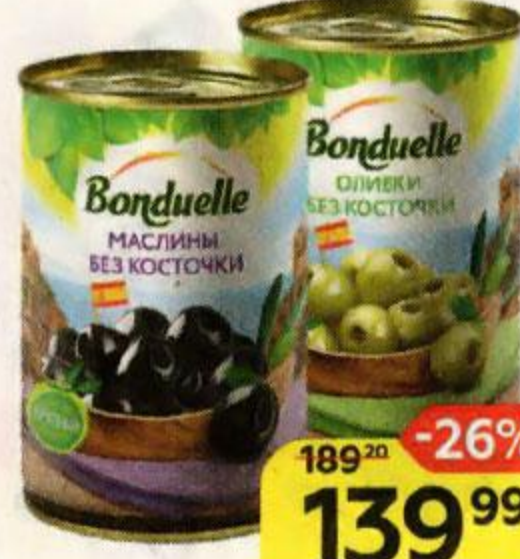
BONDUELLE , Без косточки: Маслины/ Оливки, 300 г