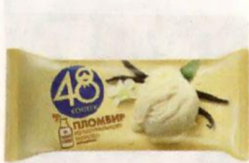
Мороженое 48 КОПЕЕК пломбир, брикет, 210 г