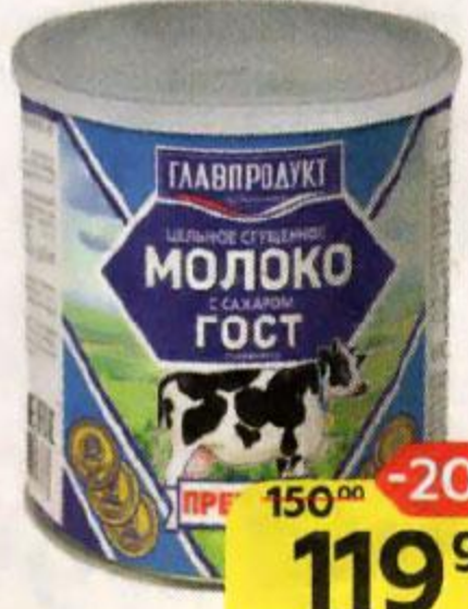
Молоко сгущенное ГЛАВПРОДУКТ , Премиум, с сахаром, ГОСТ, 8,5%, 380 г