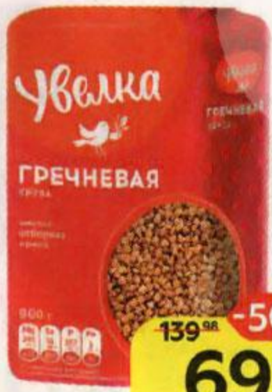
Гречка УВЕЛКА , 800 г