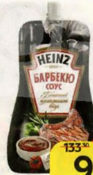
Соус HEINZ , Барбекю, 230 г