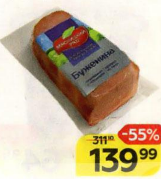
Буженина МЯСНИЦКИЙ РЯД запеченная, охлажденная, 250 г