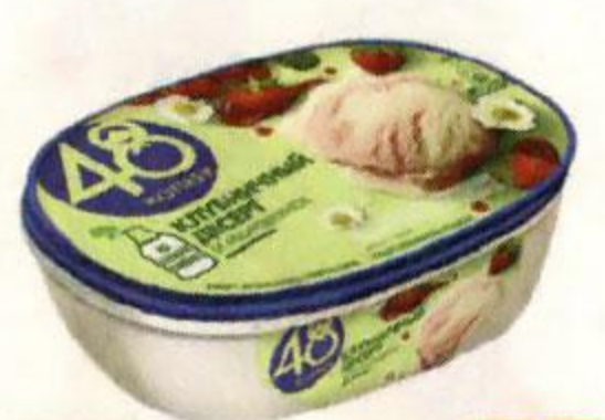
Мороженое 48 КОПЕЕК молочное, клубничный десерт, 491 г