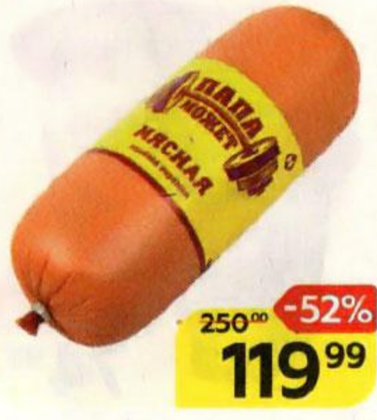
Колбаса ПАПА МОЖЕТ , Мясная, вареная (ОМПК), 500 г