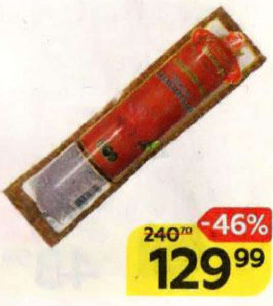
Сервелат КРЕМЛЕВСКИЙ , Варено-копченый (МПК Атяшевский), 600 г