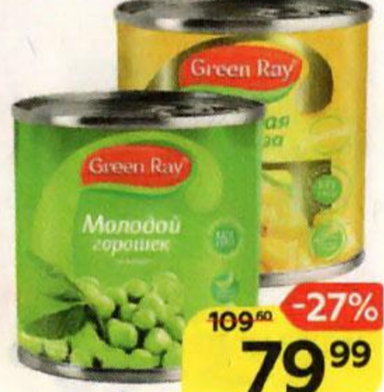
GREEN RAY , Горошек, 400 г ; Кукуруза, 340 г