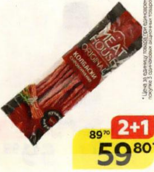
Колбаски MEAT HOUSE , Ориджинал, сырокопченые (Атяшевский МПК), 100 г