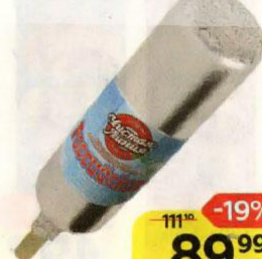
Мороженое ЧИСТАЯ ЛИНИЯ , Российское, в молочном шоколаде, 80 г