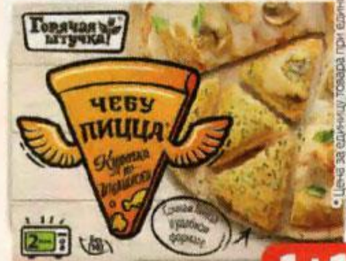
Чебулицца ГОРЯЧАЯ ШТУЧКА , Курочка по-итальянски, 250 г