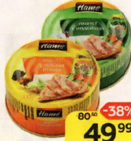
Паштет НАМЕ с мясом птицы/ с гусиной печенью/ с индейкой, 117 г