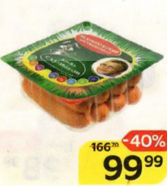
Сосиски ДЕТЯМ с кроликом (Великолукский МК), 330 г