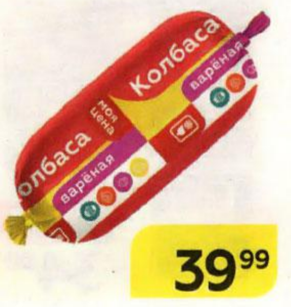
Колбаса МОЯ ЦЕНА , вареная, 400 г