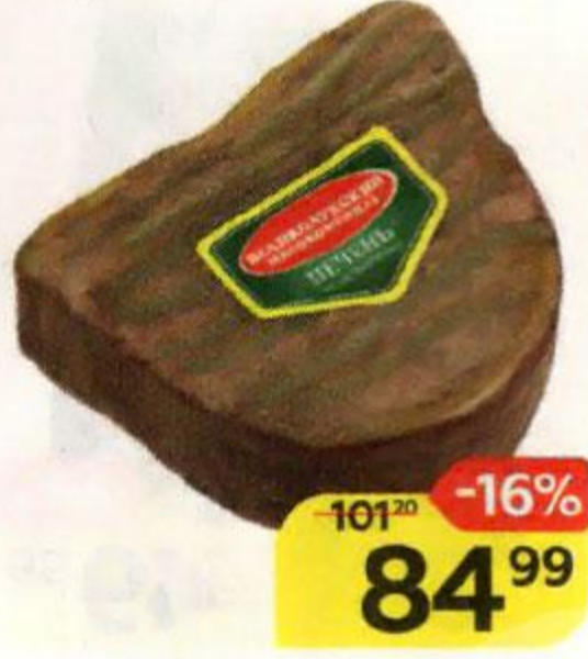
Печень ПО-ДОМАШНЕМУ вареная (Великолукский МК), 300 г