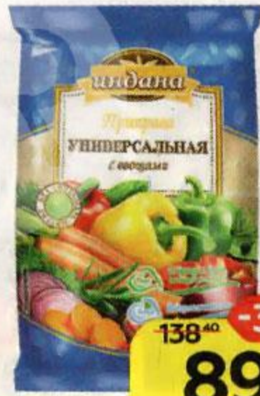
Приправа ИНДАНА , Универсальная, с овощами, 250 г