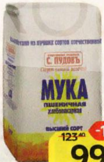
Мука пшеничная С. ПУДОВЪ , высший сорт, 2 кг