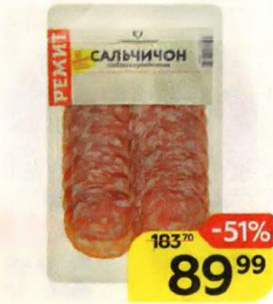
Колбаса РЕМИТ Сальчичон, сырокопченая нарезка, 70 г