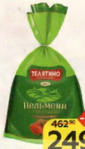
Пельмени ТЕЛЯТИНО , с телятиной, 800 г