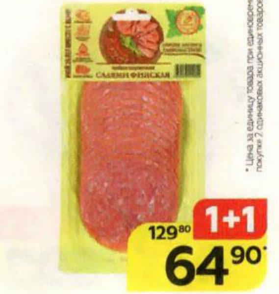
Салами ФИНСКАЯ полукопченая, нарезка (Иней), 100 г