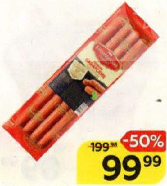
Сосиски БАВАРСКИЕ (Владимирский Стандарт), 420 г