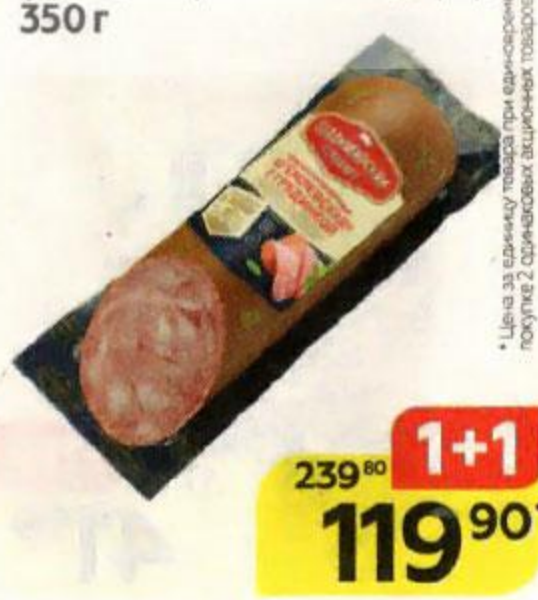
Колбаса КРЕМЛЕВСКАЯ , с грудинкой, полукопченая (Владимирский Стандарт), 350 г