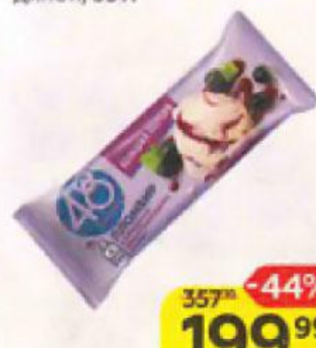
Мороженое 48 КОПЕЕК пломбир с черной сморо- диной, 351 г