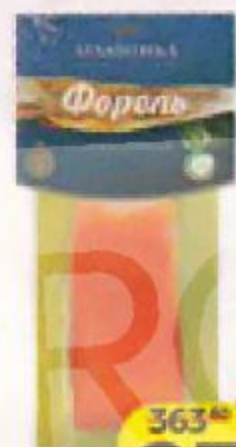
Форель АТЛАНТИКА слабо- соленая, филе-кусочки, 150 г