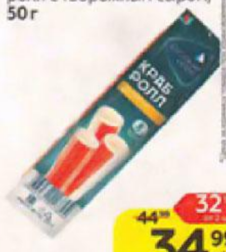
Крабовые палочки РУССКОЕ МОРЕ краб- ролл с творожным сыром, 50 г