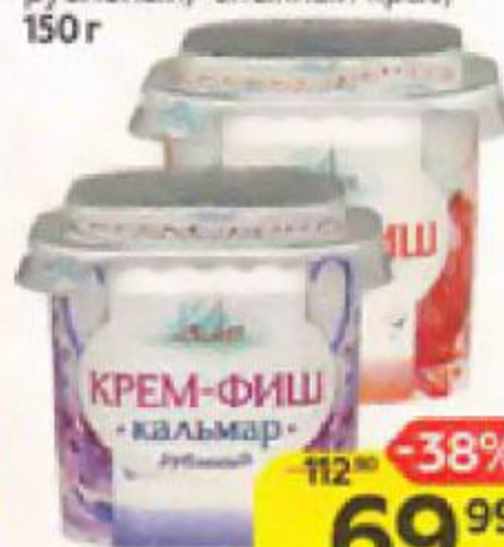
Паста рыбная КРЕМ-ФИШ горбуша-скуприя/ кальмар рубленый/ снежный краб, 150 г