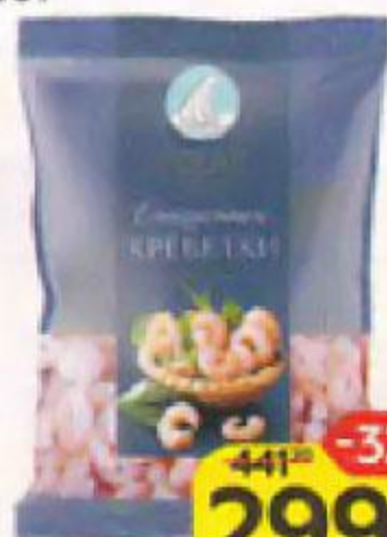
Креветки POLAR очищен- ные, варено-мороженые, 300 г