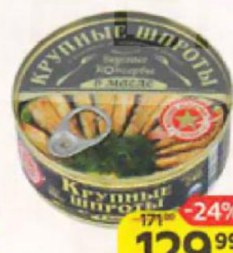
Шпроты крупные ВКУСНЫЕ КОНСЕРВЫ , в масле, 240 г