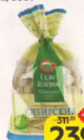
Пельмени СЕЛО ЗЕЛЕНОЕ Сибирские, свинина-говя- дина, 800 г