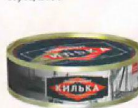
Килька ДОБРОФЛОТ балтийская, в томатном соусе, 240 г