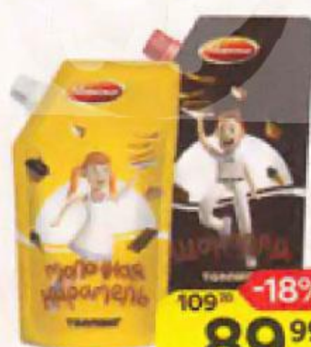
Топпинг АБРИКО карамель молочная/ шоколад, 270 г