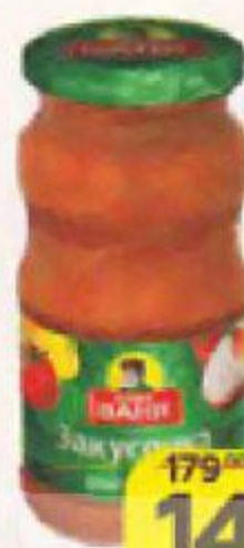
Закуска ДЯДЯ ВАНЯ , Венгерская, 460 г