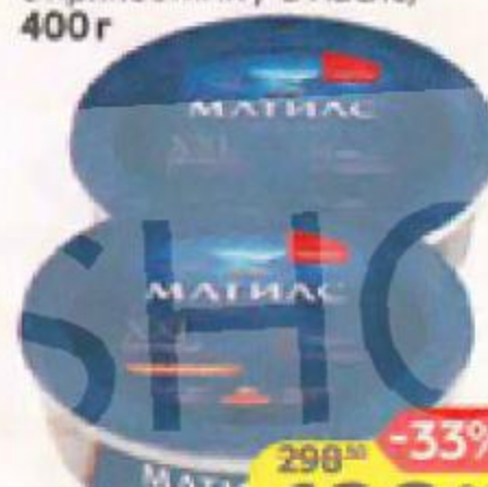
Сельдь МАТИАС XXL сла- босоленая, филе-кусочки: с пряностями / в масле, 400 г