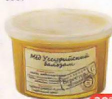
Мед УССУРИЙСКИЙ БАЛЬЗАМ (ЧП Берестова), 360 г