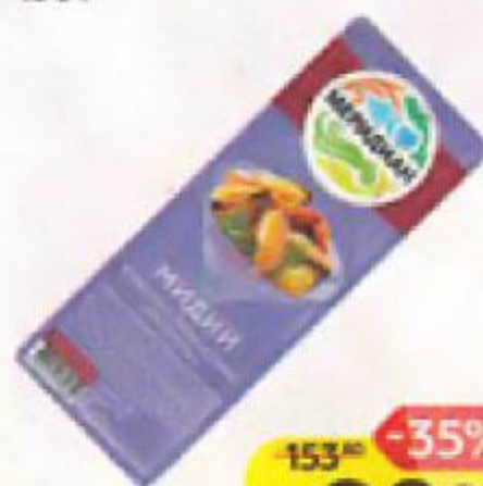
Мидии МЕРИДИАН в масле с пряностями Брушета, 150 г