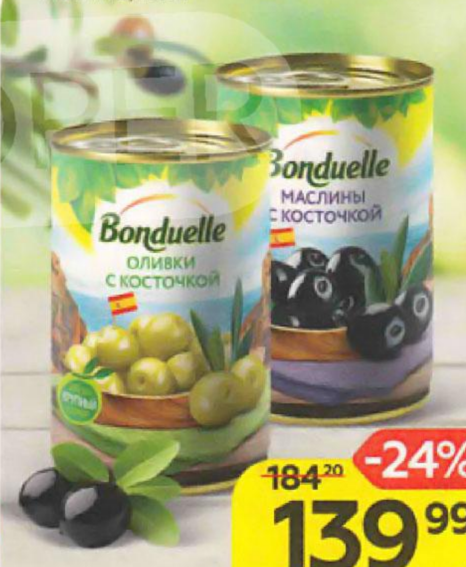
BONDUELLE , с косточкой: Оливки/ Маслины, 300 г