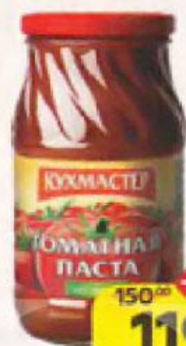
Паста томатная КУХМАСТЕР , 480 г