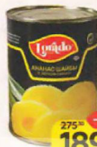
Ананасы LORADO , шайбы, 580 мл