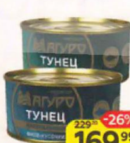
Тунец МАГУРО филе: в масле/ натуральное, 170 г