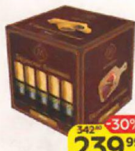
Блинчики МЗАРЕУЛИ Грузинские с мясом, 480 г