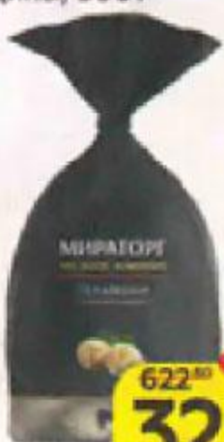
Пельмени МИРАТОРГ , Блэк ангус, из мраморной говядины, 800 г