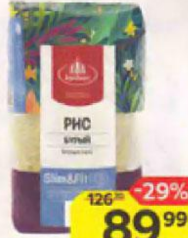
Рис ЭКСТРА , Бурый, Слим и Фит (Агро-Альянс), 800 г