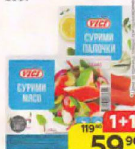
VICI , охлажденные: Суrimi палочки/ Суrimi мясо, 200 г