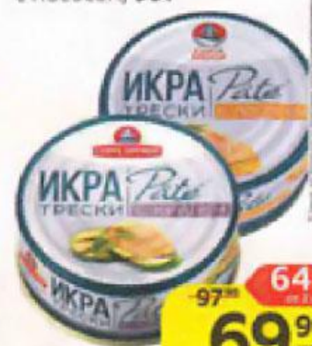
Икра трески САНТА БРЕМОР Патэ: с крилем/ с лососем, 90 г