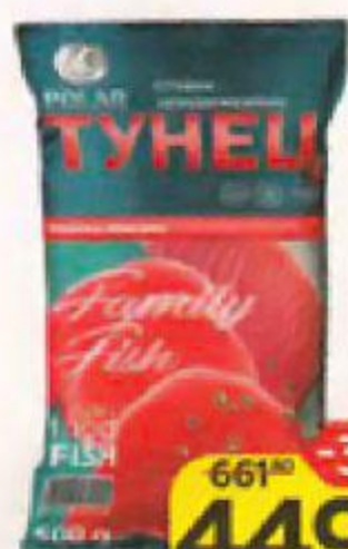
Тунец POLAR стейки замороженные, 500 г