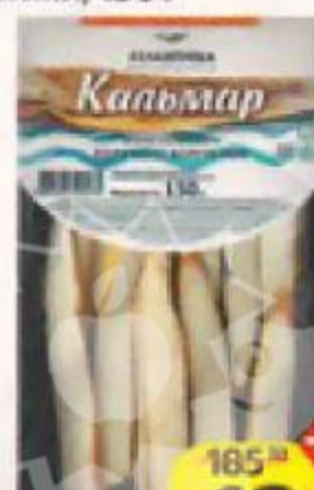
Кальмар АТЛАНТИКА горячего копчения, филе- ломтики, 150 г