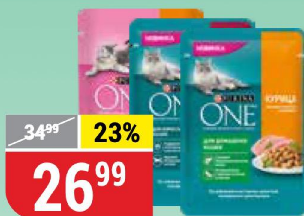
КОРМ ДЛЯ КОШЕК PURINA ONE в ассортименте, 75 г