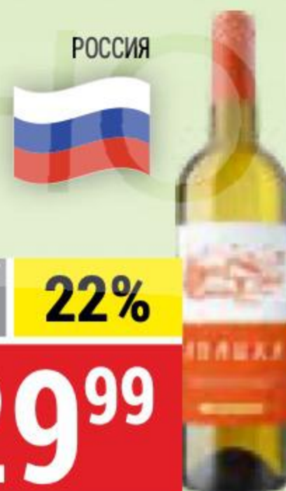
ВИНО АПАЦХА белое, полусладкое, 11%, 0,75 л