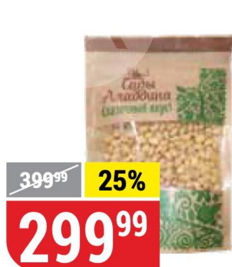
КЕДРОВЫЙ ОРЕХ ядра сушеные, Сады Аладдина, 100 г