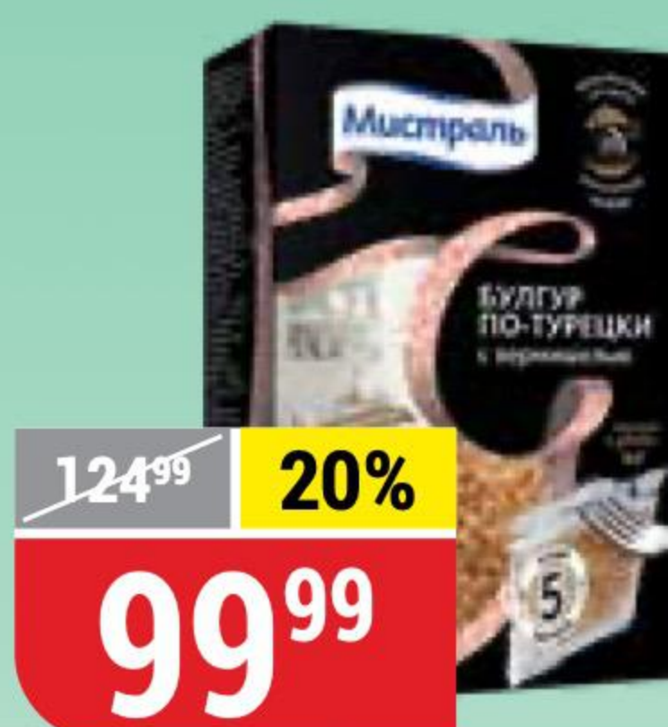
БУЛГУР ПО-ТУРЕЦКИ С ВЕРМИШЕЛЬЮ Мистраль, 400 г