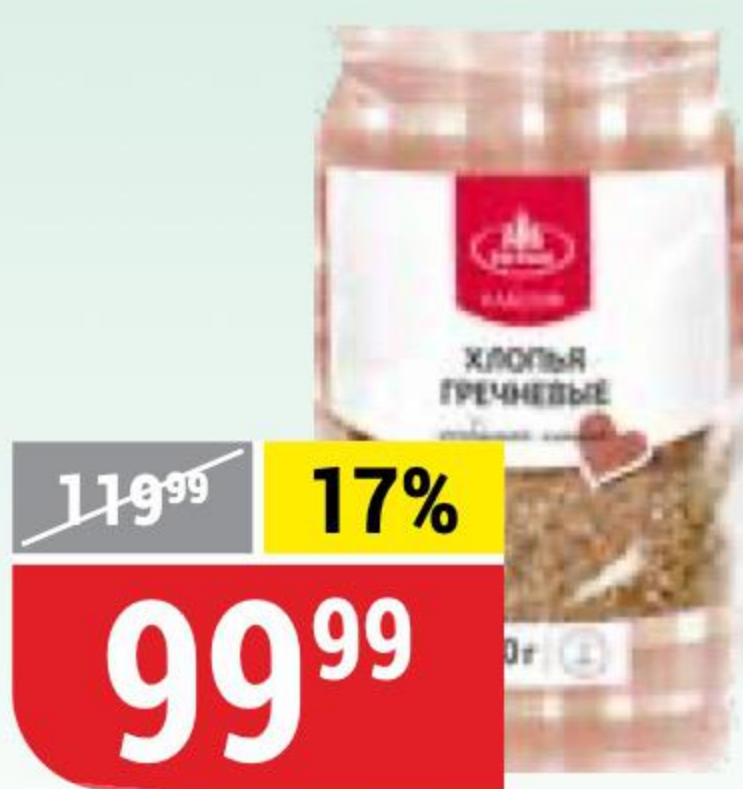
ХЛОПЬЯ ГРЕЧНЕВЫЕ классик, Агро-Альянс, 400 г