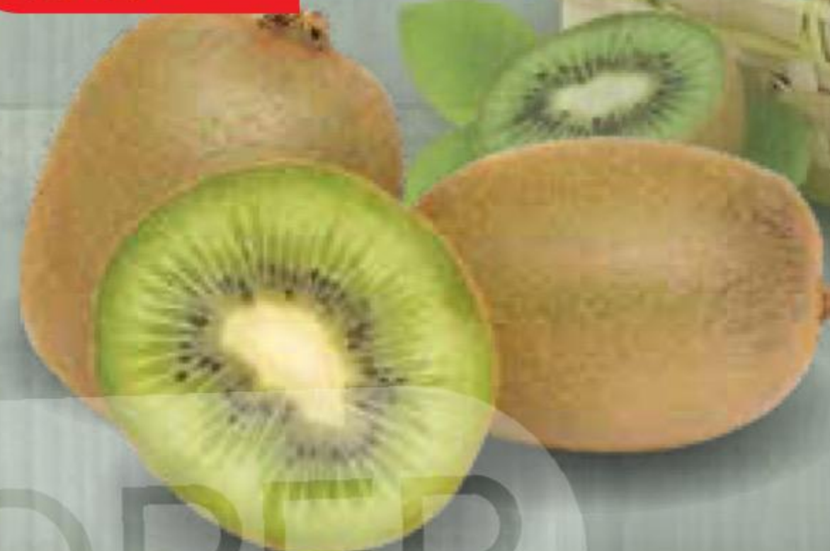
КИВИ 1 кг