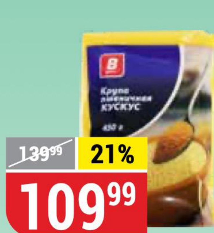
КУСКУС В 450 г