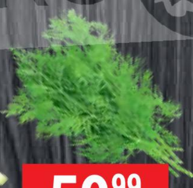
ЛУК ЗЕЛЕНЫЙ Green Vitamin, 100 г