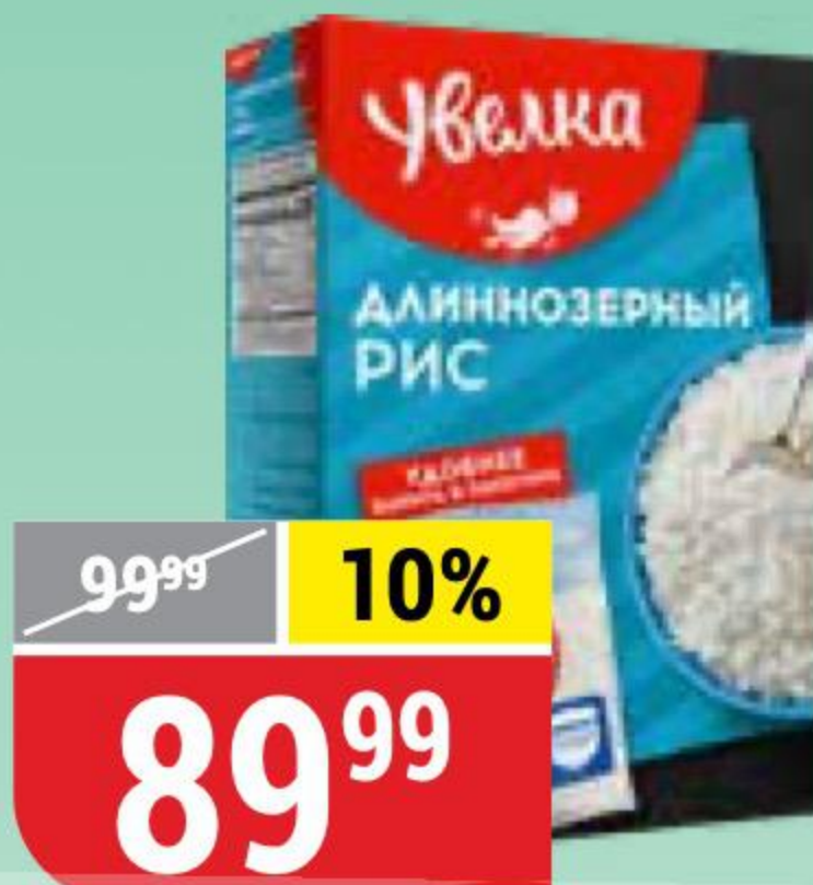
РИС ДЛИННОЗЕРНЫЙ шлифованный, Увелка, 5 пак. x 80 г