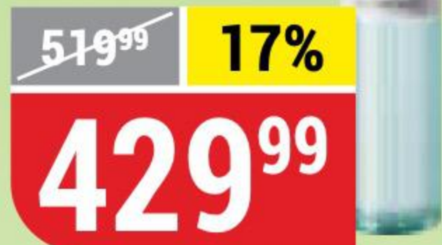
ВОДКА СВЕРКАЮЩИЙ ИНЕЙ 40%, 0,5 л