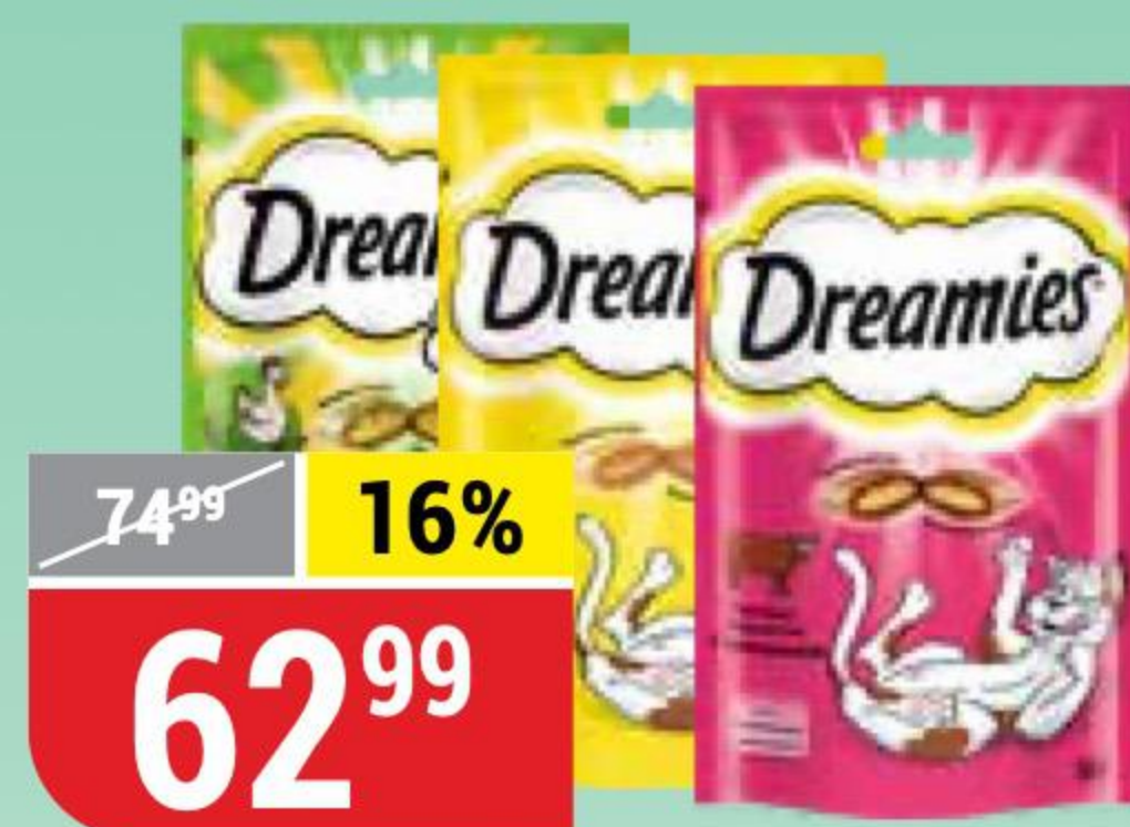
КОРМ ДЛЯ КОШЕК DREAMIES в ассортименте, 60 г