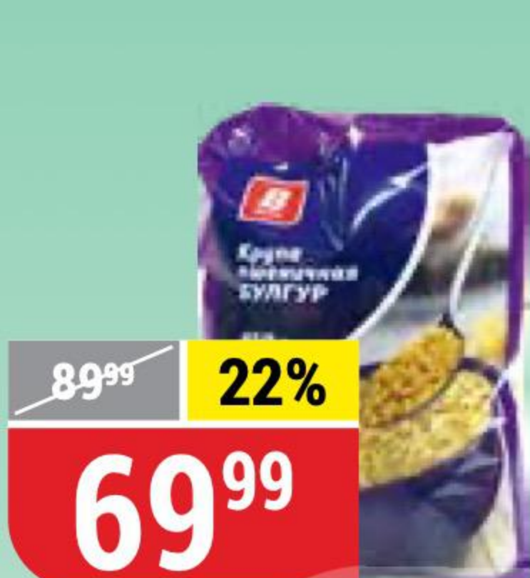
БУЛГУР В 450 г