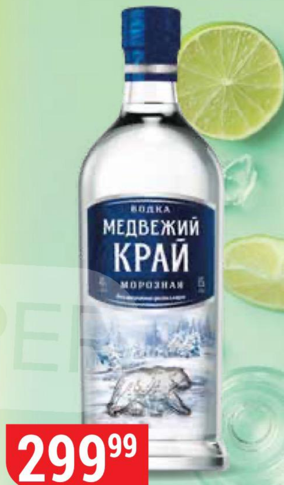
ВОДКА МЕДВЕЖИЙ КРАЙ морозная, 40%, 0,5 л

ЧРЕЗМЕРНОЕ УПОТРЕБЛЕНИЕ АЛКОГОЛЯ ВРЕДИТ ВАШЕМУ ЗДОРОВЬЮ