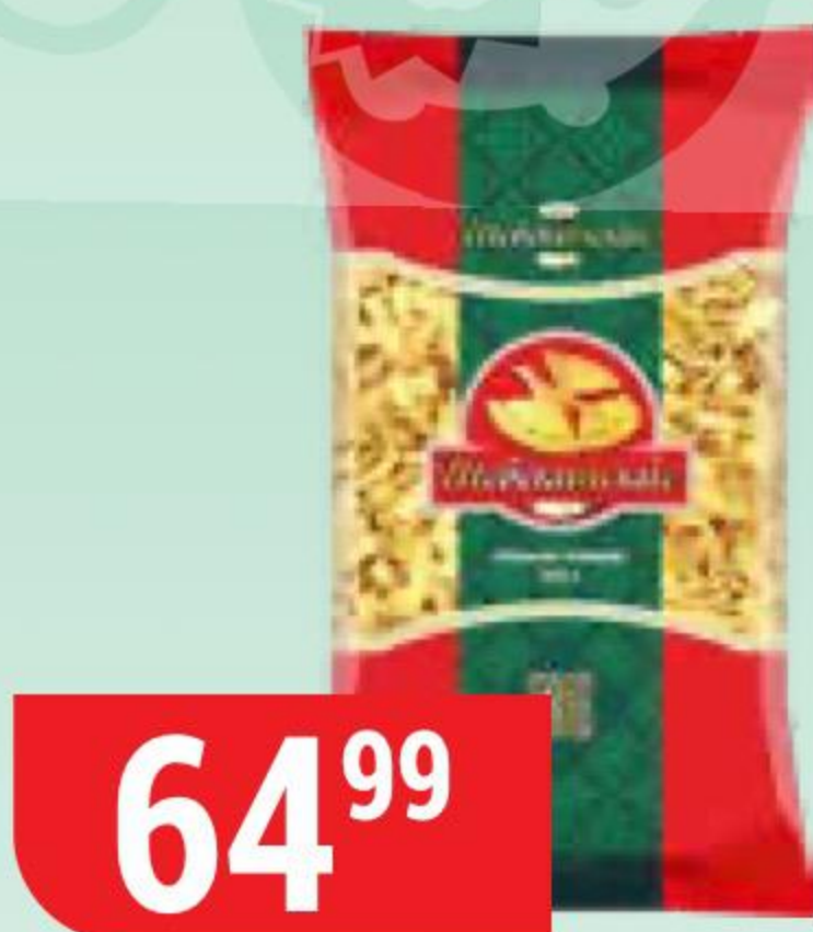
МАКАРОНЫ ШЕБЕКИНСКИЕ лапша лагман, 350 г