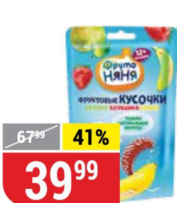
ФРУКТОВЫЕ КУСОЧКИ ФРУТОНЯНЯ яблоко-клубника-банан, 15 г