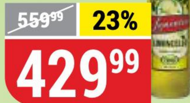
ЛИКЕР LIMONCELLO 30%, Lamonica, 0,5 л