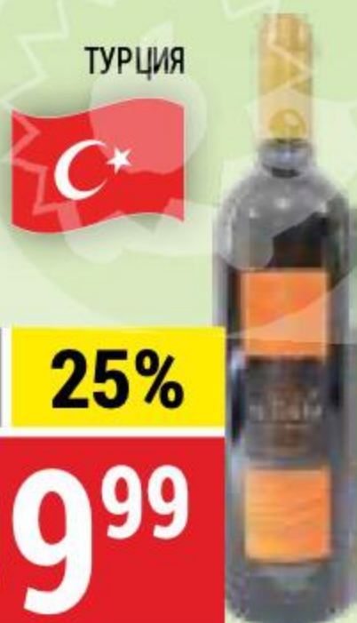
ВИНО EL TERRA красное, полусладкое, 11%, 0,75 л