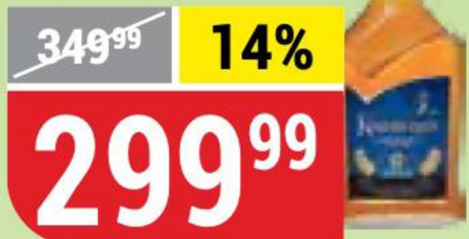
КОНЬЯК КИНОВСКИЙ 3 года, 40%, 0,25 л