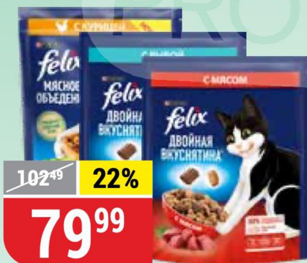
КОРМ ДЛЯ КОШЕК FELIX в ассортименте, 200 г