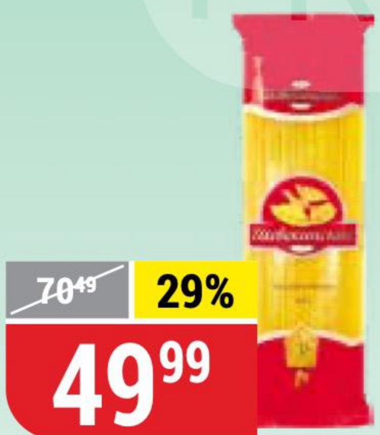
МАКАРОНЫ ШЕБЕКИНСКИЕ спагетти, 450-500 г