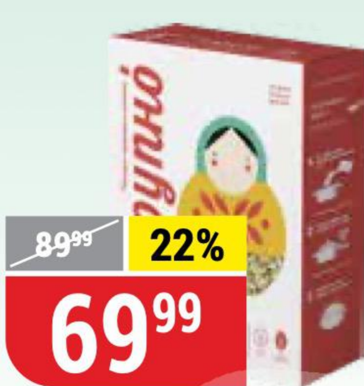
СМЕСЬ ХЛОПЬЕВ 7 ЗЛАКОВ Крупно, 400 г