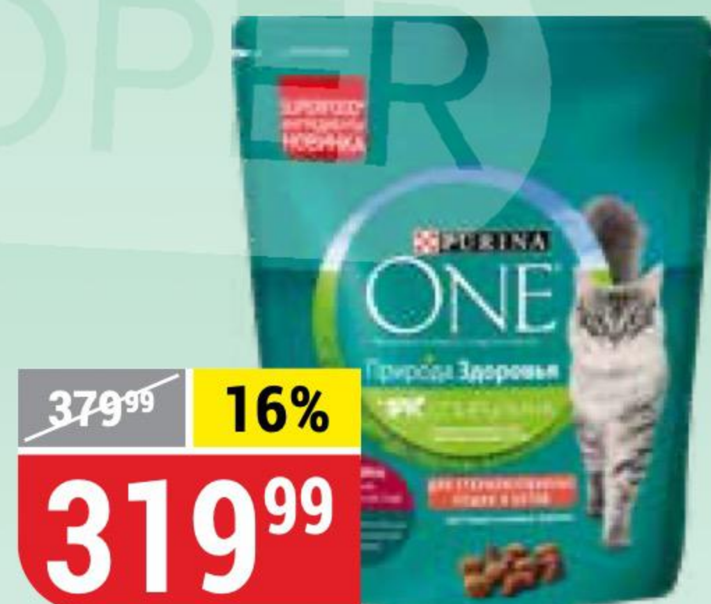
КОРМ ДЛЯ КОШЕК PURINA ONE для стерилизованных кошек, говядина, 680 г