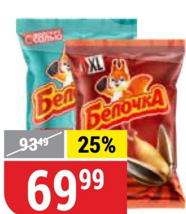
СЕМЕЧКИ БЕЛОЧКА жареные, XL; с морской солью, 100-140 г