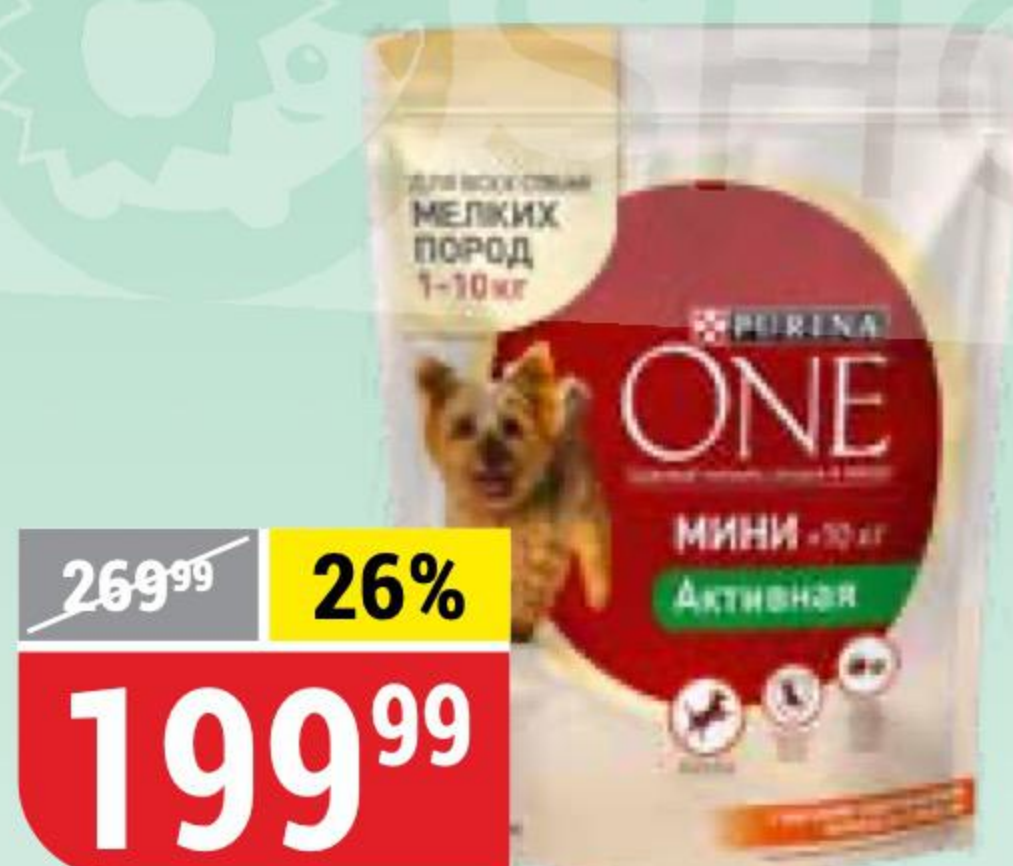
КОРМ ДЛЯ СОБАК PURINA ONE для мелких пород, курица-рис, 600 г