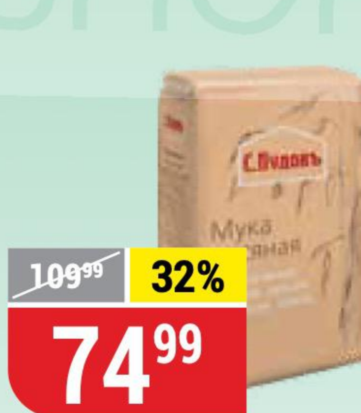
МУКА ОВСЯНАЯ С. Пудовъ, 400 г