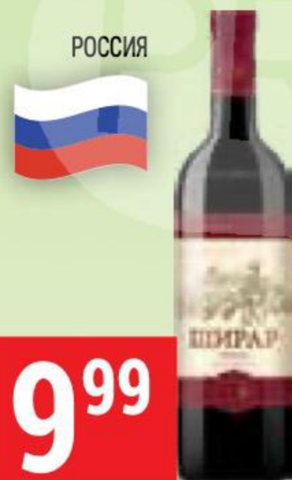
ВИНО ШИРАП красное, сухое, 10-11%, 0,75 л