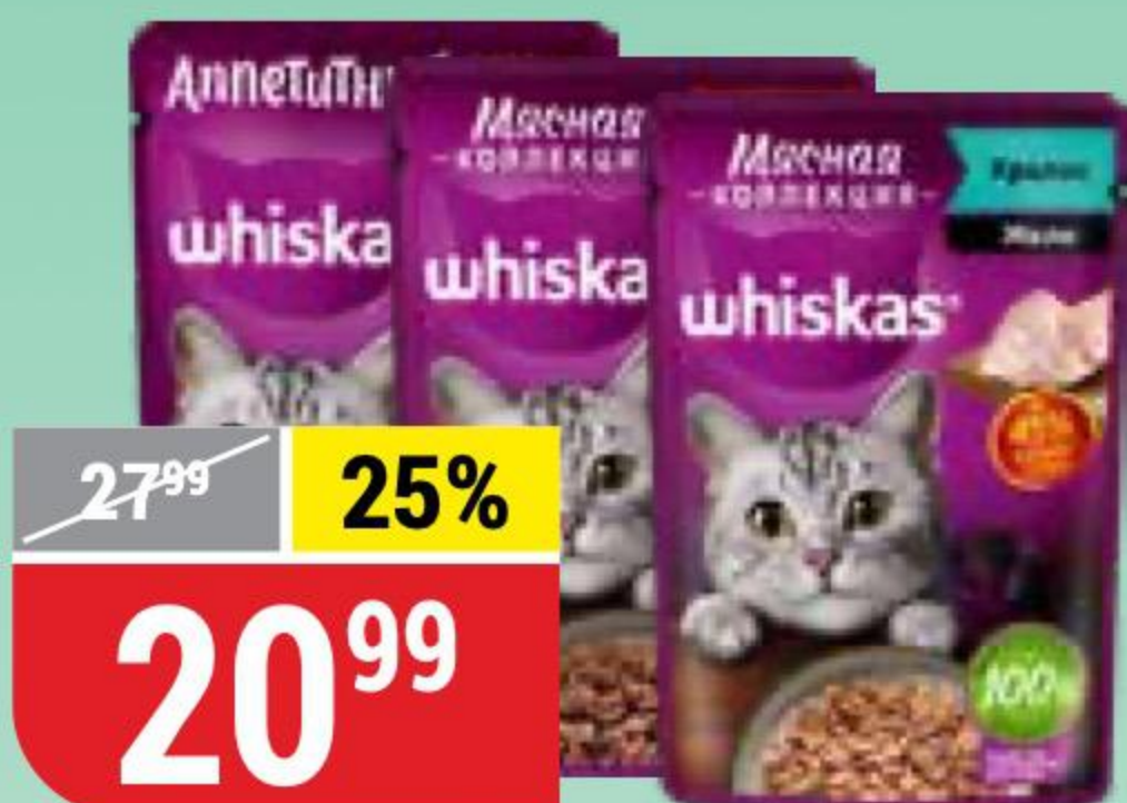
КОРМ ДЛЯ КОШЕК WHISKAS в ассортименте, 75 г