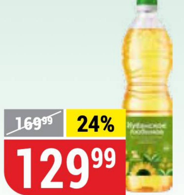
МАСЛО ПОДСОЛНЕЧНОЕ КУБАНСКОЕ ЛЮБИМОЕ рафинированное, с добавлением оливкового, 800 мл