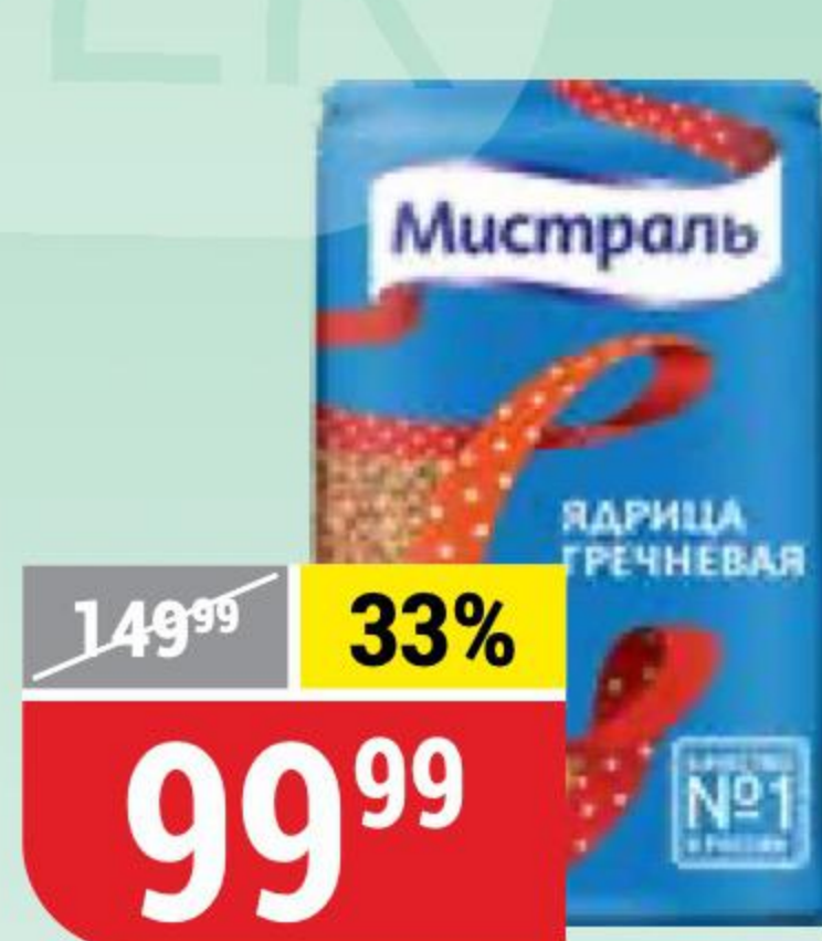
КРУПА ГРЕЧНЕВАЯ ядрица, Мистраль, 900 г