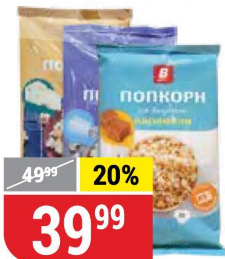
ПОПКОРН В в ассортименте, 80 г