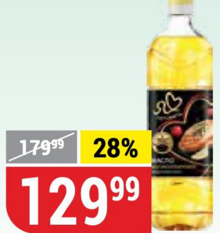
МАСЛО ПОДСОЛНЕЧНОЕ высокоолеиновое, Я Люблю Готовить, 800 мл