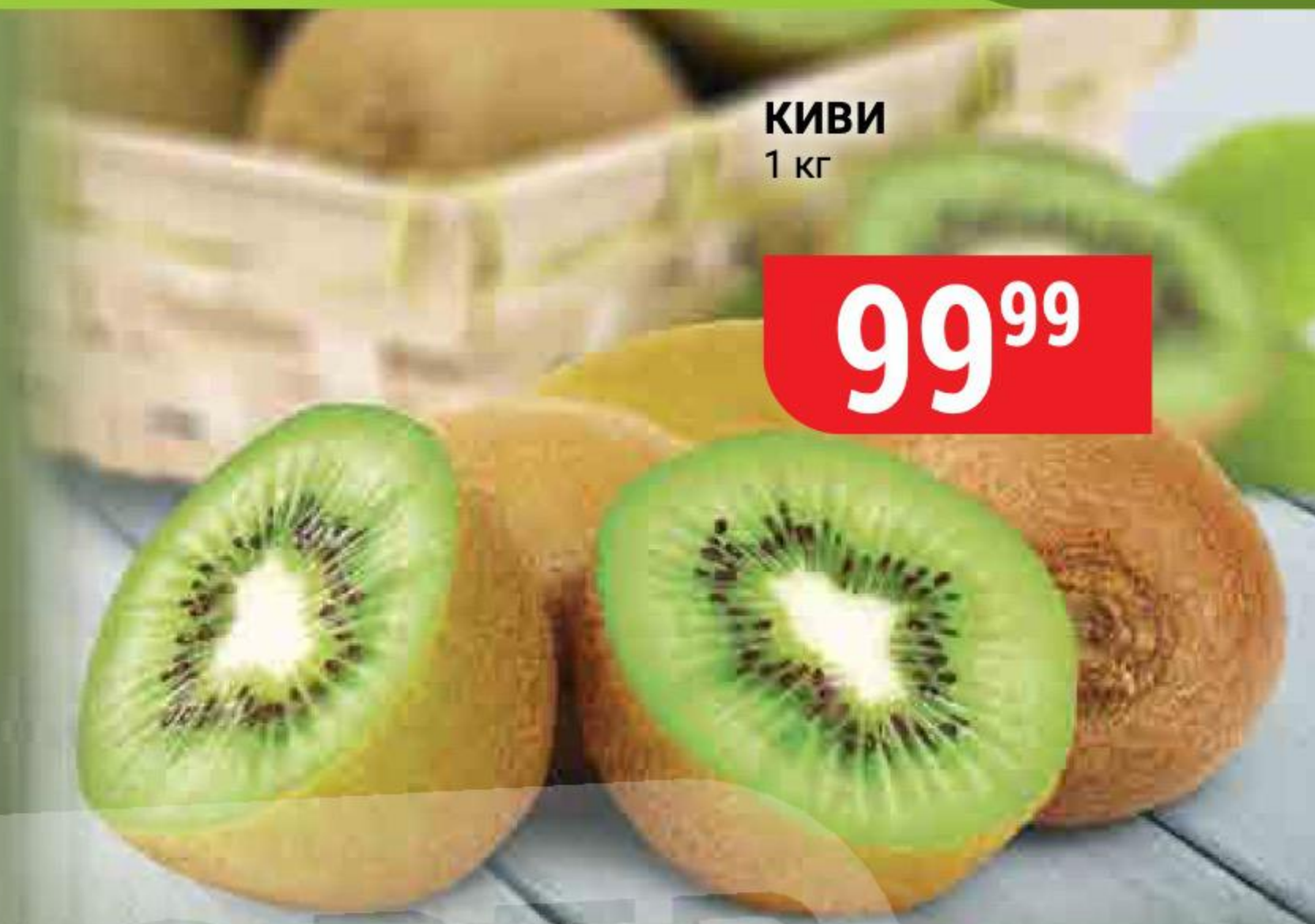
КИВИ 1 кг