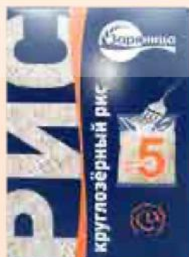
РИС КРУГЛОЗЕРНЫЙ Заряница, 400 г