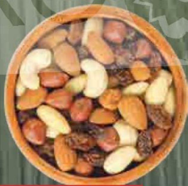
СМЕСЬ ЦУКАТЫ-ОРЕХИ-СУХОФРУКТЫ 100 г