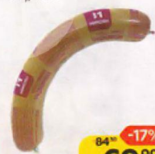
Колбаса ТРАДИЦИОННАЯ Ливерная (Микояновский МК), 400 г