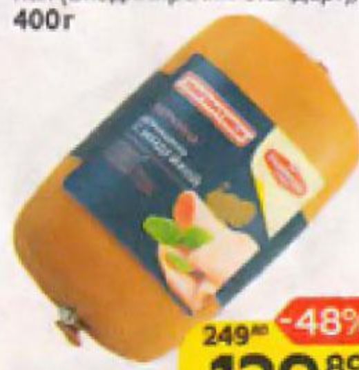
Ветчина МАГНИТИКИ Домашняя с индейкой вареная (Владимирский Стандарт), 400 г