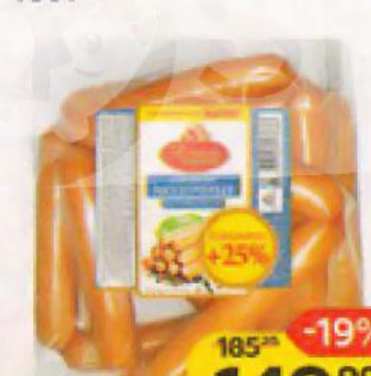
Сосиски АТЯШЕВО , Молочные, Высокий стандарт, 750 г