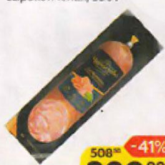
Колбаса ЧЕРКИЗОВО Premium, Сальчичон, сырокопченая, 350 г