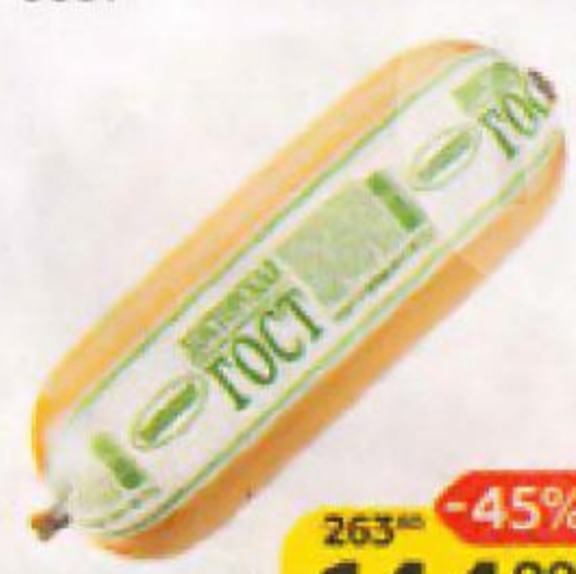
Колбаса ДОКТОРСКАЯ , ГОСТ (Великолукский МК), 500 г