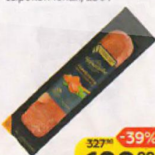
Колбаса ЧЕРКИЗОВО Premium, Сервелетти, сырокопченая, 250 г