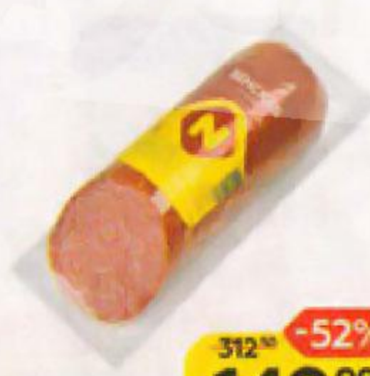
Салями ВЕНСКАЯ , полу- копченая (ОМПК), 420 г