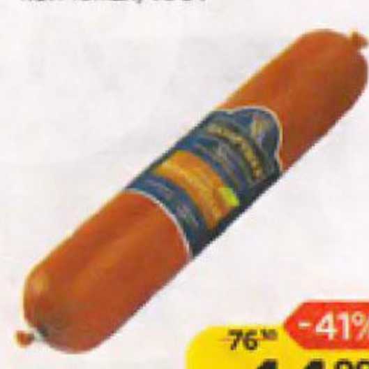
Колбаса БАВАРУШКА Бальбургская варено- копченая, 100 г