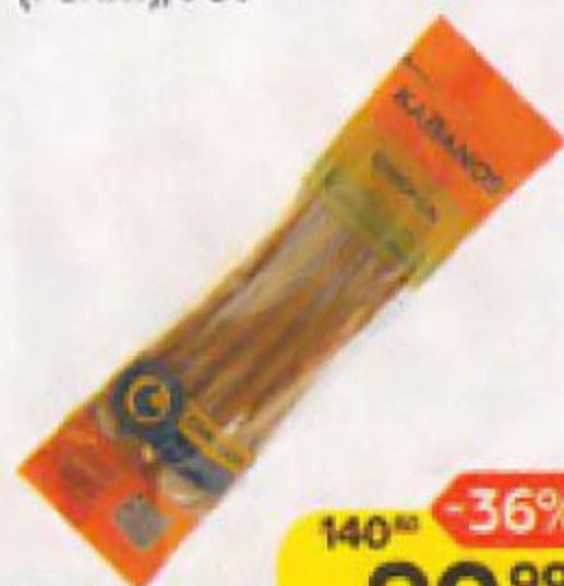
Колбаски КАВАНΟΣ® , с курицей, сырокопченые (Ренит), 70 г