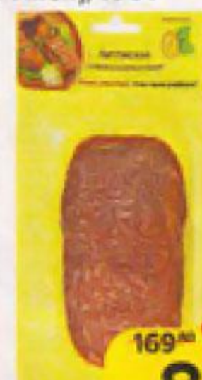
Колбаса ЛИТОВСКАЯ , Сырокопченая, нарезка (ООО Иней), 100 г