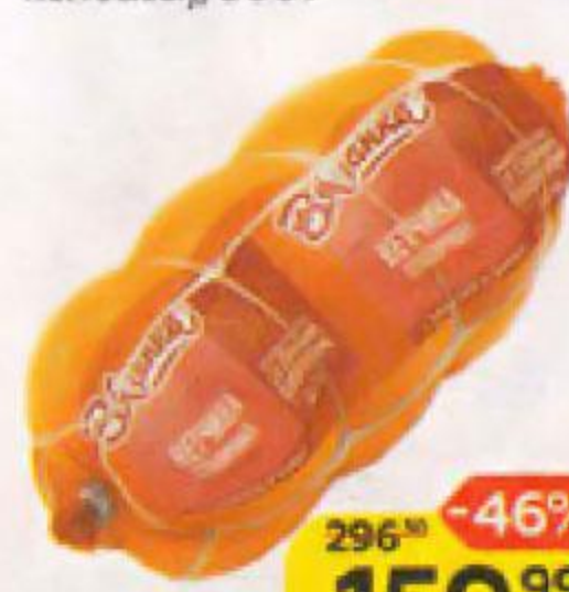
Ветчина СТОЛИЧНАЯ , Вязанка (Стародворские колбасы), 500 г