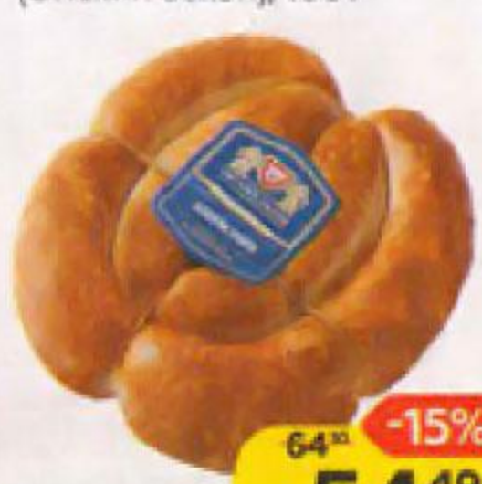
Колбаски КИЕВСКИЕ , мини, полукопченые (Омский бекон), 100 г