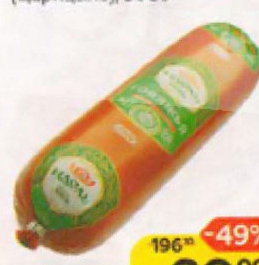
Колбаса ИДЕЛЬ , Говяжья, полукопченая, халяль (Царицыно), 500 г