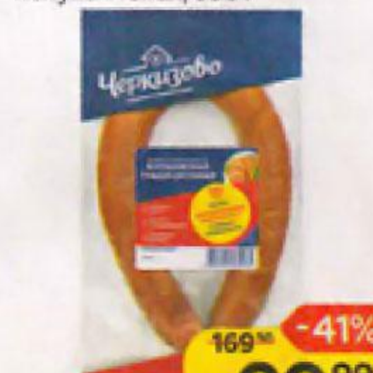
Колбаса ЧЕРКИЗОВО , Варшавская Традиционная, полукопченая, 350 г