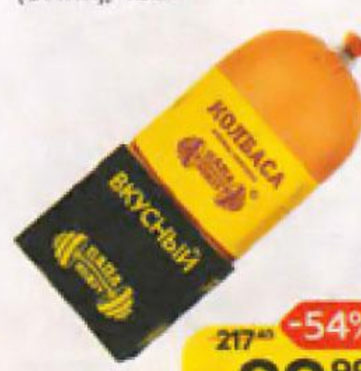
Колбаса ПАПА МОЖЕТ Палин завтрак, вареная (ОМПК), 400 г