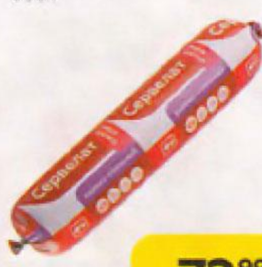
Сервелат МОЯ ЦЕНА Деревенский варено-копченый, 600 г