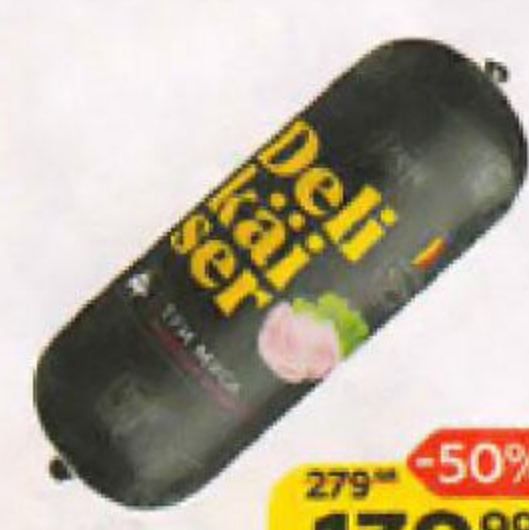
Колбаса DELIKAISER Три мяса, вареная, 400 г