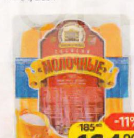
Сосиски ЧЕРКАШИН И ПАРТНЕР Молочные, ГОСТ, 285 г