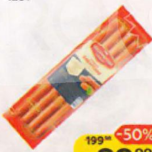
Сосиски БАВАРСКИЕ (Владимирский Стандарт), 420 г