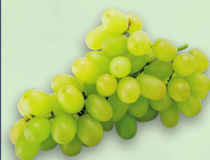
ВИНОГРАД ЗЕЛЕНый, весовой, 1 кг