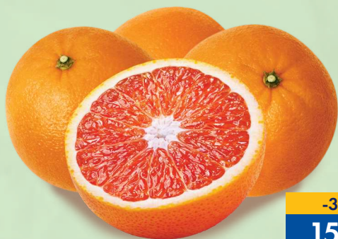
АПЕЛЬСИНЫ, с красной мякотью, весовые, 1 кг