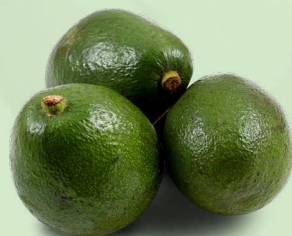
АВОКАДО, весовое, 1 кг