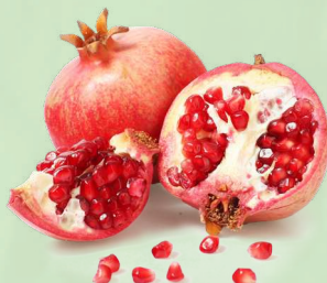
ГРАНАТЫ, весовые, 1 кг