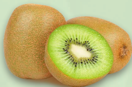
КИВИ, весовой, 1 кг