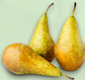
ГРУША КОНФЕРЕНЦ, весовая, 1 кг