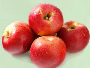
ЯБЛОКИ АЙДАРЕД, весовые, 1 кг