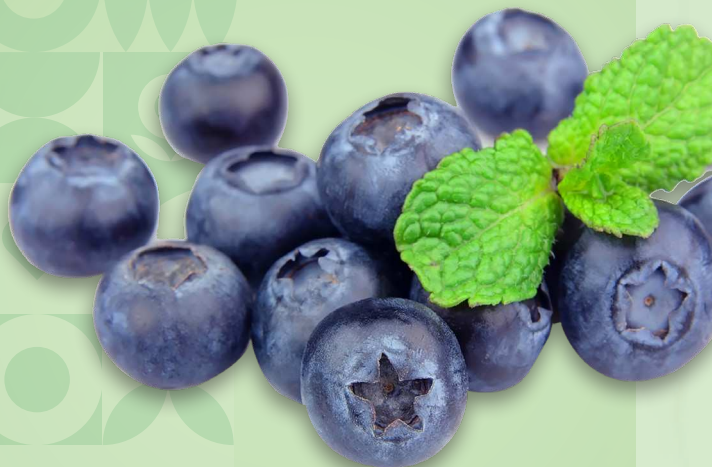
ГОЛУБИКА, 125 г