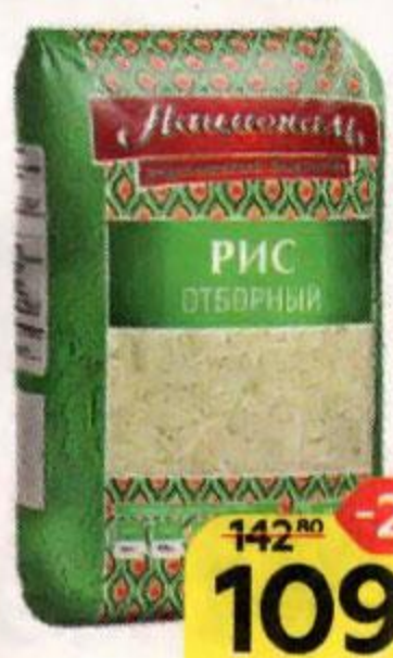
Рис НАЦИОНАЛЬ , Отборный, длиннозерный, 900 г