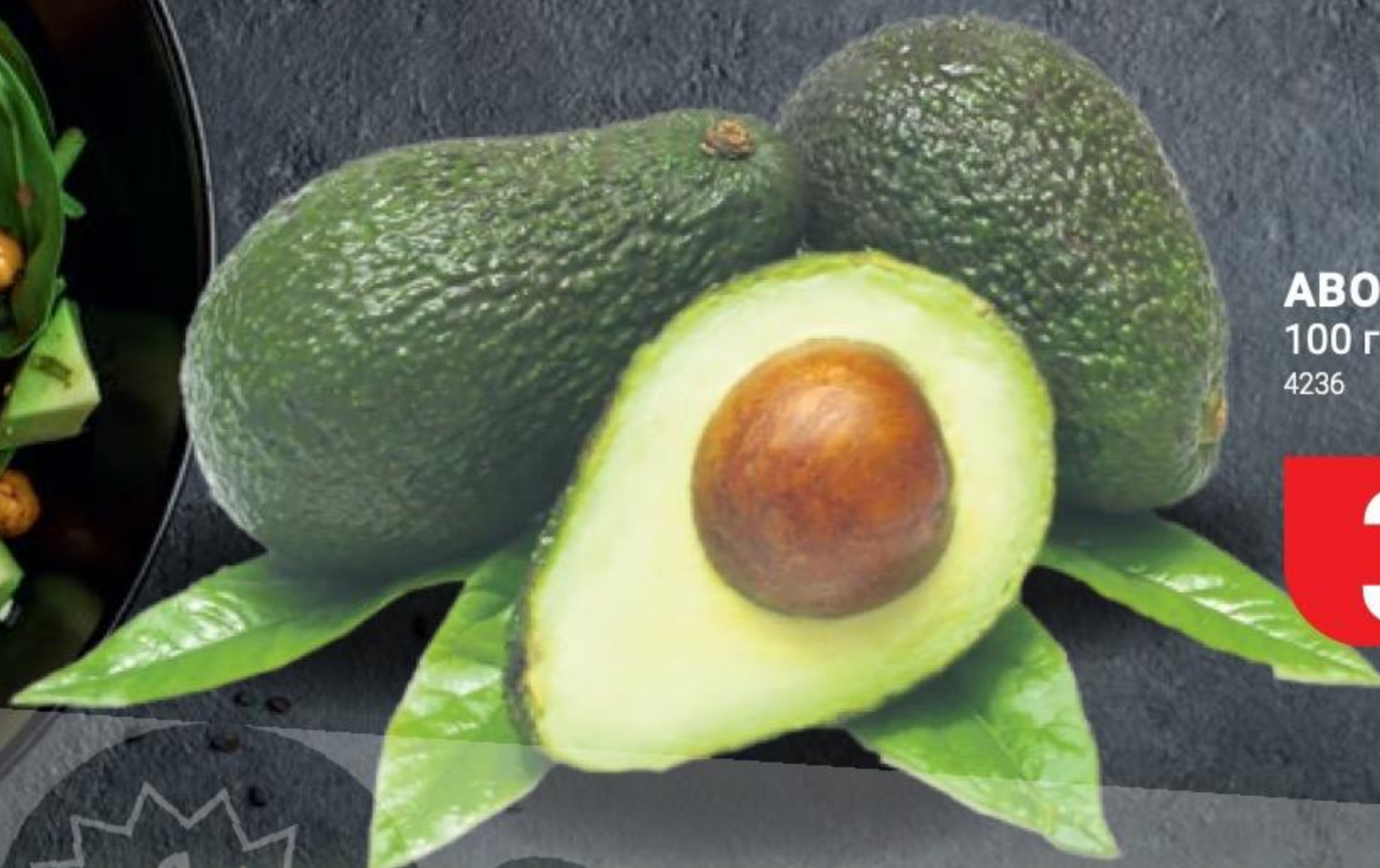
АВОКАДО 100 г 4236