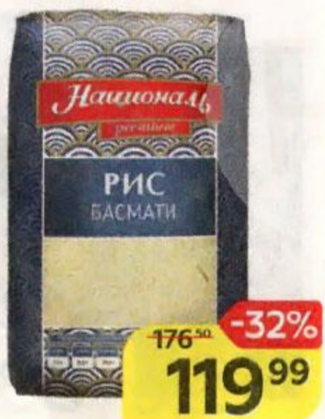
Рис НАЦИОНАЛЬ , Басмати, 500 г