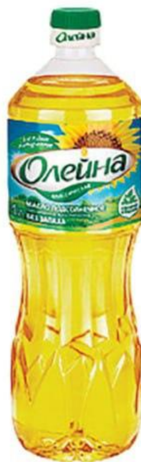
Масло подсолн. «Классическое», ТМ «Олейна», 1 л