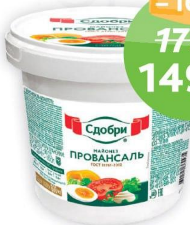
Майонез «Сдобри» Провансаль, вед., 770 г