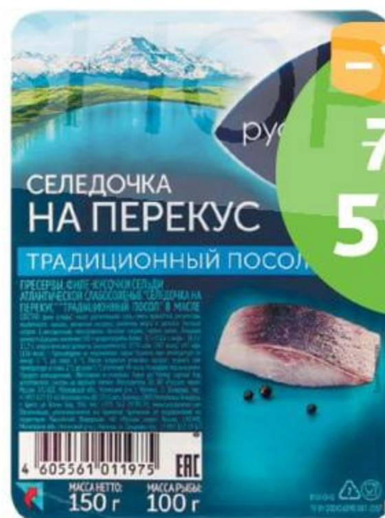
Сельдь на перекус, ТМ «Русское Море», пресервы, 150 г