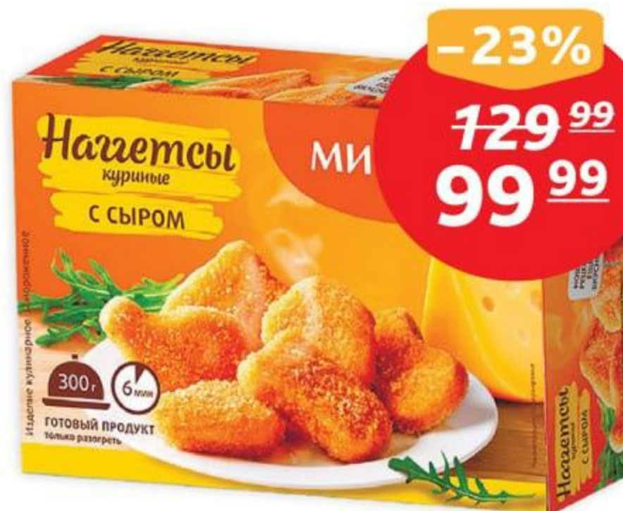
Наггетсы, ТМ «Мираторг», кур. с сыром, 300 г