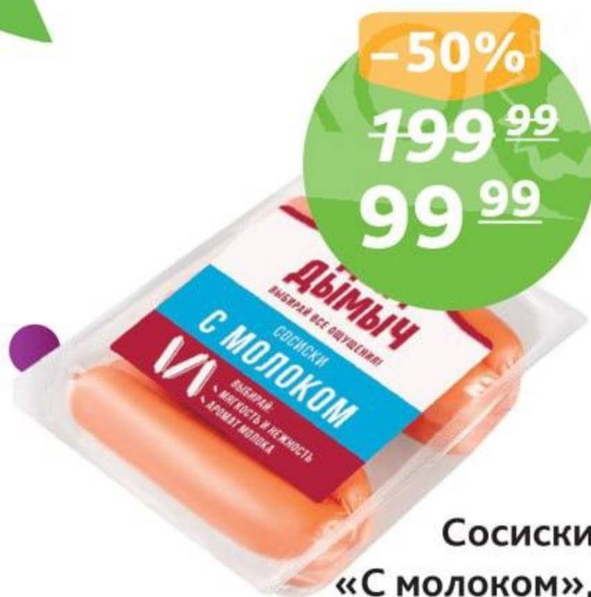
Сосиски «С молоком», ТМ «Дым Дымыч», 350 г