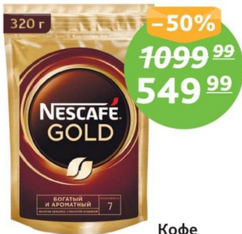
Кофе «Нескафе Голд», пакет, 320 г