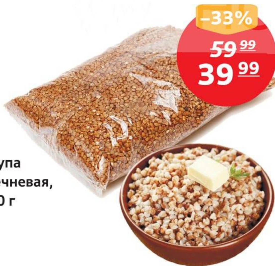
Крупа гречневая, 800 г