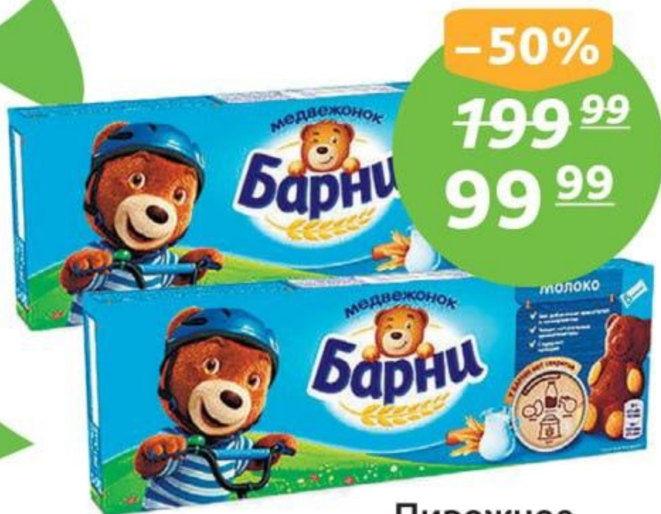
Пирожное, ТМ «Медвежонок Барни», мол., 150 г