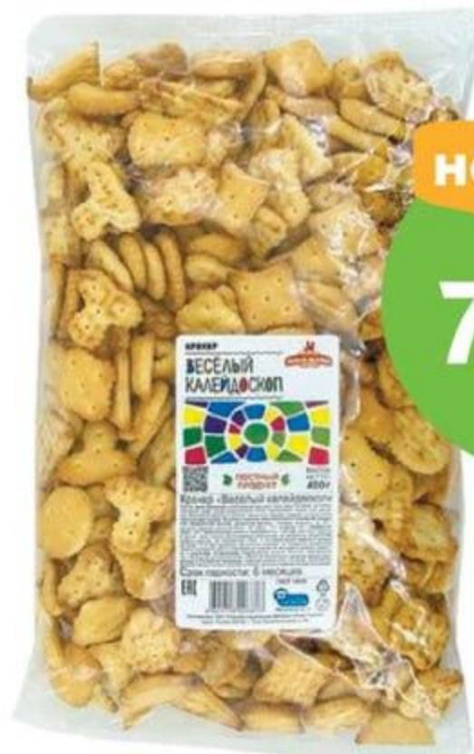
Крекер «Весёлый калейдоскоп», постный, 400 г