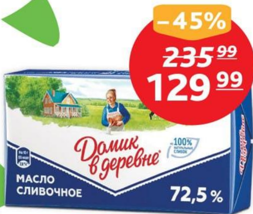
Масло сливоч. крестьян., 72.5%, ТМ «Домик в деревне», 180 г