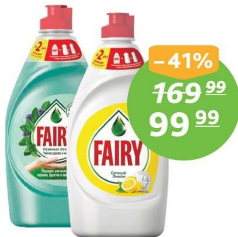
Ср-во для мытья посуды «Фейри», 450 мл, сочный лимон, чайн. дерево