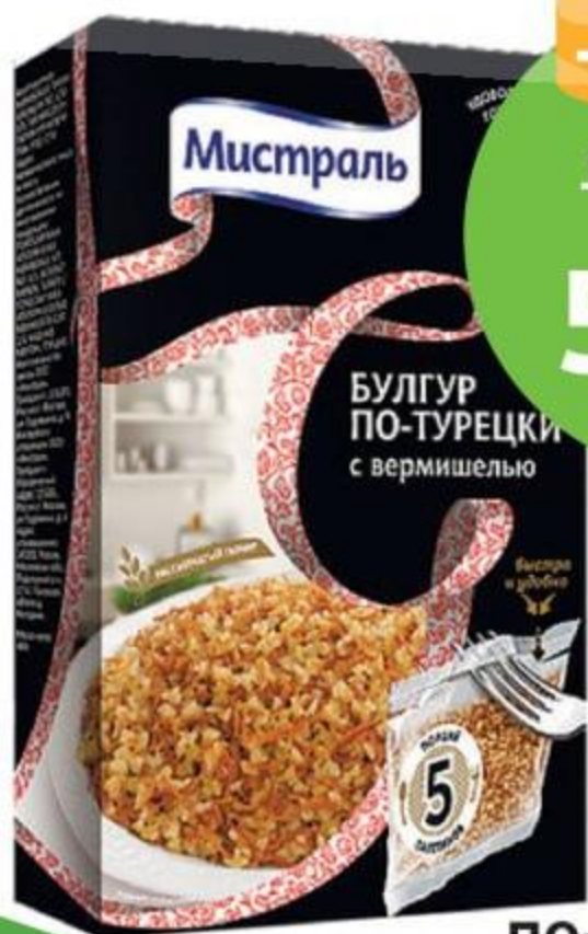
Булгур по-турецки, ТМ «Мистраль», 5*80 г