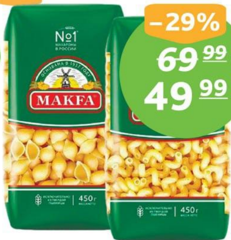
Макарон. изд. «Макфа», 450 г, витки, ракушки, спагетти