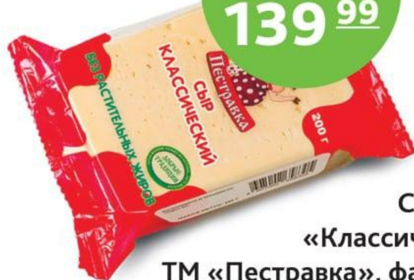
Сыр 45%, «Классический», ТМ «Пестравка», фас., 200 г