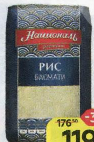
Рис НАЦИОНАЛЬ , Басмати, 500 г