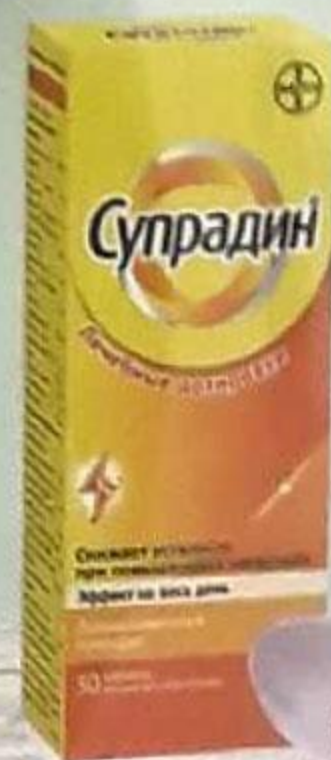
ТАБЛ. П. О. №30 П N016098/01