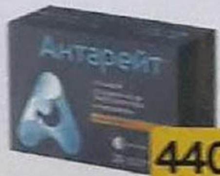
ТАБЛ. П. О. №40 П. №0266101