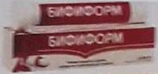
ТАБЛ. П. П. О. 5 МГ, №20 П. №0000091-РГ-РЛ