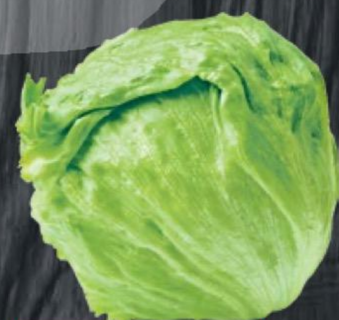
САЛАТНАЯ СМЕСЬ ТОСКАНА Белая Дача, 120 г 147961