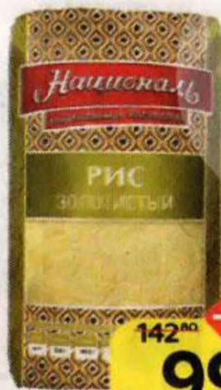
Рис НАЦИОНАЛЬ , золоти- стый, 900 г