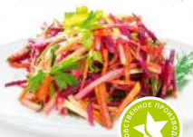
Салат Гренадер 1кг