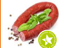
Колбаса по-краковски п/к 1кг