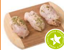
Рулет из куриного филе с сыром п/ф охлажденный 1кг