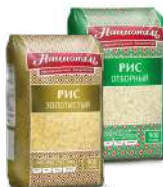
Рис Националь Отборный, Золотистый 900г