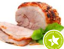
Буженина из мяса птицы в/к 1кг