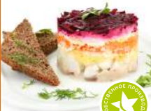
Салат Сельдь под шубой 1кг