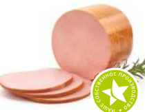
Колбаса Докторская вареная 1кг