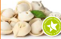
Пельмени Премиум, рыбные с горбушей и сливочным мас- лом п/ф охлажденный 1кг