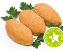
Котлеты Пожарские п/ф охлажденный 1кг