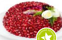
Салат Гранатовый браслет 1кг