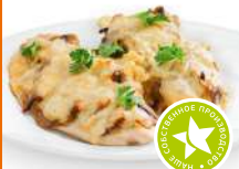
Свинина отбивная с грибным gratenom запеченная 1кг