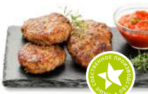
Котлеты по-селянски куриные жареные 1кг