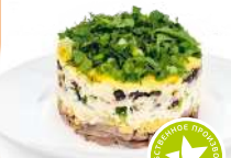
Салат слоеный с курицей и грибами 1кг