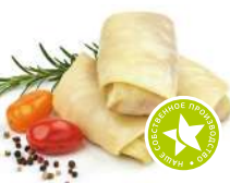
Голубцы по-деревенски п/ф охлажденный 1кг