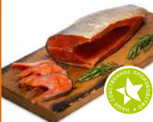
Кижуч спинка х/к 1кг