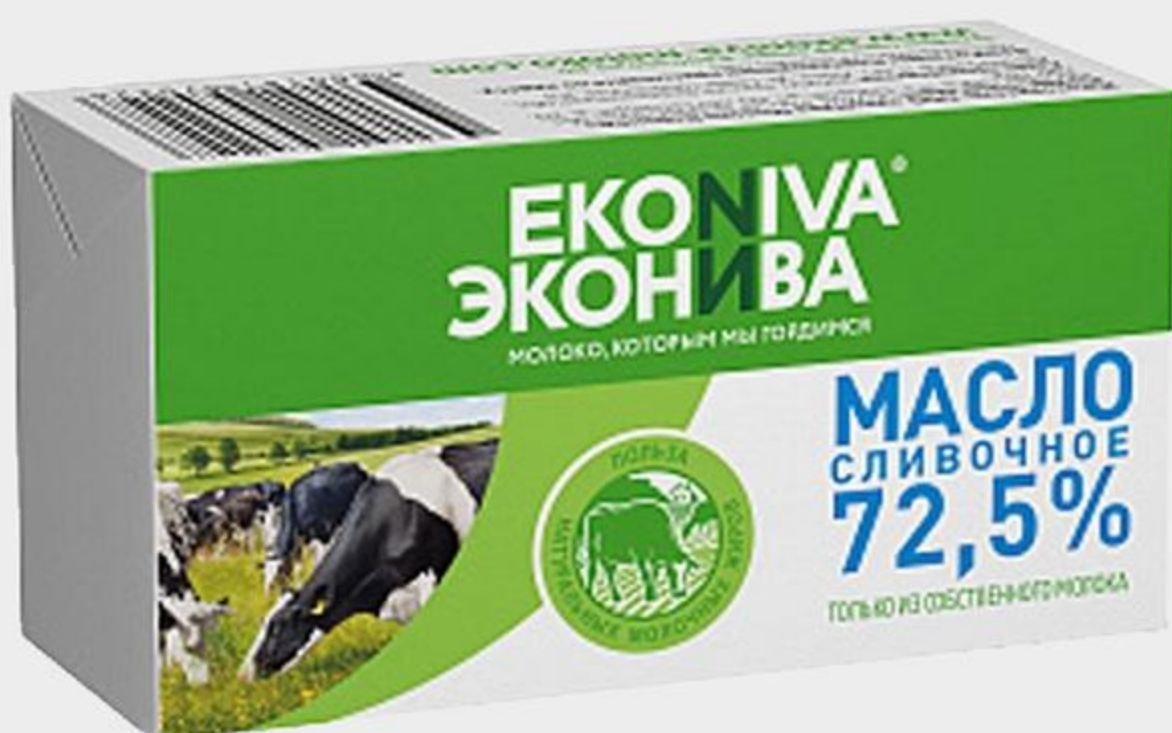
МАСЛО СЛИВОЧНОЕ ЭКОНИВА ТРАДИЦИОННОЕ, 72,5%, 180 Г