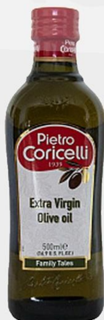
МАСЛО ОЛИВКОВОЕ PIETRO CORICELLI ЭКСТРА ВИРДЖИН, 500 МЛ