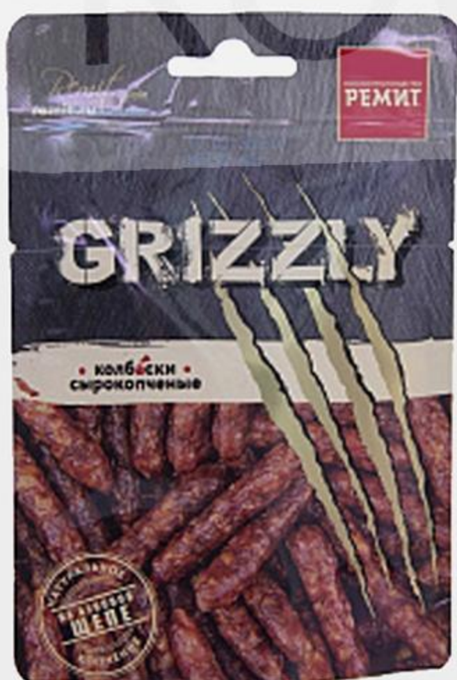
КОЛБАСКИ СЫРОКОПЧЕННЫЕ РЕМИТ ГРИЗЛИ, 40 Г