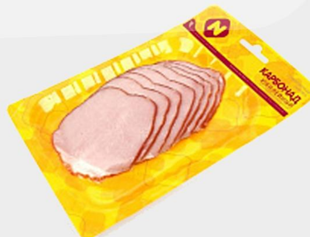
КАРБОНАД ОСТАНКИНО ВАРЕНО-КОПЧЕННЫЙ ЮБИЛЕЙНЫЙ, 150 Г