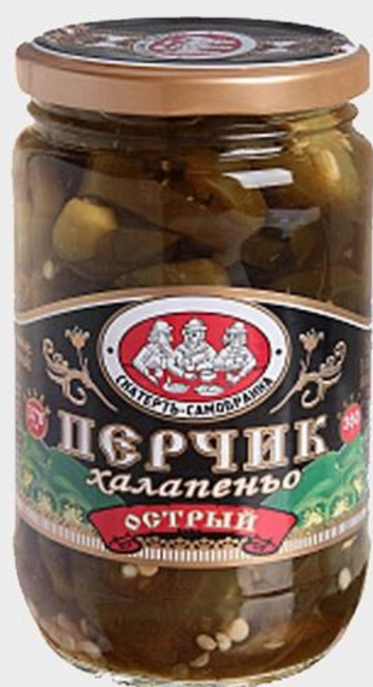
ПЕРЧИК ХАЛАПЕНЬО СКАТЕРТЬ-САМОБРАНКА ОСТРЫЙ, 360 МЛ