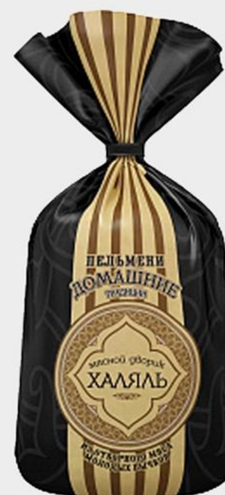
ПЕЛЬМЕНИ МЯСНОЙ ДВОРИК ХАЛЯЛЬ ИЗ МЯСА МОЛОДЫХ БЫЧКОВ, ДОМАШНИЕ, 800 Г