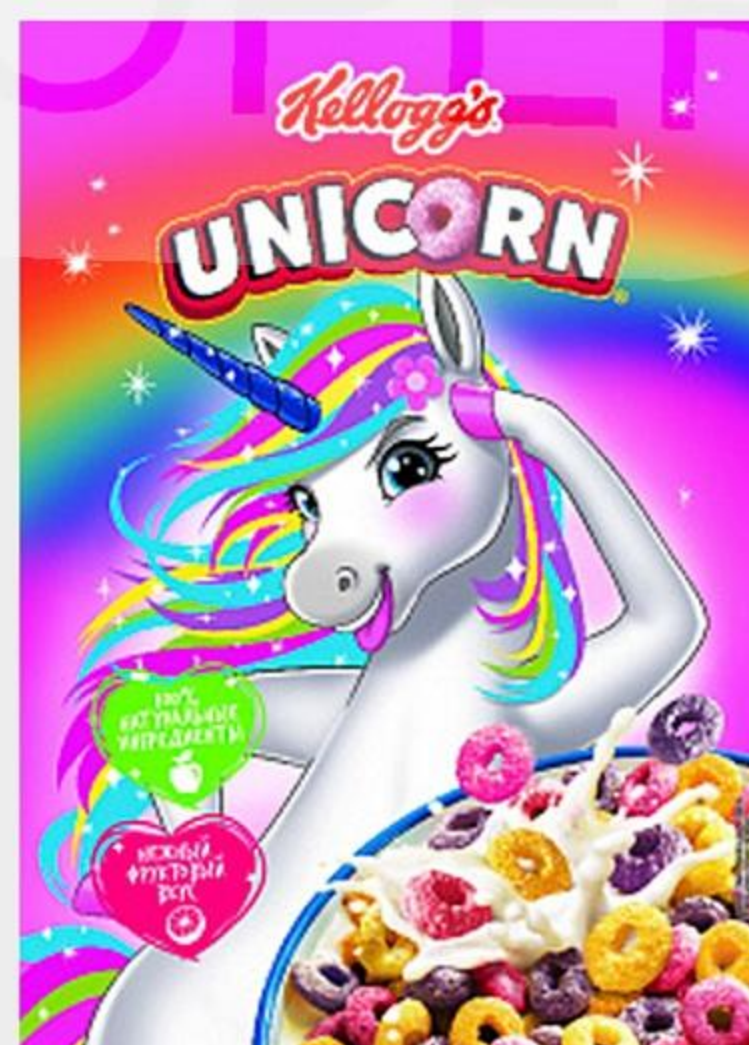
ГОТОВЫЙ ЗАВТРАК KELLOGG'S РАДУЖНЫЕ КОЛЕЧКИ С ФРУКТОВЫМ ВКУСОМ, 195 Г