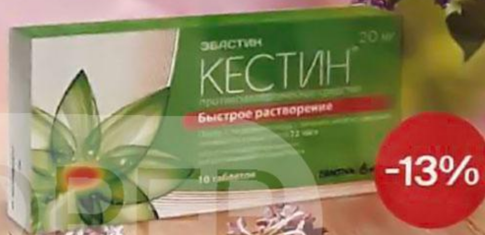
ТАБЛ. ЛИОФИЛИЗИРОВАННЫЕ 20 МГ, №10 ЛП-000789