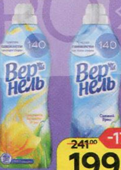
Кондиционер для белья ВЕРНЕЛЬ , в ассортименте***: 870 мл/ 910 мл