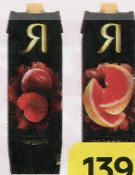
Соки и нектары Я в ассортименте***, 970 мл