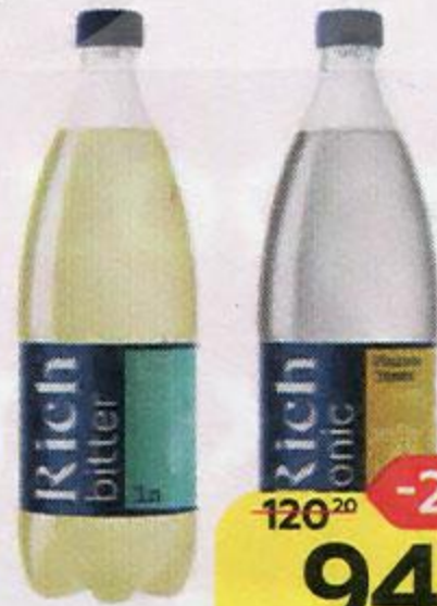
Напиток газированный RICH® , в ассортименте***, 1 л