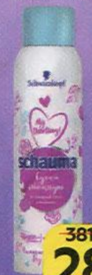
Шампунь сухой SCHAUMA® Май дарлинг для нормальных волос, 150 мл