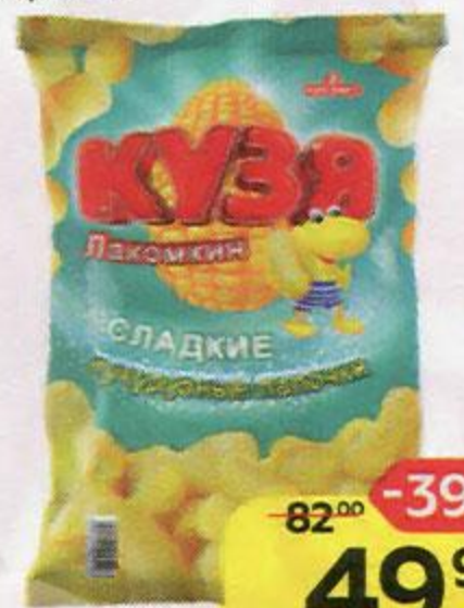
Палочки кукурузные КУЗЯ ЛАКОМКИН , Сладкие, 140 г