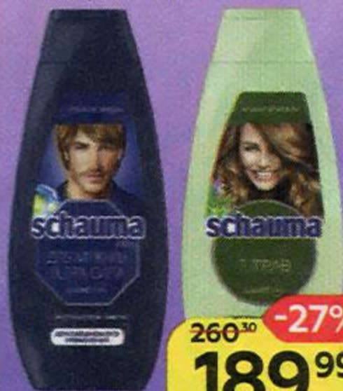
Шампунь SCHAUMA® , в ассортименте***: 360 мл/ 370 мл/ 400 мл