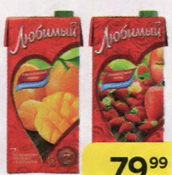
Напиток ЛЮБИМЫЙ , в ассортименте***, 950 мл