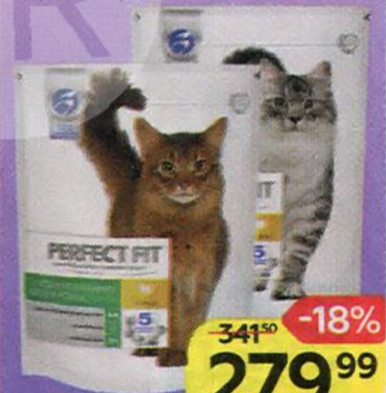
Корм сухой PERFECT FIT® , Для кошек и котят, в ассортименте***, 650 г