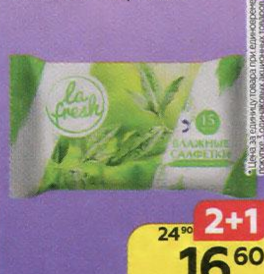
Салфетки влажные LA FRESH® , с ароматом зеленого чая, 15 шт.