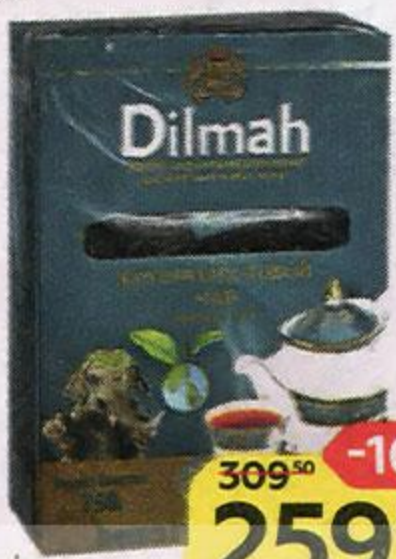
Чай DILMAH , Цейлонский, черный крупнолистовой, 250 г