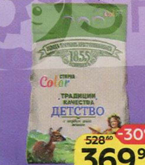
Порошок стиральный ЗАВОДЪ БРАТЬЕВЪ КРЕСТОВНИКОВЫХЪ детский автомат колор, 2,4 кг