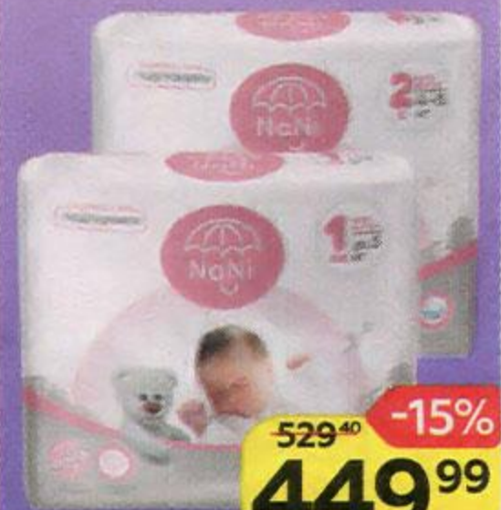
Подгузники NANI® 1NB (до 5 кг)/ 2S (4-8 кг), 27 шт.