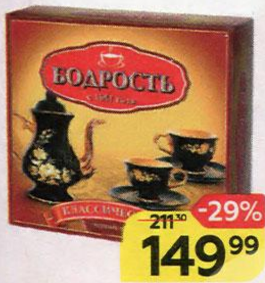
Чай БОДРОСТЬ черный, 100 пакетиков