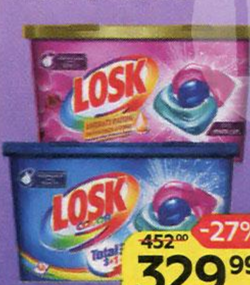
Капсулы для стирки ЛОСК Трио капс: Колор/ Малазийский цветок, 12 шт.