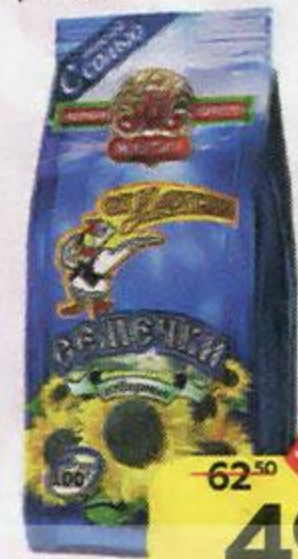
Семечки подсолнечника ОТ МАРТИНА , С морской солью, 100 г