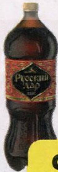
Квас РУССКИЙ ДАР , 2 л