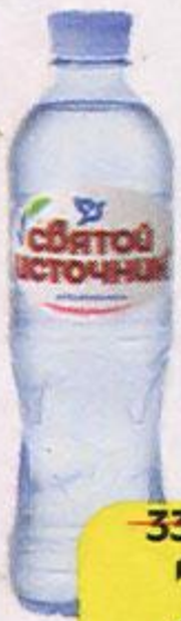
Вода питьевая СВЯТОЙ ИСТОЧНИК , негазированная, 500 мл