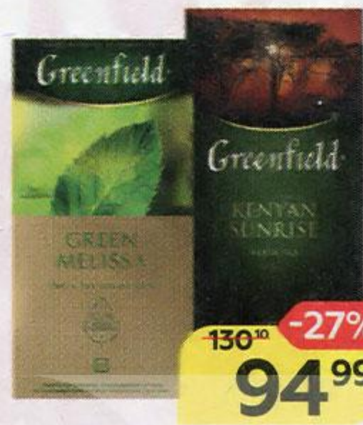
Чай GREENFIELD в ассортименте***, 25 пакетиков