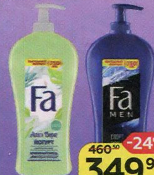
Гель для душа FA® , Йогурт с алоэ вера/ Актив спорт, 750 мл