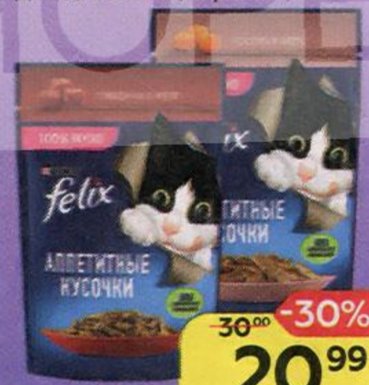
Корм для кошек FELIX® Аппетитные кусочки: говядина/ лосось/ кролик, 75 г