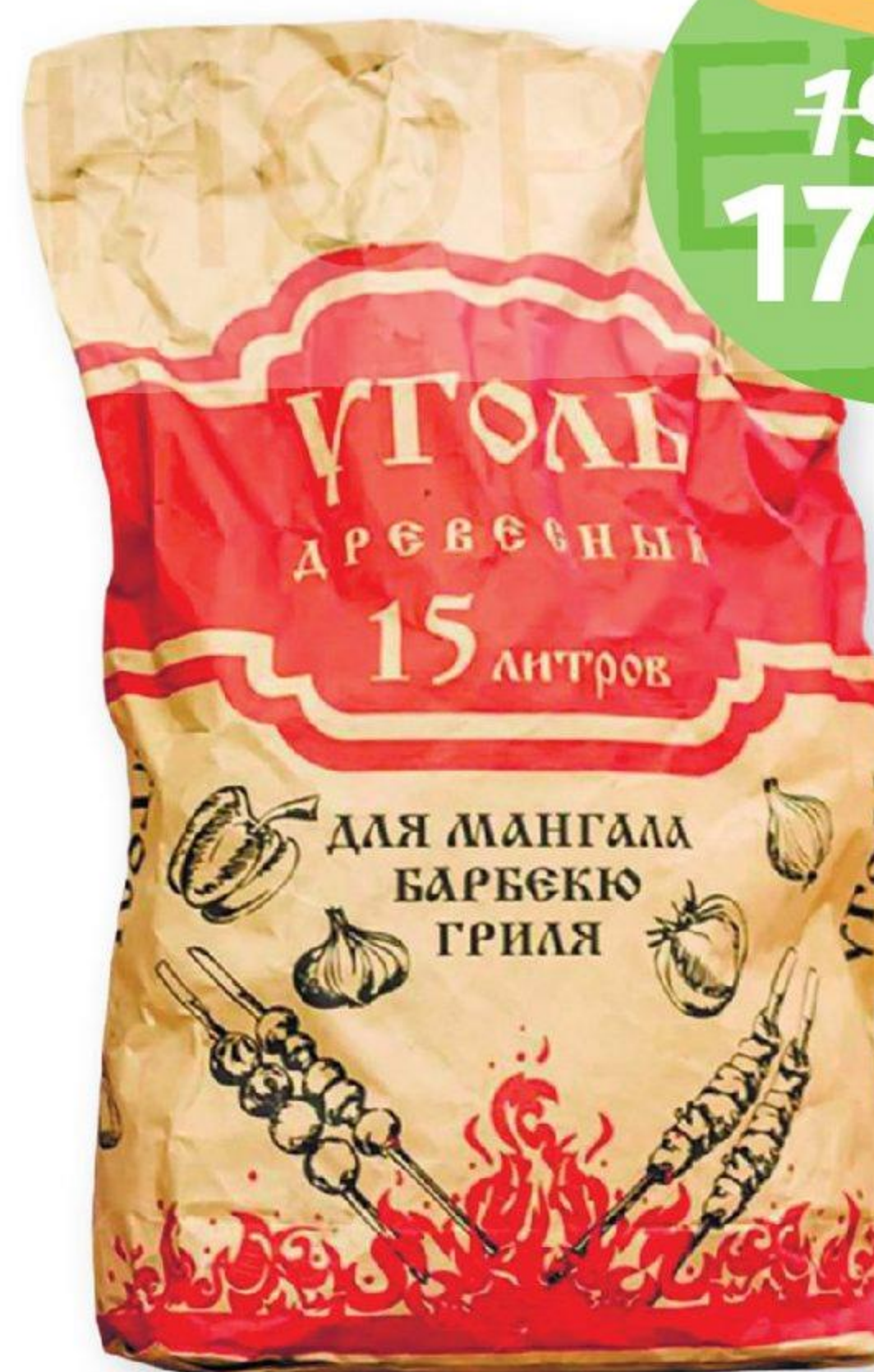
Уголь древесный, 15 л