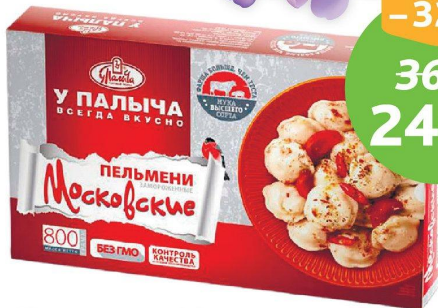
Пельмени «Московские», ТМ «У Палыча», 800 г