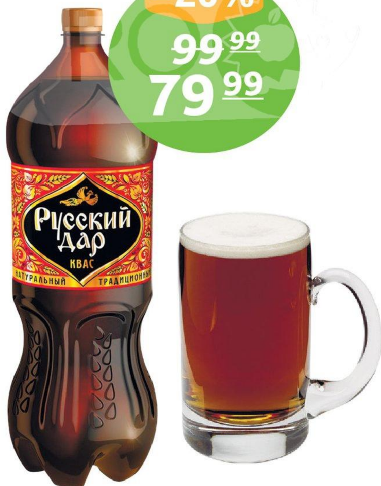
Квас «Русский Дар», 2 л