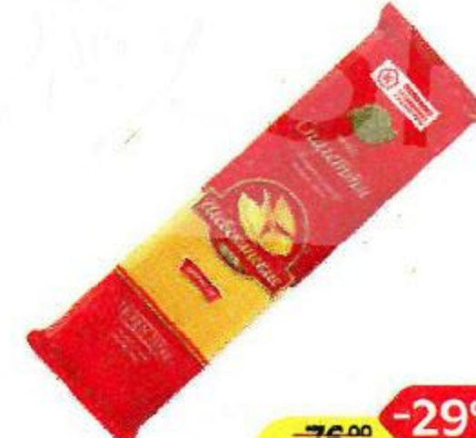
Макаронные изделия ШЕБЕКИНСКИЕ , Спагетти, 450 г