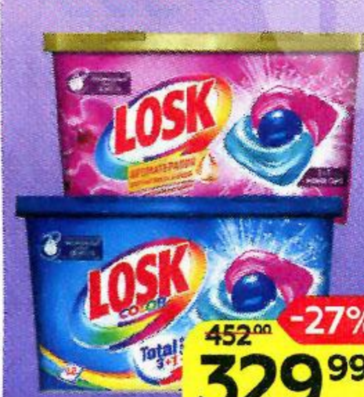
Капсулы для стирки ЛОСК Трио капс: Колор/ Малазийский цветок, 12 шт.