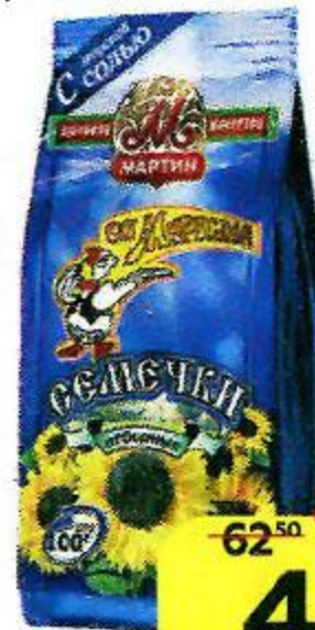
Семечки подсолнечника ОТ МАРТИНА , С морской солью, 100 г