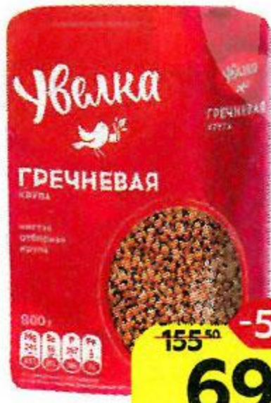
Гречка УВЕЛКА , 800 г