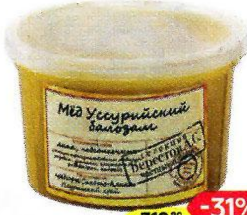
Мед УССУРИЙСКИЙ БАЛЬЗАМ (ЧП Берестова), 360 г