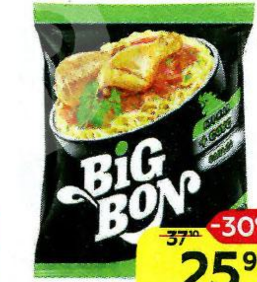
Лепша BIG BON Курица + соус сальса, 75 г