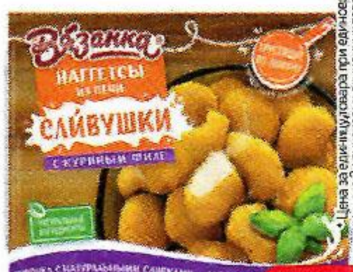
Наггетсы ВЯЗАНКА Сливушки, куриные, из печи, 250 г

*Цена за единицу товара при единичной покупке 2 одинаковых акционных товаров