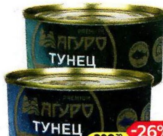
Тунец МАГУРО филе-кусочки: в масле/ натуральный, 170 г