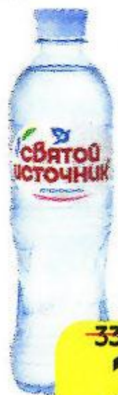
Вода питьевая СВЯТОЙ ИСТОЧНИК , негазированная, 500 мл