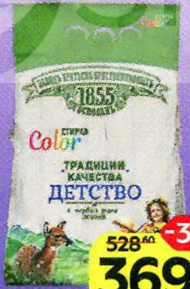
Порошок стиральный ЗАВОДЬ БРАТЬЕВЪ КРЕСТОВНИКОВЫХЪ детский автомат колор, 2,4 кг