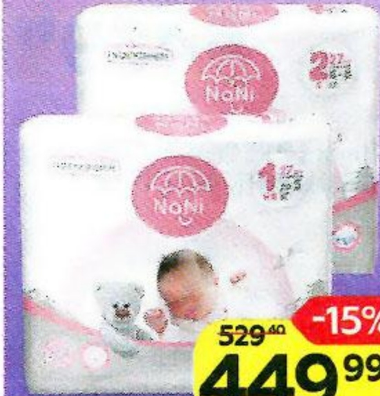
Подгузники NANI® 1NB (до 5 кг)/ 2S (4-8 кг), 27 шт.