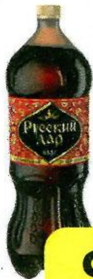
Квас РУССКИЙ ДАР , 2 л