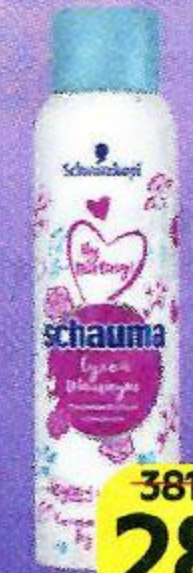
Шампунь сухой SCHAUMA® Май дарлинг для нормальных волос, 150 мл