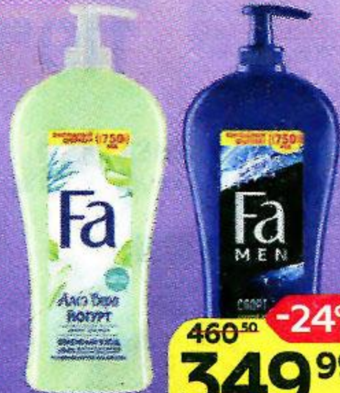
Гель для душа FA® , Йогурт с алоэ вера/ Актив спорт, 750 мл