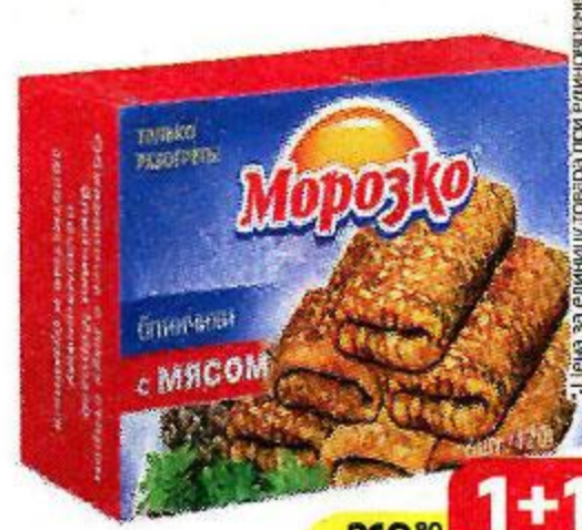
Блины МОРОЗКО , С мясом, 420 г

*Цена за единицу товара при единичной покупке 2 одинаковых акционных товаров