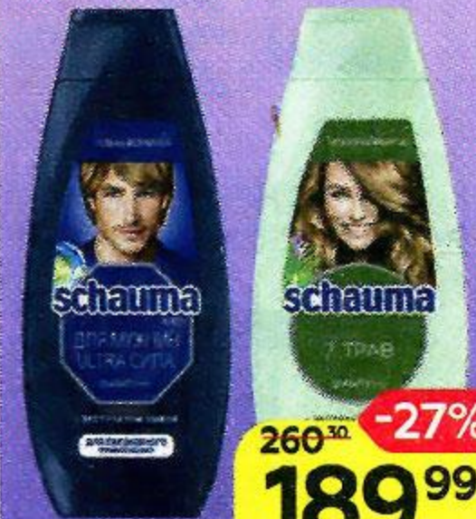
Шампунь SCHAUMA® , в ассортименте***: 360 мл/ 370 мл/ 400 мл