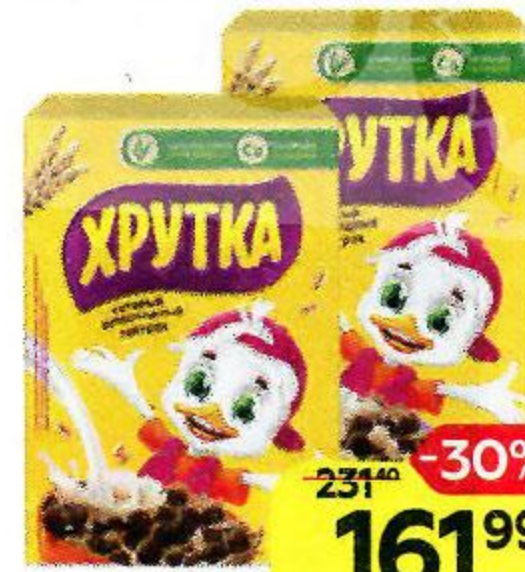
Шарики шоколадные ХРУТКА обогащенные кальцием: классические/ DUO, 350 г