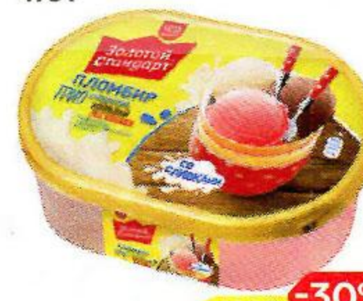
Мороженое ЗОЛОТОЙ СТАНДАРТ , Трио-пломбир, шоколад-сливки-клубника, 475 г