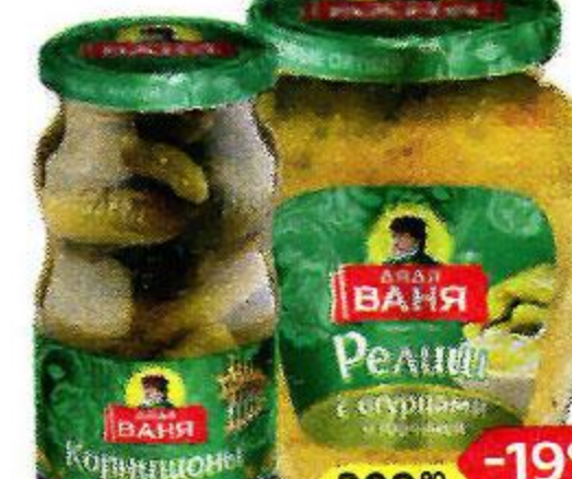
ДЯДЯ ВАНЯ , Корнишоны По-французски, 3-6см, 460 г/ Релиш с горчицей, 350 г