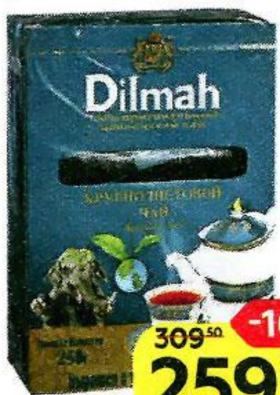
Чай DILMAH , Цейлонский, черный крупнолистовой, 250 г