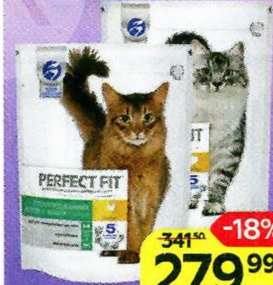
Корм сухой PERFECT FIT® , Для кошек и котят, в ассортименте***, 650 г