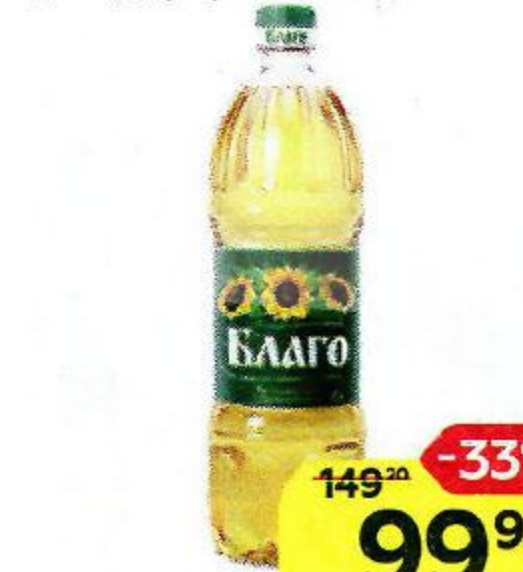
Масло подсолнечное БЛАГО , Рафинированное, дезодорированное, 1 л