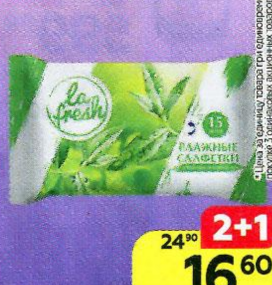
Салфетки влажные LA FRESH® , с ароматом зеленого чая, 15 шт.