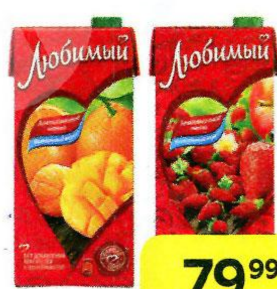
Напиток ЛЮБИМЫЙ , в ассортименте***, 950 мл