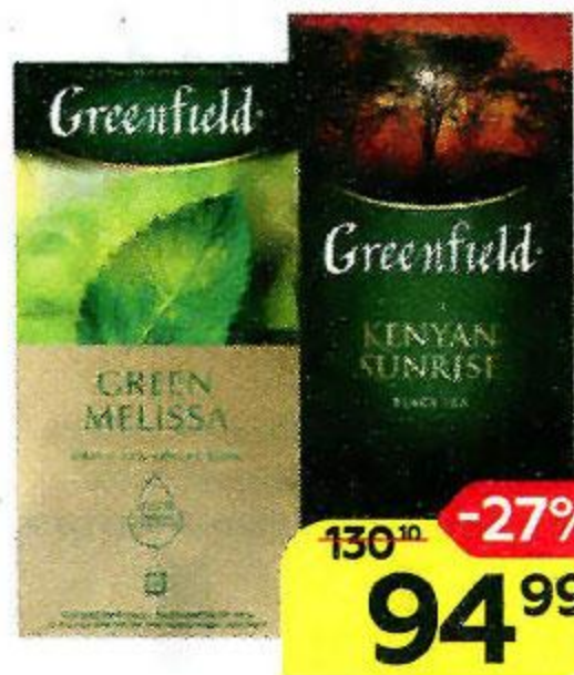
Чай GREENFIELD в ассортименте***, 25 пакетиков