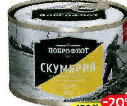
Скумбрия ДОБРОФЛОТ , натуральная, с маслом, 245 г