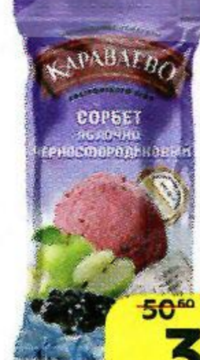
Сорбет КАРАВАЕВО черная смородина-яблоко, 75 г