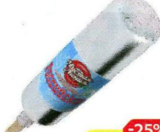
Мороженое ЧИСТАЯ ЛИНИЯ , Российское, в молочном шоколаде, 80 г