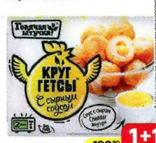
Круггетсы ГОРЯЧАЯ ШТУЧКА , С сырным соусом, 250 г

*Цена за единицу товара при единичной покупке 2 одинаковых акционных товаров