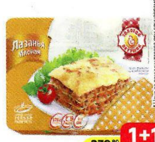
Лазанья ЗОЛОТОЙ ПЕТУШОК , мясная, 370 г

*Цена за единицу товара при единичной покупке 2 одинаковых акционных товаров