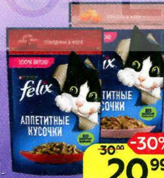
Корм для кошек FELIX® Аппетитные кусочки: говядина/ лосось/ кролик, 75 г