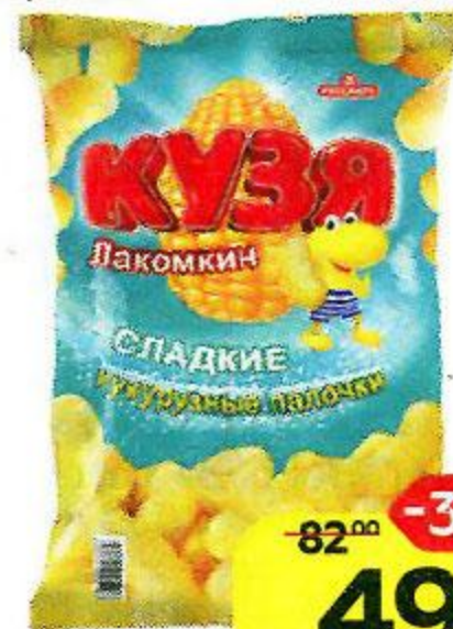
Палочки кукурузные КУЗЯ ЛАКОМКИН , Сладкие, 140 г