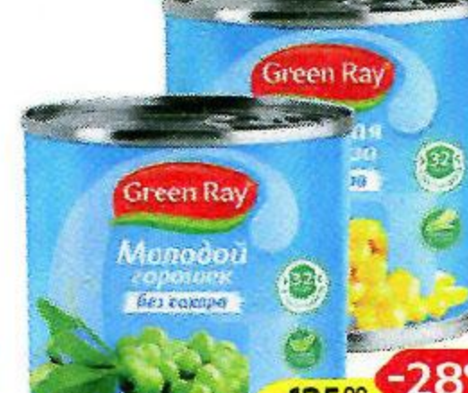
GREEN RAY , без сахара: Молодой горошек, 400 г/ Молодая кукуруза, 340 г