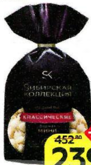
Пельмени СИБИРСКАЯ КОЛЛЕКЦИЯ Классические, 700 г