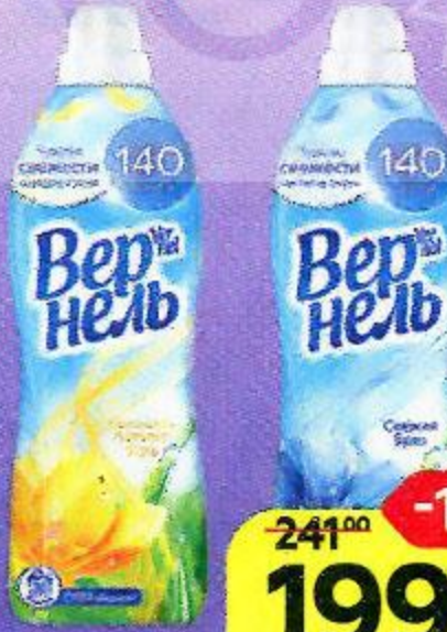
Кондиционер для белья ВЕРНЕЛЬ , в ассортименте***: 870 мл/ 910 мл