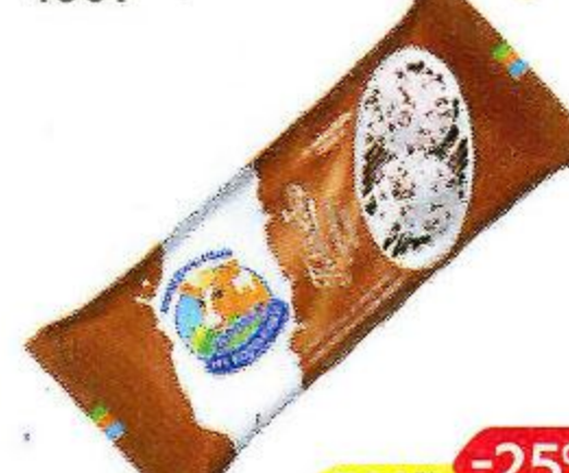
Мороженое КОРОВКА ИЗ КОРЕНОВКИ пломбир с шоколадной крошкой, 400 г