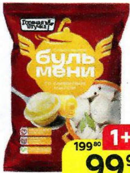
Бульмени ГОРЯЧАЯ ШТУЧКА Со сливочным маслом, 430 г

*Цена за единицу товара при единичной покупке 2 одинаковых акционных товаров