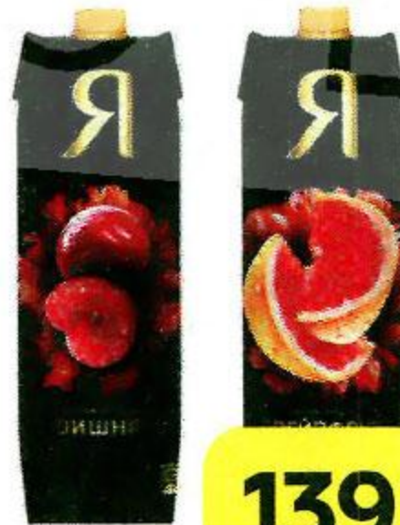
Соки и нектары Я в ассортименте***, 970 мл