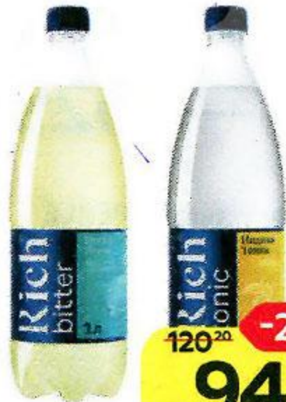
Напиток газированный RICH® , в ассортименте***, 1 л