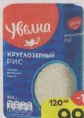
Рис круглозерный УВЕЛКА, 800 г