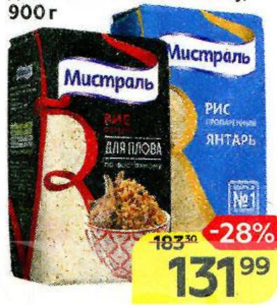
Рис МИСТРАЛЬ , Янтарь, пропаренный/ Осман для плова по-восточному, 900 г