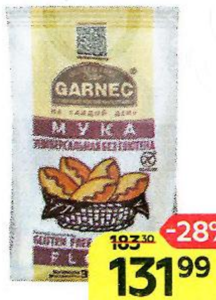
Мука GARNEC универсальная, без глютена, 300 г