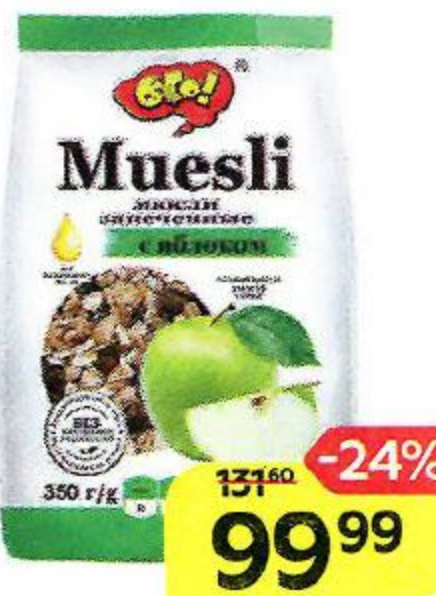
Мюсли ОГО! , запеченные, с яблоком, 350 г