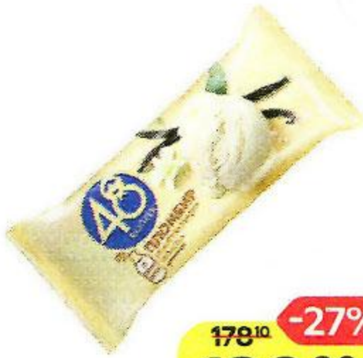
Мороженое 48 КОПЕЕК пломбир, брикет, 210 г