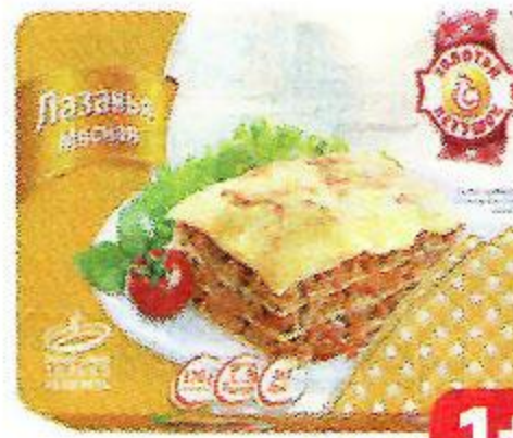
Лазанья ЗОЛОТОЙ ПЕТУШОК , мясная, 370 г

Цена за единицу товара при единичной покупке 2 одинаковых акционных товаров