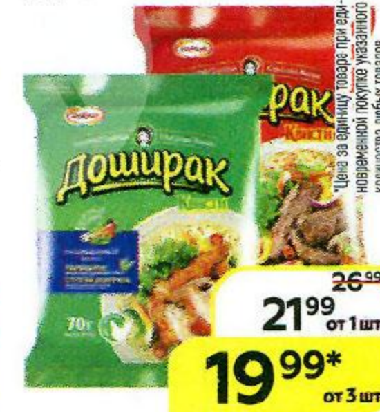
Лепша ДОШИРАК , со вкусом: говядины/ курицы, 70 г