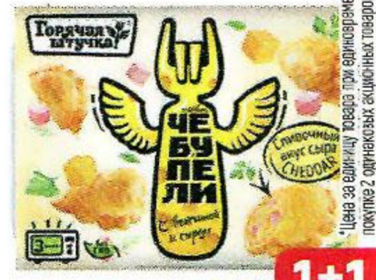
Чебупели ГОРЯЧАЯ ШТУЧКА , С ветчиной и сыром, 300 г

Цена за единицу товара при единичной покупке 2 одинаковых акционных товаров