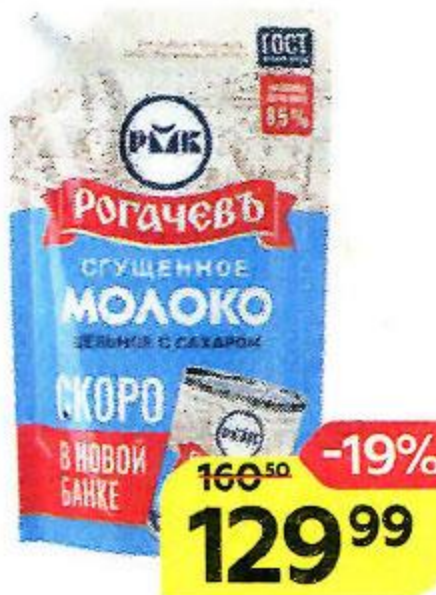
Молоко сгущенное РОГАЧЕВЬ цельное 8,5%, 270 г