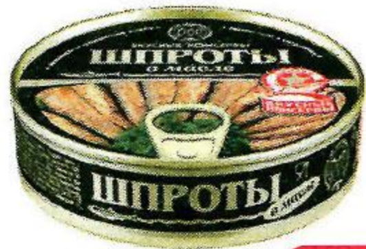
Шпроты ВКУСНЫЕ КОНСЕРВЫ , В масле, 160 г