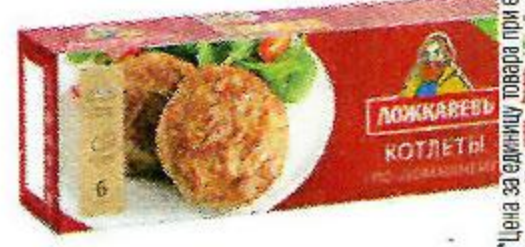
Котлеты ЛОЖКАРЕВЬ По-домашнему, с говядиной, 400 г

Цена за единицу товара при единичной покупке 2 одинаковых акционных товаров