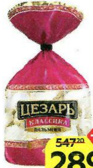
Пельмени ЦЕЗАРЬ , Классика, говядина-свинина, 800 г