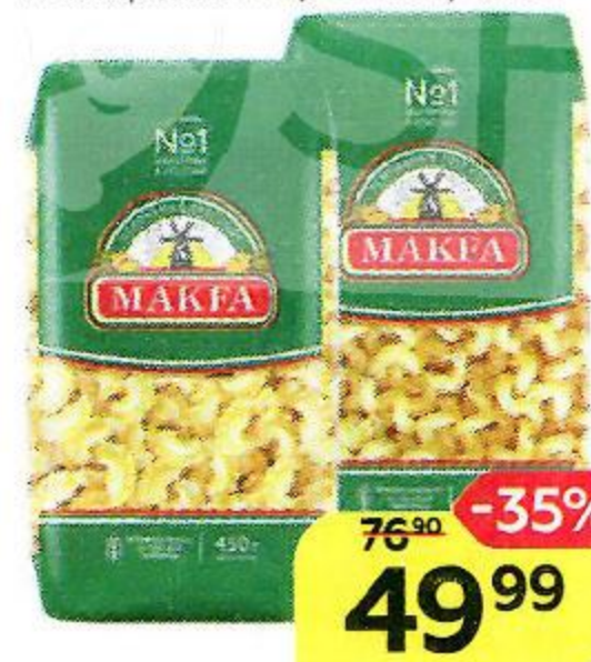
Макаронные изделия МАКФА Спагетти/ Петушья гребешки/ Виток, 450 г