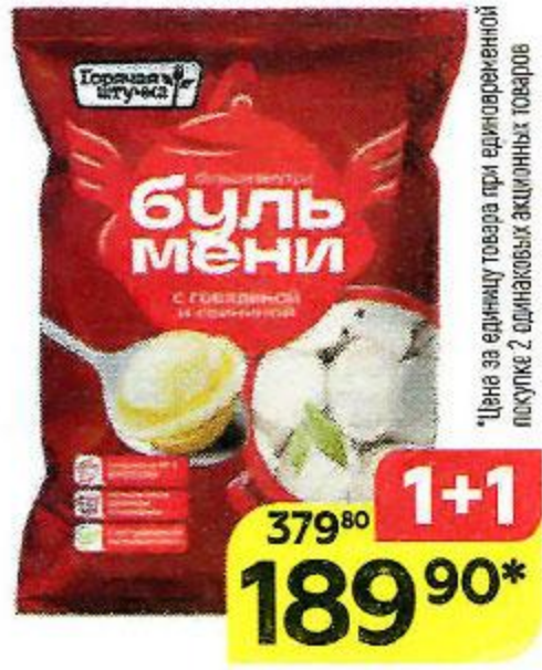
Пельмени ГОРЯЧАЯ ШТУЧКА , Бульмени с говядиной и свиной, 900 г

Цена за единицу товара при единичной покупке 2 одинаковых акционных товаров