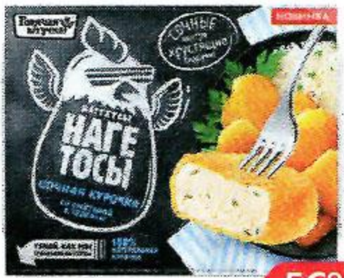
Нагетсы ГОРЯЧАЯ ШТУЧКА сметана зелень в хрустящей панировке, 250 г