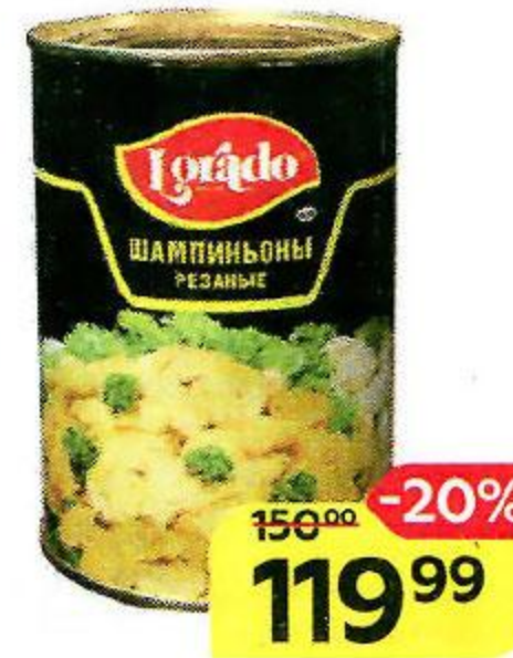
Шампиньоны LORADO , резаные, 400 г