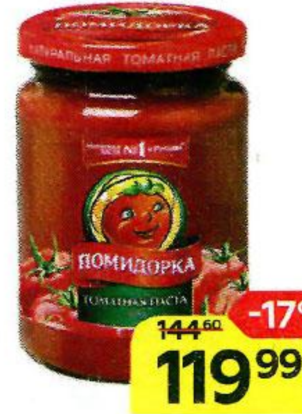
Паста томатная ПОМИДОРКА , 270 г