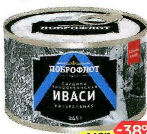
Сардина тихоокеанская ДОБРОФЛОТ , Иваси, натуральная, 245 г