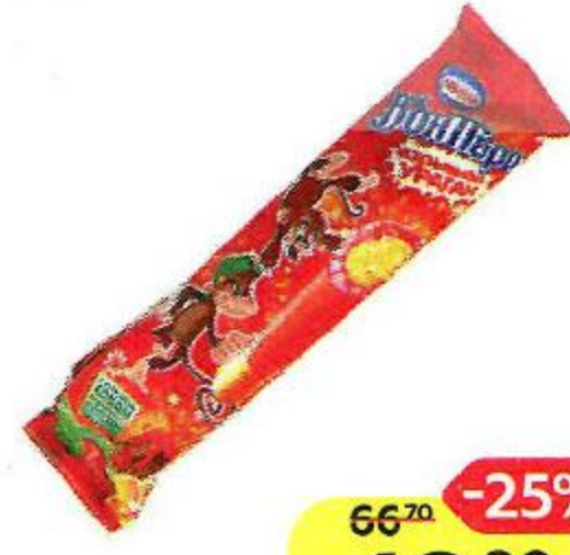
Лед фруктовый БОН ПАРИ , Ураган Взрывная карамель, 60 г