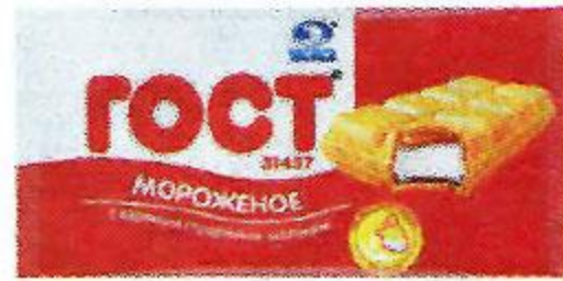
Мороженое ГОСТ с вареным сгущенным молоком (Челны-Холод), 75 г