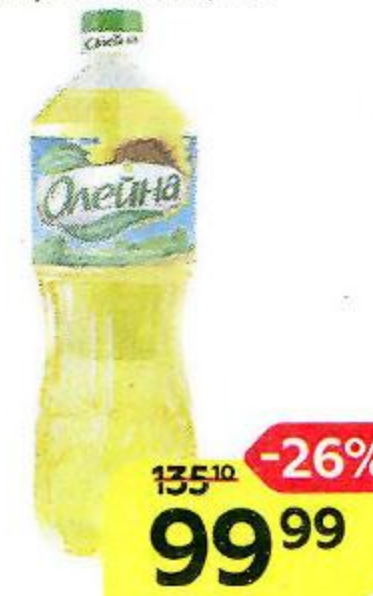
Масло подсолнечное ОЛЕЙНА , Рафинированное, дезодорированное, 1л