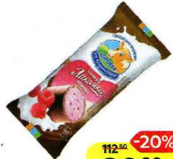
Мороженое КОРОВКА ИЗ КОРЕНОВКИ Лакомка малиновая, 90 г