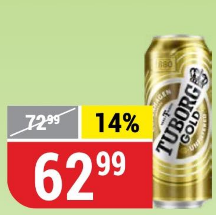
ПИВНОЙ НАПИТОК TUBORG GOLD нефильтрованный, неосветленный, 4,8%, 0,45 л 176662