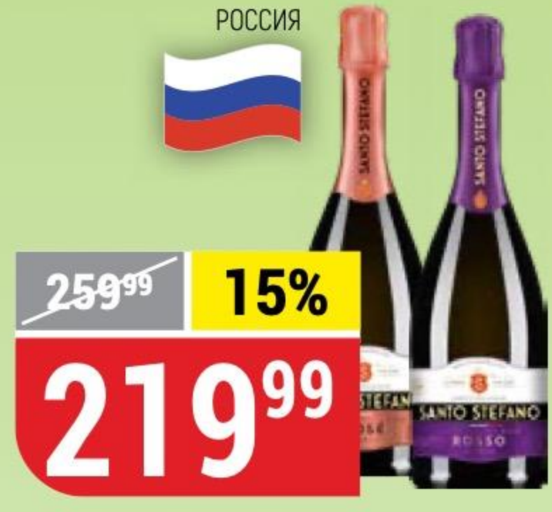
НАПИТОК ВИННЫЙ SANTO STEFANO особый, красный; розовый, полусладкий, 8%, 0,75 л 154213/154211