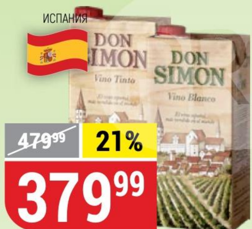
ВИНО DON SIMON белое; красное, сухое, 11%, 1 л 134598/134600