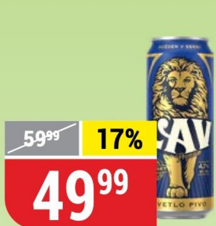
ПИВО LAV PREMIUM светлое, 4,7%, 0,45 л 171968