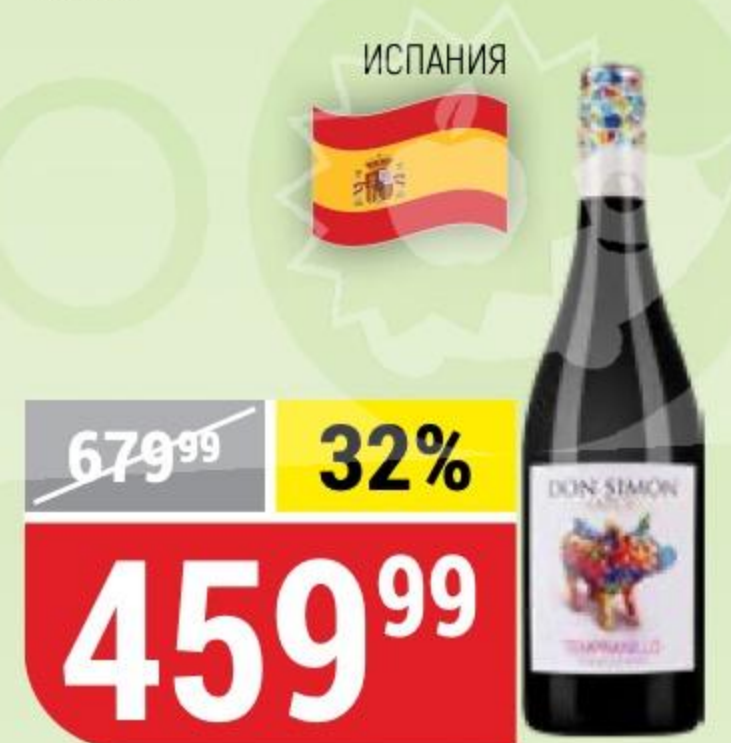
ВИНО DON SIMON tempranillo, красное, сухое, 12,5%, 0,75 л 174436