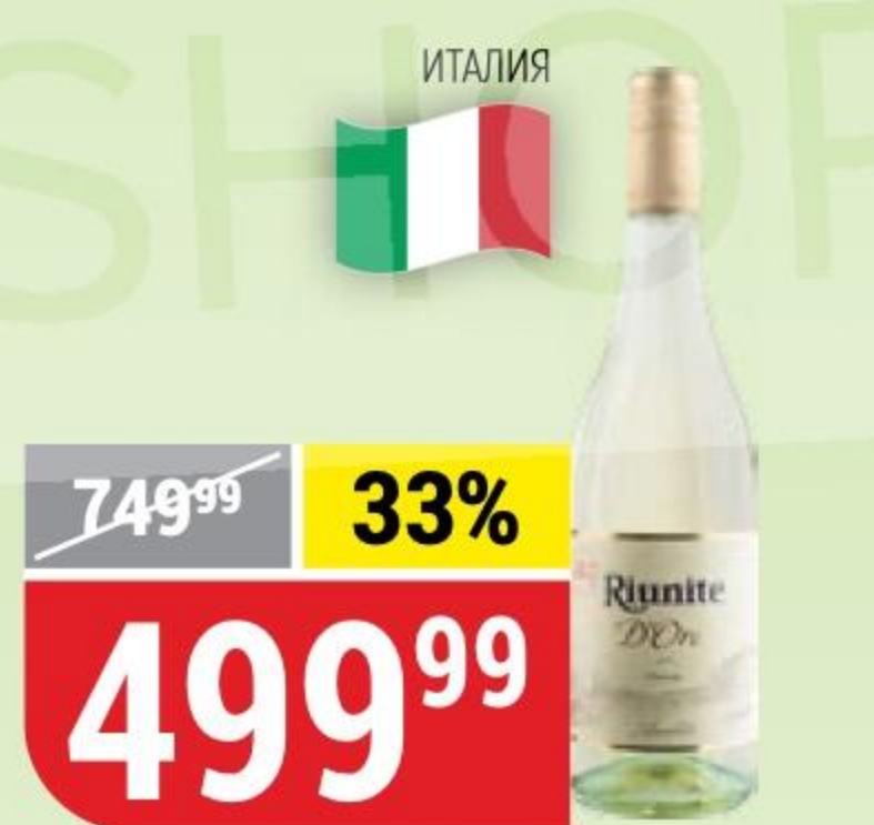
ВИНО ИГРИСТОЕ RIUNITE d'oro, белое, полусладкое, 8%, 0,75 л 145946