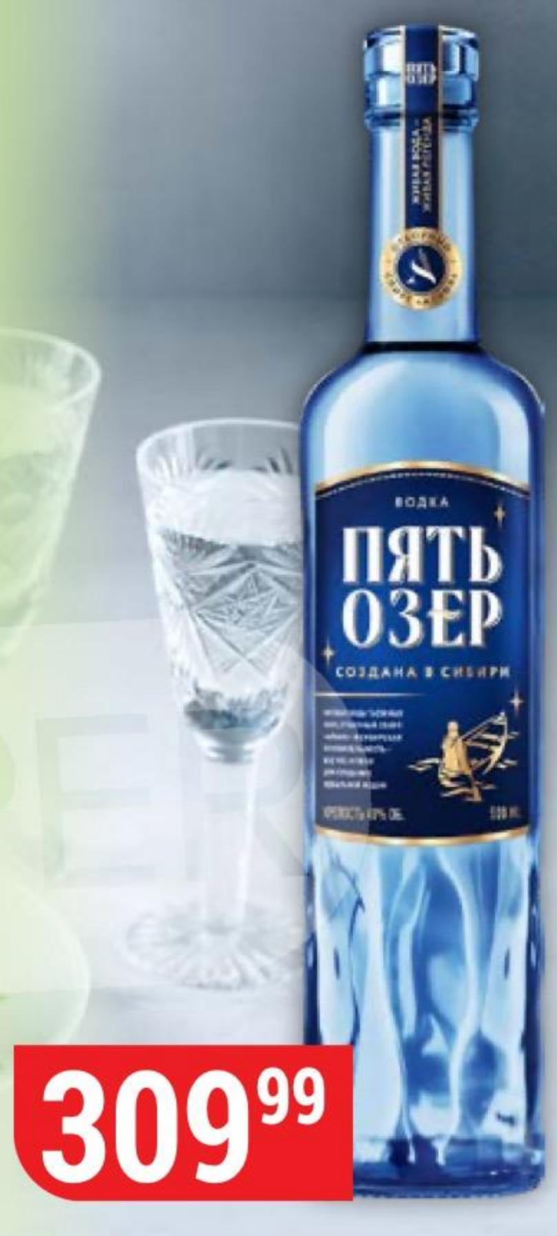
ВОДКА ПЯТЬ ОЗЕР 40%, 0,5 л 134516

ЧРЕЗМЕРНОЕ УПОТРЕБЛЕНИЕ АЛКОГОЛЯ ВРЕДИТ ВАШЕМУ ЗДОРОВЬЮ