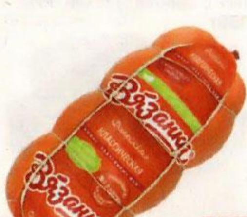
Колбаса ВЯЗАНКА Филейная, вареная, 450 г