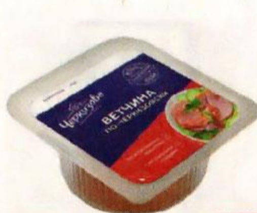
Ветчина ПО-ЧЕРКИЗОВСКИ нарезка (ЧМПЗ), 200 г