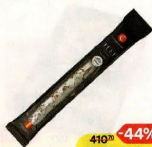
Колбаса FUET EXTRA , Casademont, сыровяленая, 150 г