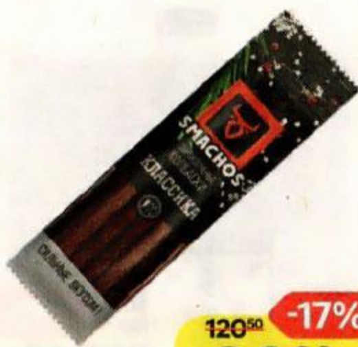
Колбаски SMACHOS , классика, сырокопченые, 70 г