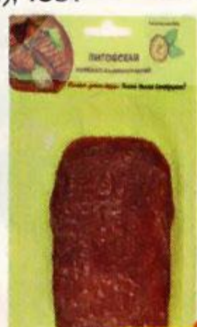
Колбаса ЛИТОВСКАЯ , сырокопченая, нарезка (Иней), 100 г