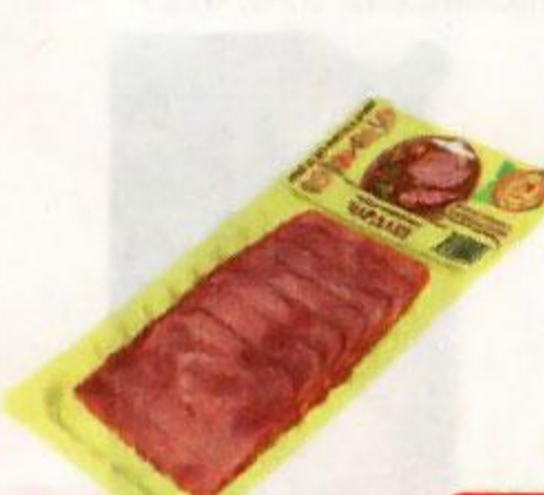
Колбаса ЧАРДАШ полукопченая, нарезка (Иней), 120 г