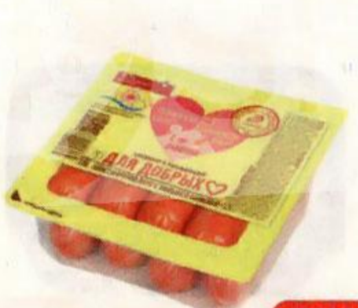
Сосиски ИНЕЙ из говядины вареные, 330 г

*Цена за единицу товара при одновременной покупке 2 оригинальных упаковочных товаров