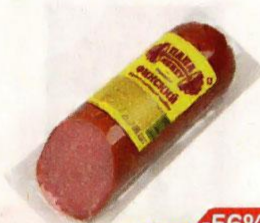
Сервелат ПАПА МОЖЕТ , финский, варено-копченый (ОМПК), 420 г