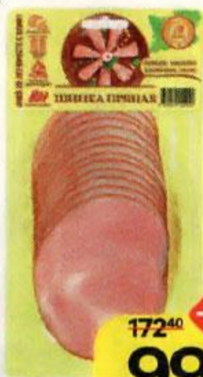
Шинка ПРЯНАЯ копчено-вареная, нарезка (ООО Иней), 150 г