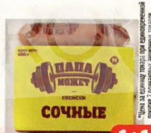
Сосиски ПАПА МОЖЕТ , сочные (ОМПК), 450 г