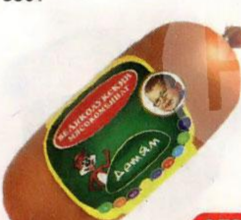
Колбаса ВЕЛИКОЛУКСКИЙ МЯСОКОМБИНАТ Детям, 500 г