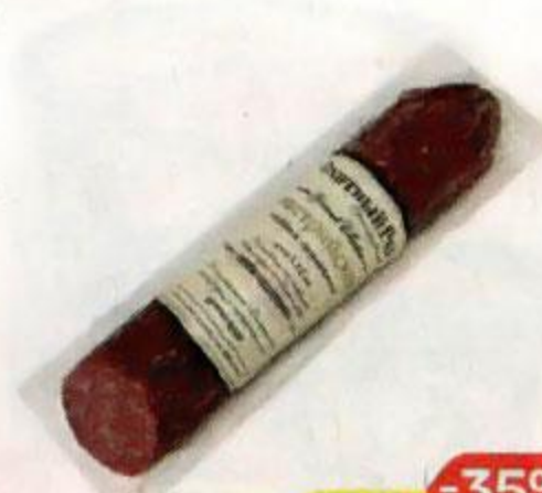
Колбаса ОХОТНЫЙ РЯД Австрийская сыровяленая, 220 г