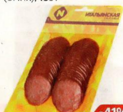
Салями ИТАЛЬЯНСКАЯ , сырокопченая, нарезка (ОМПК), 150 г