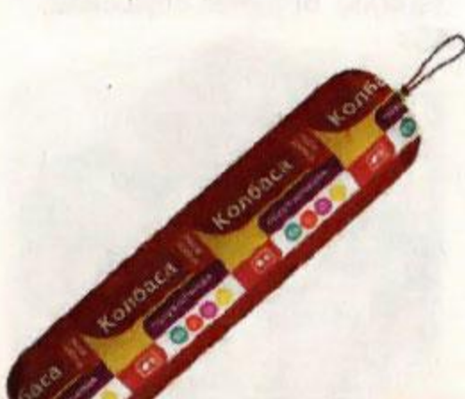
Колбаса МОЯ ЦЕНА , Деревенская, полукопченая, 350 г