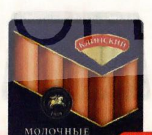
Сосиски КЛИНСКИЙ Молочные, ГОСТ, 470 г