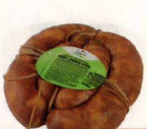
Колбаса ЗАПОВЕДНЫЕ Домашняя жареная, 350 г