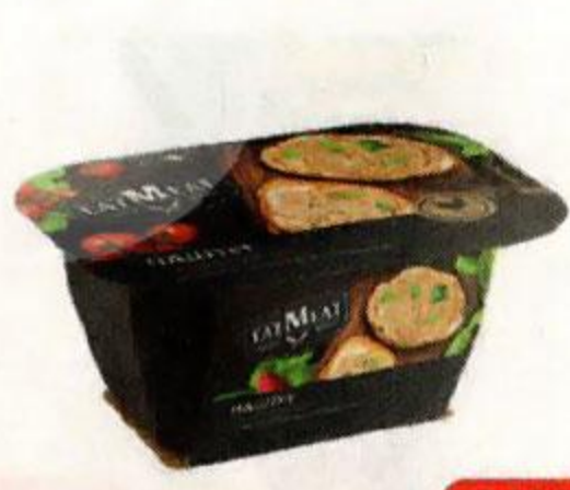
Паштет EATMEAT® с куриной печенью и сливками, 150 г