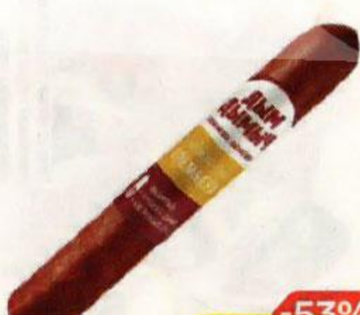
Колбаса ДЫМ ДЫМЫЧ , премьера, сырокопченая, 200 г