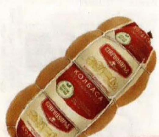
Колбаса СТАРОДВОРЬЕ Стародворская, вареная, 400 г